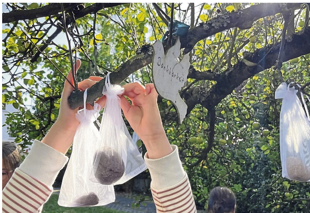
Als Hoffnungszeichen: Die Kinder hängen ihre Steine an den Apfelbaum der Pfarrei St. Marien.