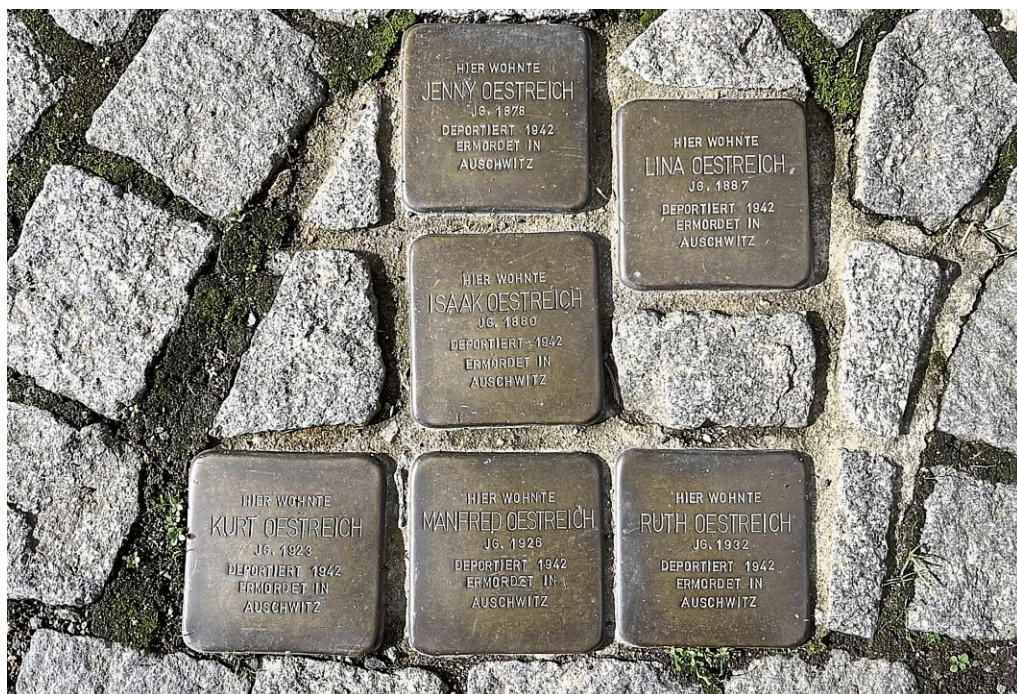
Verschiedene Stolpersteine sind in Seligenstadt zu finden, auf die auch die Kinder vermehrt achten. LEONIE SCHÄFER

„Heute wird viel mehr Rücksicht auf andere Menschen genommen als früher“, bemerkt ein Erstklässler. Ein hoffnungsvoller Gedanke – und doch gibt