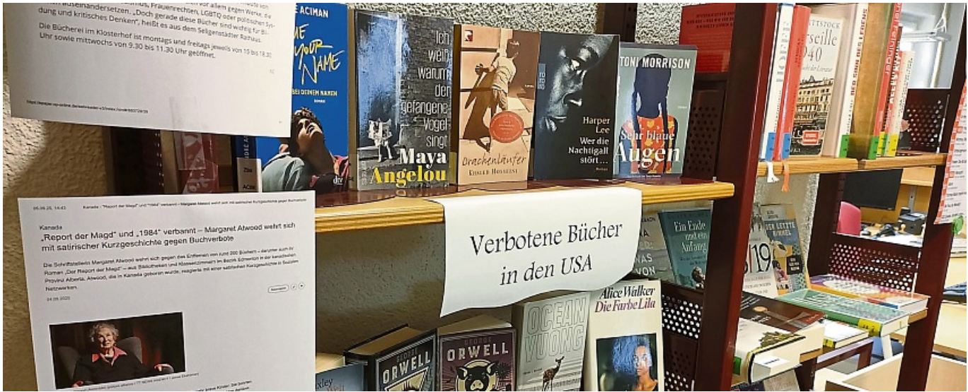
bse10092025 Stadtbücherei Seligenstadt zeigt Bücher, die in den USA verboten sind

Beim Blick auf die Liste ergibt sich, zumindest in Teilen, ein roter Faden: So finden sich dort Bücher über Rassismus, autoritäre Systeme, mit sexuellen Bezügen sowie zu sexueller Gewalt ebenso wie Werke, die sich mit queeren Themen be-