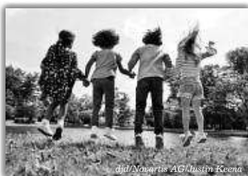
Kinder und Jugendliche haben eigene Rechte. Dies sollte auch für ihre Gesundheit gelten.

(djd-p). So steht es zumindest in der UN-Kinderrechtskonvention. Doch die Realität ist leider eine andere: Längst nicht alle Kinder haben Zugang zur bestmöglichen Gesundheitsversorgung – auch in Deutschland. Um die Arzneimittelversorgung unserer rund 14 Millionen Kinder und Jugendlichen zum Beispiel ist es nicht gut bestellt: Häufig gibt es keine eigens für sie zugelassene Therapie. Viel zu oft müssen Kinderärzte auf Erwachsenenmedizin zurückgreifen. Das birgt Risiken, denn die Präparate sind nicht auf den kindlichen Stoffwechsel angepasst, Nebenwirkungen können gravierender ausfallen. Zudem fehlt es an klinischen Studien für diese Altersgruppe. Sie sind Voraussetzung dafür, dass Kindermedikamente zugelassen werden. „Neue Wirkstoffe müssen genauestens