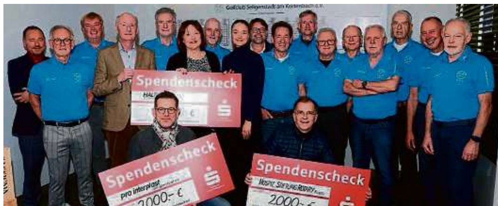
Seligenstädter „GolfFun“-Spielergruppe: Drei Spendenschecks über je 2000 Euro.

HERAUSGEGEBEN VOM HEIMATBUND SELIGENSTADT