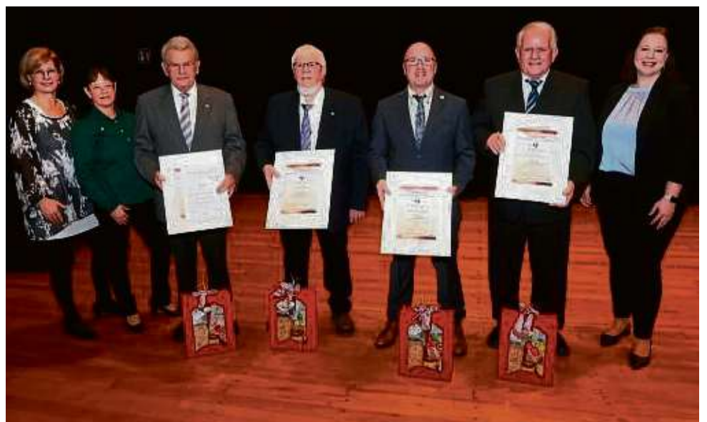
Langjährige Mitglieder zeichnete der Gesangverein Liederkranz aus.

Zellhausen – Wer in Zellhausen bis zum Sonntag, 7. Januar, keinen Besuch der Sternsinger erhalten hat, kann bis zum 14. Januar an den bekannten Sternsinger Stationen (Adressen im Schaukasten der Pfarrkirche) oder in den Zellhäuser Geschäften den Segen erhalten. Die Sternsinger Zellhausen sammeln auch in diesem Jahr für ihr Patenprojekt „GAMB“ das Waisenhaus in Emene (Nigeria).