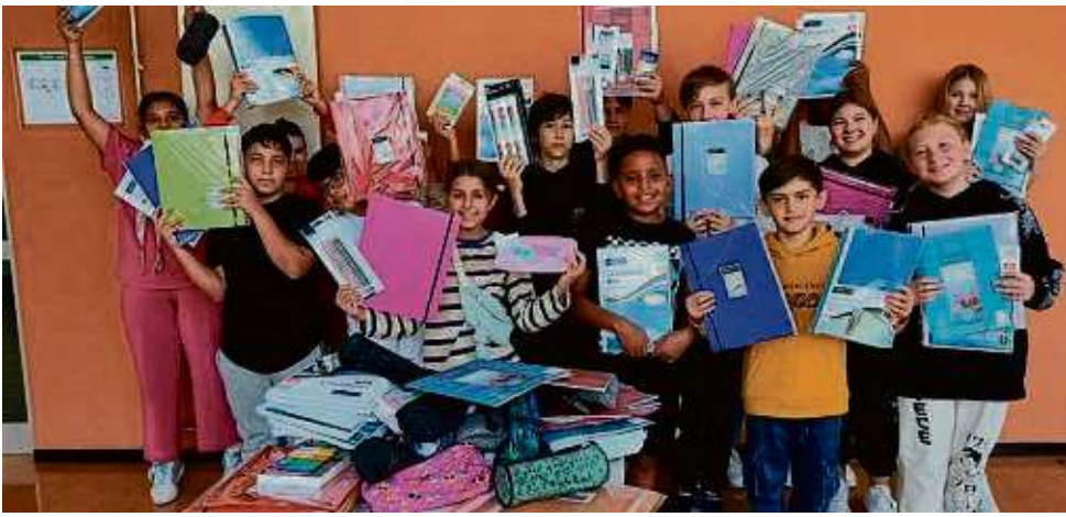
Mäppchen, Stifte, Hefte – alles, was Schüler brauchen, packten die DaZ-Klassen der Merianschule in Pakete für den Schulstart in Deutschland.