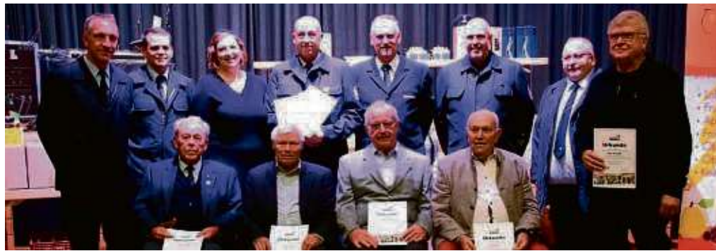
Beim Kameradschaftsabend ehrte die Freiwillige Feuerwehr Froschhausen langjährige Mitglieder. Das Foto zeigt die anwesenden Jubilare und Ehrengäste.

Seligenstadt – Den letzten Abend in der Reihe „Bibel im Gespräch“ der Evangelischen Kirchengemeinden Hainburg und Seligenstadt/Mainhauern veranstaltet Pfarrer Alexander Lita am Dienstag, 28. November, im evangelischen Gemeindezentrum in Seligenstadt. Um 19.30 Uhr geht es in der Jahnstraße 24 los mit dem 8. Kapitel des Markusevangeliums. Ob und wie die Gesprächsreihe weitergeführt wird, ist noch nicht entschieden. Aber wie immer sind für eineinhalb Stunden alle eingeladen, die sich über Gott und die Welt austauschen wollen. red