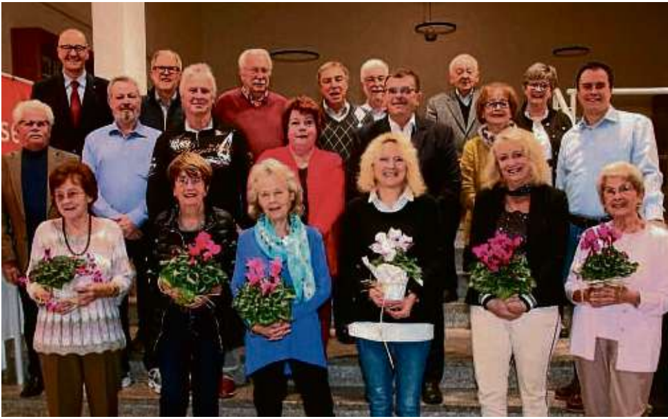
Zahlreiche Gärten, Fenster und Balkone hat die Jury des Klein-Welzheimer Blumenwettbewerbs begutachtet und bewertet. Für die Preisträger gab es bei der Feierstunde kleine Geschenke.