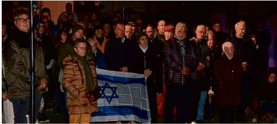
Zur Gedenkveranstaltung kamen rund 200 Seligenstädter.

„Der Überfall der Terrororganisation Hamas 85 Jahre später am 7. Oktober auf die Kibbuzim in Israel, bei dem 1400 Menschen durch Gräueltaten auf schrecklichste Weise zu Tode kamen und weitere 240 verschleppt wurden, ist ein Zivilisationsbruch und erinnert an die dunkelsten Tage des Holocausts“, sagte die Pfarrerin in ihrer Ansprache. Von den Terroristen sei explizit auf den Holocaust