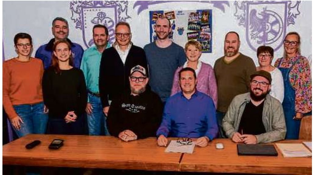
Die Seligenstädter Fastnachtsfreunde beenden das Jahr mit einem neuen Vorsitzenden sowie alten und neuen Vorstandsmitgliedern und Ausschussvorsitzenden.