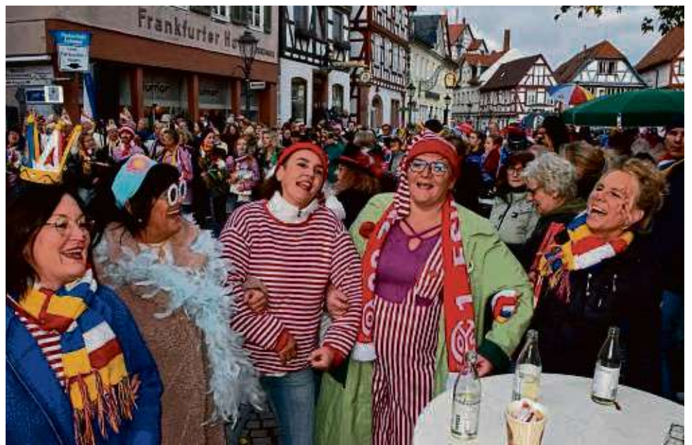
500 Seligenstädter Närrinnen und Narrhallesen strahlten beim Kampagnenstart mit der Sonne um die Wette.

Telefon: 06182 - 25134 • Telefax: 06182 - 20220 • www.haeuser-metzgerei.de