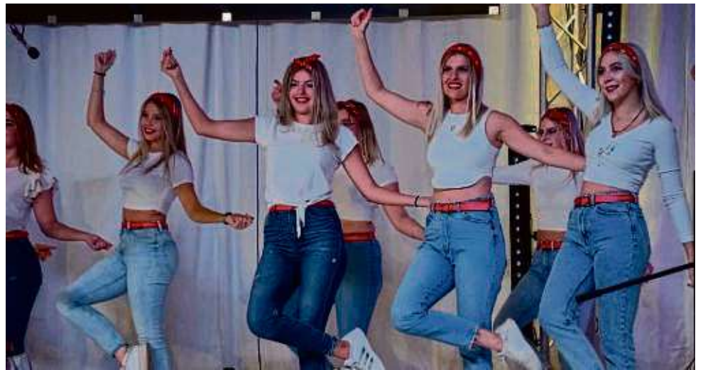
Die Crazy Schimmel Dancers rundeten das Konzert mit ihren Taneinlagen gekonnt ab.