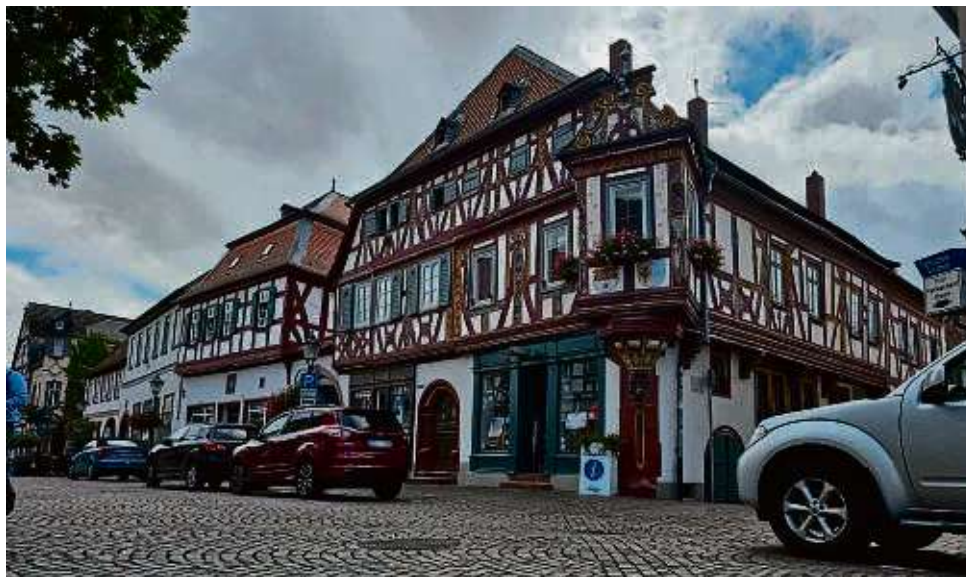
Die Tourist-Info, die sich im Einhardhaus befindet, wird nun vom Stadtmarketing geleitet. Damit befinden sich die Tourismusaufgaben in neuer Hand.

Denn durch die Neuausrichtung versprechen sich