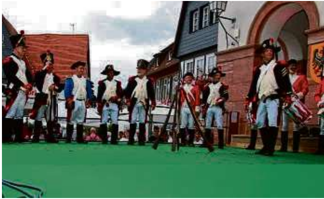
Aussendung des Geleits am Samstagabend am Seligenstädter Marktplatz: Die Bürgergarde bereitet sich auf ihren Einsatz vor.

Als die Kaufmannszüge immer umfangreicher und größer wurden, brach die Zeit von Raubrittern und Räuber-gesindel an. Sie lauerten den reichen „Pfeffersäcken“ auf, um sie zu berauben. Die Situation wurde so dramatisch, dass Handlungsbedarf an höchster Stelle bestand. Und so unterzeichnete der Stauferkaiser Friedrich II. (1194-1250), der zumeist in Italien lebte, am 11. Juli 1240 ein kaiserliches Privileg. Dieser Schutzbrief garantierte allen zur und von der Messe Reisenden körperlichen Schutz durch kaiserliche Truppen. Wörtlich heißt es dort: „Wer gegen dieses Gebot verstieß, sollte wissen, dass er mit dem