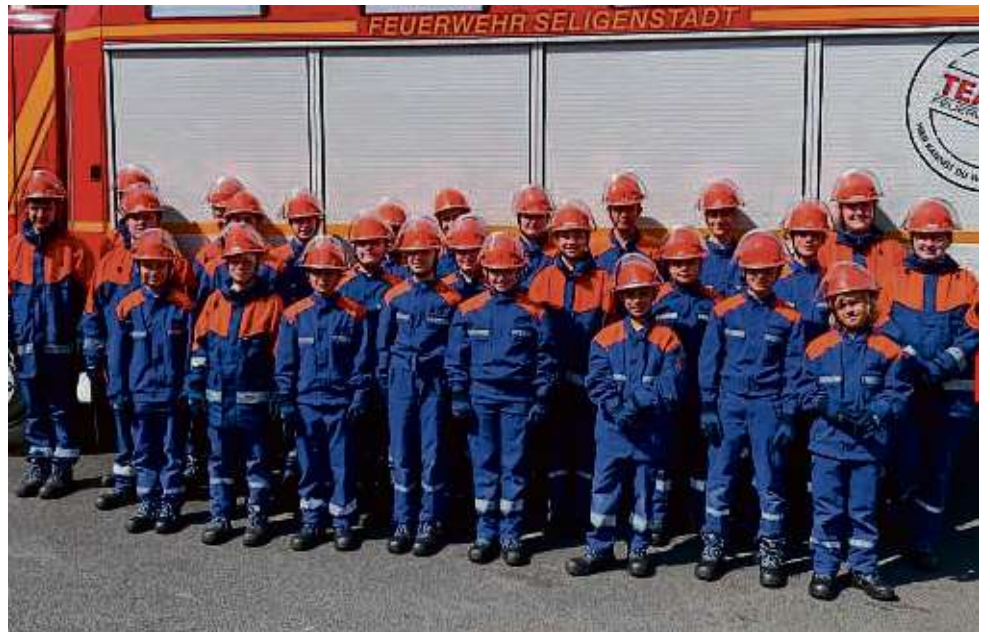
Vertreter der drei Jugendwehren: Gemeinsame Stationsausbildung.

Gemeinsame Ausbildung der drei Seligenstädter Jugendfeuerwehren