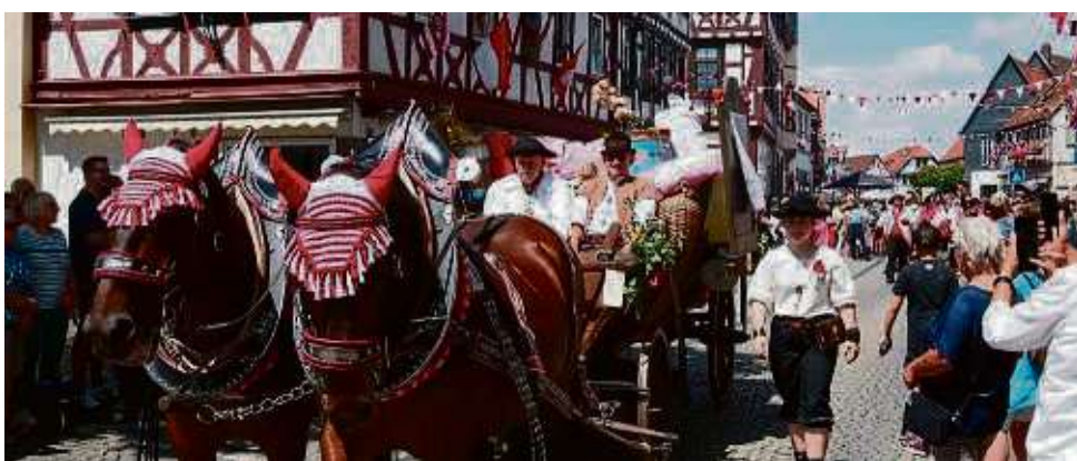
Geleitszug am Sonntag durch die Einhardstadt: Historische Kostüme, fröhliche Teilnehmer und begeisterte Zuschauer am Straßenrand.