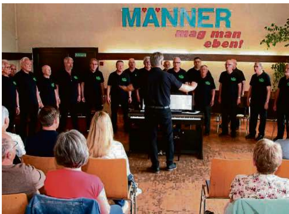
„Männerabend“ der Harmonie: Mit Konzept ins Schwarze getroffen.