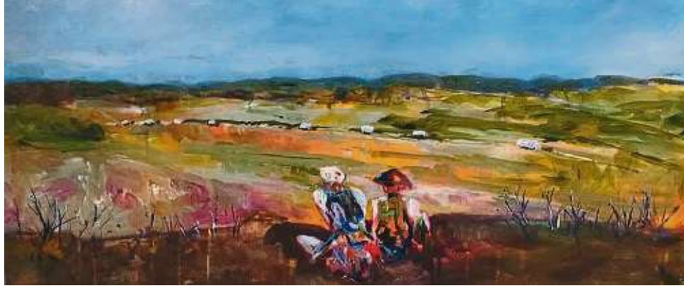
Ein besonderer Moment: der Blick von einem Hügel auf den sich durchs Tal annähernden Kaufmannszug.