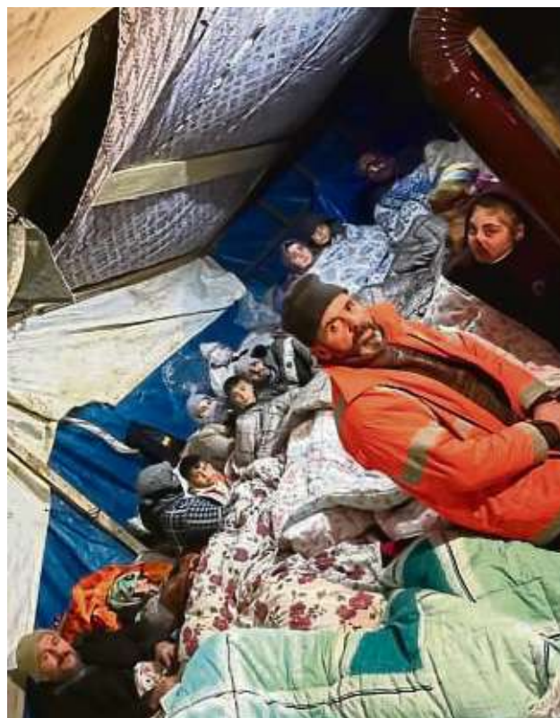
In der türkischen Provinz Kahramanmaraş leben ganze Familien in selbst gebauten Zelten.

Dafür hofft die Initiative nun auf weitere Vereine und Bürger, die sich ihr anschließen und auch auf lange Sicht hilfsbedürftige Menschen über die Seligenstädter Grenzen hinaus unterstützen wollen.