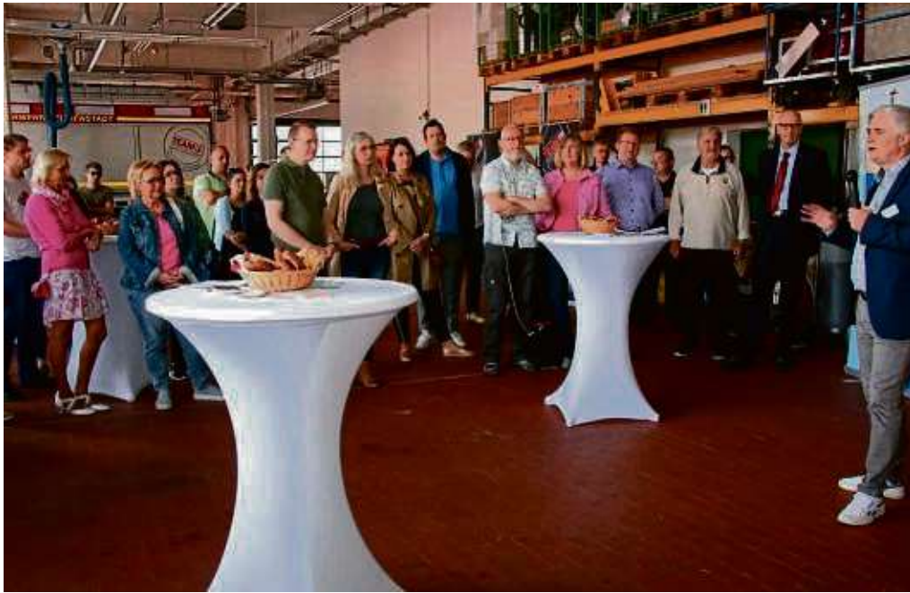
Zahlreiche neue Bewohner Seligenstadts folgten der Einladung zum Neubürgerempfang. Dort stellten sich neben der Stadtverwaltung auch die Vereine und Institutionen vor. ZBO