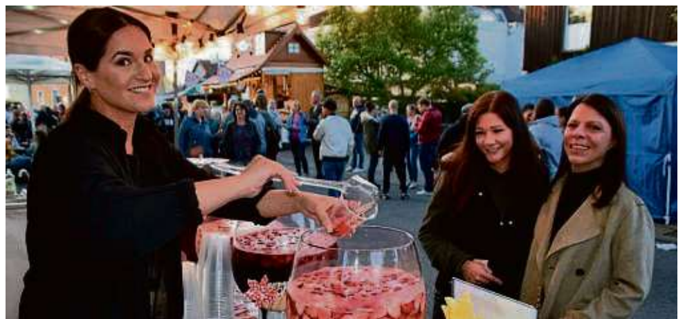
Ein großes Fruchtbowl-Angebot ließ die Herzen vor allem der weiblichen Besucher des Hainburger Marktes höher schlagen.