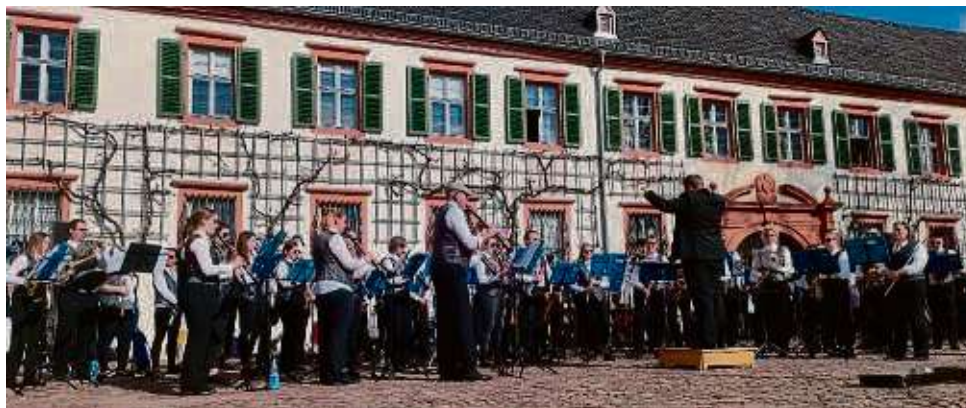
Das Große Blasorchester nahm das Publikum mit auf eine Reise vom Monumentalfilm bis nach Griechenland.

Mit einem Augenzwinkern moderierte Westhäuser das