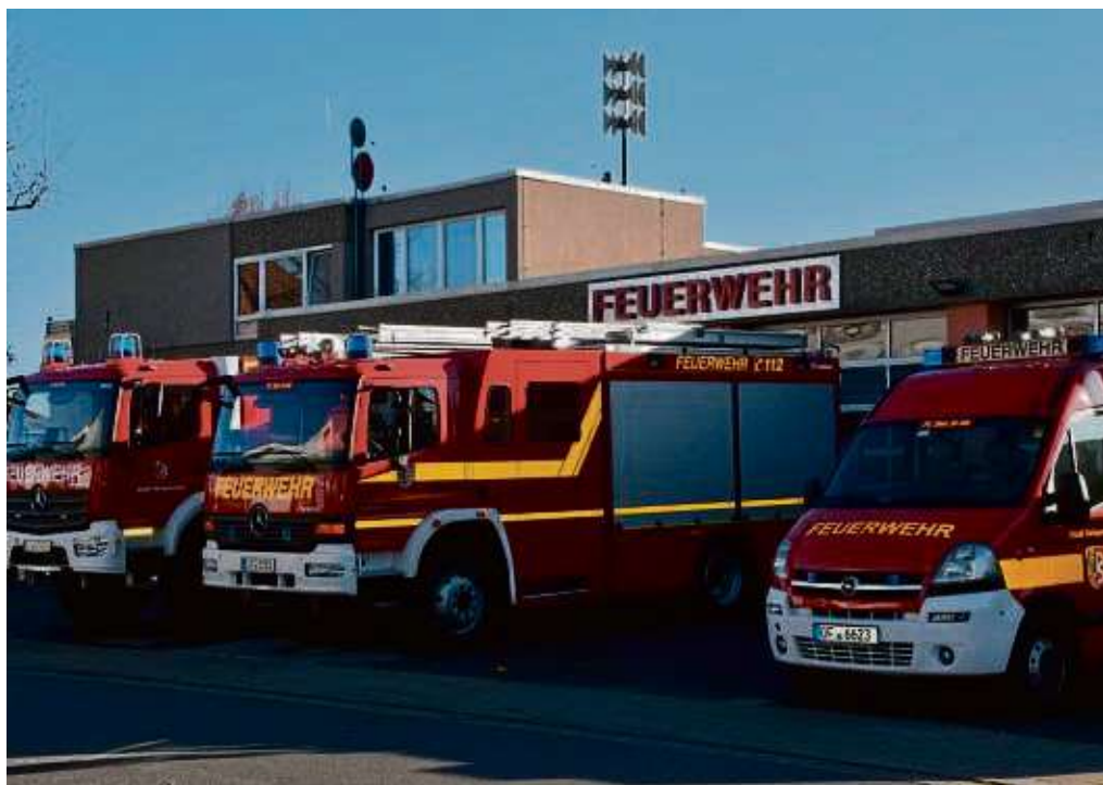
Derzeit herrscht bei den Froschhäuser Brandschützern eine rege Bautätigkeit: Im Obergeschoss des Feuerwehrhauses werden die Räume saniert und eine Küche eingebaut.

Räumen ein neuer Bodenbelag verlegt. Die Kosten für die Modernisierung des Froschhäuser Spritzenhauses werden von der Stadt Seligenstadt mit 90000 Euro beziffert. Die Froschhäuser Brandschützer wenden darüber hinaus 20000 Euro aus Vereinsmitteln auf und verwenden diese Summe für den Einbau einer komplett neuen Küche mit Theke, teilt deren Pressesprecher Dennis Kraft mit. Die Finanzierung der diesbezüglichen Elektroarbeiten übernimmt die Stadt. hoh