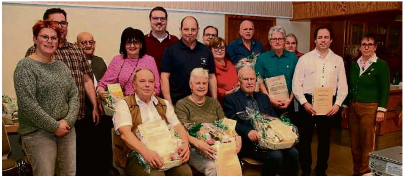
Für jahrelange Treue geehrt wurden Mitglieder des Wanderclubs Edelweiß.