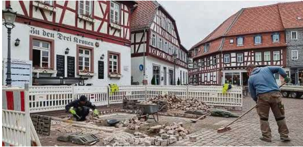
Die Baumscheibe auf dem Freihofplatz , die erst im Herbst angelegt worden war, wird derzeit wieder zugestrichelt – einen neuen Baum soll es trotzdem geben.

Das blieb auch dem Verein Lebenswerte Seligenstädter Altstadt nicht verborgen, bei dem das Baustellen-Treiben – wie wohl bei vielen Seligenstädtern – für reichlich Ver-