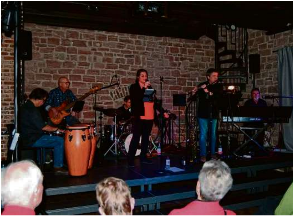
Ganz dem Genre Latin-Jazz verschrieben hat sich die Band Parason. Während ihres Auftritts wagen sie sich auch an ungewöhnliche Songs, beispielsweise von Jimi Hendrix.