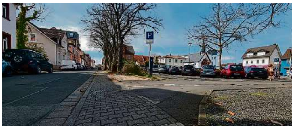
Wer sein Fahrzeug normalerweise an der Kaiser-Karl-Straße oder auf dem Kapellenplatz stellt, muss sich ab Ende März eine Alternative überlegen.