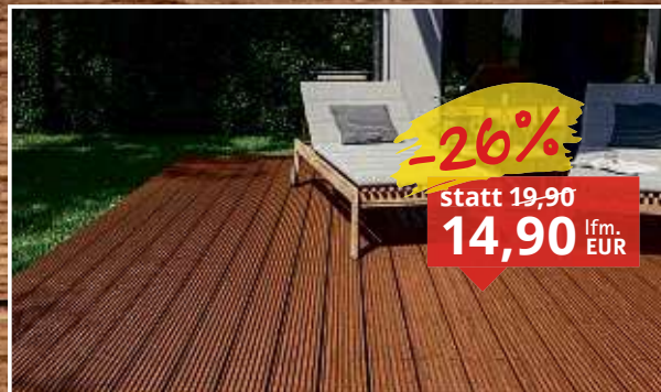
Terrassendiele Bangkirai Premium Qualität fein/grob geriffelt, Maße: 145 x 25 mm Längen: 1,83/5,13 m