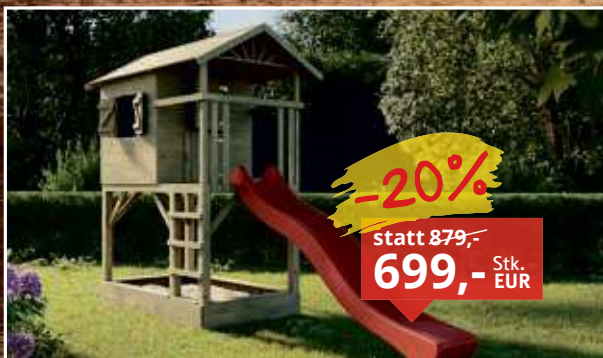
Stelzenhaus Tree Hut mit Sandkasten KDI B x T x H: 156 x 237 x 298 cm, inkl. 142 cm Podest