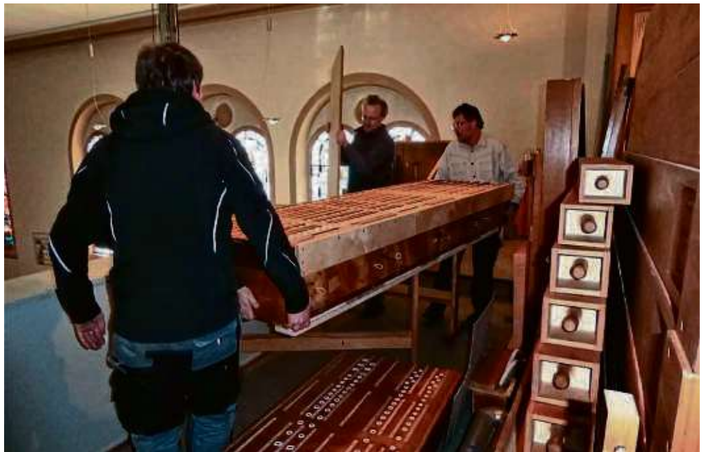
Beim Zusammensetzen der erneuerten Walcker-Orgel ist nicht nur Geschick, sondern vor allem bei den großen Teilen auch Kraft gefragt.