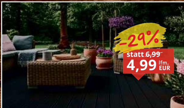
Terrassendiele WPC ProFi Terra Hohlkammerprofil, Maße: 128 x 3.150 mm, Stärke: 28 mm