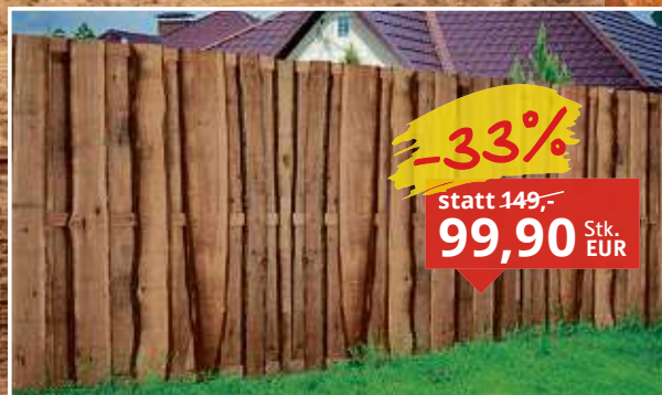
Sichtschutzzaun Europäische Lärche unbehandelt, Maße: 180 x 180 cm, Stärke: 7 cm