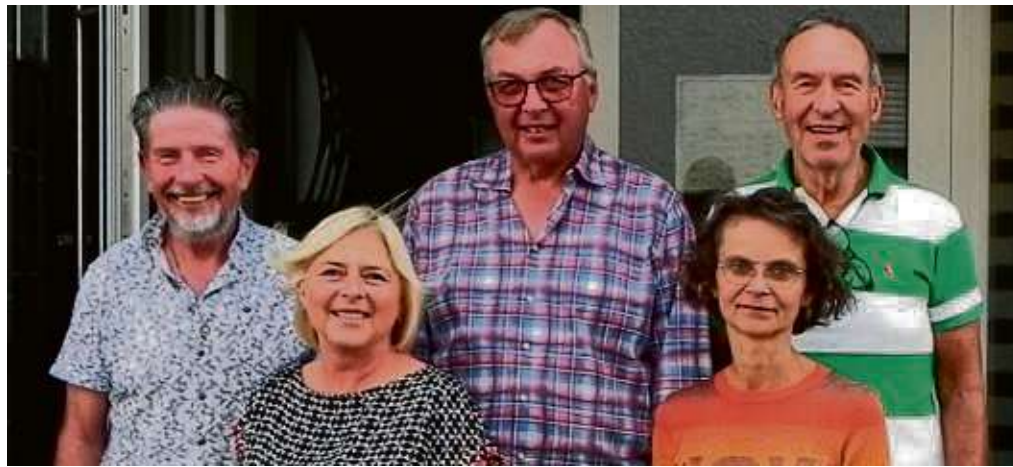
Einstimmig wiedergewählt haben die Tanzsportler der TKK ihren Vorstand.

Klein-Krotzenburg – Vereinsmitglieder und Freunde der Radsportvereinigung Klein-Krotzenburg sind eingeladen, am Freitag, 30. September, ab 19 Uhr in die Vereinsgaststätte Illy's Place an der Uferstraße 19 zu kommen, um dort traditionsgemäß den Kerbstrauß zu schmücken. Der Vorstand hofft auf zahlreiche Besucher und einen geselligen Abend. mt