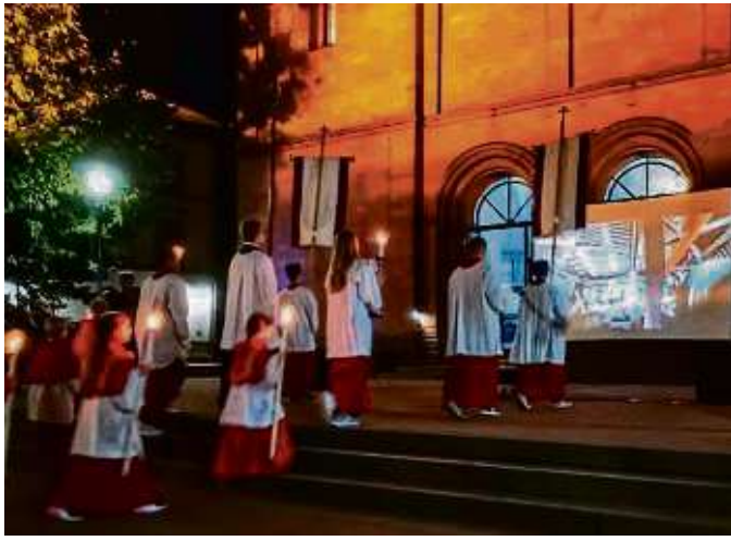
Eine Lichterprozession darf nicht fehlen.