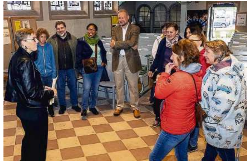
Musik darf nie fehlen bei so vielen besonderen Geburtstagen.