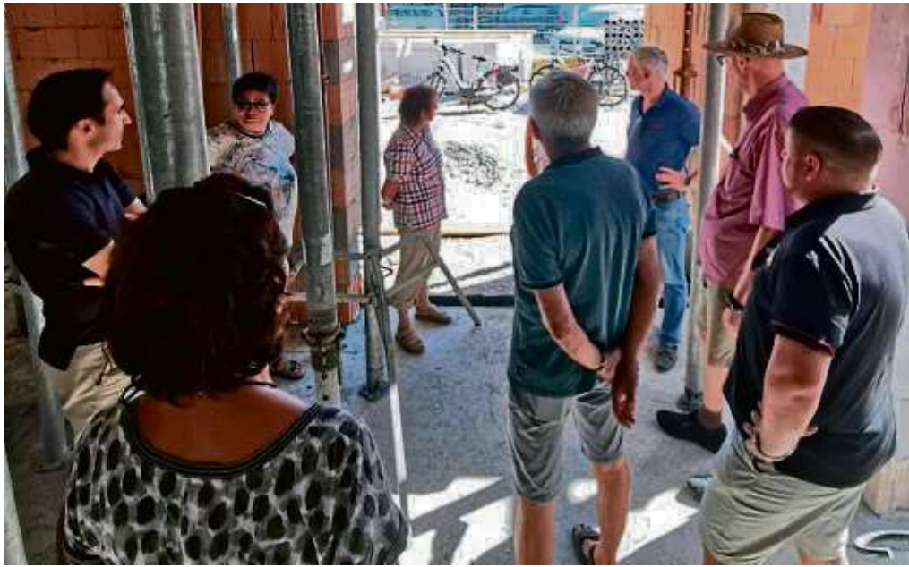
Ein Bild an Ort und Stelle machen sich Vertreter von CDU und FDP.