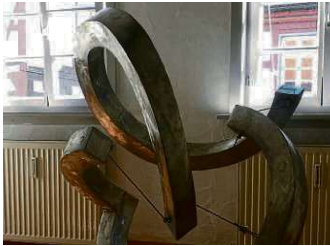
Edelstahlskulptur von Matthias Will (Detail)

Winters Farbfeldmalerei, schließlich, auch als essenzielle Malerei bezeichnet, will nichts als reine Malerei sein, hat meist eine ruhige, kontemplative Wirkung und trägt bisweilen sogar sakral anmutende Momente in sich. Außerdem ist in seinen Werken neben dem Ornament das Zeichenhafte von großer Bedeutung. mt