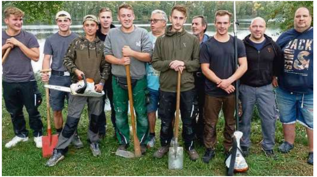
Freiwillige beim Arbeitsdienst am Vereinsgewässer: Es gibt viel zu tun, um zum Beispiel die Anglerplätze von Bewuchs zu befreien.

Die Gewässerordnung steht kommerzieller Ausbeutung entgegen, ebenso Fängen über den Eigenbedarf hinaus. Jugendliche oder Erwachsene können an Vereinsabenden dienstags vorbeikommen oder per E-Mail an info@asv-mainflingen.de Kontakt aufnehmen. Im Internet ist der Verein unter