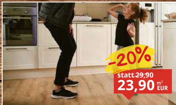
Designboden Eiche Hamilton Landhausdiele feuchtraumgeeignet, Maße: 1.285 x 192 mm, Stärke: 8 mm