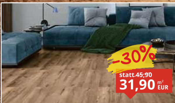
Vinylboden Eiche Toronto Landhausdiele 4-seit. Microfase, Maße: 1.220 x 229 mm, Stärke: 5 mm