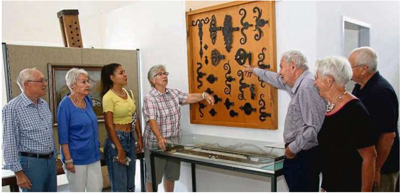
Die Kunst des Schmiedens stand im Mittelpunkt der informativen, eifrig wahrgenommenen Schau.

Viele Besucher erinnerten sich noch an die Schmiede der Familie Schnabel, die schon früh die Bezirksvertretung der Firma Adam Opel übernehmen konnte und wegen Platzmangels nach 1945