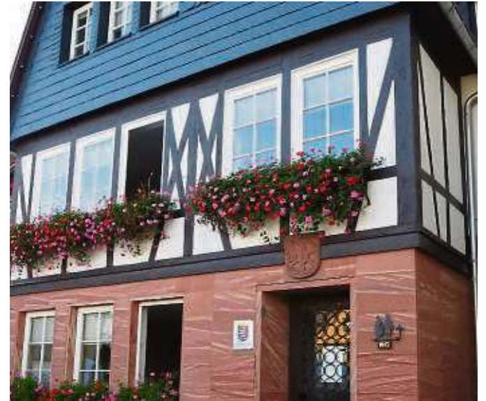
Haus Sonne, in den 1960er Jahren erbaut

es Rathaus baut, sieht der Seligenstädter Verwaltungschef keine Anknüpfungspunkte. Da sei die Geschichte – die früher selbstständigen Orte