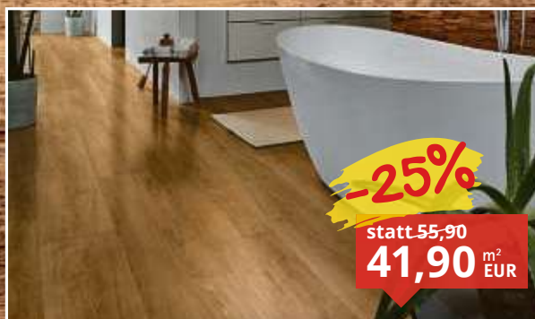
Designboden Eiche Lowfield Holzoptik feuchtraumgeeignet, Klick-Verbindung, Stärke: 5,5 mm