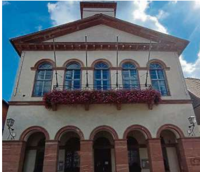
Rathaus am Marktplatz, errichtet 1823

Abgesehen von der Platznot auf circa 2000 Quadratmetern ist auch die energetische Ausstattung des klassizistischen Baus einige Überlegungen wert. Nach einer Ana-