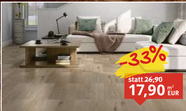
Vinylboden Oak brown Landhausdiele feuchtraumgeeignet, Maße: 1.220 x 184 mm, Stärke: 3,2 mm