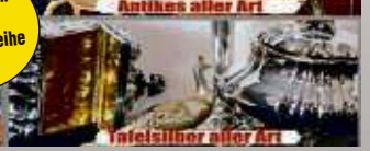
Silber aller Art