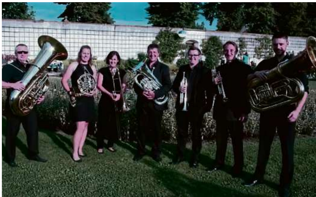
Das Blechbläserensemble der Stadtkapelle übernimmt die musikalische Begleitung beim Geleitsmahl 2022.

Darüber hinaus soll beim festlichen Geleitsmahl 2022 eine Rekordzahl von acht Neuaufnahmen erfolgen, nachdem die Veranstaltung zweimal coronabedingt ausfallen musste.