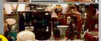
Antiques aller Art

Wir zahlen zur Zeit bis zu 65 €* * Euro pro Gramm