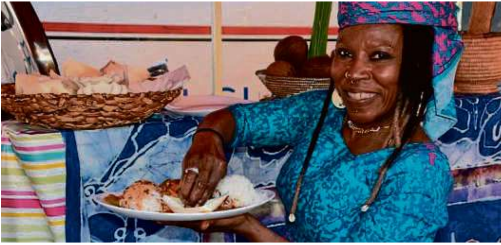
Streetfood-Festival: Speisen aus aller Herren Länder.