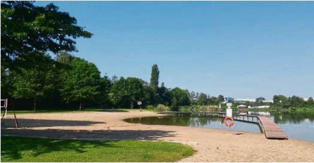
Badesee im Hainburger Ortsteil Klein-Krotzenburg: großzügige Liege- und Wasserflächen, Wiese mit vielen Sportmöglichkeiten.

Eintrittspreise unverändert, Beschränkung der Besucherzahlen aufgehoben