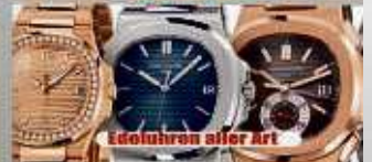
Golduhren aller Art

Ihre Vorteile: kostenlose Beratung kostenlose Wertschätzung transparente Abwicklung Bargeld sofort