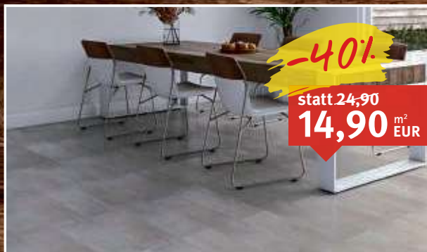
Vinylboden Toscana Gray Oak Landhausdiele, Klick-Verbindung, Dämmung, strukturiert, feuchtraumgeeignet, ohne Fase, Maße: 4,2 x 178 x 1.235 mm