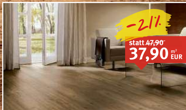
Designboden Grando Eiche Nox LKlick-Verbindung, integrierte Dämmung, gebürstet, 4-seitige Fase, Maße: 10 x 216 x 2.200 mm