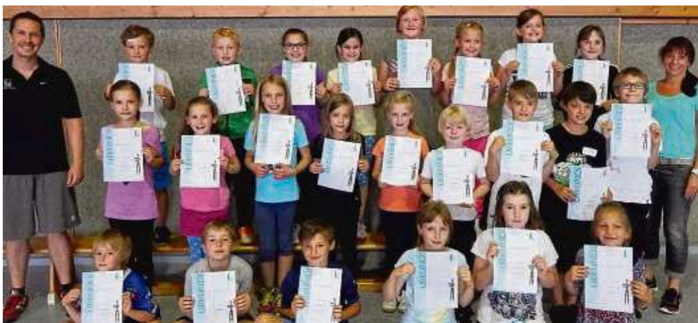
Erfolgreiche Teilnahme wird mit einer Urkunde bescheinigt.

Die traditionelle Fußwallfahrt der Klein-Welzheimer nach Walldürn ist am Samstag, 18. Juni, die Buswallfahrt am Donnerstag, 30. Juni. Nähere Infos dazu folgen. zbo