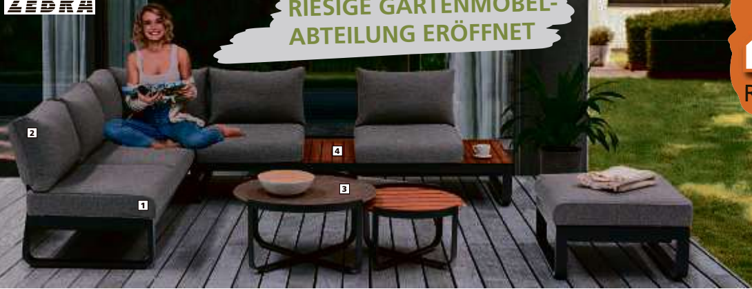
1 FLY 30 Lounge 3er Sitz Alu, pulverbeschichtet inkl. Olenkissen ca. 207x70x82cm B/H/T, beidseitige Verstellung. 2 FLY 31 Lounge Rückenmodul inkl. Rückenmodul inkl. Rückenmodul ca. 52x52x17cm B/H/T, Kissen mixed grey, Rahmen graphit. 3 FLY 32 Gartentisch Rahmen Alu pulverbeschichtet, Ø 60x35,5 cm kleiner Tisch und Ø 80x40,5 cm großer Tisch, Keramik. 4 FLY 35 Lounge - Teakeinleger 2er Set, Teak, ca. 70x36x2,5 cm B/H/T.