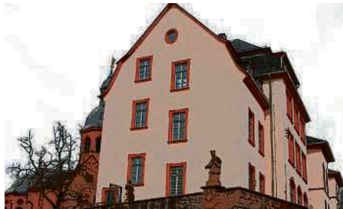
Hans-Memling-Haus: Weitere Sanierung geplant

Seligenstadt – Eine positive Zwischenbilanz ziehen die Freunde der Hans-Memling-Schule (HMS), die seit August 2021 gemäß Vereinbarung mit der Stadt Seligenstadt das Haus für Kultur, Bildung und Begegnung über eine dafür gegründete gemeinnützige Gesellschaft zur Nutzung anbieten: Jeder kann Räume oder den Hof zu günstigen Konditionen mieten.