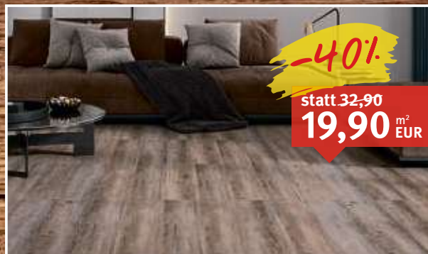
Design-Vinylboden Base 59 Rigid Pinie V522 Landhausdiele, Klick-Verbindung, Feuchtraumgeeignet, 4-seitige Fase, Maße: 4 x 176,6 x 1.210 mm