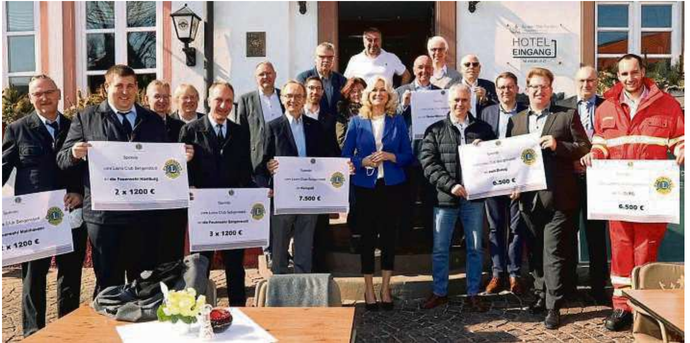
Den Erlös seiner Kalenderaktion hat der Lions-Club Seligenstadt an fünf Initiativen ausgeschüttet.

Der Förderverein Kompass des Lions-Clubs erhielt 7500