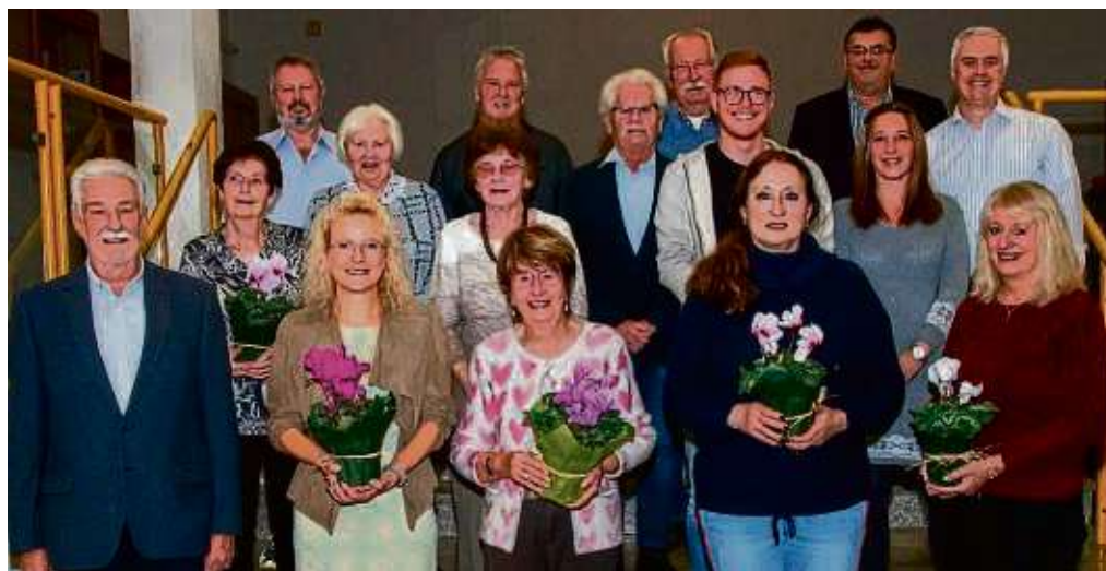
Preisträger, Veranstalter und Juroren bei der Feierstunde im „Wiesegiggel“