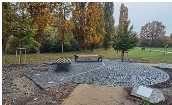
Blutbuchen rahmen den Ort „Zum Dialog“.

Vor einem Jahr wandten sich Vertreter der Lions mit der Idee an die Stadt, eine Begegnungsstätte für alle Menschen zu errichten. Anlass waren rassistisch und religiös motivierte Übergriffe in Hanau und anderswo. Die Gärtnerei Löwer spendete drei Bäume, die für die Religionen Christentum, Judentum und Islam stehen, der städtische