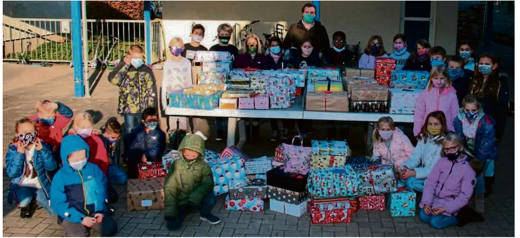
Wie schon im Vorjahr beteiligte sich die Alfred-Delp-Schule in Froschhausen wieder mit vielen Familien an der Weihnachtspäckchen-Aktion der Lichtblick-Stiftung Hanau (Hanauer Tafeln). Liebevoll haben Eltern und Kinder 120 bunte Päckchen mit Spielzeug, Kleidung, Mal- und Schreibutensilien sowie Süßigkeiten gepackt, um damit notleidenden Kindern und Erwachsenen eine Freude zu bereiten. Die Aktion findet zugunsten von Menschen im Raum Hanau statt, an die zum Weihnachtsfest kaum jemand denkt.