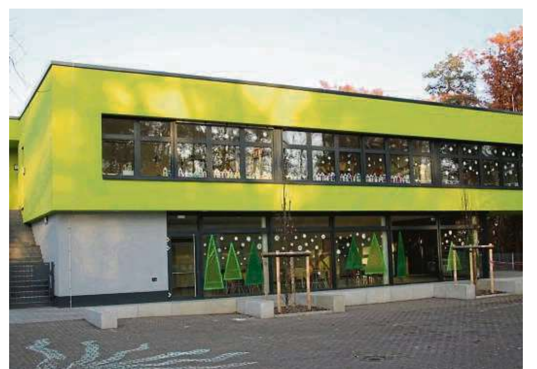
Bis zu 150 Kinder können in dem zweistöckigen Gebäude am Schulstandort mit Essen versorgt und betreut werden.

Gemeinde Hainburg und Kreis investieren über 1,6 Millionen Euro