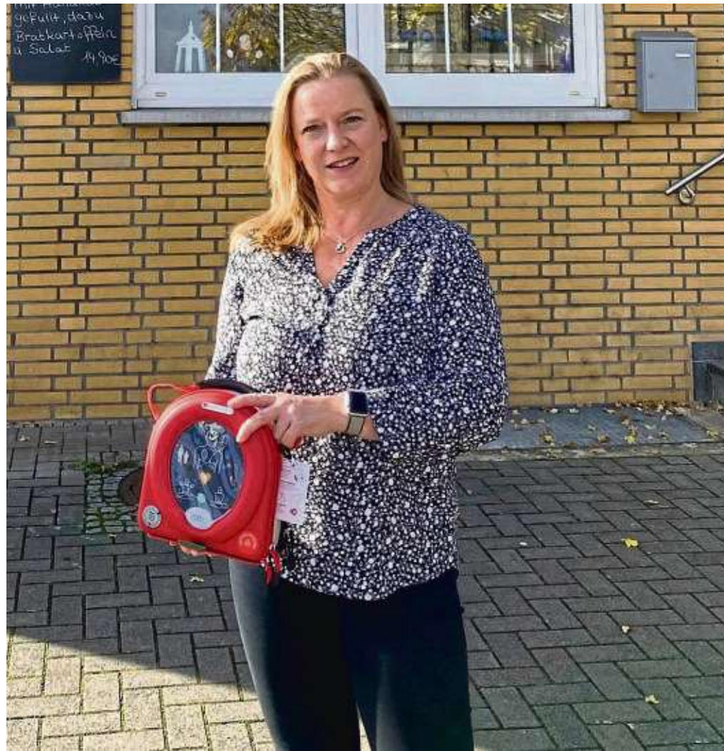
Die Turnabteilung der TSV Heusenstamm hat einen Defibrillator gespendet, der im Eingangsbereich der TSV-Halle in der Jahnstraße 3 hängt.

In den Jahresberichten der Fachbereichsleiter für das Kunstturnen, Cheerleading, Volleyball und Wandern wurde über die vielen durch Corona bedingten kreativen Trainingsalternativen berichtet. Training per Video, Online über Videokonferenz, mit Trainingsplänen, auf dem Außengelände, oder mit komplett neuen Konzepten wie zum Beispiel fürs Kinderturnen konnte der Kontakt zu den Mitgliedern gehalten werden. Freuen konnte sich die Turnabteilung im Sommer über eine Spende von 600 Euro, die bei der Kassier-