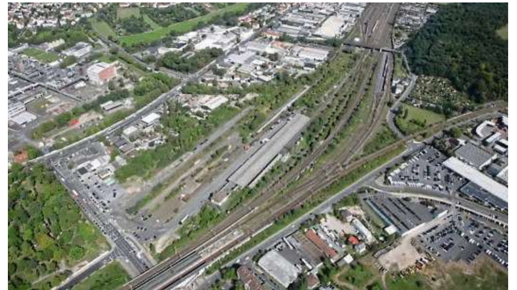
Luftbildaufnahme des Geländes, auf dem das geplante Wohn- und Gewerbegebiet unter der Bezeichnung Quartier 4.0 entstehen soll.

Offenbach (red) – Nachdem die Stadtverordnetenversammlung in Anfang November dem Satzungsbeschluss für die Bebauung des ehemaligen Güterbahnhofs Offenbach zugestimmt hat, ist nun der Weg frei für die Entwicklung des dort geplanten Wohn- und Gewerbegebiets unter der Bezeichnung „Quartier 4.0“. Die Erschließungsarbeiten sollen nach Angaben der Grundstückseigentümerin Aurelis Real Estate Service GmbH noch im ersten Quartal 2021 beginnen und bis Mitte 2022 abgeschlossen sein. Anschließend können die Bauarbeiten auf den einzelnen Baufeldern beginnen. Auf dem knapp 9 Hektar großen Bahnhofsareal im Osten der Innenstadt wurden ab 1919 Waren umgeschlagen, die über die Schiene transportiert wurden. Ab den 70er Jahren wandelte sich der Güterverkehr im Zuge der fortschreitenden Globalisierung. Schwere und industrielle Massengüter wie Stahl oder Steinkohle wurden zunehmend durch höherwertige und leichtere Güter abgelöst. Neue Märkte entstanden, der Transport auf der Straße nahm zu und die Transportwege veränderten sich. 1996 endete schließlich die Nutzung des Güterbahnhofs als Tief- und Verladestation. Danach diente das Areal verschiedenen Zwischennutzungen. Bereits im Jahr 2003 wurde für das Gebiet ein städtebaulicher Rahmenplan erarbeitet. Dieser formulierte im Offenbacher Osten neben dem Kaiserleigebiet und der Innenstadt eine dritte Säule der Stadtentwicklung mit dem Ziel, Büro- und Dienstleistungs-