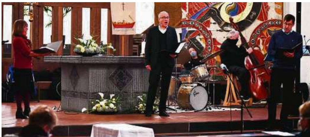
Die Offenbacher Hospiztage sind mit Texten und Musik zu den Themen Leben und Sterben, Tod und Trauer in der Kirche St. Paul gestartet. Sie dauern bis 7. November, das für 8. November geplante Benefizkonzert in St. Marien ist wegen Erkrankung abgesagt. Das weitere Programm findet sich unter www.hospiz-offenbach.de .