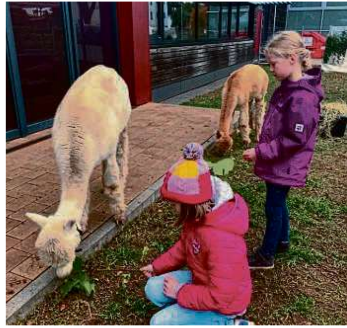
Schnell waren erste Berührungsängste überwunden.

vollen, geruchsneutralen und antiallergenen Wolle gezüchtet. Der Bestand an Alpakas in Peru liegt bei etwa 3,5 Millionen Tieren, was etwa 80 Prozent des weltweiten Bestands ausmacht. Alpakas werden in Europa wegen ihres ruhigen und friedlichen Charakters auch in der tiergestützten Therapie eingesetzt. Alpakas sind wie alle Kamele soziale Tiere und fühlen sich in Gruppen am wohlsten.