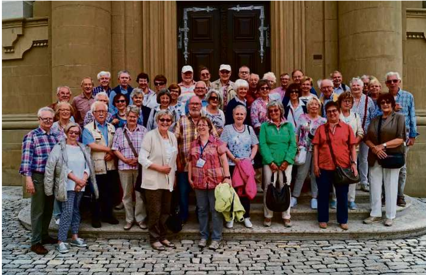
Die Kirche St. Mauritius in Wiesentheid war eines der Ziele bei der Jahresfahrt 2019 des Fördervereins Balthasar Neumann.

Probleme mit der Zustellung? 069/85008-443