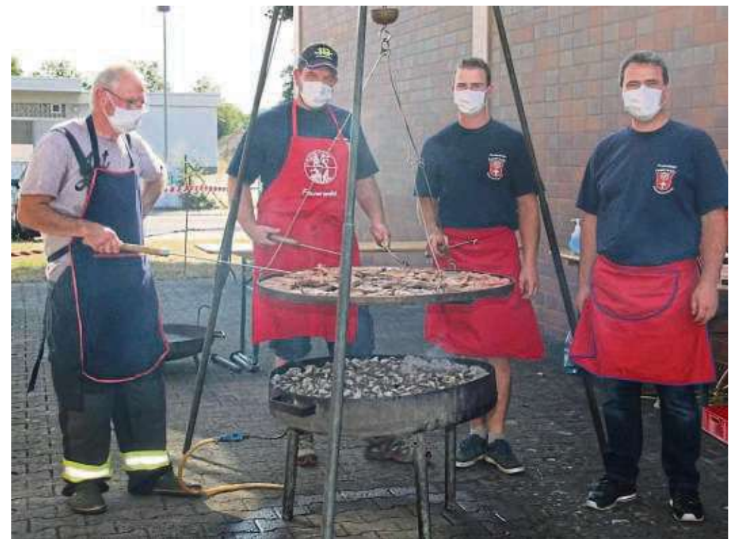
Die Freiwillige Feuerwehr Klein-Krotzenburg bot ihre beliebten Feuerwehrsteaks aufgrund der aktuell bestehenden Beschränkungen für zu Hause an – getreu dem Motto „Unser Grillfest derff des Joahr net steische, awwer die Steaks wolle mer euch net aach noch streiche“. Die traditionellen Grillsteaks vom Schwenkgrill konnten direkt am Feuerwehrhaus in umweltfreundlichen Verpackungen aus Zuckerrohr abgeholt werden, alternativ stand auch ein Lieferservice bereit.

stehen aber warme Fleischwurst, Würstchen, und mehr für den kleinen Hunger der Gäste bereit. Wie es sich gehört, gibt es neben kühlen Erfrischungsgetränken auch frisch gezapftes Bier und Weißbier aus dem Hause Glaabs vom Fass. Es wird sich zwar ein bisschen was ändern, aber für eines garantiert die Germania: Spaß und Gemütlichkeit im wohl schönsten „Vereins-Biergarten“ Hessens. Die Welzheimer Germania freut sich auf viele Besucher.