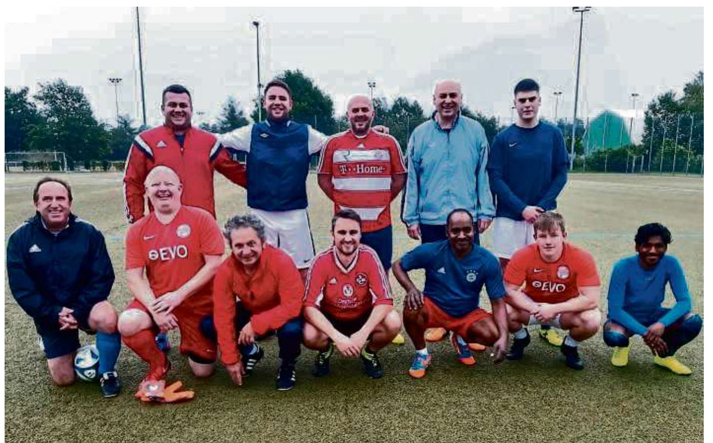
Freuen sich auf neue Mitspieler: Die Kicker der Sondermannschaft der TSV Heusenstamm trainieren einmal die Woche auf der Sportanlage am Martinsee zusammen.