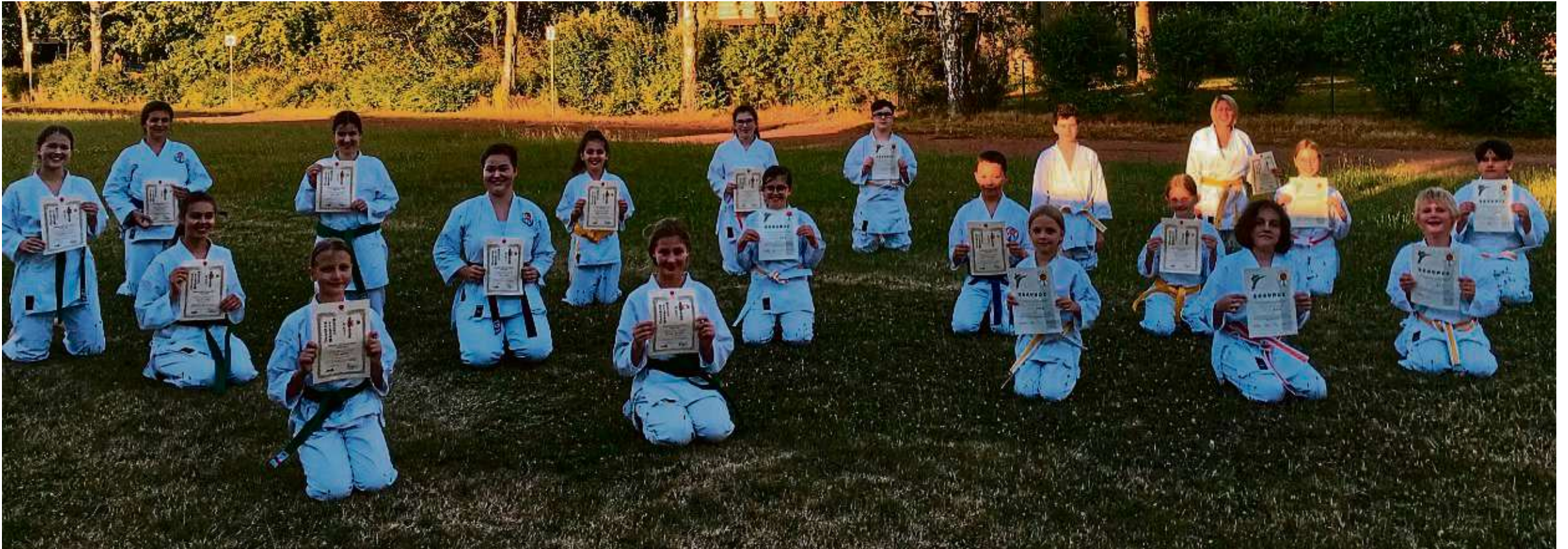
Bei den diesjährigen Sommerprüfungen der Karateabteilung der TSV Heusenstamm haben alle Prüflinge, darunter Kinder, Jugendliche und Erwachsene, ihre Prüfungen zum nächsthöheren Gurt bestanden.