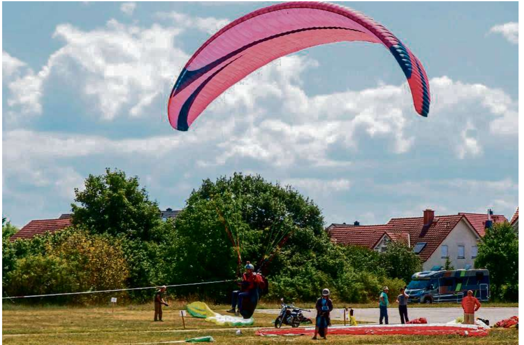
Ihr Fliegerlager verbringen die Piloten des Albatros-Gleitsegelclubs Aschaffenburg derzeit auf dem Segelflugplatz in Zellhausen.

Abtsberg“ vermitteln einen lebendigen Einblick ins mittelalterliche Leben der Stadt und der Benediktiner-Abtei. Aber auch Geschichten über die berühmtesten Gefängnisse in den Stadttürmen und Bollwerken der Stadtbefestigung, hochnotpeinliche Verhörmethoden, Hexenprozesse und den letzten Weg hinaus zum Galgenhügel lassen erahnen, wie dunkel im Geiste das Mittelalter wirklich war. Nachtwächter und Türmerin versetzen ihre Gäste aus dem weltlichen Seligenstadt hinein in die benediktinische Klosterstadt mit ihrer 1.200-jährigen Geschichte. Ein gemeinsamer Abschiedstrunk mit Blick auf die alte Klostermühle endet mit einem zünftigen Abschiedsgruß, verbunden mit einem beherzten Stoß ins Horn. Buchungen nimmt die Tourist-Info unter 06182 87177 entgegen.