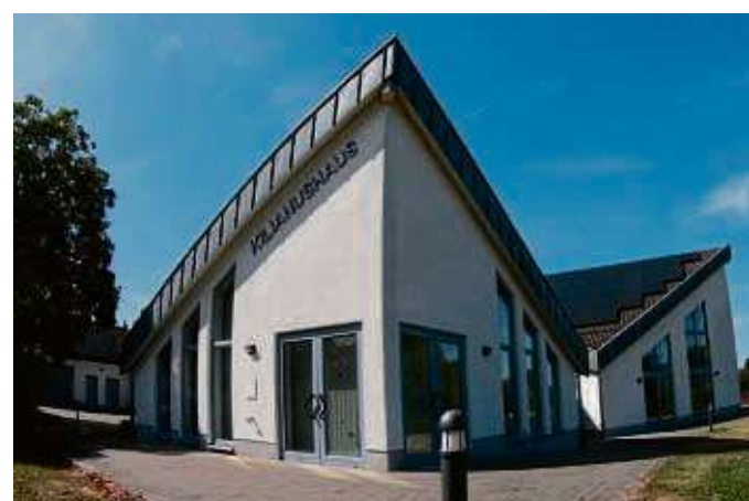
Künftiges Kitagebäude Kilianushaus: Die Inbetriebnahme ist für Ende des Jahres geplant.

lich durch Mitarbeiter des gemeindlichen Bauhofs geräumt und mit den notwendigen Räumungs- und Rückbauarbeiten begonnen. Anschließend wird die Anpassung der Elektro- und Sanitärinstallation sowie des Innenausbaus vorgenommen. Soweit möglich werden die Arbeiten von Fachingenieuren geplant und vom