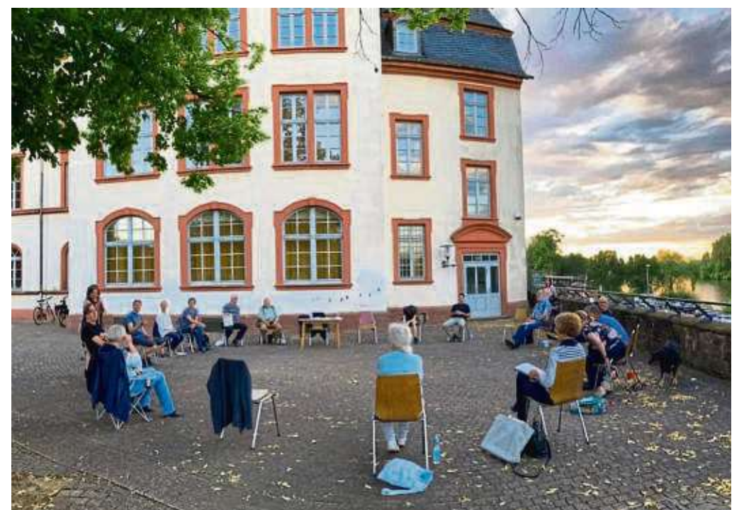
In luftiger Atmosphäre und mit gebührendem Abstand trafen sich die Seligenstädter Fotofreunde erstmals wieder physisch zu ihrem monatlichen Clubabend. Um zu demonstrieren, dass sie nicht nur Freunde der Fotografie, sondern auch Freunde der Hans-Memling-Schule sind, wählten sie den Pausenhof des historischen Gebäudes zwischen Basilika und Mainufer für ihr Juli-Treffen.

sentation während der Bauzeit ist möglich. Damit ein einheitliches Bild der Werbeflächen entsteht, wurde die Firma active design in Hainburg mit der Vermarktung beauftragt. Weitere Informationen gibt es unter ☎ 06182 8980381 oder per E-Mail an b.guenter@active-design.net.