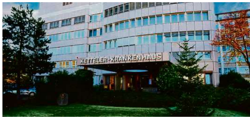
Auch das Deutsche Palliativsiegel wurde dem Ketteler Krankenhaus erneut erteilt.

kontrollieren die Spielgeräte, Bänke und die Bepflanzung auf Schäden. Reparaturbedarf an den Spielgeräten wird an die Kollegen von der GBM Service GmbH Offenbach der Stadtwerke gemeldet. Schäden an Bänken und sonstigem Stadtmobiliar erledigen die Mitarbeiter des Stadtservice in Eigenregie. Zusätzlich sind Jugendliche im Auftrag des Boxclubs täglich im Nordend unterwegs und sammeln dort Müll wie Taschentücher, Verpackungen oder Zigarettenskippen auf. Ob die Maßnahmen greifen oder ob noch mehr für die Sauberkeit im Nordend getan werden muss, überprüft der Außendienst des Stadtservices laut Mitteilung der Stadt bei seinen Kontrollen jeden Morgen.