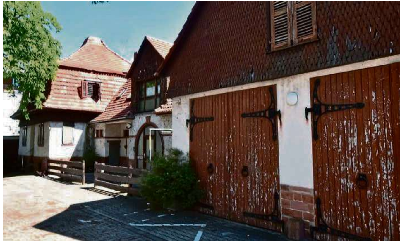
Die Alte Feuerwache wurde in das Denkmalverzeichnis des Landes Hessen aufgenommen.

bilden“, ergänzt der Ratshauschef. Er kündigte an, dass dieser neue Gesichtspunkt bei der Vorstellung von Ideen im Rahmen des Integrierten Stadtentwicklungskonzeptes (ISEK) sowie im Zusammenhang mit dem Thema des Feuerwehrhauses Berücksichtigung finden wird. Ein Auszug aus dem Denkmalverzeichnis: „1876 erhielt Heusenstamm seine erste eigene Feuerwehr. Anlass ihrer Gründung war ein verheerender Ortsbrand im Februar des Jahres, der aufgrund mangelnder Gerätschaften nur schwerlich zu löschen war. 1910 erfolgte der Bau einer neuen Feuerwache am östlichen Ortsrand. Verkehrstechnisch günstig gewählt wurde der Standort an der 1892 angelegten Ortsstraße nach Rembach, die im Westen an die Hauptortsdurchfahrt (Frankfurter Straße) anschließt. Vermutlich um 1923 entstand an der Nordseite des Baukörpers eine Erweiterung in Form eines weiteren Wohn- und Aufenthaltsgebäudes. In den 1950er Jahren ließ man an der Ostseite einen inzwischen abgängigen holzverschalteten Schlauchturn errichten. Die nachfolgen-