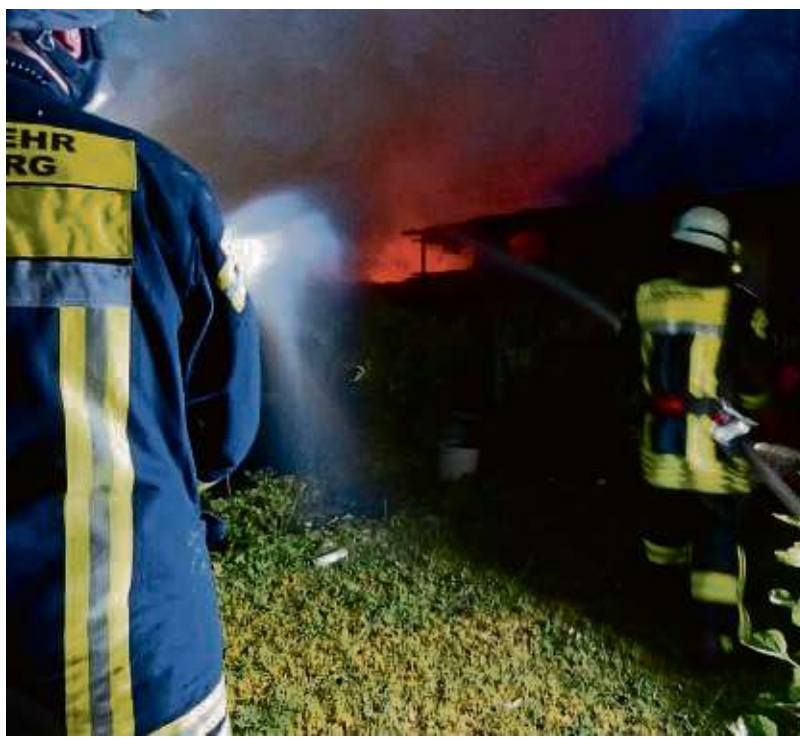
Zwei Feuerwehrleute im Kampf gegen einen Brand eines Holzschuppens am vergangenen Samstag in Hainstadt.

Uhr konnte auch das letzte Fahrzeug mit mehreren Fahrzeugen zur Einsatzstelle verlassen. Eine Staffel kontrollierte gegen neun Uhr erneut die Einsatzstelle auf heiße Brandstellen hin, so der Einsatzbericht der Feuerwehr Hainstadt. Die Hütte wurde bei dem Brand komplett zerstört. Es wurden keine Anwohner verletzt. Zu der Brandursache gab es zunächst noch keine Angaben.