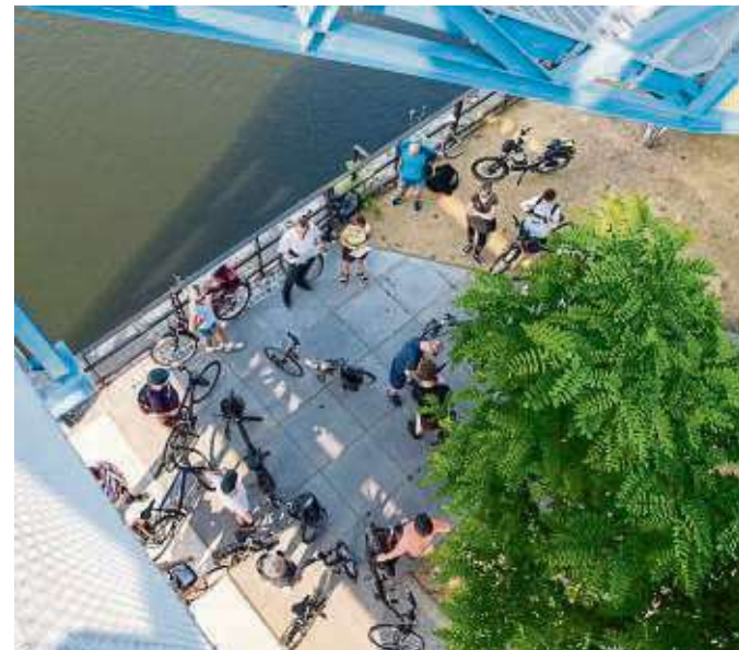
Rund 20 Teilnehmer kamen Ende Juni 2019 zur allerersten Bike Offenbach-Tour am blauen Kran im Hafen zusammen.

senswertes rund um Bike Offenbach. „Tour de Bieber“ Die Tour beginnt am Mathildenplatz in der Innenstadt und verläuft parallel zur Waldstraße Richtung Heusenstamm nach Bieber und zurück. Sie ist elf Kilometer lang, und die Teilnehmenden sind größtenteils entlang der zukünftigen und teilweise fertiggestellten Fahrrad-Achsen 3 und 6 unterwegs. Termin: Mittwoch, 17. Juni, 18 Uhr, Treffpunkt Stadteibüro Mathildenplatz „Raus ins Grüne“ Die Tour startet an der Straßenbahn-Endhaltestelle Dreieichring und führt über den Wilhelmsplatz und die neue Fahrradstraße in Bürgel nach Rumpenheim, um von dort aus entlang des Mains zurück in die Innenstadt zu gelangen. Ein Teil der rund elf Kilometer lan-