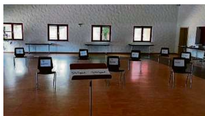
Mit genügend Abstand wird geübt.

kurzfristig abgesagt werden musste, für das die Musiker sich so lange vorbereitet hatten, war die Vorfreude groß, nicht nur für sich alleine zuhause sondern endlich wieder einmal in der Gemeinschaft zu musizieren. Deshalb finden ab jetzt wieder dienstags die Proben für Schüler- und Großes Orchester und Montags für die „Original Hainburger“ statt. Die Musiker freuen sich aber vor allem darauf, möglichst bald auch in der Öffentlichkeit wieder ihr musikalisches Können zu präsentieren und auch das Jahreskonzert noch nachzuholen. Nähere Infos wie immer im Internet unter www.mge1888.de .