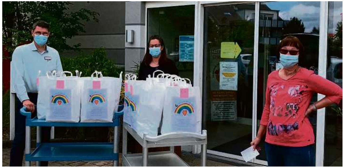
Eine ganze „Wagenladung“ Süßes und Salziges spendierte der Förderkreis den Bewohnern und Mitarbeitern des Horst-Schmidt-Hauses der Arbeiterwohlfahrt (Awo).

schlossen, auch weiterhin positiv denkend und mutig durch die Pandemie zu gehen. Dass Angehörige die Einzel-Kontaktbesuche unter dem schützenden Hygienekonzept der Einrichtung seit einigen Wochen wahrnehmen können und das tun, ist auch sehr unterstützend – aber: ein wenig Schokolade ist immer ein i-Tüpfelchen Glück obendrauf. Und trotz allem wird am kommenden Freitag, 19. Juni, von 15 bis 18 Uhr das alljährliche Sommerfest im Garten des Horst-Schmidt-Hauses gefeiert – diesmal allerdings unter Ausschluss der Öffentlichkeit.