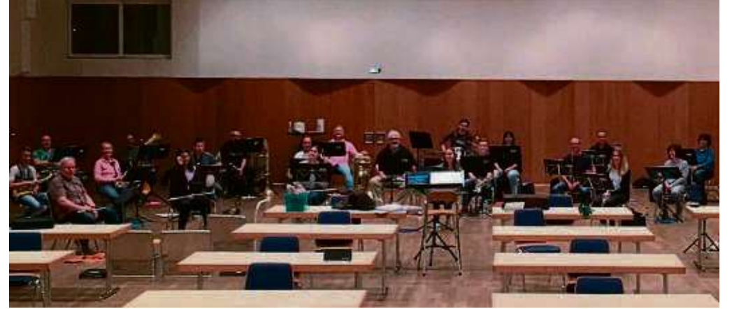
Endlich wieder Probe. Nach der erzwungenen Pause der vergangenen Monate hat der Musikverein Klein-Welzheim wieder die Proben aufgenommen. Das Jugendorchester und das Große Blasorchester haben sich am Dienstag vor einer Woche erstmals wieder zum Musizieren im Bürgerhaus Klein-Welzheim getroffen. Der Musikverein wird nun auch die Sommermonate nutzen, um für hoffentlich kommende Veranstaltungen zu proben.