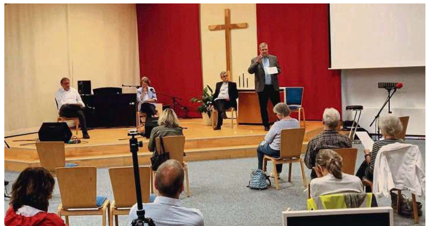
Rund 20 Besucher aus drei verschiedenen Kirchengemeinden kamen zur Podiumsdiskussion, zu der die Freie evangelische Gemeinde Heusenstamm eingeladen hatte.

aufgenommen wurden und die für die nächsten Jahre sicherlich genügend Stoff für weitere Podiumsdiskussionen liefern werden. Abgeschlossen wurde der für alle sehr interessante Abend mit dem gemeinsamen Sprechen des Apostolischen Glaubensbekenntnisses.