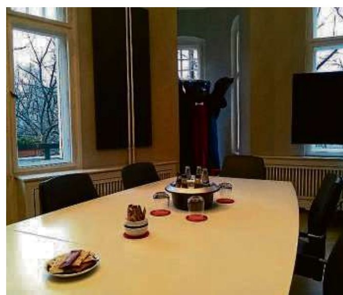
Besprechungsraum in der Anwaltskanzlei

ordentlichen und der besonderen Gerichtsbarkeit. Die Revision eines Gerichtsurteils bietet nach der ersten bzw. zweiten Instanz die Möglichkeit, in einer weiteren Fallprüfung die Rechtssache erneut zu verhandeln und zu entscheiden. Zuständig für Revisionsverfahren sind in der Regel die obersten Bundesgerichte. In den meisten Strafsachen sind jedoch die Oberlandesgerichte (in Berlin Kammergericht, in Hamburg Hanseatisches OLG) zuständig. Gegen im ersten Rechtszug erlassene Urteile kann Revision eingelegt und damit die Berufungsinstanz übergangen werden, wenn der Gegner einwilligt und das Revisionsgericht diese „Sprungrevision“ zugelassen hat. Der Antrag auf Zulassung der Revision, der die Rechtskraft des Urteils hemmt, ist innerhalb eines Monats nach Zustellung des Urteils bei dem Revisionsgericht einzureichen. Im Strafverfahren kann gegen Urteile des Amtsgerichts statt Berufung unmittelbar Revision eingelegt werden, wenn es dem/der Beschwerdeführer/in nur auf die Klärung von Rechtsfragen ankommt. Auch gegen das Urteil eines Verwaltungsgerichts ist die Sprungrevision vor dem Bundesverwaltungsgericht möglich, wenn das Verwaltungsgericht das