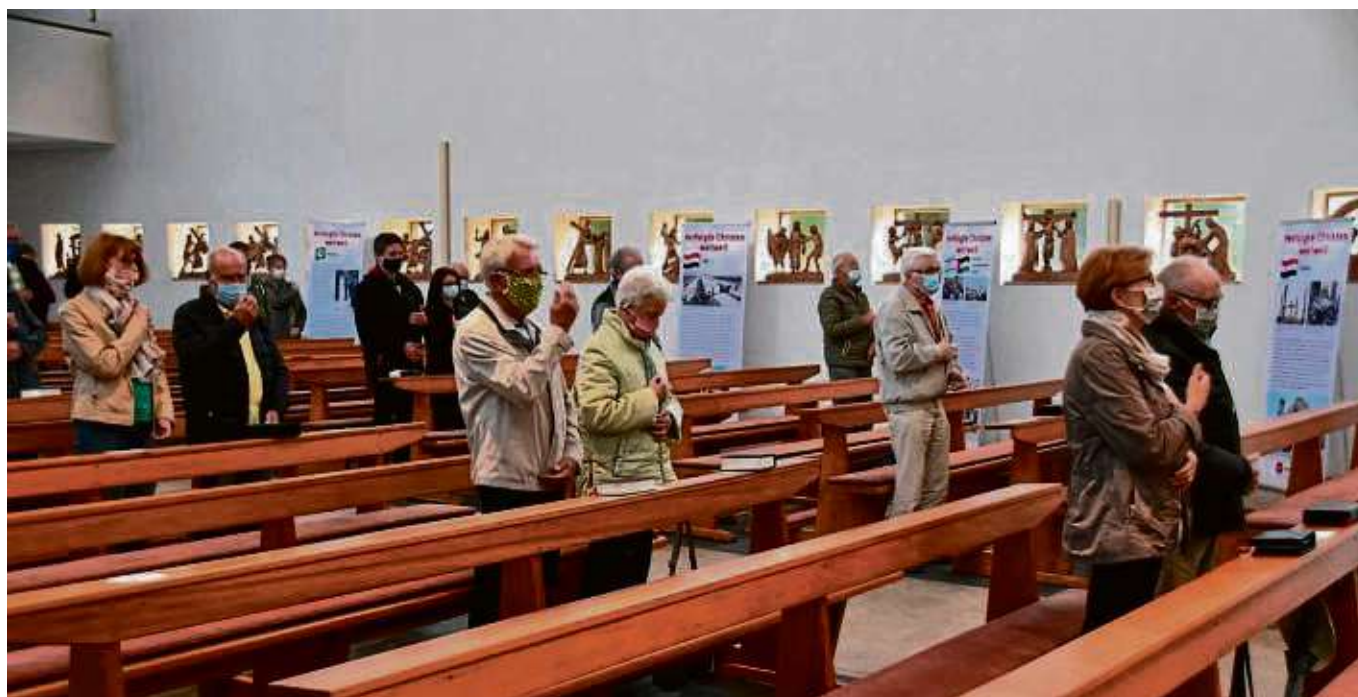
Markierungen an den Kirchenbänken sorgen für den nötigen Sitzabstand zueinander, den die Gläubigen bei den Gottesdienstbesuchen einhalten müssen.

Gemeindebüro: Dietrich-Bonhoeffer-Straße 2-4, 63110 Rodgau-Weiskir-