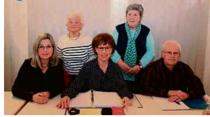
Zur Jahreshauptversammlung haben sich die Mitglieder des katholischen Kirchenchores St. Kilianus getroffen.