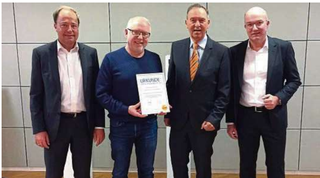
Die Vertreter der Turnerschaft 1882 Klein Krotzenburg freuen sich über die Urkunde und den Geldpreis in Höhe von 1.500 Euro.

Weiterhin hat der Verein die Teilnehmer ermutigt, mit dem Fahrrad zum Sport zu kommen und das Auto dagegen stehen zu lassen. Hier ist ein als weiterer Bestandteil ein großer Fahrradparkplatz in Planung. All diese Maßnahmen führten zu der Auszeichnung mit dem Klimapreis der Entega.