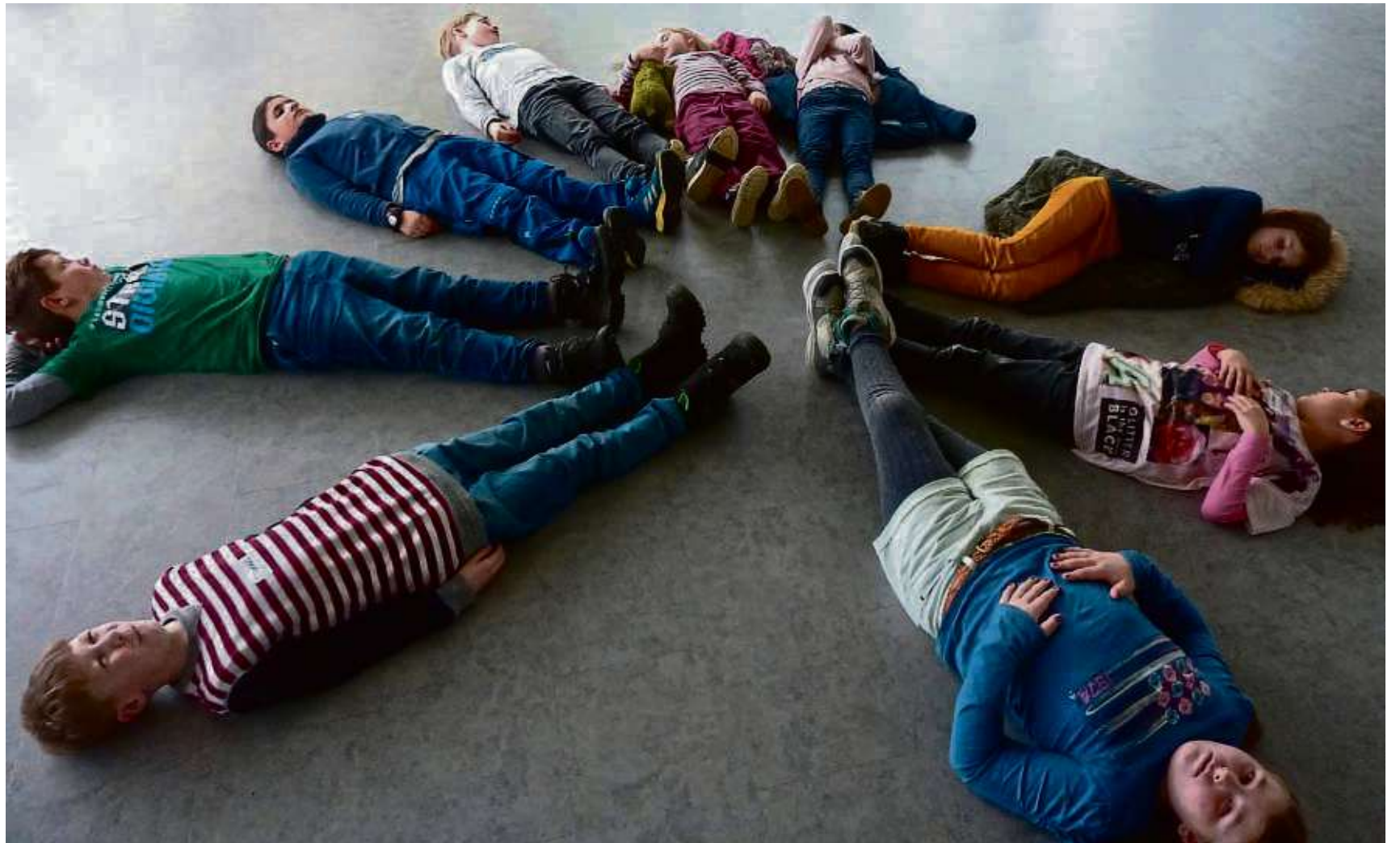
Auf der Suche nach dem verlorenen Schaf: In der Fastenzeit bot der Kindertag von St. Marien in Seligenstadt den über 40 Kindern, die daran nahmen, etwas Besonderes. Alles drehte sich um ein kleines verlorenes Schaf. Diese biblischen Geschichte beschäftigte die Kinder in verschiedenen Kleingruppen auf unterschiedliche Weise: Da gab es eine Traumreise mit Musik, bei der das Schöne und das Bedrohliche deutlich wurden, da gab es Spiele, bei denen die Kinder Leichtigkeit und Spaß erlebten und eine Schatzsuche im Labyrinth, bei der Schafe gesucht werden mussten. Zur Vertiefung malten die Kinder beeindruckende Bilder. Die Älteren schrieben bewegende Geschichten voller Fantasie und guter Gedanken.