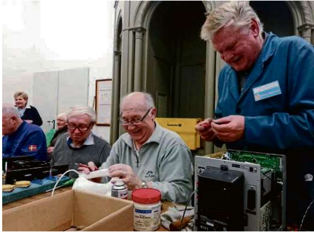
Ihnen macht Reparieren sichtlich Spaß. Die Experten des Hainstädter Repair Cafés sind für viele eine hoffnungsvolle Anlaufstelle, wenn ein älteres technisches Gerät kaputt geht.