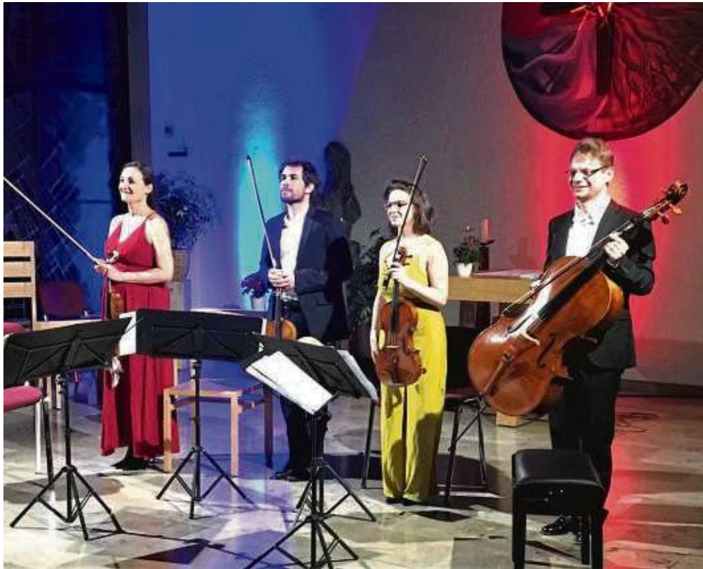
Das Alinde-Streichquartett aus Köln begeisterte die Zuschauer in der Kapelle des ehemaligen Klosters in Hainstadt.

Themen in den Sinfonien Beethovens und sorgten auch mit Musikbeispielen und Erklärungen bei den anderen beiden Werken für einen kammermusikalischen Hochgenuss. Die Darbietung der Werke überzeugte durch große Spielfreude, glänzendes Zusammenspiel. Spieltechnisch und in der Interpretation der Werke auf höchstem Niveau. „Da braucht man nicht nach Frankfurt zu fahren“, sagte eine Zuhörerin in der Pause. Der Freundeskreis St. Gabriel, der diese Konzertreihe fördert, wies auf die weiteren kammermusikalischen Gesprächskonzerte der Reihe „Intervalle - Kammermusik im Gespräch“ in St. Gabriel in diesem Jahr hin. Am Samstag, 22. August, findet um 19 Uhr ein Sere-nadenkonzert mit dem Blockflöten Ensemble „il flauto dolce“ unter der Leitung von Claudia Krämer im Innenhof des Klosters statt. Und am Samstag, 25. Oktober, gibt es um 17 Uhr dort einen Liederabend mit dem Tenor Ralf Emge.