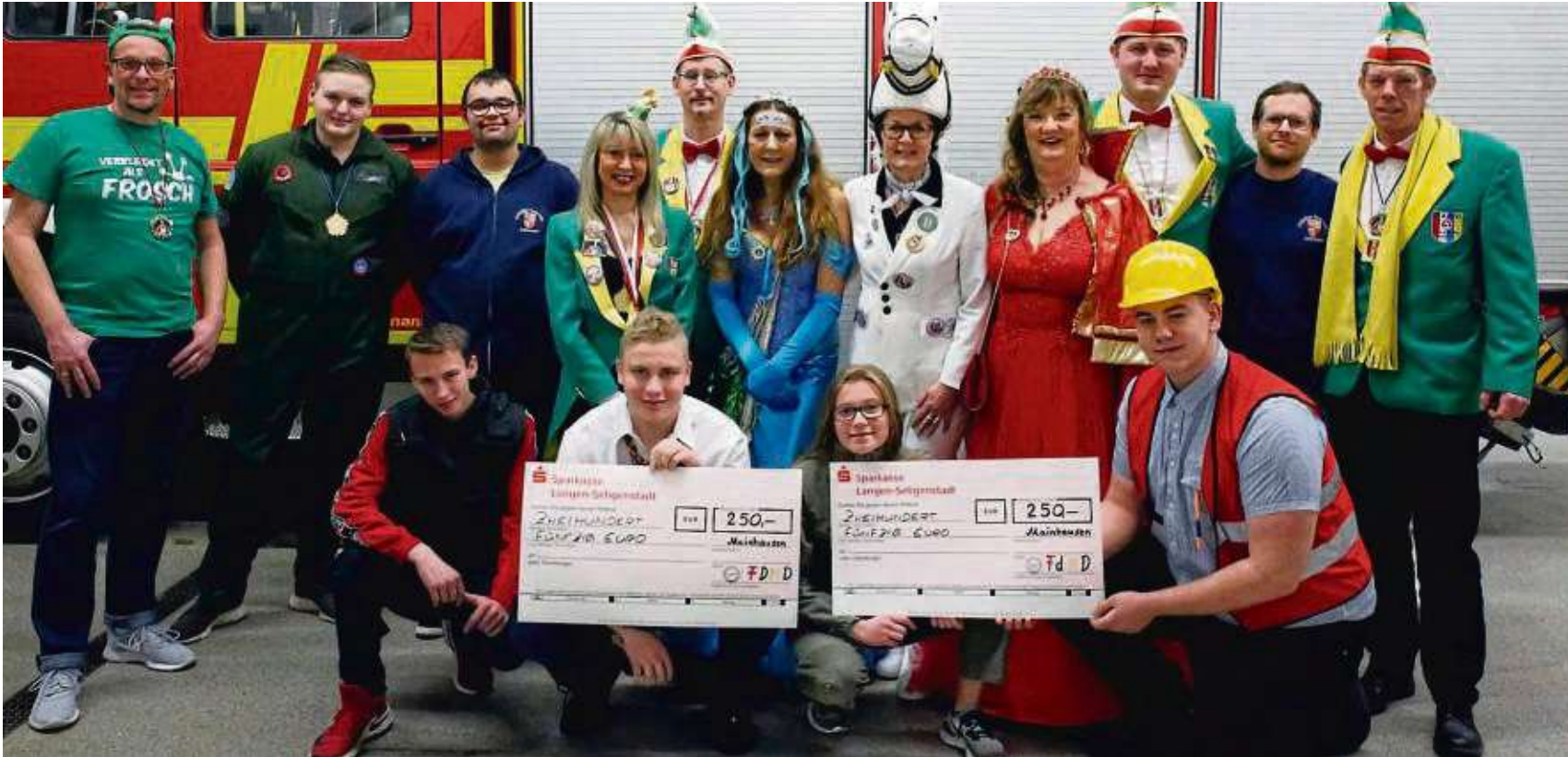
Im Rahmen des Kappenabends im Feuerwehrgerätehaus Mainflingen, wurden der Mainhäuser Jugendfeuerwehr zwei Schecks im Gesamtwert von insgesamt 500 Euro und ein herzliches Dankeschön für die Verteilung des Fastnachtsboten in beiden Ortsteilen, durch das Dreigestirn und Minister des Vereins Freunde des Mainflinger Dreigestirns, übergeben.