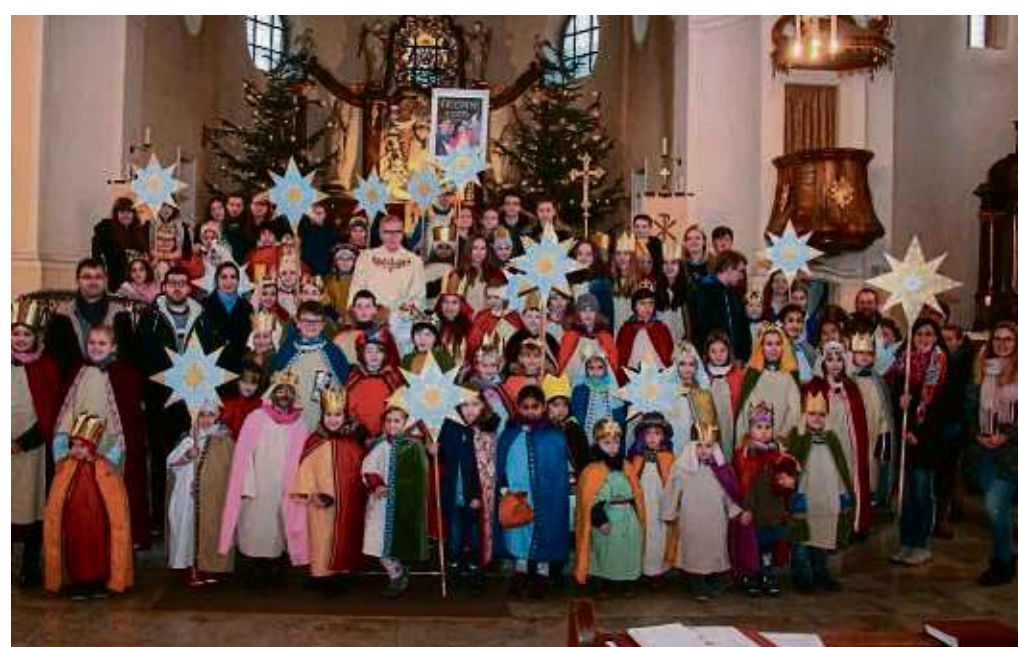
Erzielten ein Rekordergebnis: Die Sternsinger der Pfarrgemeinde St. Wendelinus.