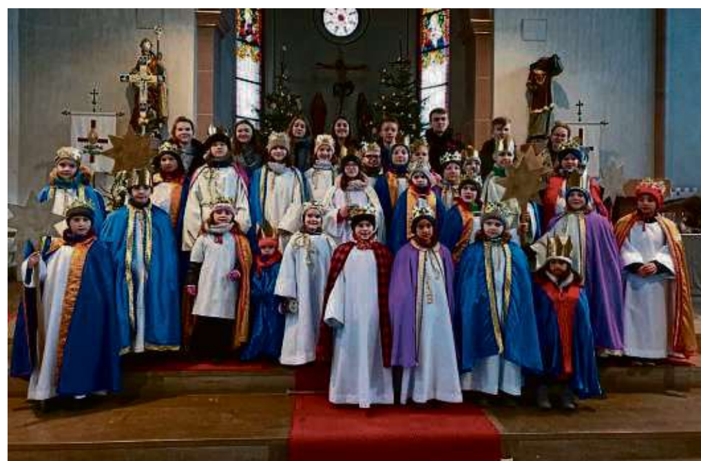
Die Sternsinger aus Klein-Welzheim sammelten nicht nur Geld, sondern auch Unmengen Süßigkeiten ein. 15 Kilogramm spendeten sie.