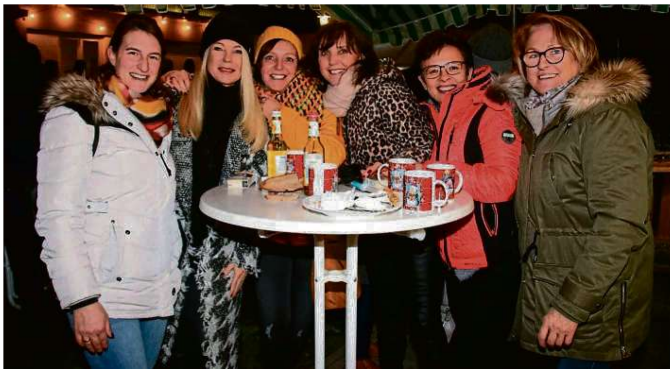
Die Nutzer des Vereinsheims Wiese 1 in Zellhausen, die KJG, Gesangsverein Harmonie, Treue Bazis und SPD, hatten zum Winterfest eingeladen. Zahlreiche Besucher genossen Glühwein, Cocktails und Leckereien wie über offenem Feuer gegrillten Flammflachs, Lakefleisch oder Ofenkartoffeln.

nachtsferien Spiele-Spenden im Seligenstädter Rathaus (direkt an der Pforte) in der Katholischen Jugendzentrale, Goethestraße 29, (Pfarrheim St. Cyriakus, Obergeschoss) und im evangelischen Gemeindezentrum entgegengenommen. Der Erlös kommt einem sozialen Projekt zugute. „S(pi)eligenstadt“ wird am Donnerstag von 8 bis 20 Uhr, am Freitag von 8 bis 22 Uhr, am Samstag von 12 bis 23 Uhr und am Sonntag von 12 bis 18 Uhr für alle ab vier Jahren geöffnet haben. Der Eintritt ist frei. Mehr auf der gegenüberliegenden Seite 8.