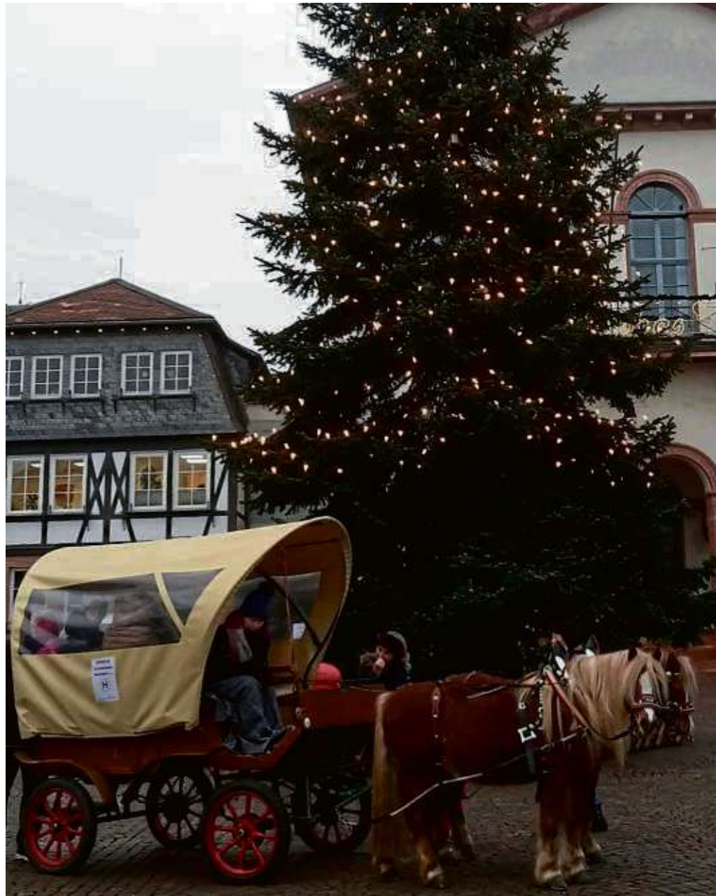
Mit großer Begeisterung haben die Teilnehmer die Kutschenfahrt des Gewerbevereins Seligenstadt. Insbesondere die Kinder hatten viel Spaß bei der Fahrt durch die schöne Altstadt. Kutschiert wurden die Teilnehmer von Ludwig Sprey und den beiden Ponys.