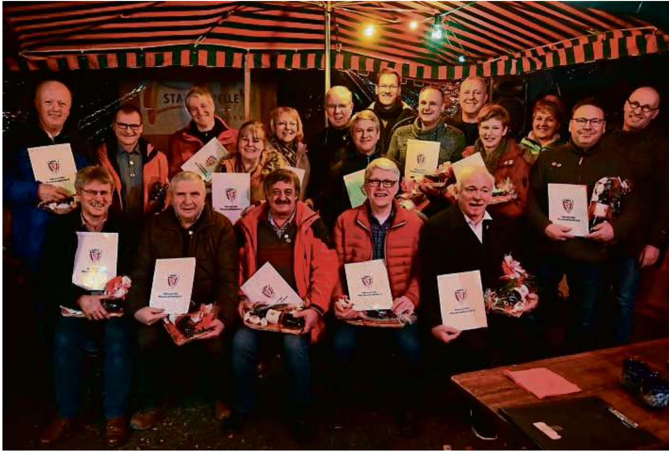
Die Jubilare: Zusammen gerechnet wurde an diesem Abend 775 Jahre Vereinsmitgliedschaft bei der Stadtkapelle geehrt.

Insgesamt 775 Jahre Vereinsmitgliedschaft geehrt