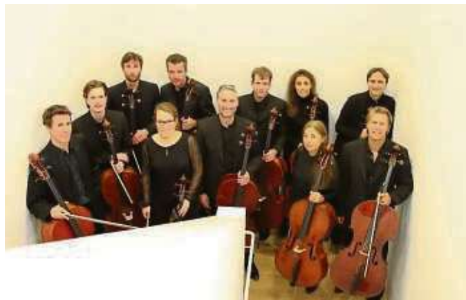
Die Elph Cellisten, die Cellisten des NDR Elbphilharmonie Orchesters, sind am Samstag in Seligenstadt.

Seligenstadt (zja) – Die Elph Cellisten, die Cellisten des NDR Elbphilharmonie Orchesters, spielen am Samstag, 30. November, um 20 Uhr im Rahmen der Klosterkonzerte in Seligenstadt in Sankt Marien, Steinweg 25. Kenner und auch Dirigenten bezeichnen die Musiker dieses Ensembles als eine der besten Cellogruppen weltweit. Immer wieder verstehen es die elf Streicher, mit raffinierten Arrangements und teils eigenen Bearbeitungen populärer Stücke zu begeistern. Die Mitglieder haben alle bei den renommiertesten und gefragtesten Cello-