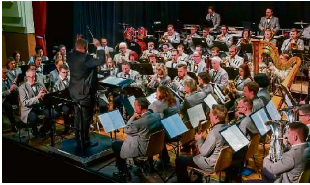
Die Stadtkapelle Seligenstadt mit insgesamt 121 Musikern konzertierte vor einem ausverkauften Riesensaal.

Klein-Krotzenburg (beko) – Adventsmarkt im Simeonstift am Triebweg 36 in Klein-Krotzenburg ist am Samstag, 30. November, ab 14 Uhr. Weitere Termine im Advent finden unsere Leser auf Seite 6.