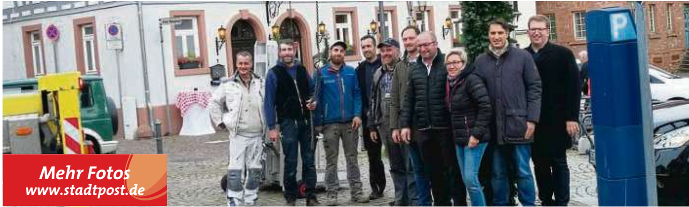
Mehr Fotos www.stadtpost.de

Eine Sammlausgabe mit Infos aus der ganzen Region erscheint am 1. Januar. Das nächste Heimatblatt dann am 8. Januar. Redaktionsschluss freitags, 10 Uhr.