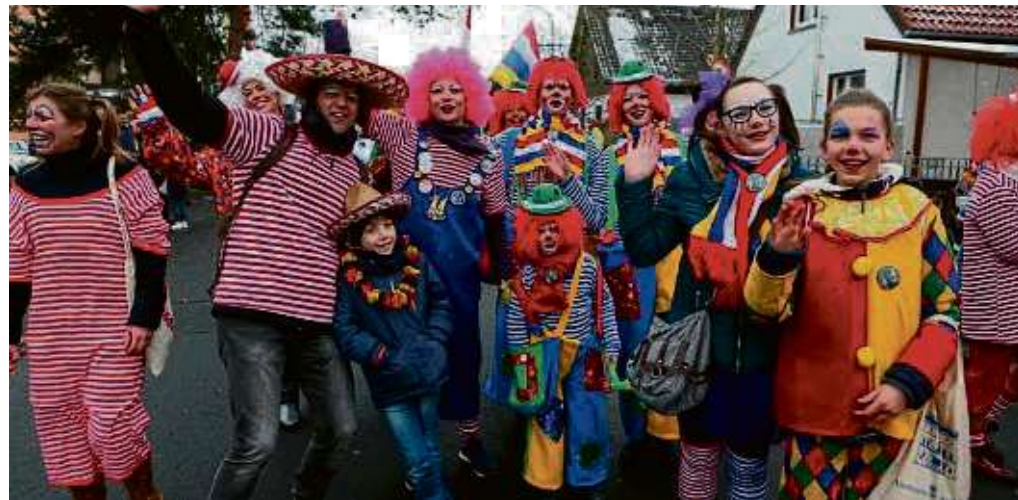
Viele närrische Gruppen sollen wieder mit dabei sein beim Kinderfastnachtzug in Hainstadt. Schon jetzt kann man sich online für den 16. Februar dazu anmelden.

Die Einnahmen kommen – aus den Sammeldosen und der Bewirtung bei der Sonnenapotheke und bei der Feuerwehr Hainstadt – Kindern und Jugendlichen aus der Region zu Gute. Der Kinderfastnachtzug