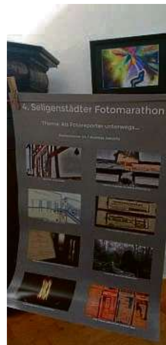
Die Gewinner-Collage von Andreas Jakobitz.