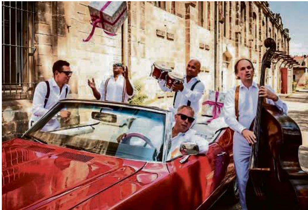
Zu seinem vorweihnachtlichen Konzert lädt das Kunstforum Seligenstadt für Freitag, 6. Dezember, um 20 Uhr (Einlass 19 Uhr) in die Kirche St. Marien in Seligenstadt ein. Zu Gast ist diesmal die Formation „Klazz Brothers & Cuba Percussion“, die musikalische Grenzen mit Leichtigkeit aushebelt. Mit seinem neuen Programm „Christmas meets Cuba 2“ erweckt das Quintett internationale und deutsche Weihnachtslieder zu neuem Leben. Mehr dazu online.