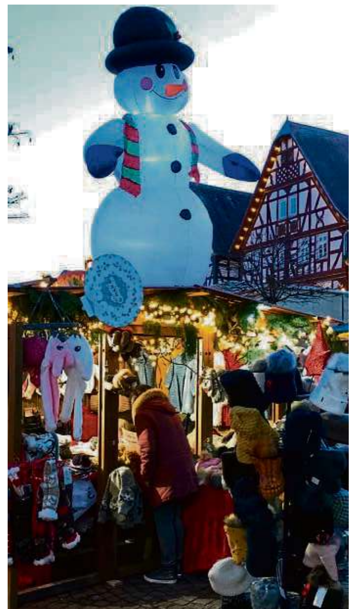
Warm anziehen scheint angesagt zu sein, zumindest ab Ende der Woche, Schnee fällt eher weniger, auch beim Adventsmarkt.