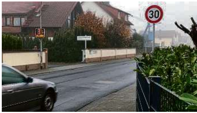
Zwischen Hasenpfad und Jahnstraße ist die zulässige Höchstgeschwindigkeit an der Ellenseestraße auf 30 km/h reduziert.

Waldweihnacht für Samstag, 7. Dezember, terminiert und - vorausgesetzt Petrus spielt mit - wird es einige neue Attraktionen geben. Von 11 bis 16 Uhr bieten rund 15 Vereine und Institutionen selbst gemachte Waren und Köstlichkeiten an. > Seit wenigen Tagen ist die zulässige Höchstgeschwindigkeit an der Ellenseestraße zwischen dem Hasenpfad und der Jahnstraße auf 30 km/h reduziert. > Für Mittwoch, 11. Dezember, laden die Stadt Seligenstadt und die Senio-