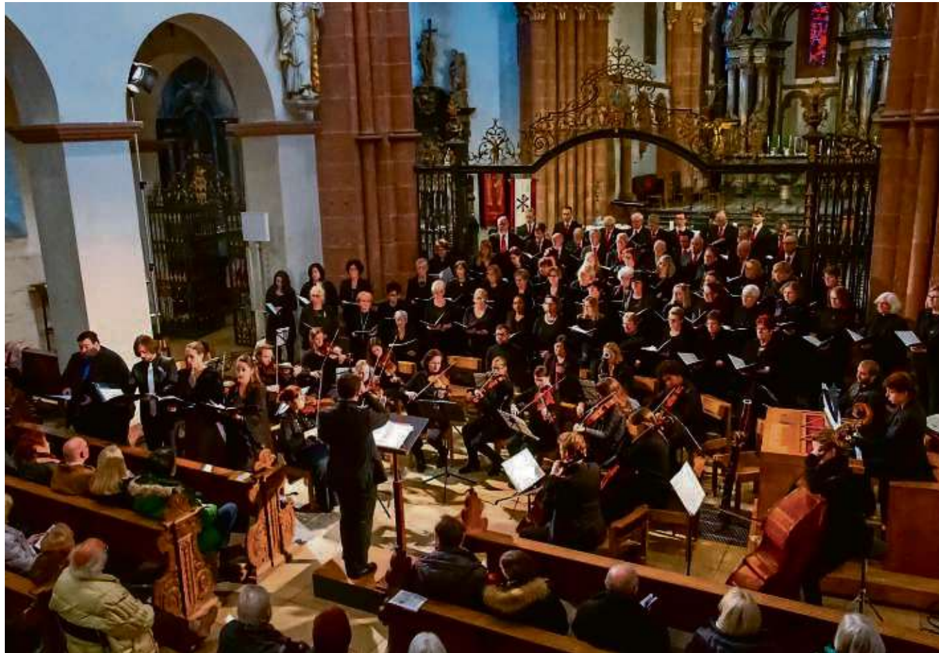
170 Jahre Chor an der Basilika: Zu einem solchen „Geburtstag“ gehört ein Konzert mit einem Schwergewicht der Kirchenmusikliteratur. So war die Wahl auf die Messe C-Dur KV 317 von Wolfgang Amadeus Mozart gefallen, die als die stärkste seiner Salzburger Messen gilt. Bekannt ist das Werk allgemein als „Krönungsmesse“, wobei die Bezeichnung aber nicht von Mozart stammt. Bericht folgt.

tags von 12 bis 20 Uhr. Zeit, Angebote zu studieren, Geschenke zu kaufen, zu schlemmen, zu bummeln und zu genießen. Offizieller Startschuss ist morgen um 18 Uhr auf dem Marktplatz mit einer inzwischen gut angenommenen Verkaufsaktion: Zehn Meter Christstollen stiften die Bäckereien Haas, Löwer, Mayer und Nitschke. Der Erlös wird den Kindergärten von St. Marien und Basilika-Pfarrei als Gutschein für die örtlichen Buchhandlungen weitergegeben. Viele Attraktionen sind geplant, ausführliche Informationen im Internet auf www.unser-seligenstadt.de