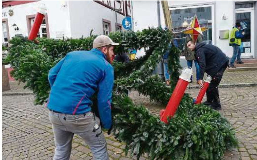
Der Stern ist dran, die Kerzen okay, jetzt kann er hoch gehievt werden, der Adventskranz 2019 auf dem Freihofplatz in Seligenstadt.