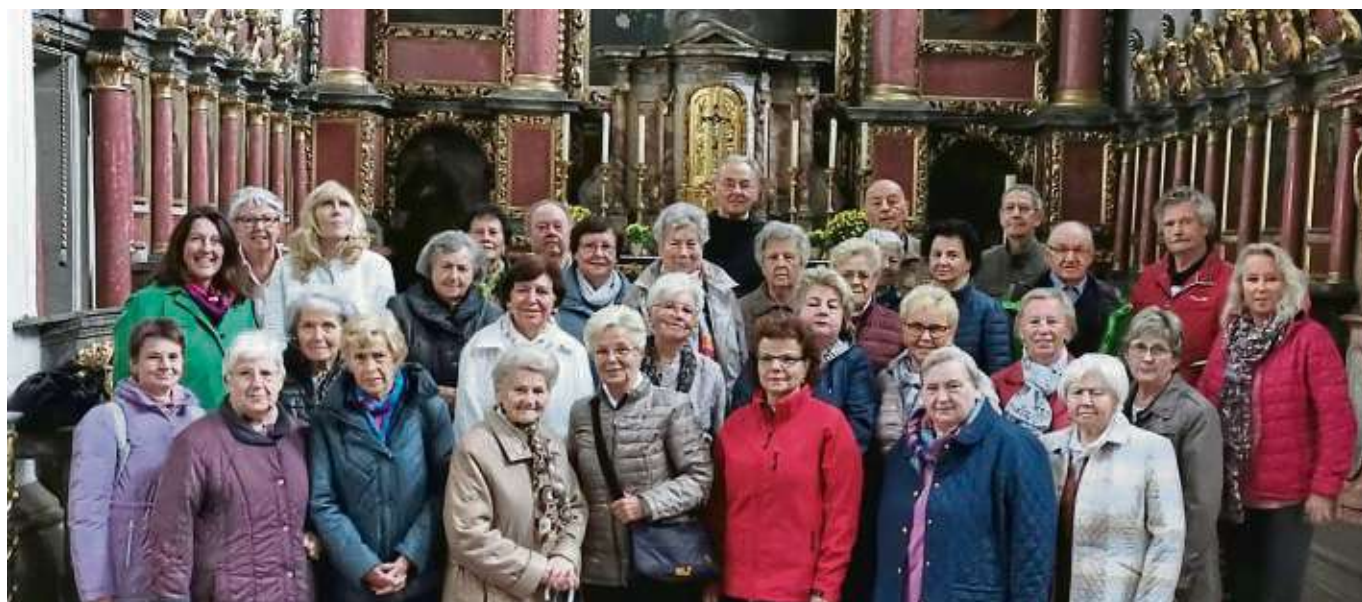
Eine Fahrt zum Franziskaner-Minoriten-Kloster Schönau an der fränkischen Saale unternahm die Wallfahrtsvereinigung St. Cyriakus Klein-Welzheim. In der dortigen Wallfahrtskirche wurde ein Gottesdienst mit dem Guardian Pater Leo gefeiert, der seine Gäste anschließend mit einer sehr lebendigen und interessanten Kirchenführung erfreute. Als Besonderheit konnte eine spätgotische Figurengruppe aus der Werkstatt Tilman Riemenschneiders im ehemaligen Sommerchor bewundert werden. Nach einer Stärkung und Rundgang in Gemüden am Main besuchte die Wallfahrtsgruppe am Nachmittag das romantische Städtchen Hammelburg, älteste Weinstadt Frankens, durch die auch der fränkische Marienweg verläuft.

Gewerbliche Anzeigenannahme Kevin Demuth, ☎ 06182 929833 E-Mail: kevin.demuth@op-online.de Helmut Adam, ☎ 929832 E-Mail: helmut.adam@op-online.de Annalena Müller, ☎ 929834 E-Mail: annalena.mueller@op-online.de