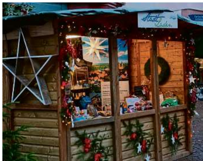
Auch der Stadtladen ist wieder mit einer Bude vertreten beim Adventsmarkt im Städtchen.

Ostkreis (beko/red) – „Umfangreiche Durchsuchungsmaßnahmen“ unter Federführung der Staatsanwaltschaft Darmstadt gab es am gestrigen Dienstag in Froschhausen. Gegen Abend war klar: Ermittlungserfolg gegen mutmaßliche Drogenhändler in Seligenstadt, Hainburg und Hanau. Mehrere Straßen waren zudem gesperrt, so dass sich Rückstaus bildeten. Ermittelt wurde wegen des „Verdachts des Betäubungsmittelhandels in nicht geringen Mengen“ - zu deutsch: Der Polizei - mit 250 Beamten im Einsatz - ist ein Schlag gegen Drogenhändler gelungen. 30 Festnahmen gab es in 40 Objekten. Ausführliche und aktuelle Informationen dazu heute in der Offenbach-Post sowie unter www.op-online.de