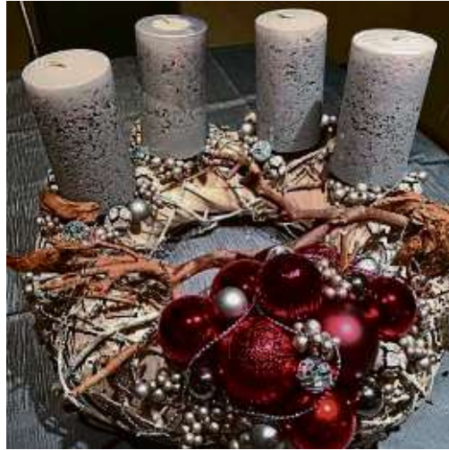
Der Adventskranz daheim steht auf dem Tisch, am Sonntag wird die erste Kerze entzündet.

> Der Lebendige Adventskalender ist für Donnerstag, 12. und 19. Dezember, jeweils von 18 Uhr bis etwa 19 Uhr. Treffpunkt ist immer das Kirchen-Hauptportal von Sankt Margareta