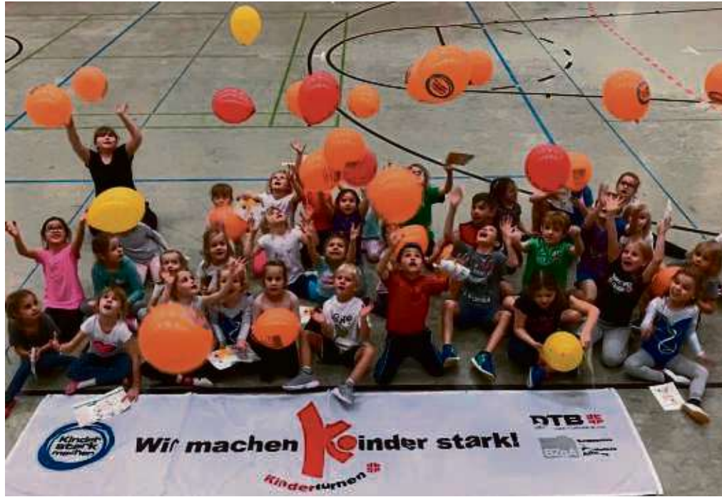
„Spaß und Freude an der Bewegung für Alle“ lautete das Motto beim „Tag des Kinderturnens“. Um die 40 Kinder fanden drei Stunden lang Spaß an der Bewegung.

Redaktionsschluss für die darauffolgende Ausgabe ist dann am Freitag, 3. Januar, 10 Uhr.