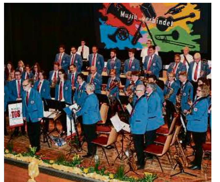
„Musik verbindet“ und das macht das TGS-Musikcorps Seligenstadt immer wieder deutlich.