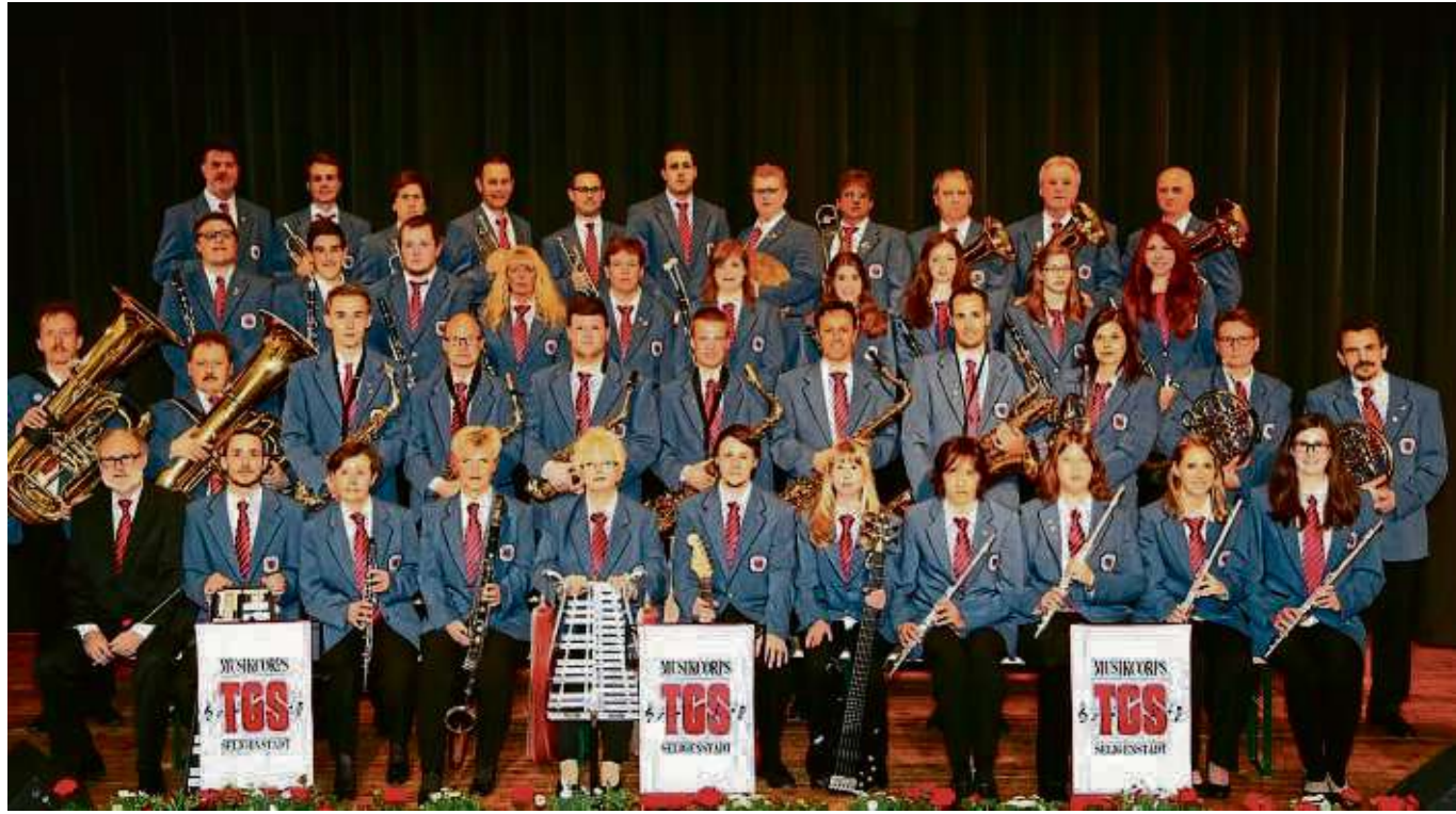
„Music is my first love“ – Treffender könnte man das Musikcorps der Turngesellschaft 1895 Seligenstadt nicht beschreiben. Heute stellt das Heimatblatt diese Ehrenamtler vor.