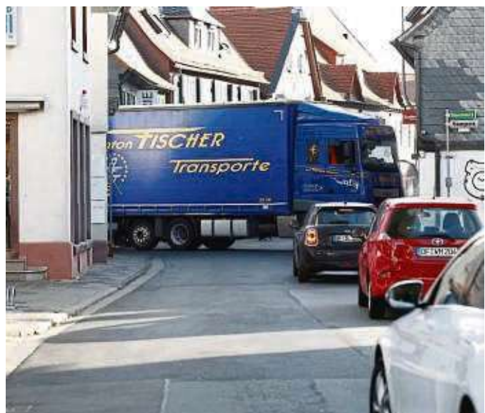
Sorgen immer wieder für knifflige Situationen in der Seligenstädter Altstadt: Große Transporter wie hier an der Ecke Wallstraße / Frankfurter Straße.

und Blutvergiftung“ mit. Pfarrer Seebacher notiert in Latein: „in der Heil- und Pflegeanstalt Hadamar aufgrund einer neuen Gesetzeslage der NSDAP ermordet worden und verbrannt, Asche in das Grab seines Vaters in einer Urne am 16.4.1941.“ Auf Initiative des Arbeitskreises Ehemalige Synagoge Klein-Krotzenburg wird am 19. Dezember Gunther Demmig in Hainburg für fünf Hainburger Opfer der Euthanasie-Aktion Stolpersteine verlegen, in der Hütten- gasse, Liebfrauenheidestraße, Kanalstraße und Fahrstraße.