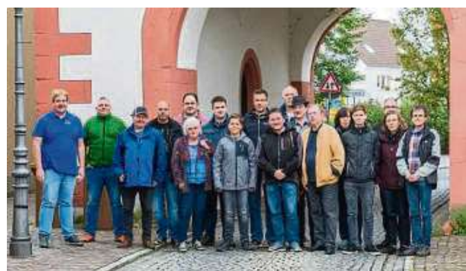
Die erfolgreichen Funker, die nach intensiver Vorbereitung die Prüfung abgelegt haben.

tete die elektrotechnischen Grundlagen zur Amateurfunktechnik, Gesetzeskunde zu den Rechtsgrundlagen des Funkdienstes und dessen Betriebsvorschriften. Das siebenköpfige Ausbilder-Team referierte dazu und führte auch praktische Beispiele direkt am Funkgerät vor. 17 Teilnehmer (drei weibliche und 14 männliche Aspiranten) büffelten den Gesamtstoff in der Zeit vom 7. bis 11. Oktober täglich acht Stunden im Steinheimer Turm. Trotz der teilweise anstrengenden Themen blieb die Stimmung der hoch motivierten Teilnehmergruppe des Intensivkurses stets sehr gut. Nach bestandener Prüfung erhalten die neuen Funkamateure ein individuelles Rufzeichen, das jeweils weltweit einmalig ist.