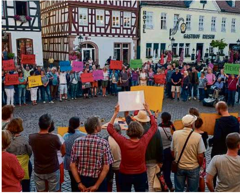
Teilnehmer an der Mahnwache der Seebrücke versammelten sich immer wieder auf dem Marktplatz, um an die Menschlichkeit an Europas Grenzen zu appellieren. Heute findet zum letzten Mal eine solche Mahnwache statt.