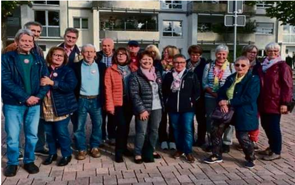
Einen Ausflug nach Groß-Umstadt unternahmen die Mitglieder des Jahrganges 1948/49 aus Klein-Welzheim zum 70-Jährigen. Bei einer Planwagenfahrt mit Weinprobe und Imbiss kam man sich näher und tauschte Erinnerungen aus, da viele Teilnehmer sich seit Jahren nicht mehr gesehen hatten.