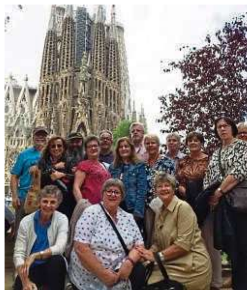
Der Jahrgang 1954/55 nach dem Besuch der Sagrada Família.

ein Schaumwein und eine der bekanntesten Spezialitäten Kataloniens. Für die Sagrada Família, dem Wahrzeichen Barcelonas, war nächsten Tag eine deutschsprachige Führung organisiert, so dass der Gruppe ohne Wartezeit Einlass gewährt wurde. Ist dieses Bauwerk, auch wenn es bis heute noch nicht komplett fertiggestellt ist, bereits von außen mehr als nur imposant, so war der Eindruck von innen einfach unbeschreiblich und hinterlässt eine bleibende Erinnerung. Wenn auch zu den „Stadtbesichtigungen“ teilweise öffentliche Verkehrsmittel benutzt wurden, belegten zwei entsprechende Apps eine von der Gruppe