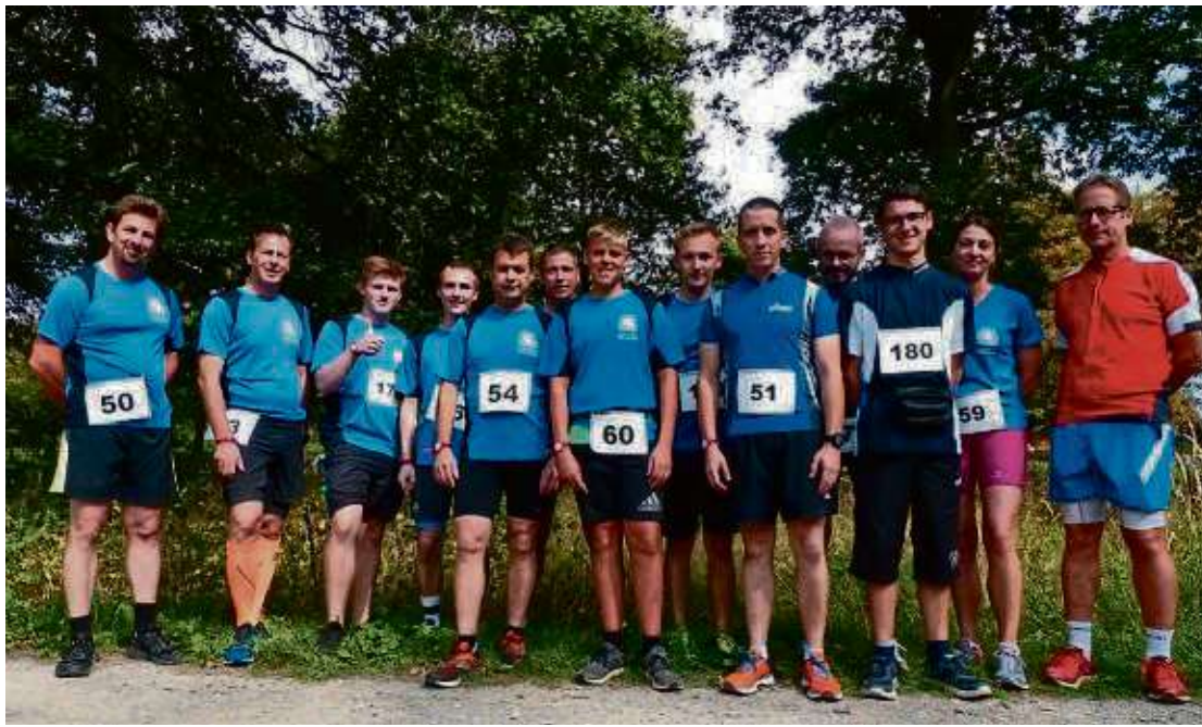
Und wieder holte die Freiwillige Feuerwehr Hainstadt deutsche Meistertitel in den Ostkreis. Als teilnehmertestärkstes Team wurde die Truppe bereits zum 18. Mal ausgezeichnet.

sich immerhin den Titel „Schnellste Freiwillige Feuerwehr“. Den Titel als Deutscher Meister für die teilnehmertestärkste Mannschaft holte das Team nunmehr zum 18. Mal nach Hainstadt. Darüber hinaus erzielten die Teilnehmer viele gute Platzierungen in den verschiedenen Altersklassen. Der Feuerwehrlauf-Cup motiviert die Feuerwehrläufer zu sportlicher Fitness und fördert bei aller Konkurrenz die Kameradschaft.