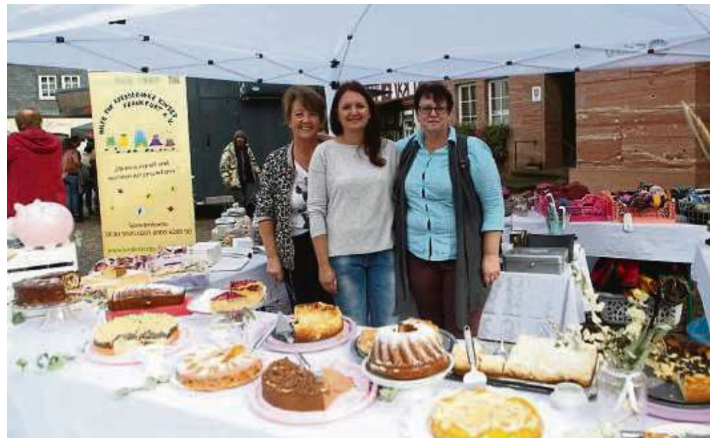
Neben Mini-Donuts, Crepes oder deftigen Leckereien gab es auch jede Menge Auswahl an Kuchen. Der Erlös dieses Standes kam der „Hilfe für krebserkrankte Kinder“ zugute.