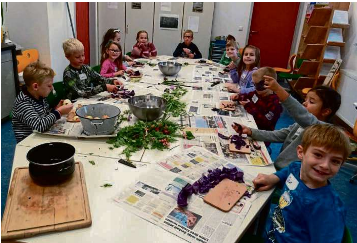
Viel gebastelt, gemalt und zusammen gespielt wurde bei der Ferienbetreuung in der Mainflinger „Schülerburg“ während der Herbstferien.