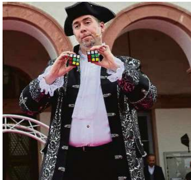
Hochzeitszauberer „AbraXas“ brachte die versammelten Besucher mit seinen Tricks zum Staunen.