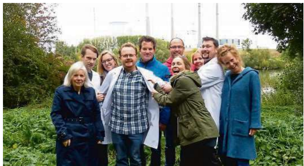
Das Theaterensemble des Kunstforums bereitet sich unter Leitung von Regisseurin Tanja Garlt auf die Komödie „Die Physiker“ vor.

in eine Psychiatrie einweisen. Geheimdienste sind ihm dabei dicht auf den Fersen. Der Eintritt liegt bei 15 Euro, ermäßigt (Schüler, Studenten, Schwerbehinderte und Kunstforum-Mitglieder) bei acht Euro. An der Abendkasse gibt es einen Aufschlag von zwei Euro. Schulklassen bezahlen fünf Euro pro Person. KulturCard-Inhaber bekommen darüber hinaus an der Abendkasse zwei Euro zurück. Tickets gibt es bei den Vorverkaufsstellen Tourist-Info, den Buchhandlungen der buchladen und geschichten*reich, der Bücherstube Klingler, Das Ladsche und der Jügesheimer Bücherstube. Auch online können Karten erworben werden unter www.kunstforum-seligenstadt.de .