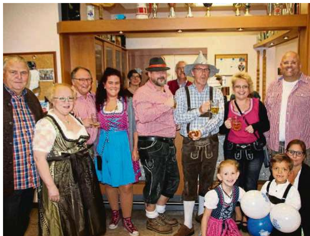
Zum ersten Mal rief der Volkschor zur Teilnahme an seinem Oktoberfest auf und die Teilnehmenden konnten bei bayerischer Musik, Bretzeln, Würstchen und Bier einige schöne Stunden erleben. Mit viel Liebe haben die Verantwortlichen das Vereinsheim in blau-weiß geschmückt. Jeder war in Tracht gekommen und konnte zu später Stunde gar auf den Tischen tanzen.

Seligenstadt (zki) – Die Stadtkapelle Seligenstadt lädt zum Jahreskonzert ein. Es findet am Abend vor dem Ewigkeitssonntag, 23. November, ab 19.30 Uhr im Riesensaal statt und bietet ein abwechslungsreiches Programm. Saalöffnung ist ab 18.30 Uhr. Karten gibt es zum Preis von 15 Euro bei Zabos Werkstatt und allen aktiven Musikern.