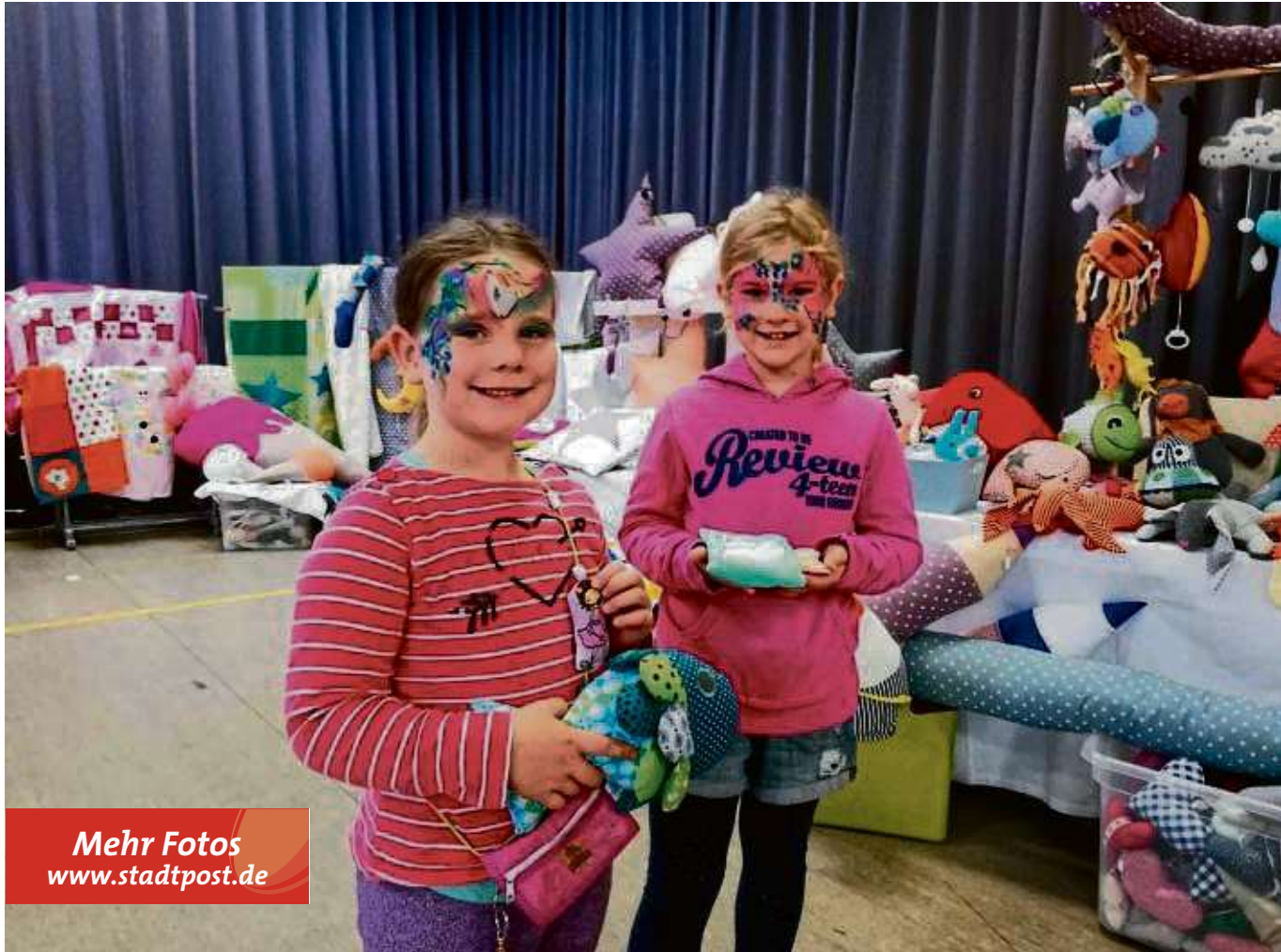
Mehr Fotos www.stadtpost.de

Bunt war nicht nur das Angebot der verschiedenen Stände, sondern auch einige kleinere Besucher, die sich passend zum Kreativmarkt schminken lassen konnten.