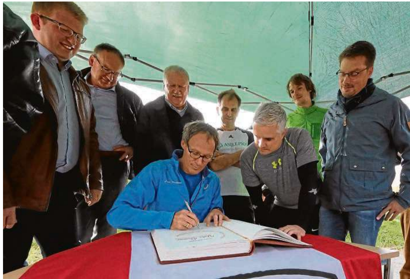
Der frühere Weltklasse-Leichtathlet und Olympiasieger Dieter Baumann trug sich vor Ort in das Goldene Buch der Stadt Seligenstadt ein, um dann mit der ersten Laufrunde die Strecke einzuweihen.