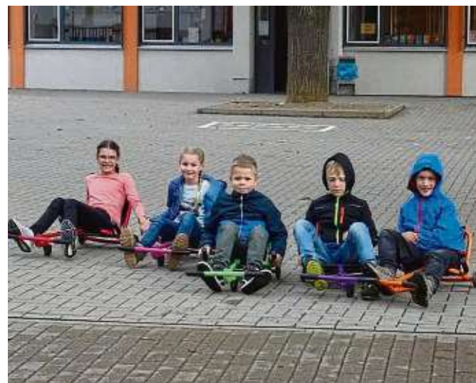
Viel Freude hatten die Kinder bei der Ferienbetreuung der Mainflinger „Schülerburg“. Mehr auf Seite 11.