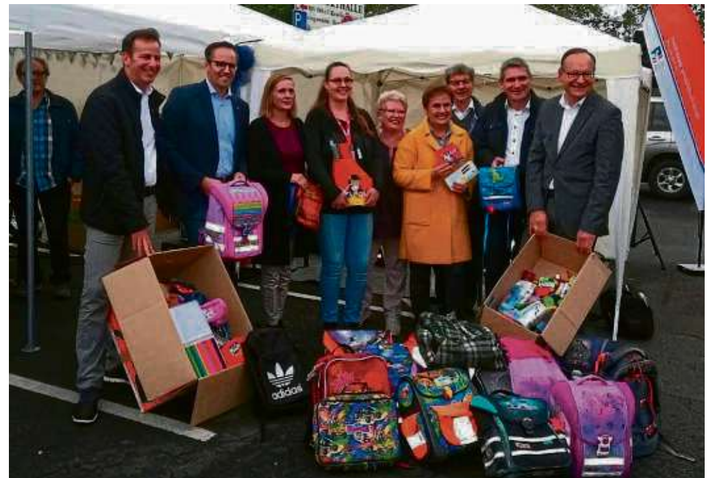
Fast sieht es so aus, als müssten sie noch einmal die Schulbank drücken, dabei nehmen die Vertreter nur an der Übergabe der Materialien teil.

Vom 26. - 29.10.2019 jeweils ab 9.00 Uhr großer Krämermarkt in den Straßen von Ortenberg. Landmaschinen- und Fahrzeugausstellung im Ausstellungsgelände sowie 55. Kalter Markt Leistungsschau im Ausstellungszelt. Großer Vergnügungspark auf dem Marktplatz. Außerdem finden Sie Weiteres im Internet unter www.Kalter-Markt.de