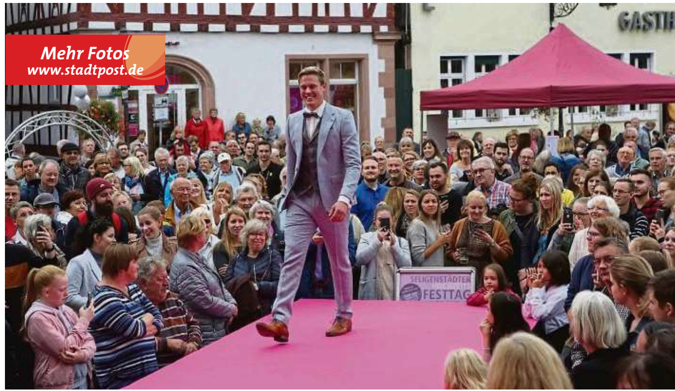
Nicht nur die weiblichen Besucher kamen auf ihre Kosten: Neben den prächtigen Hochzeitskleidern für Frauen präsentiert hier Model Hagen zur Abwechslung auch Hochzeitsmode für Männer.