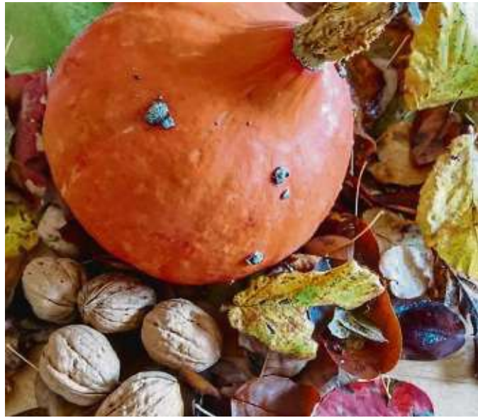
„Herbstliche Stimmung in Seligenstadt“ ist das Motto beim Heimatbund.

Seligenstadt (red) – Der Wettbewerb zur Stadtverschönerung unter dem Motto „Herbstliche Stimmung in Seligenstadt“ läuft noch bis 30. November. Wer teilnehmen möchte, reiche im Wettbewerbszeitraum die schönsten Impressionen der selbstgestalteten Objekte - Gärten, Höfe, Fassaden und Anwesen in der Kernstadt, sofern sie frei zugänglich und einsehbar sind - als Digitalfoto in ausreichender Auflösung per Mail unter stadtverschoenung@heimatbund-seligenstadt.de ein. „Wir freuen uns auf Ihre facettenrei-