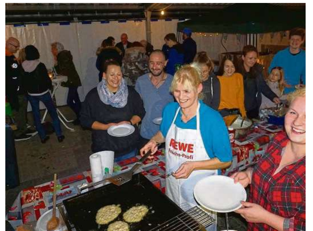
„Auf geht's zur siebten Kartoffelfete!“ Ein Fest rund um die „dolle Knolle“ feierte wieder die Freie Turnerschaft Hainstadt auf dem Vereinsgelände am Katzenfeld. Die Mitglieder boten selbst gemachte Kartoffelpfannkuchen, Kartoffelsuppe mit Würstchen, Folienkartoffeln mit Dip und ein Dessert mit Sahne an. Zur späteren Stunde öffnete die Cocktailbar und ein DJ sorgte mit Partymusik für Stimmung.

Klein-Welzheim (zki) – In die Sternwarte des Adolph-Reichwein Gymnasiums nach Heusenstamm fährt die Kolpingfamilie am Freitag, 25. Oktober, um einen Blick in das Universum zu werfen. Die Besichtigung findet bei jedem Wetter statt, bei schlechten Bedingungen gibt es einen Bildervortrag. Abfahrt ist um 18.15 Uhr an der Kirche in Klein-Welzheim, Besichtigung und Sternengucken ab 19 Uhr. Nach der Veranstaltung ist ein Imbiss vorgesehen. Ankunft in Klein-Welzheim gegen 21.45 Uhr. Es gibt eine begrenzte Teilnehmerzahl, die Kosten sind zehn Euro pro Person, die im Bus bezahlt werden. Anmeldung bei Irene Sommer ☎ 200324.