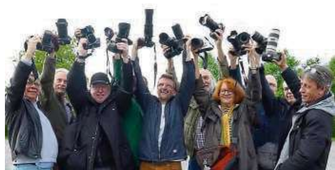
Auf den Auslöser. Fertig. Los! Hobbyfotografen sind eingeladen zum Blind Date am Sonntag.

Teilnehmer ihre vier Lieblingsbilder als Datei von der Speicherkarte an die Veranstalter ab. Diese Fotos werden gedruckt und ab 16 Uhr vorgestellt und bewertet. Die besten Fotos werden mit kleinen Preisen prämiert. Das Blind Date zählt zu den Sonderveranstaltungen der Fotofreunde Seligenstadt im Rahmen ihrer Jahresausstellung. Die Teilnahme ist kostenlos. Eine Anmeldung ist nicht erforderlich.