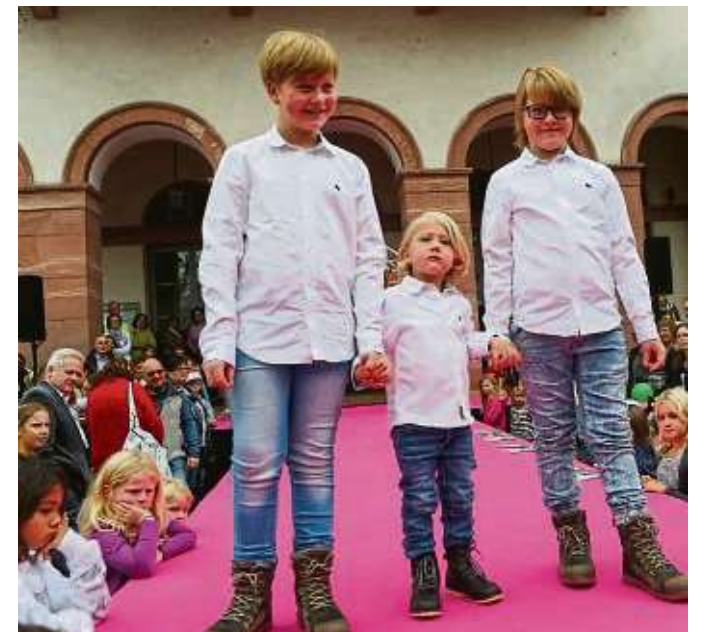
Diese drei Jungs wissen, wie man posiert: Körperspannung vom Kopf bis in die Fußspitze, da stimmt einfach alles!