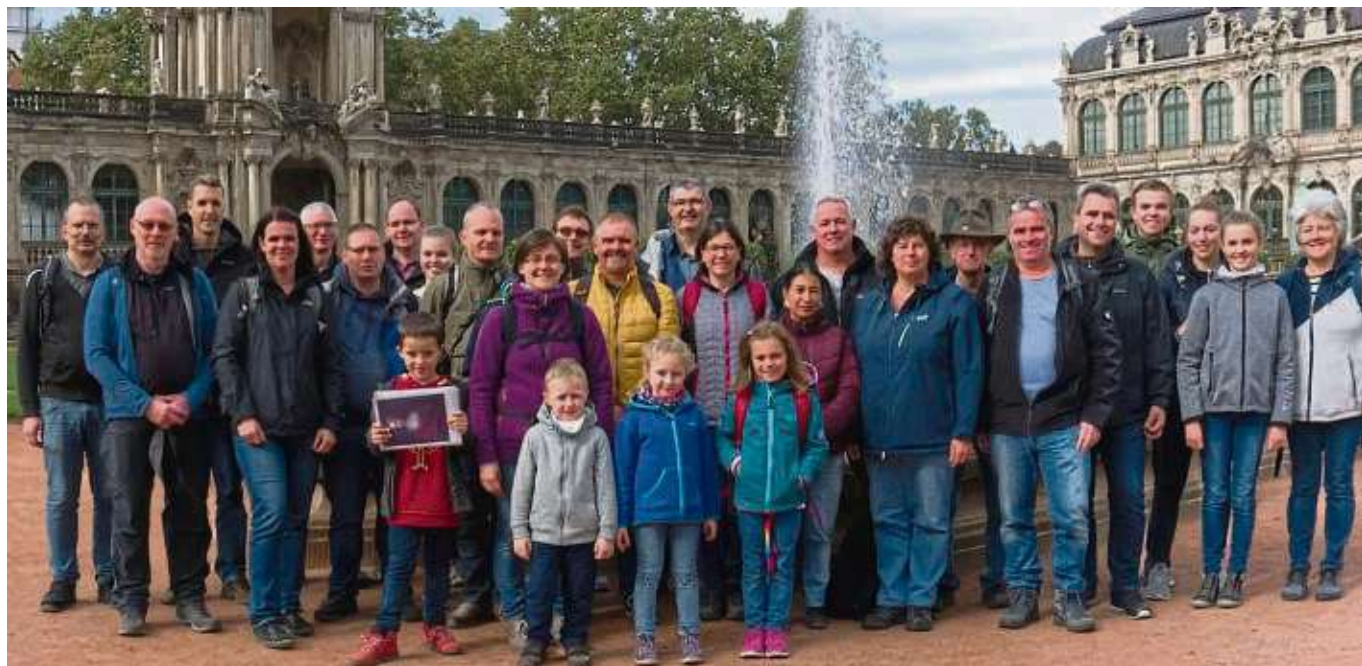
Zu einer Familien-Herbstfreizeit bricht eine Gruppe der Freiwilligen Feuerwehr Klein-Krotzenburg alle zwei Jahre auf. Diesmal ging es für die 30 Teilnehmer in das Dörfchen Hohnstein bei Dresden. In einem Selbstversorgerhaus bezog die Reisegruppe Quartier und spielte, bastelte und kochte gemeinsam. Darunter befanden sich auch ab und zu wahre DDR-Klassiker, wie Würzfleisch oder Wurstgulasch. Mehrere Ausflüge und Wanderungen führten die Gruppe ins Elbsandsteingebirge und natürlich nach Dresden selbst, wo der Zwinger, die Semperoper, die Frauenkirche, das Residenzschloss, die Hofkirche und viele andere Sehenswürdigkeiten in Augenschein genommen wurden. zfk