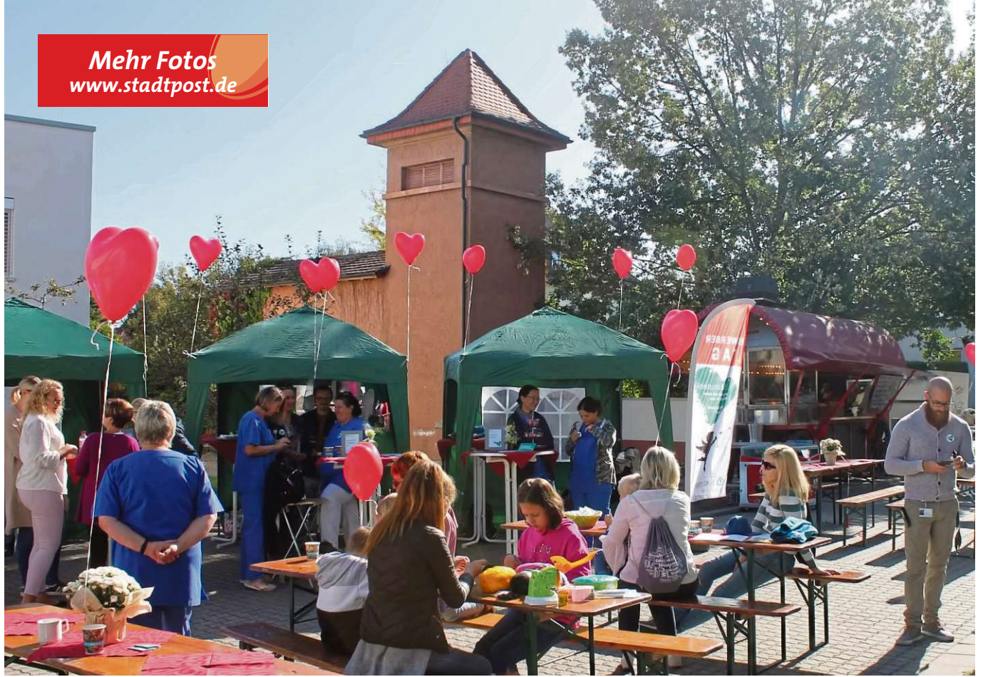
Reger Betrieb beim erstmalig organisierten „Bewerber-Tag“ der Asklepios-Klinik in Seligenstadt: Das schöne Ambiente und die herzliche Fürsorge der Mitarbeiter lockte doch so einige Interessenten in den Innenhof der Einrichtung.

Lesen Sie das Heimatblatt als E-Paper auch mit Bildergalerien auf www.stadtpost.de