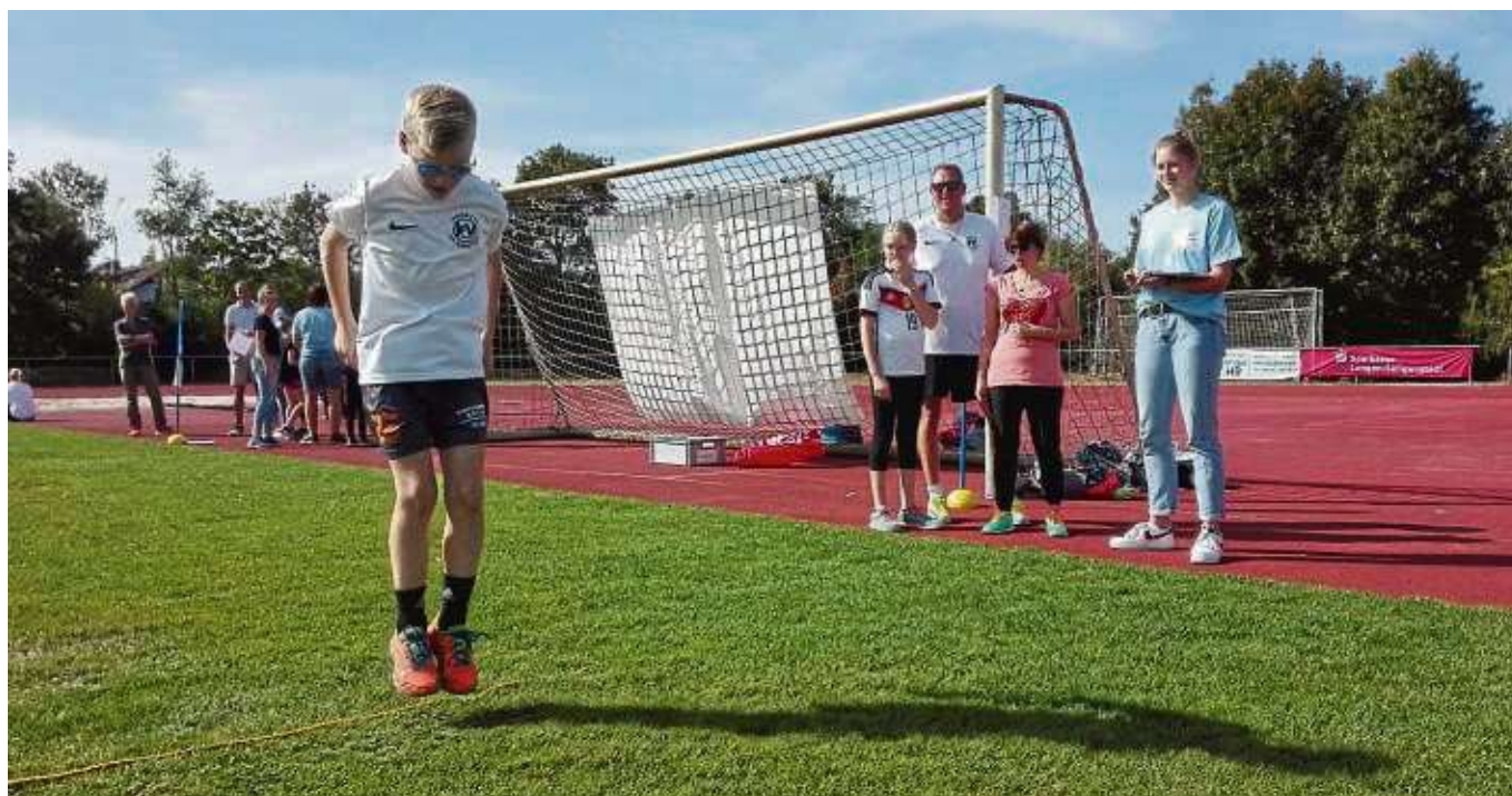
Die zweite Disziplin hieß „Känguru, hüpf!“, bei dem die Mitglieder der Teams nacheinander eine Minute Zeit hatten, über ein Seil auf dem Boden hin und wieder zurück zu springen.

Runde der Ball an die nächste Person weitergegeben. Das Ziel ist es, nach zwei Minuten möglichst selten den Ball fallen zu lassen. Bei den „Big Games“ wurde natürlich auch für Verpflegung gesorgt mit Kaffee und Kuchen. Wer wollte, konnte zudem auch ganz normale Kinderleichtathletik-Disziplinen ausprobieren.