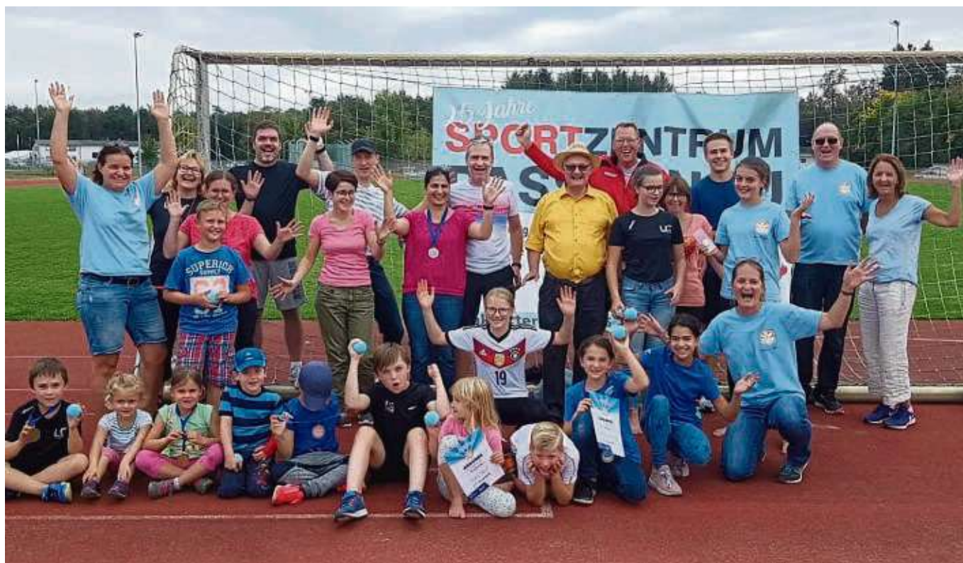
An der Aktion „Big Family Games“ beteiligte sich auch die LG Seligenstadt auf dem Gelände des städtischen Stadions und viele Familien starteten aktiv in verschiedenen Disziplinen.