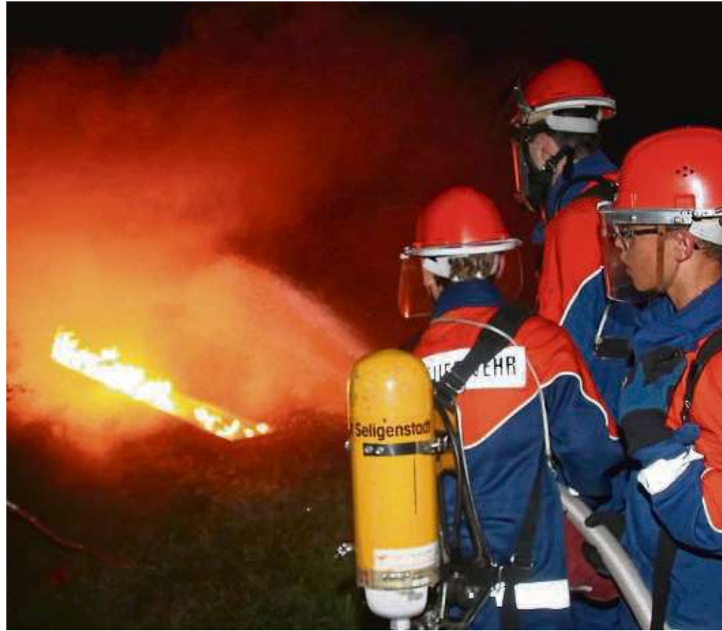
Spektakulärer Grillunfall: Brandbekämpfung und medizinische Versorgung lernen die Nachwuchs-Feuerwehrleute bei der Übung.