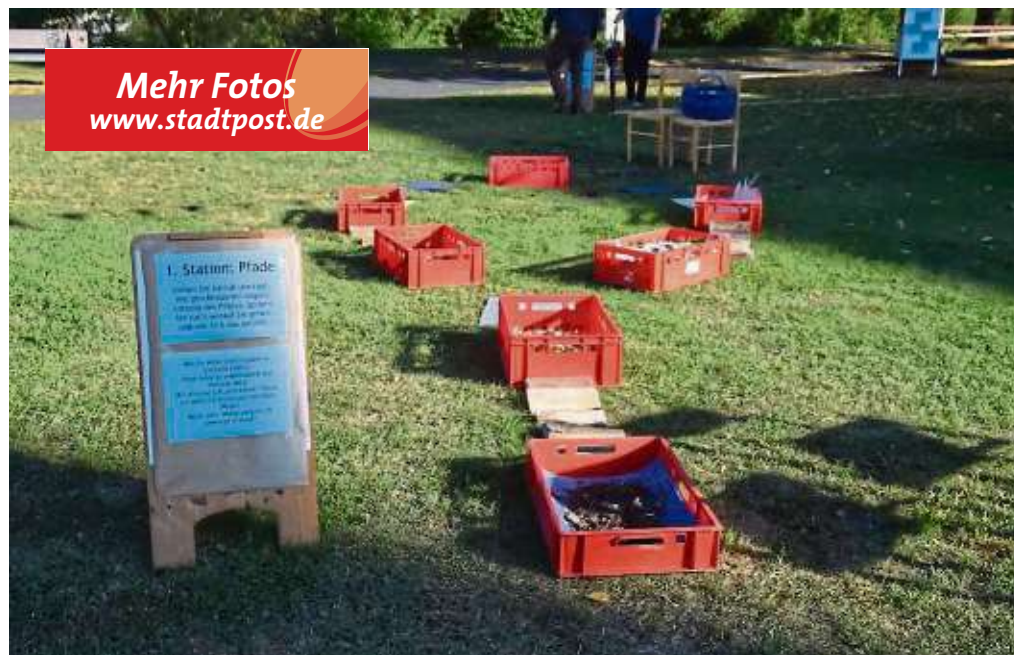
Verschiedene Stationen waren aufgebaut im Anschluss an den Eröffnungsgottesdienst in Mainflingen, auch ein Barfußpfad gehörte dazu.

ren waren verteilt als Zeichen, sich auf den Weg zu machen. Auf kleine Füße konnte geschrieben werden, was bewegt hat oder wo jemand von einer Person bewegt worden ist. Im Anschluss an den Eröffnungsgottesdienst gab es in und um die Kirche herum die Möglichkeit, an einzelnen Stationen bewegt zu sein: Eine Slackline und ein Seil luden zum Balancieren ein, ein Barfußpfad zum Erleben und auch für das leibliche Wohl war gesorgt. Weiter ging es nach Kleinwelzheim, um im atmosphärisch mit Lichteffekten gestalteten Gotteshaus eine Reise durch die Liturgie zu unternehmen. und zu entdecken, wie vielfältig Kirche eigentlich sein kann. In Sankt Cyriakus blickten die Besucher verschiedener Generationen einmal hinter die Kulissen und ließen sich von Pfarrer Stefan Selzer erklären, wie ein Gottesdienst aufgebaut ist und warum jedes einzelne Element wichtig ist. Ging man dann auf Kirchentour weiter nach Seligenstadt in die Evangelische Kirche, konnte man Plakate auf den Kirchenbänken finden. Eine Gruppe Konfirmanden der evangelischen Gemeinde hatte sich mit dem Motto „Wo ist Gott?“ beschäftigt