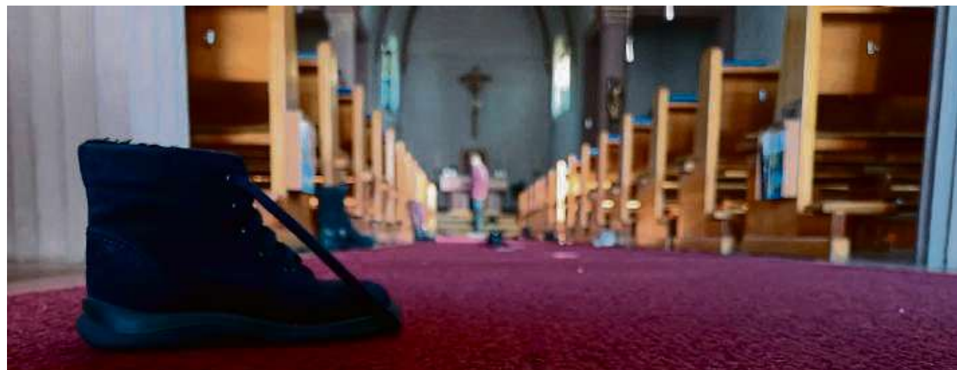
Ein Schuh in der Kirche. Vergessen? Mitnichten! Schuhe und Fußspuren symbolisierten das Motto „Bewegung“ bei der Aktion „Nacht der Kirchen bewegt“ in den Ostkreis-Gemeinden und Steinheim. Mehr auf Seite 9.