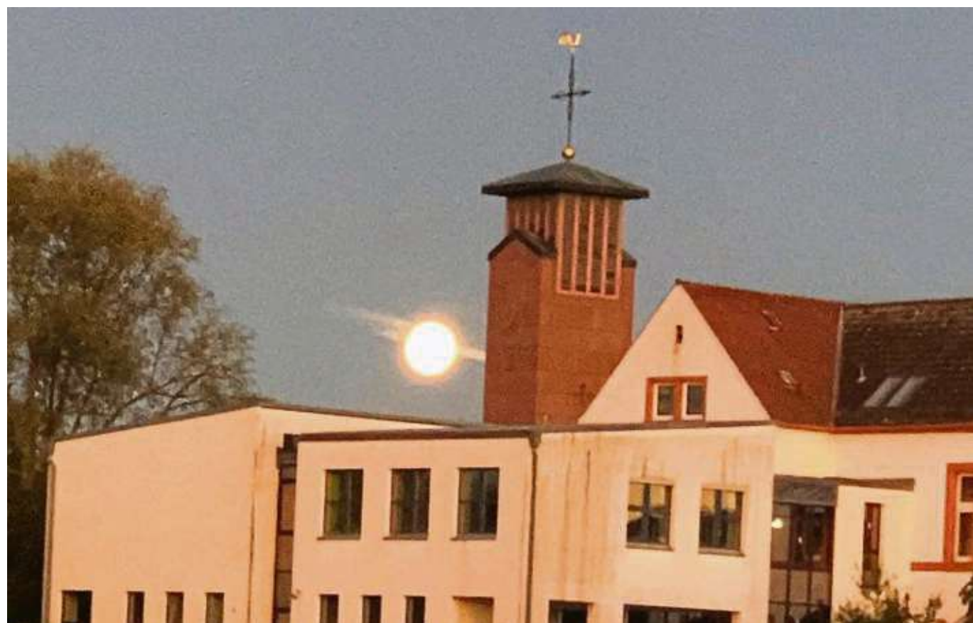
Abendlicher Spaziergang am Mainufer in Klein-Welheim und dann die Smartphone-Kamera dabei haben und beobachten, was sich hinter St. Cyriakus innerhalb weniger Minuten so tut und auf welche Perspektive es ankommt.