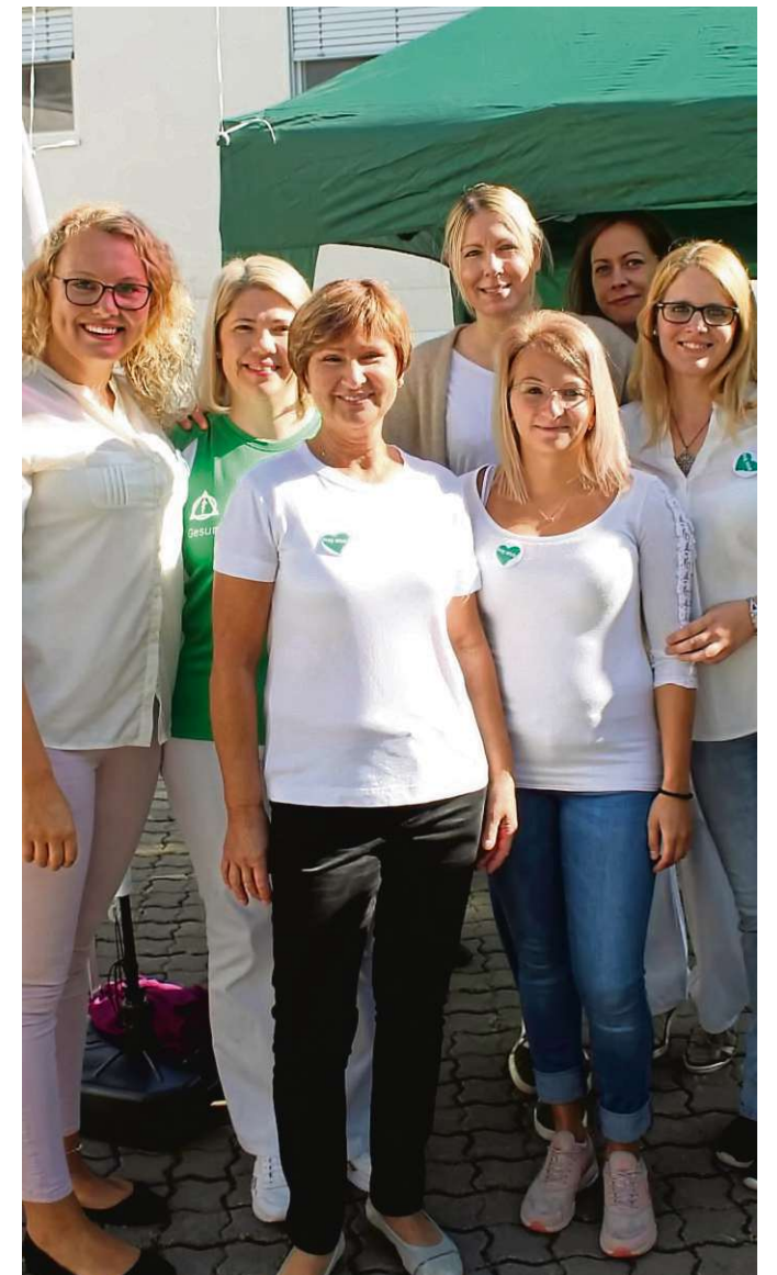
Das Personal verschiedenster Stationen stellte sich vor: Unter anderem die NIG, Geriatrie und Privata.