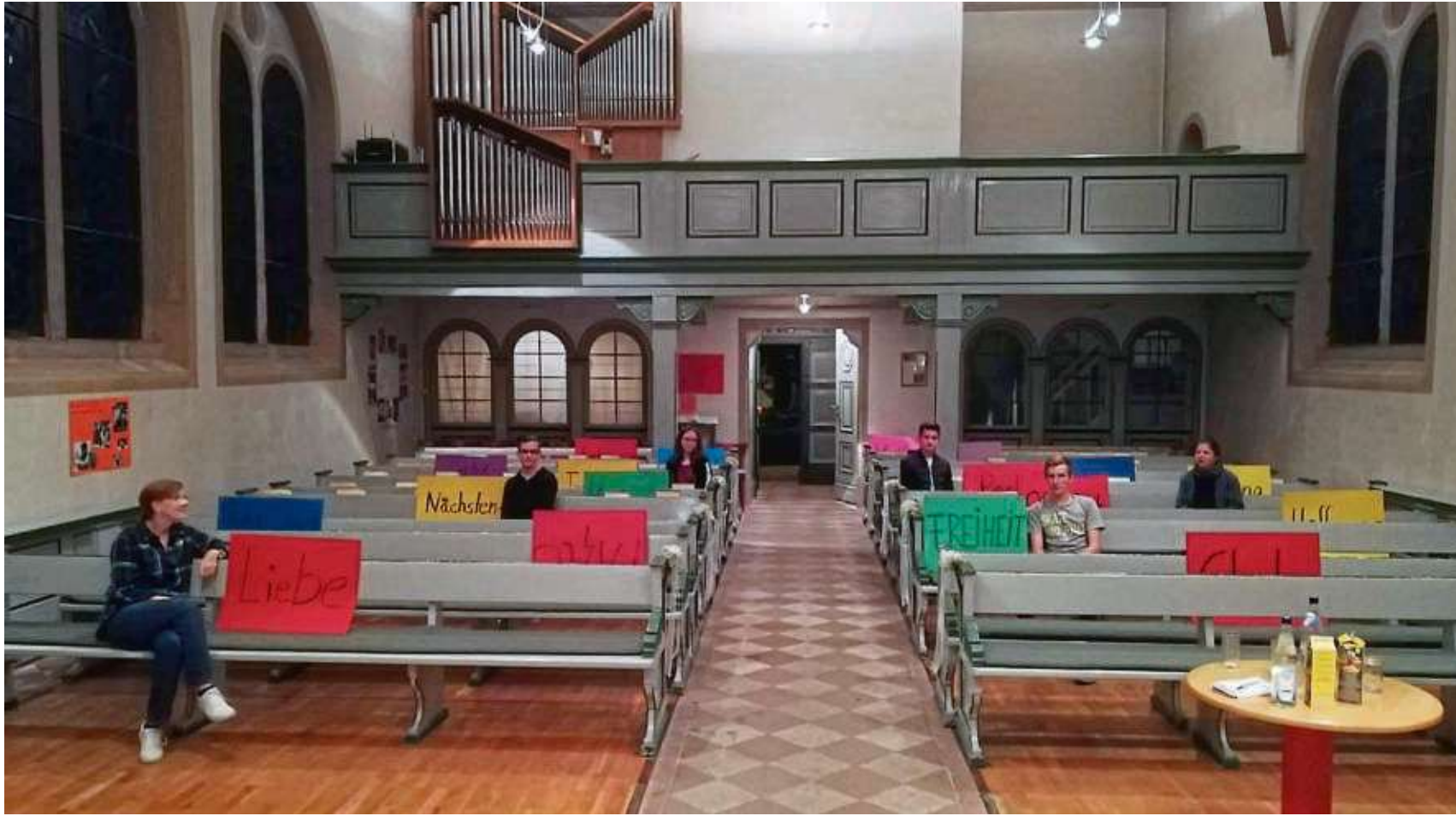
Tapfer haben sich die Konfirmanden der evangelischen Gemeinde in Seligenstadt den ganzen Abend über in der Evangelischen Kirche an der Aschaffener Straße aufgehalten und über ihre Aktion aufgeklärt.