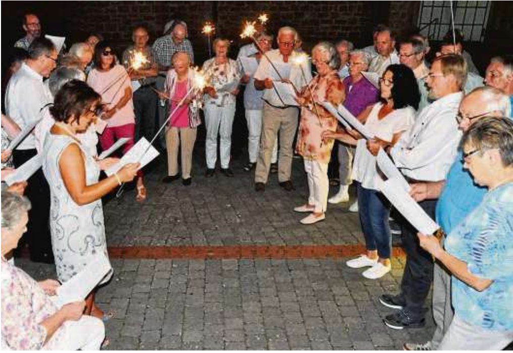
Wunderkerzen wurden beim KAB-Jubiläum zu einem gemeinsamen Abschiedslied vor dem Gemeindezentrum angezündet.