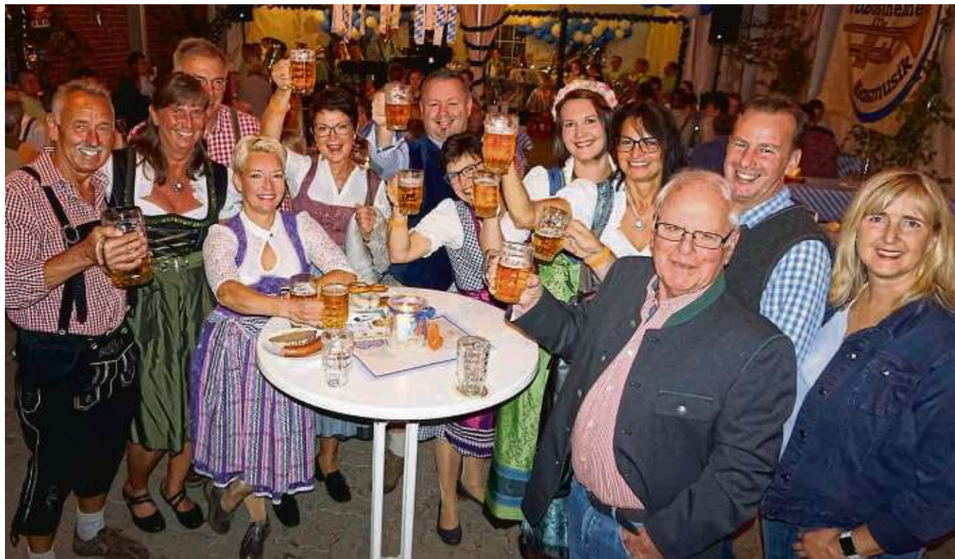
Eine zünftige Hüttenparty mit Barbetrieb veranstaltete am Freitag der Gesangverein Germania Hainstadt im Festzelt am Vereinsheim. DJ „Die Maren“ sorgte bei voller Hütte für gute Stimmung. Am Samstag ging es mit dem Oktoberfest weiter. Da hieß es wieder „O‘ zapft is“. Die Vereinsmitglieder dekorierten das beheizte Zelt in weiß blau und boten bayerische Schmankerl an. Die Musiker der „Großostheimer Blasmusik“ sorgten für ausgelassene Oktoberfest-Atmosphäre.

Klein-Krotzenburg (red) – Zu einer Tagesradtour zum Freizeitzentrum Münster-Breitfeld lädt die Abteilung Radwandern der Radsportvereinigung Klein-Krotzenburg, ein. Start ist am Sonntag, 29. September, um 10 Uhr am Platz der Republik in Klein-Krotzenburg. Zu bewältigen sind insgesamt 50 Kilometer. Am Ziel kehrt die Gruppe in den Biergarten „Auszeit bei Axel“ ein. Nach der Rückkehr soll der Tag in der Vereinsgaststätte ausklingen. Auch Nichtmitglieder sind willkommen. Weitere Infos und Anmeldungen bei Fachwart Dieter Euler, ☎ 06182 68746.