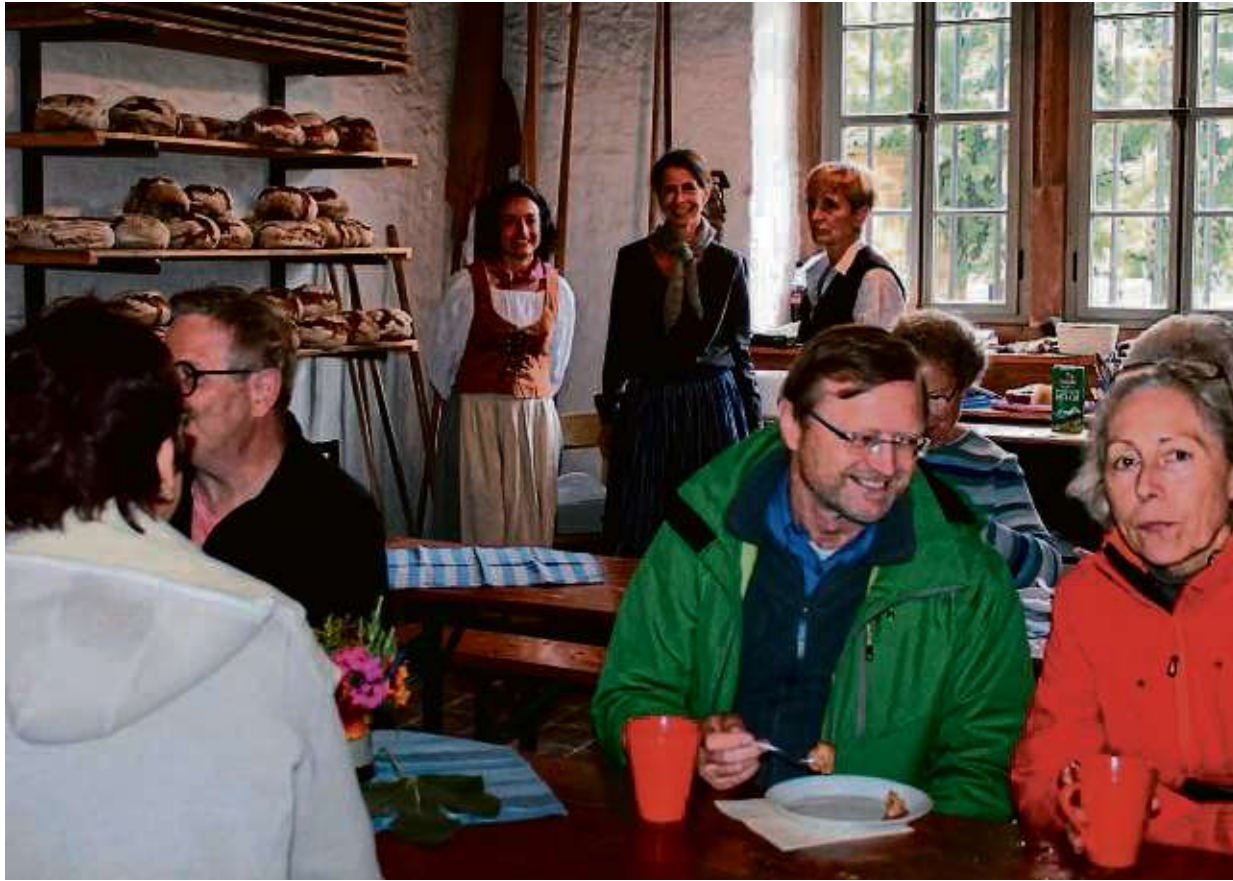
Frisches Brot aus dem Steinbackofen, Kaffee und Kuchen ließen sich die Gäste in der historischen Klostermühle aus dem Jahr 1574 schmecken.