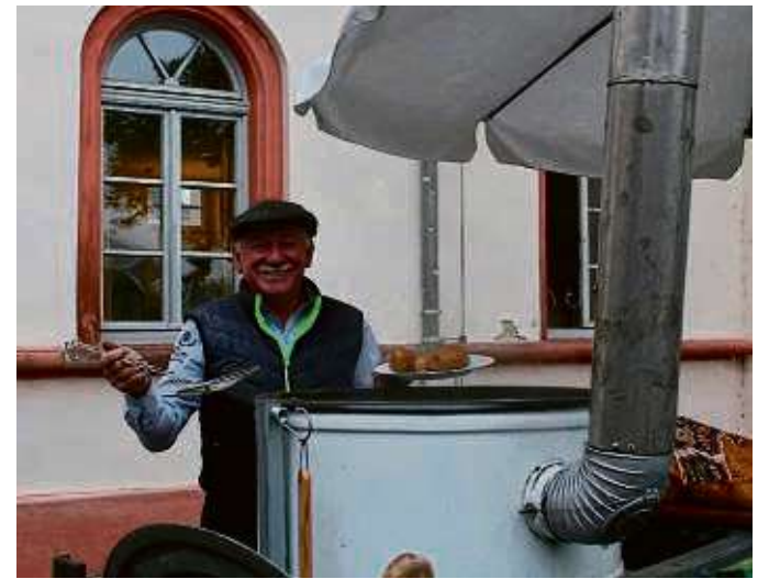
Bewirtung mit „Herzhaftem“ hieß es auf dem Schulhof der Hans-Memling-Schule.