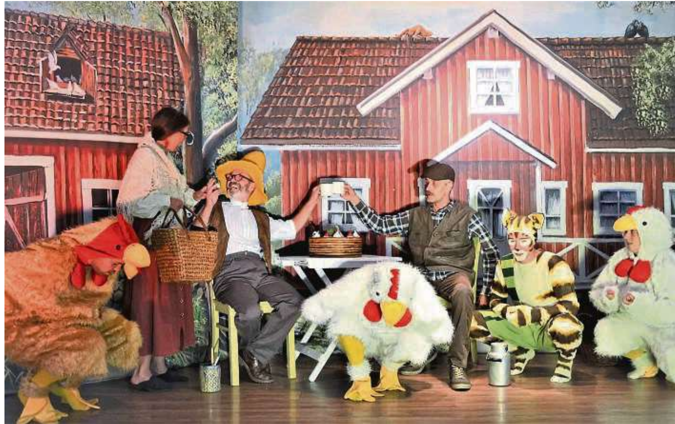
Das KiWi Kindertheater zeigt „Pettersson und Findus-Kleiner Quälgeist, große Freundschaft“ und zwar am Donnerstag, 26. September, ab 16 Uhr, im Riesensaal in Seligenstadt.

tion in der Familie bis 1832. Neben klassischen Märchen spielen die Akteure moderne Stücke wie aktuell „Pettersson und Findus“. Theater ist für uns nicht nur ein Beruf, sondern eine Berufung und unsere Leidenschaft. in allem, was wir machen steckt viel Herzblut. Unsere Kulissen sind von Hand gemalt, Requisiten und Kostüme wurden liebevoll und kindgerecht ausgewählt. Die Redaktion des Heimatblattes verlost drei mal zwei Karten. Was ist zu tun? Bis 14 September eine E-Mail an beko@stadtpost.de mit dem Betreff „Kindertheater“. Gewinner werden benachrichtigt.