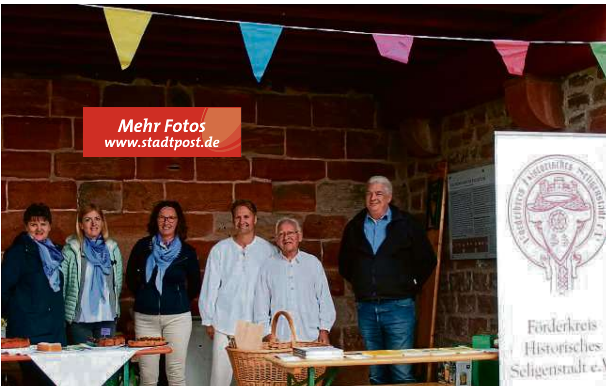
Im Klosterhof war auch der Förderverein Historisches Seligenstadt aktiv während des „Tages des offenen Denkmals“. Die Aktiven sorgten, wie viele andere Gruppen an diesem Tag, auch für das leibliche Wohl der Besucher.