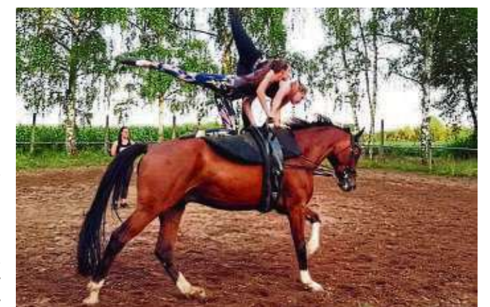
Anlässlich des „Tag des Pferdes“ lädt die Interessengemeinschaft für Pony- und Pferdesport (IPPF) für Sonntag, 15. September, ab 11 Uhr auf ihr Vereinsgelände „Am Fasanengarten“ in Klein-Krotzenburg ein. Die Gäste können sich auf Frühlingsreiten und Kutschfahrten freuen. Zudem wird ein abwechslungsreiches Showprogramm rund um den Pferdesport ab 14 Uhr geboten. Darüber hinaus wird die Voltigierabteilung einige Vorführungen präsentieren. Die jüngsten Teilnehmer sind gerade einmal drei Jahre alt.

Seligenstadt (red) – Dringend Unterstützung bei der Versorgung von Kleintieren im Tierheim sucht der Tierschutzverein Seligenstadt und Umgebung. Wer zuverlässig ist und Freude im Umgang mit Tieren hat, ist im Team der ehrenamtlichen Helfer willkommen. Gebraucht werden Personen, die einmal pro Woche (morgens oder abends) für etwa zwei bis drei Stunden die Tiere versorgen. Interessenten können sich melden unter ☎ 26626 oder E-Mail info@tsvseligenstadt.de