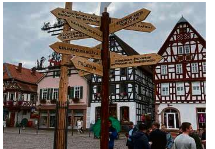
Schilder auf dem Marktplatz zeigten die verschiedenen Aktionsziele in der Stadt an.