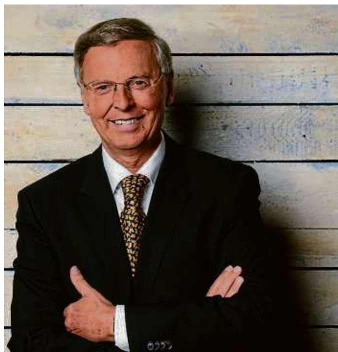
Wolfgang Bosbach kommt am 2. November zur CDU nach Froschhausen.

>> Mit der Rubrik „Worte, die verbinden“ spricht die Redaktion wöchentlich Leser an und zeigt auf, dass wir trotz aller Unterschiede doch alle gleich sind. Bitte auch Instagram-Account „wordedieverbinden“ beachten.