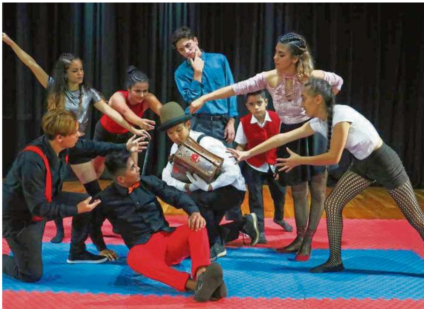
„Rondoland“ ist ein Stück mit Akrobatik, Jonglage, Clownerie, Tanz sowie Live-Musik. Von Samstag bis Dienstag ist die Truppe in Seligenstadt zu Gast. Mehr im nebenstehenden Text.