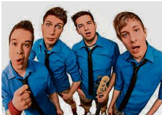
Die Gruppe „Rotzlöffel“ kommen zum Oktoberfest der Sportvereinigung Seligenstadt am 27. September.

standesgemäß zum zünftigen Frühschoppen ein. Das Refreshed-Orchester der Stadtkapelle Seligenstadt wird den Vormittag musikalisch mit Blasmusik gestalten. Für das leibliche Wohl werden, wie an den Vorabenden, die typisch bayerischen Speisen angeboten, am Nachmittag gibt es Kaffee und Kuchen. Und für die Unterhaltung der Kleinen sorgen eine Hüpfburg und Kinderschminken von der amtierenden Vizeweltmeisterin im Bodypainting. Am Sonntag ist der Eintritt frei.