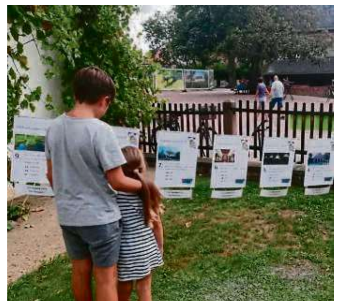
Klosterleben, aber auch Aktuelles war gefragt bei einem Quiz während des Kelterfestes der Germania.