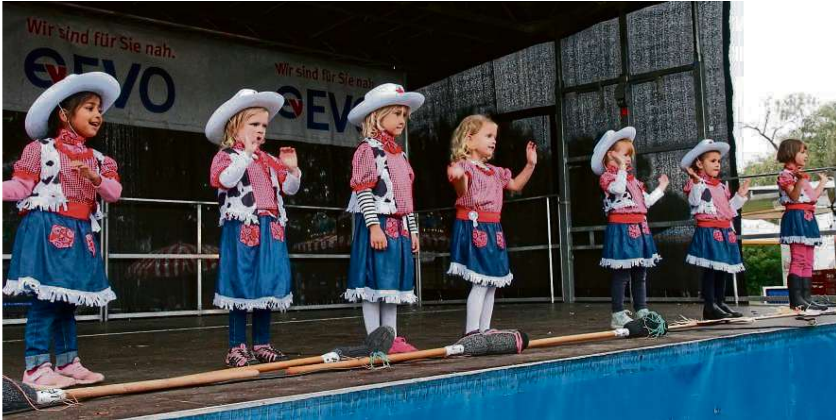
Welzem feierte seine Kerb am Wochenende wieder mit zahlreiche Attraktionen. Aktiv mit dabei war beispielsweise auch die Kindertanzgruppe mit drei- bis sechsjährigen „Little Giants“.