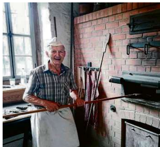
Zwiebelkuchen aus dem Klosterbackofen lieferte während des Kelterfestes Klosterbäcker Heinz Kimmel.