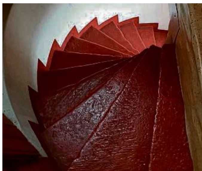
Treppen-Blick: Einen besonderen Blick hatte SHB-Leser Dieter Mohler beim Besuch des „Steinheimer Turms“ während des „Tages des offenen Denkmals“ am Sonntag in Seligenstadt. Auch wenn die Seite zur Veranstaltung bereits produziert war, hier haben wir noch eine Ecke gefunden, um das gelungene Foto wenigstens im Kleinformat zu veröffentlichen.