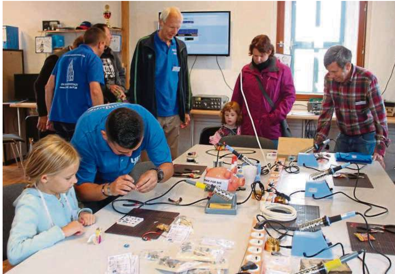
Auch die Seligenstädter Funkamateure beteiligten sich wieder am bundesweiten „Tag des offenen Denkmals“. Schon mehr als 40 Jahre haben sie im 1603 erbauten „Steinheimer Turm“ ihr Vereinsdomizil. Von dort betreiben modernste Funktechnik als ihr Hobby. Praktische Einblicke in ihre Arbeit gewährten die Aktiven des Vereins am „Tag des offenen Denkmals“. Mehr von dem Tag heute auf Seite 4. Text/Foto: zay

Wenn die Wette vom Deutschen Roten Kreuz gewonnen wird, wird Viktor Likej pro angemeldetem Blutspender zwei Euro spenden. Die erzielte Summe wird den Ferienspielen Hainburg zur Ausstattung der Aktivitäten vom DRK-Ortsverein überlassen. Weitere Gewinner sind die Blutspender. Sie bekommen einen kleinen Gesundheitscheck und erfahren das gute Gefühl, bedürftigen Menschen mit der Blutspende geholfen zu haben.