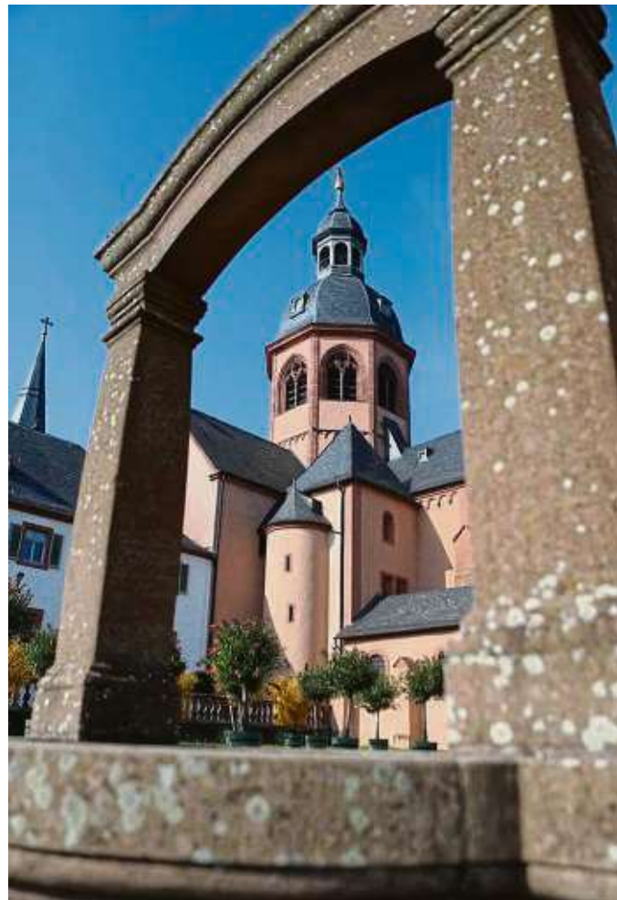
Die Einhardbasilika als Wahrzeichen Seligenstadts ist nur eines der Bauwerke, die am Sonntag im Blickpunkt stehen.

> Mit der Pfarrkirche St. Marien steht ein weiteres Gotteshaus für seine Gäste offen. Nach den beiden Gottesdiensten um 8 und 11 Uhr laden die Verantwortlichen der Kirchengemeinde zu Führungen in und an der Kir-