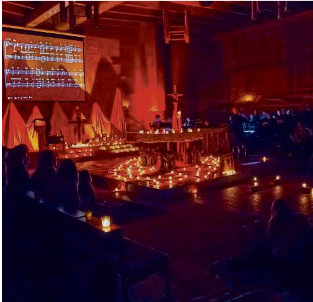
Ähnlich wie vor einem Jahr bei der Taizénacht in St. Marien Seligenstadt könnte es aussehen, wenn am 21. September zur „Nacht der Kirchen“ eingeladen wird.

Lesen Sie das Heimatblatt auch als E-Paper auf www.stadtpost.de