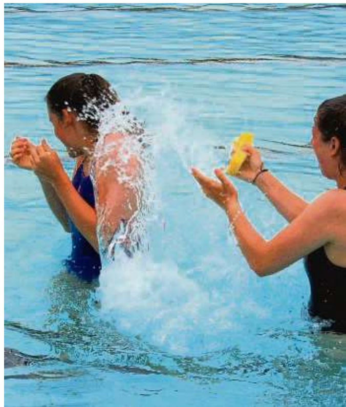
Nochmal schnell nass machen. Bald ist die Freibad-Zeit vorbei. Aber für die DLRG-Ausbilder geht der Arbeit weiter.