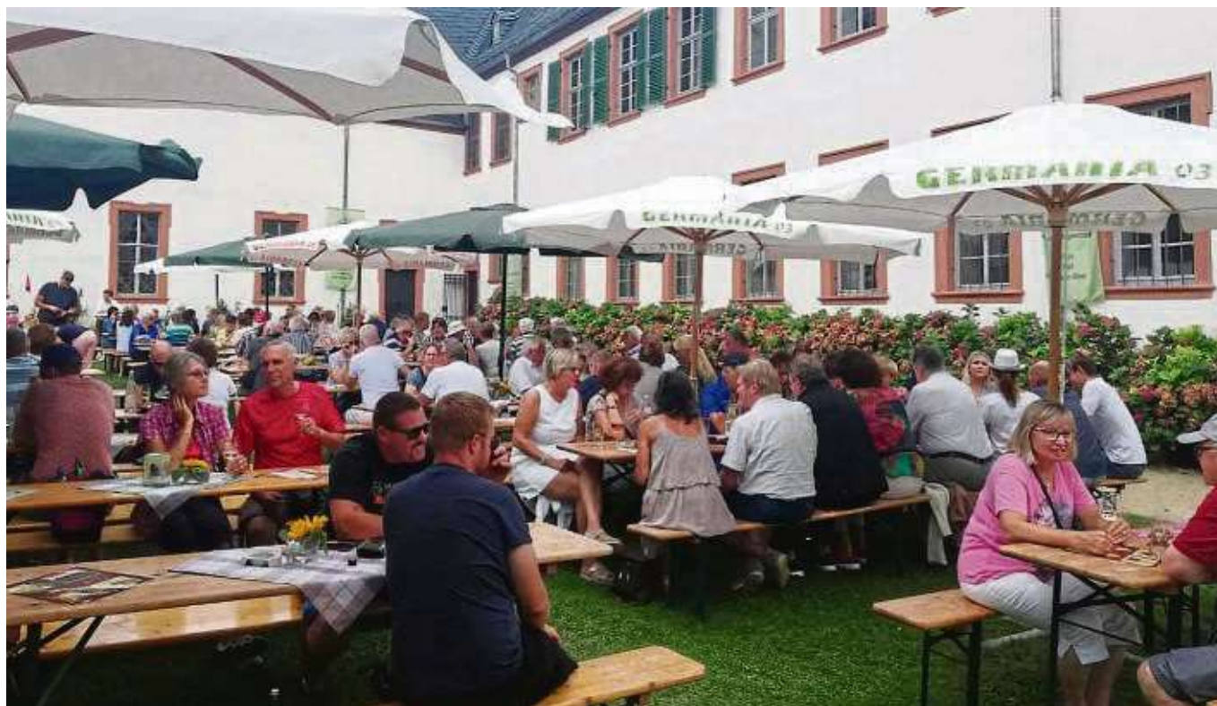
Rege Unterhaltungen bei außergewöhnlichem Ambiente im Klostergarten der ehemaligen Abtei begeisterten allerhand Menschen beim Kelterfest.