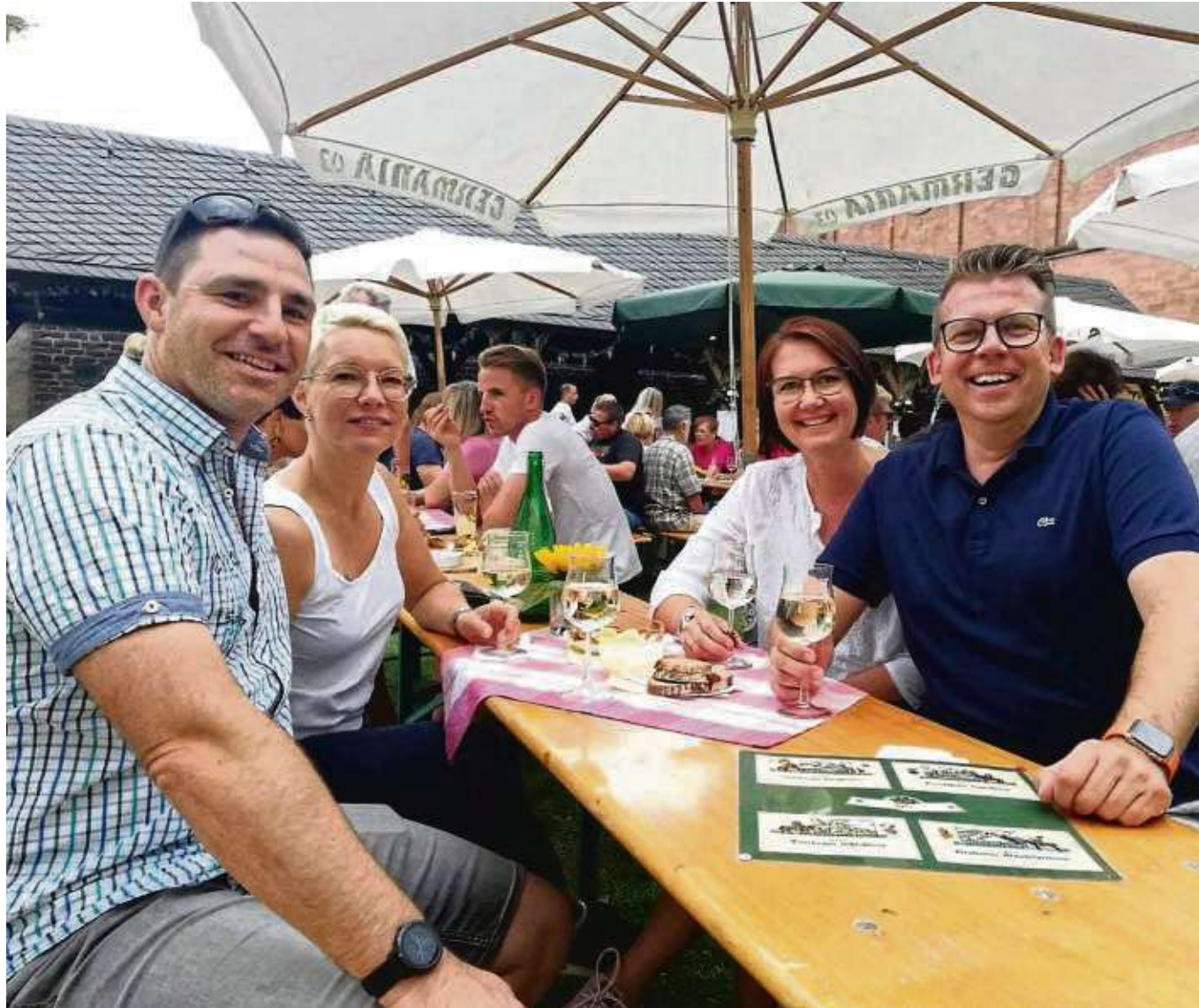
„Solange der Wein kalt ist, gibt es für mich keinen Grund zu gehen!“ Erzählen die Besucher, die sich nach einer kleinen Fahrradtour zum Kelterfest auf dem Klosterhof eingefunden haben.