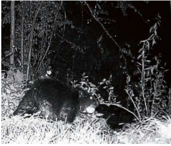
Wer genau hinschaut, erkennt vermutlich den mit Nachtsichtkamera aufgenommenen Biber, der Hainburg in Atem hält.