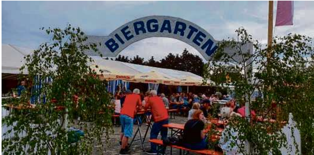
Gut besucht während des Wochenendes war auch der Biergarten bei der Zellhäuser Kerb auf dem Festplatz hinter dem Bürgerhaus.