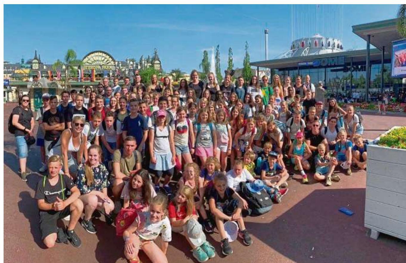
Detektei Frosch - wir quaken jeden Fall. Auf Untersuchung im Europapark Rust waren Kinder und Jugendliche aus Froschhausen während ihrer Sommerfreizeit nach Altglashütten auf den Sommerberg. Mit 80 Kindern, 24 Betreuern, drei Küchenkräften und der Leitung versteckten sich die Teilnehmer idyllisch inmitten von Bergen. Das Nachtreffen der Freizeit ist nun am Sonntag, 22. September, um 15 Uhr im Harmonie-Vereinshaus. Dort werden die Bilder und Videos der Freizeit bei einem Kaffee- und Kuchenbüfett gezeigt.

Klein-Krotzenburg (zki) – Der Bund der Vertriebenen, Ortsgruppe Klein-Krotzenburg, lädt zur 56. Vertriebenenwallfahrt ein. Der Gottesdienst zum „Tag der Heimat“ findet am Samstag, 7. September, um 18 Uhr an der Klein-Krotzenburger Liebfrauenheide statt.