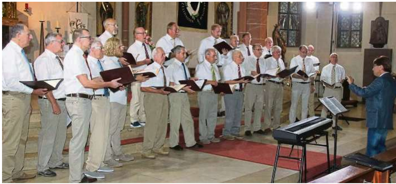
Unterhaltsamer Abend in der Pfarrkirche Sankt Wendelinus unter Beteiligung auch des Männerchors der Harmonie Zellhausen zum 130-jährigen Vereinsbestehens.

Hainstadt (red) – Das erste „Bullriding“ und „Bungee Jumping für Kids“ veranstaltet die Freie Turnerschaft Hainstadt (FTH) am Sonntag, 15. September, auf dem Vereinsgelände Am Katzenfeld. Von 10.30 bis 17 Uhr können sich sportliche Interessenten auf einem mechanischen Bullen „vergnügen“. Das „Rodeo Bullriding“ sei für Kinder und Erwachsene gleichermaßen geeignet, so die Veranstalter. Für Speisen und Getränke sorgt das Team der Freien Turnerschaft. Der Eintritt ist frei.