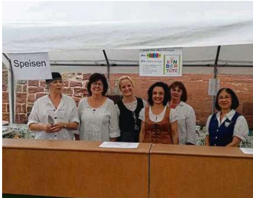
Ohne die fleißigen Helfer in ihren traditionellen Trachten würde das Fest wohl einiges an Charme verlieren.