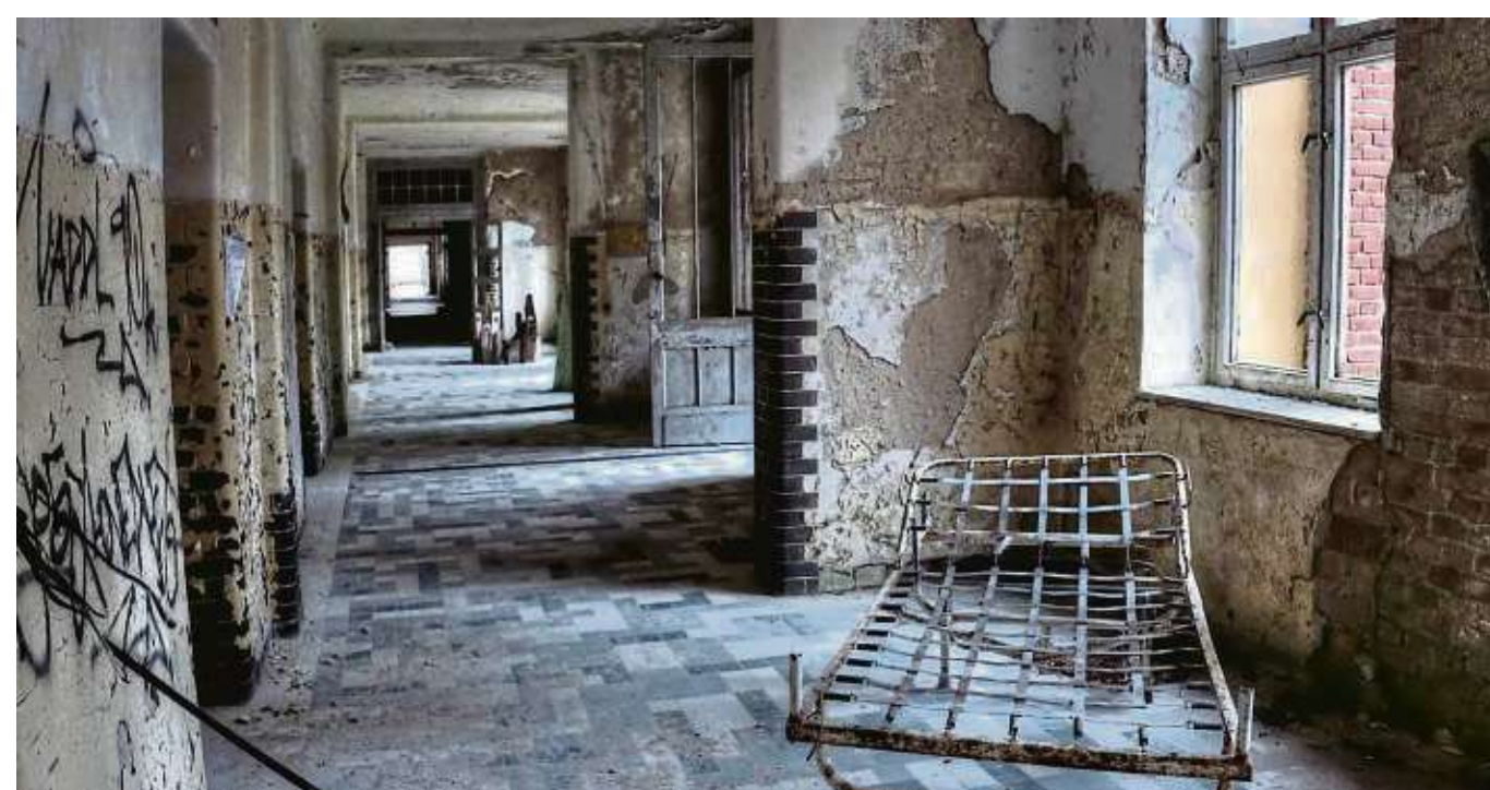
Fotofreunde unterstützen „Freunde der Hans-Memling-Schule“: Am 8. September ist der „Tag des offenen Denkmals“. Dieser Tag findet seit 1993 unter der Koordination der Deutschen Stiftung Denkmalschutz immer am zweiten Sonntag im September statt. Der Verein „Freunde der Hans-Memling-Schule“ lädt für den Nachmittag des 8. September zu diesem Anlass zu einer Veranstaltung auf den Schulhof der Hans-Memling-Schule ein. Die Fotofreunde Seligenstadt unterstützen diesen Event mit einer Fotoausstellung unter dem Thema „lost places“. Die Ausstellung wird „open air“ im Schulhof der Hans-Memling-Schule stattfinden, da aus sicherheitstechnischen Gründen die Schule lediglich im Rahmen von Führungen mit jeweils maximal 15 Besuchern zugänglich gemacht werden kann. Das selbst gestellte Thema der Ausstellung „lost places“ ist ein Thema, das in der Fotografie einen großen Platz einnimmt. Lost places sind verlassene Orte, die einstmal eine Funktion oder eine besondere Bedeutung für die Menschen hatten und dann aus den verschiedensten Gründen verlassen oder vernachlässigt wurden. Wie alles, das nicht mehr gehegt und gepflegt wird, fallen diese Plätze dann dem Verfall anheim. Der Zahn der Zeit fordert seinen Tribut. Die Wahl dieses Themas ist nicht zufällig. Die Bilder sollen zum Nachdenken anregen und bewusst machen, dass der Ort der Veranstaltung selbst zum lost place werden kann, wenn man seine Bedeutung als Kulturgut nicht erkennt. Noch spürt man die Aura der eigenen Schulzeit in diesen Räumen, noch trotz der Schule dem Verfall. Aber ohne Hilfe wird sie es nicht schaffen. zki/Foto: Fotofreunde/wp/privat

Jeden ersten Freitag im Monat findet eine öffentliche Nachwächterführung (5,50 Euro pro Person) statt, sie kann aber auch individuell gebucht werden (pauschal 85 Euro für bis zu 15 Personen). Reservierung erforderlich: Telefon 97177.