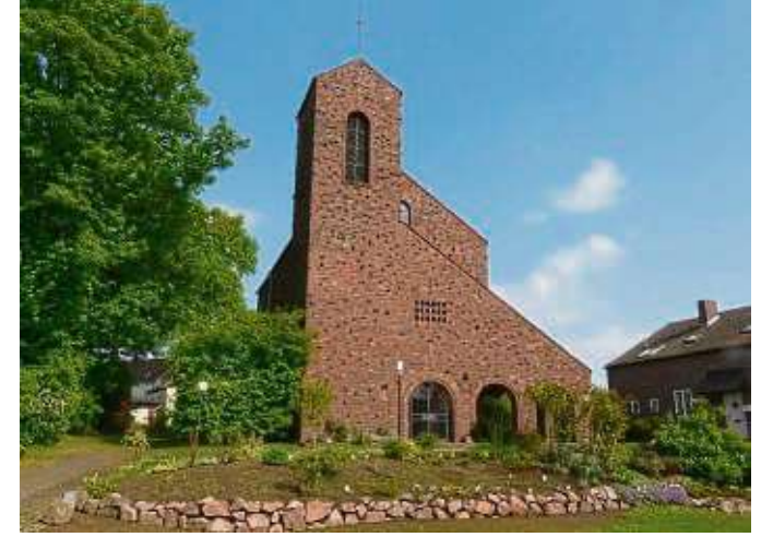
Offenes Denkmal: 90 Jahre Kahler Kreuzkirche. Die evangelisch-lutherische Kirche in Kahl am Main in der Bahnhofstraße 14 öffnet am 8. September von 14 bis 18 Uhr ihre Pforten. Für Kinder gibt es Bauklötze und Kinderführungen. Die Bauhaus-Architektur erläutert der renommierte Architekt Karl Becker in seiner typischen Art (mit Geschichtchen angereichert) um 14 und um 17 Uhr. Eine Rarität gibt es zu sehen und zu hören: die pneumatische, also mit Luft gesteuerte, Steinmeyer-Orgel. Natürlich ist für Speis und Trank gesorgt. beko

Seligenstadt (beko) – Die für Sonntag im Romanischen Haus vom Heimatbund vorgesehene Bilderschau „Vergleichsbilder von Bauten früher und heute“ ist abgesagt und wird zu einem späteren Zeitpunkt nachgeholt.