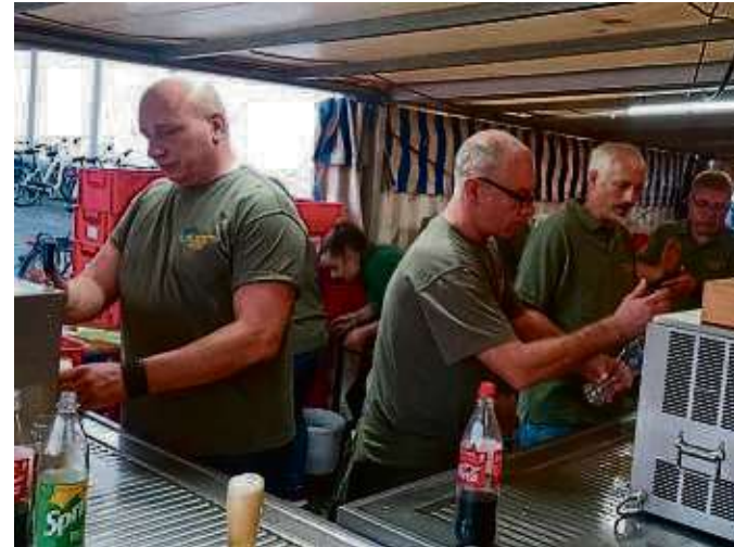
Fleißige Helfer vieler Vereine standen parat, um die Kerbfreunde am Wochenende zu unterstützen.