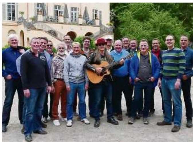
Neben dem Chor „Elysian Voices“ sorgt auch der Männerchor „Allegred-do“ für Musik beim Benefizkonzert am Freitag.