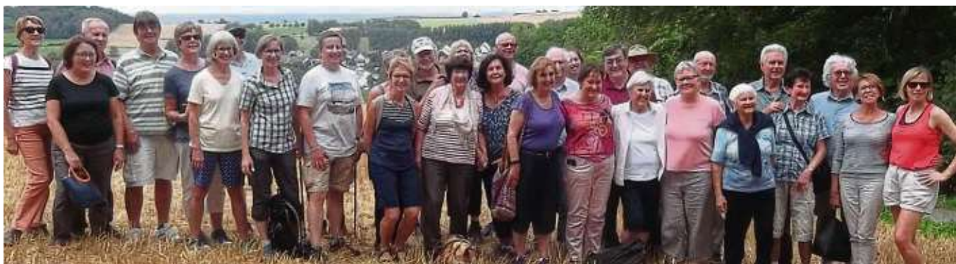
Seine Herbstwanderung unternahm nun der Europäische Freundeskreises Seligenstadt. Die Teilnehmer stammten aus Seligenstadt, Trier und sogar aus Leatherhead in England, der Partnerstadt von Trier. Mit dem Odenwald-Express ging es zunächst nach Wiebelsbach/Heubach, wo dann die Wanderung durch Wald und über Feld begann. Danach wartete ein Planwagen durch die örtlichen Weinberge. Bei der Tour kam auch ein erfahrener Winzer zu Wort und klärte die Gruppe über die verschiedenen Rebsorten auf. Zum Abschluss gab es noch eine Kellerführung bei der Winzergenossenschaft. zfk