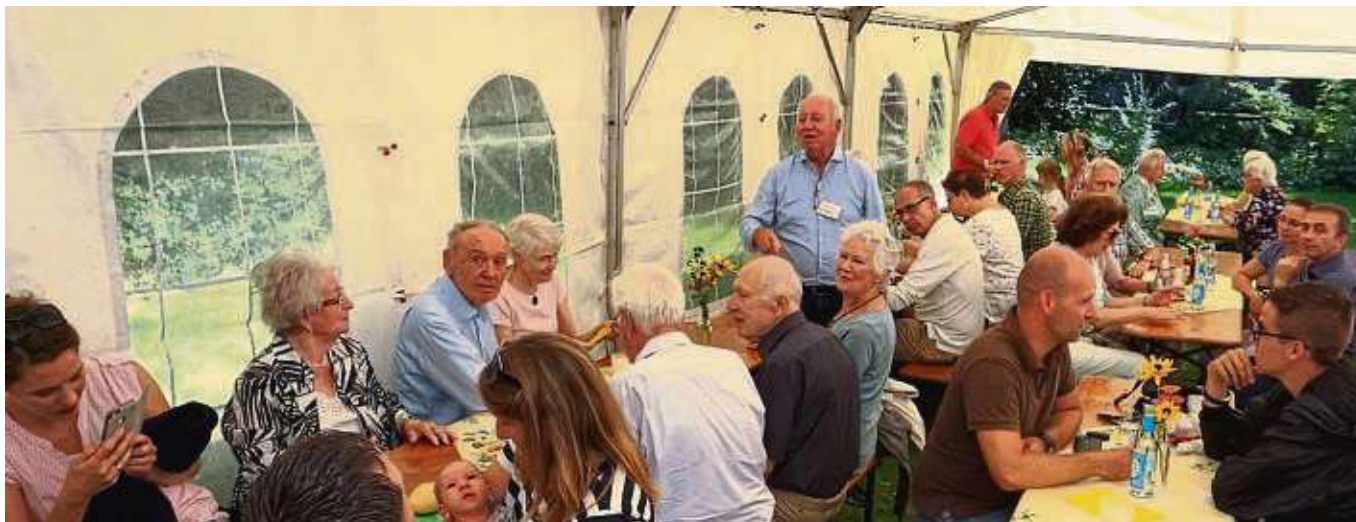
Ein Sommerfest feierte der Freundeskreis für Kapelle und Haus St. Gabriel und stellte die Kapelle, das Musikzentrum und das Theresien Kinder- und Jugendhilfezentrum vor. Nach einem Gottesdienst gab es ein musikalisches Programm und Führungen durch die Räumlichkeiten. Die Mitglieder sorgten für das leibliche Wohl der Besucher.