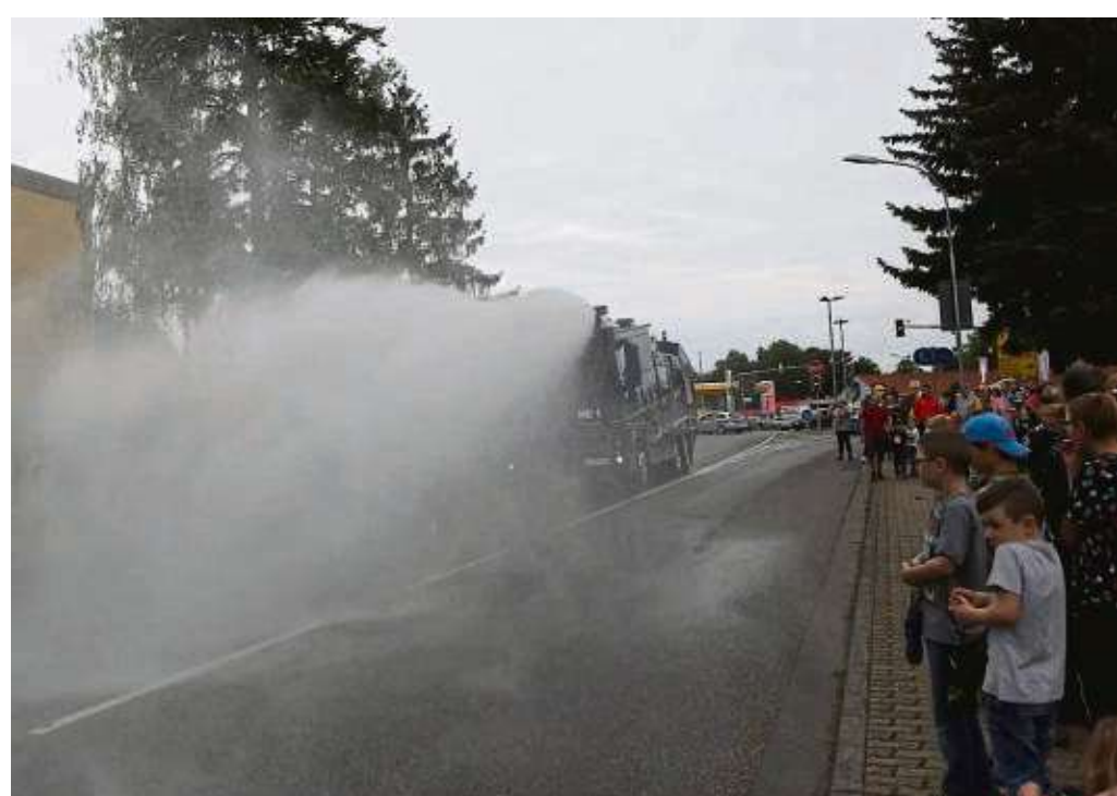
Ziemlich einschüchternd wirkte der Wasserwerfer auf die Besucher der Polizeischau, als er mit großem Druck eine hohe Wassermenge auf die Straße katapultierte.