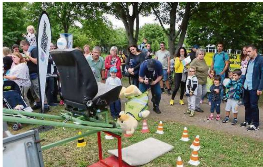
So schnell kann es gehen: Wer im Auto nicht angeschnallt fährt, riskiert, bei einem Unfall aus dem Sitz geschleudert zu werden.