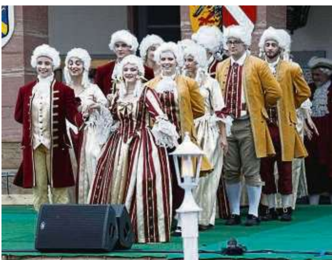
Auch die Rokoko-Tanzgruppe war aktiv vertreten sowohl beim Geleitszug als auch auf danach der Bühne.