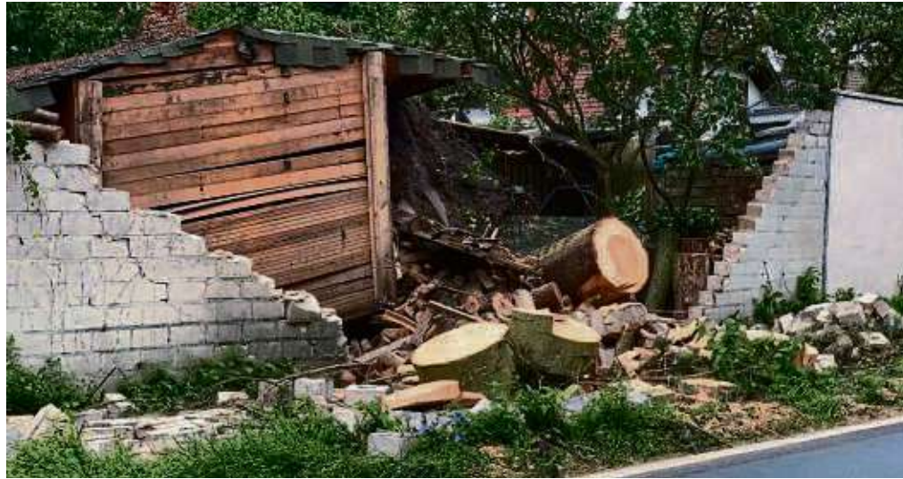
Ein Beispiel von vielen, gesehen an der Zellhäuser Straße in Seligenstadt: Riesige Baumstämme durchbrachen auch Mauern, machten alles platt.

Mit optimistischem Blick in die Zukunft Herzlichst euer Turmmännchen