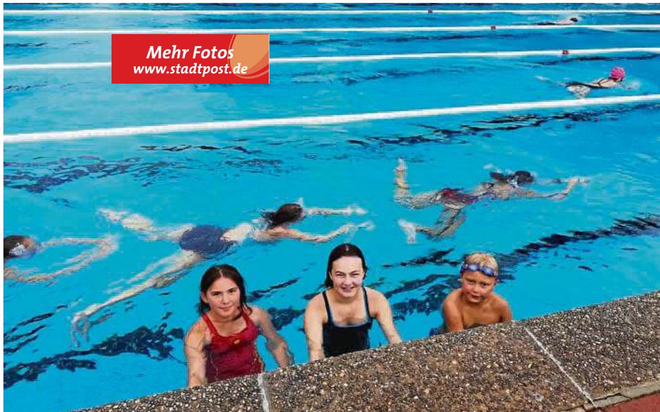
Auch die jüngere Generation ist mit von der Partie beim Zwölf-Stunden-Schwimmen im Seligenstädter Freibad und unterstützt ihren jeweiligen Verein und das Schwimmbad tatkräftig.

Seligenstadt (red) – Das Erfolgsrezept „Germanias tönende Wochenschau“ geht am 30. August ab 18.30 Uhr im Prälaturgarten des Klosters in die zweite Runde. Die dafür benötigten Eintrittskarten können bei Günter Wolf, Wallstraße 30 (☎ 06182/1604) abgeholt werden.