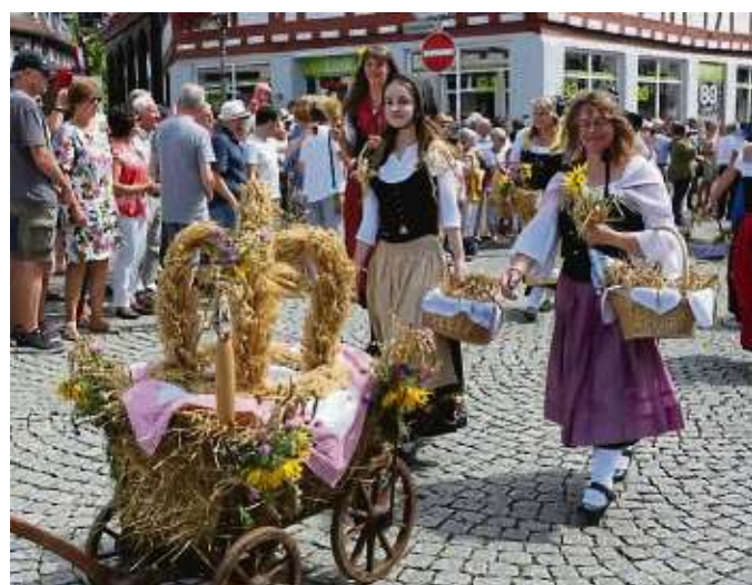
Zahlreiche Zünfte stellten sich während des Seligenstädter Geleitszuges in der Einhardstadt vor.