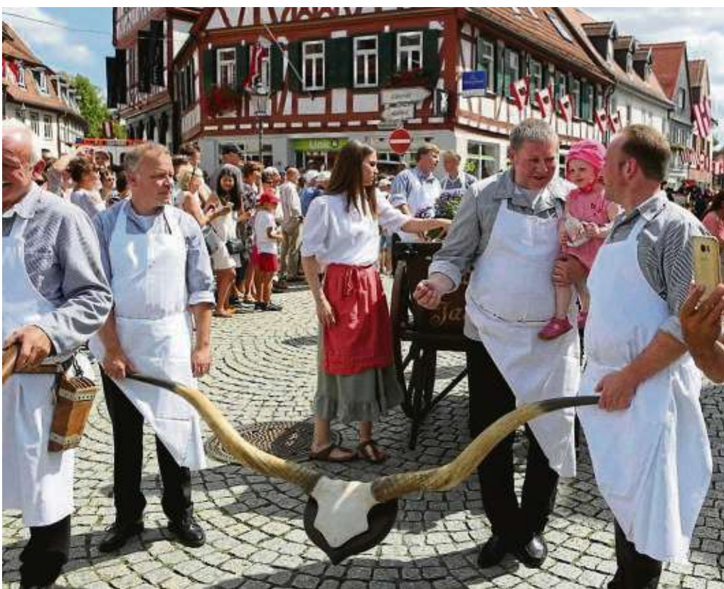
Die Schürzen der Metzger sind noch sauber, als sie über das Seligenstädter Pflaster mit Frau und Kind stolzierten.