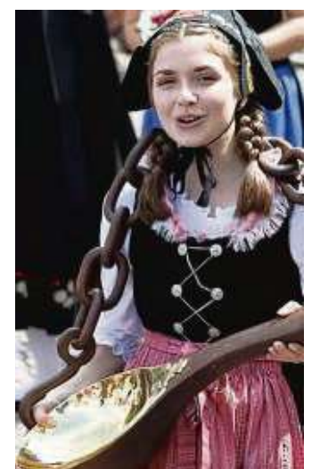
Strahlende Löffel-Mädchen mit dabei.