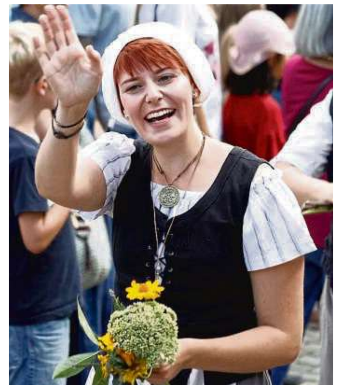
„Jubel“-Rufe ertönten während des Geleitszuges nicht nur von den Besuchern, sondern auch von den Aktiven.

Seligenstadt (beko) – Eine große „Gemeinschaftsaktion“ von drei Vereinen war es, die den musikalischen Abschluss der Geleitsfestwochen auf der Kirchenplatte vor der Basilika bildeten und es war etwas Besonderes: Musikverein Klein-Welzheim, das TGS-Musikcorps und die Stadtkapelle wirkten gemeinsam mit beim großen Zapfenstreich nach dem Feuerwerk und den Rodgau Monotones. Auch heute noch ist das Geleitsfest trotz des aktuellen Unwetters in aller Munde und auch die Besucher sind begeistert von dem, was der Heimatbund da wieder auf die Beine gestellt hat.