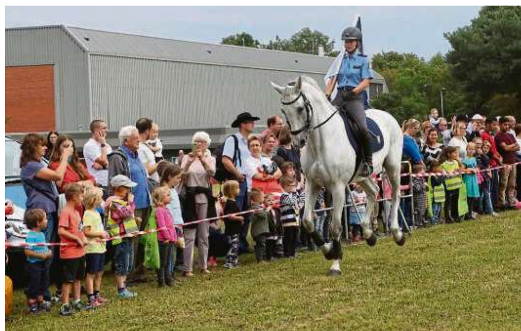
Ein eingespieltes Team sind Pferd und Reiter der berittenen Polizei. Ohne mit der Wimper zu zucken, gehorcht das Tier dem Reiter selbst in Extremsituationen.