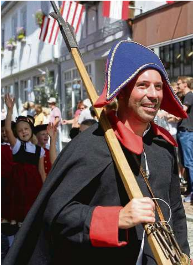
Schulklassen folgten den Nachtwächtern beim Zug durch Seligenstädts Straßen.