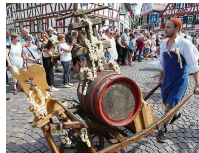
Stellmacher, Schreiner, Zimmerleute, Schuster, Schlosser - viele Zünfte waren vertreten beim Geleitszug.