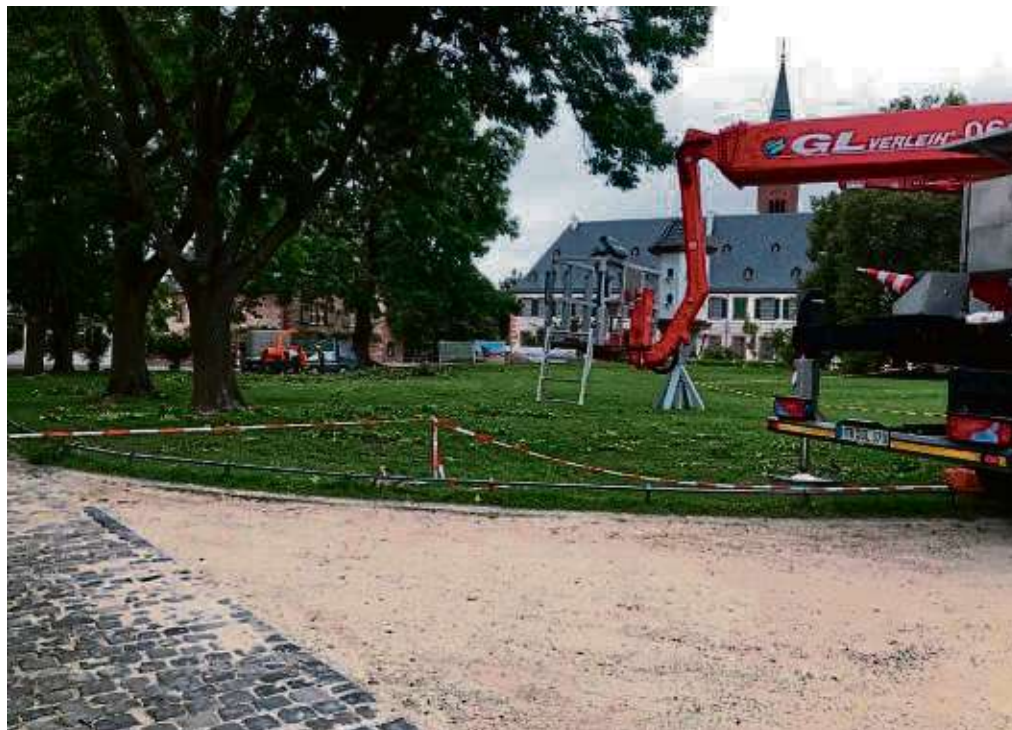
Noch fleißig gearbeitet wurde gestern nach dem Unwetter vom Sonntag auf der Klosterwiese. Ob das Picknick-Konzert am Sonntag dort oder alternativ auf den Mainwiesen stattfindet, war zum Redaktionsschluss des Heimatblattes noch nicht bekannt. Infos gibt es unter www.seligenphil.de oder unter ☎ 0173 6500515.

>> Mit der Rubrik „Worte, die verbinden“ spricht die Redaktion wöchentlich Leser an und zeigt auf, dass wir trotz aller Unterschiede doch alle gleich sind. Bitte auch Instagram-Account „wordedieverbinden“ beachten.