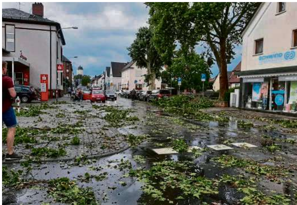
So sah es am Sonntag, unmittelbar nachdem der Sturm durch Seligenstadt zog, auf der Frankfurter Straße aus. Mehr Fotos in der Online-Bildergalerie.

> Aktuelle Informationen auf www.stadtpost.de