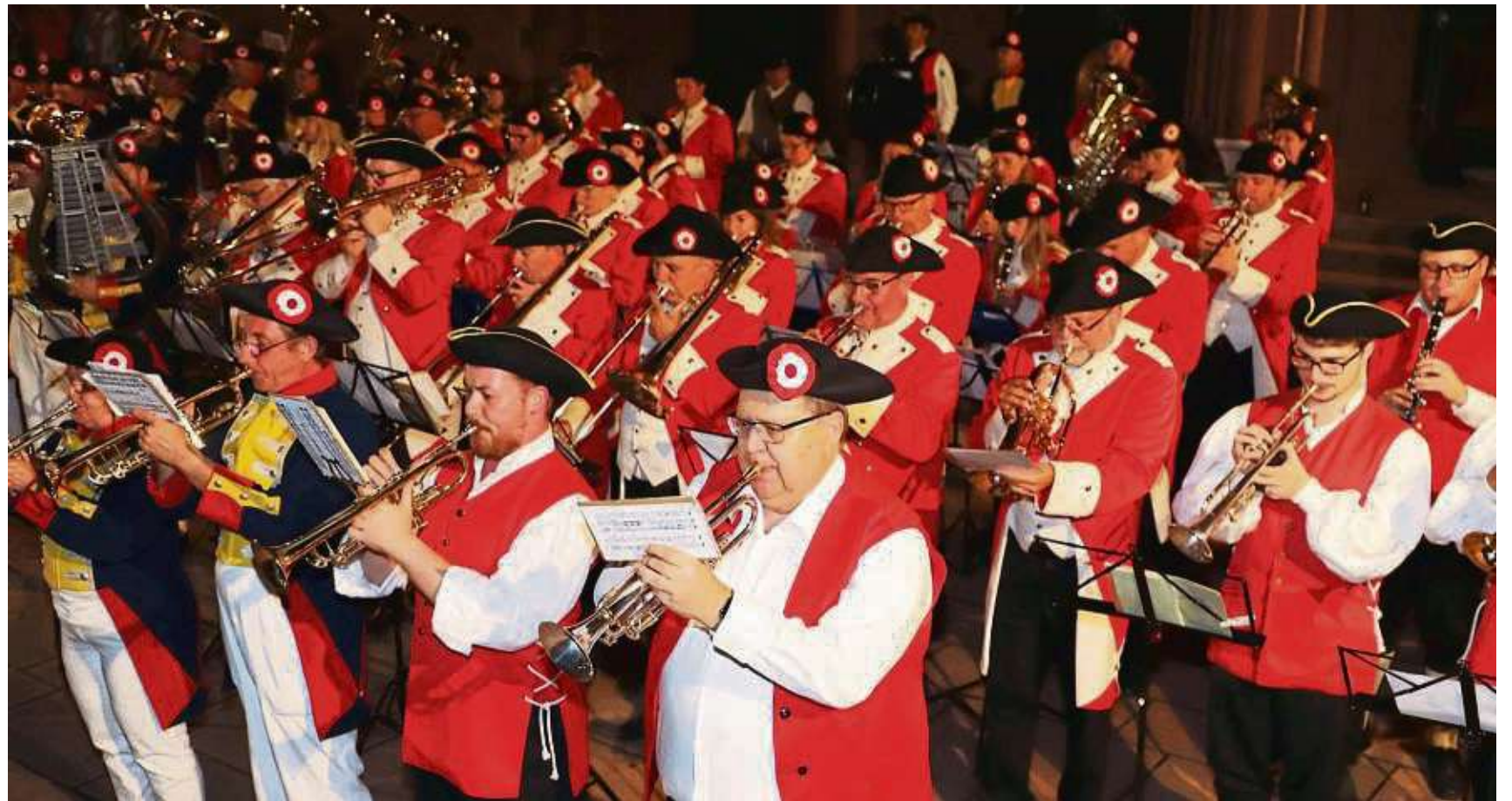
Gleich drei Musikgruppen beteiligten sich in einer „Gemeinschaftsaktion“ am großen Zapfenstreich zum Abschluss der Geleitsfestwochen an der Einhardbasilika: Das TGS-Musikcorps, der Musikverein Klein-Welzheim und die Stadtkapelle Seligenstadt.