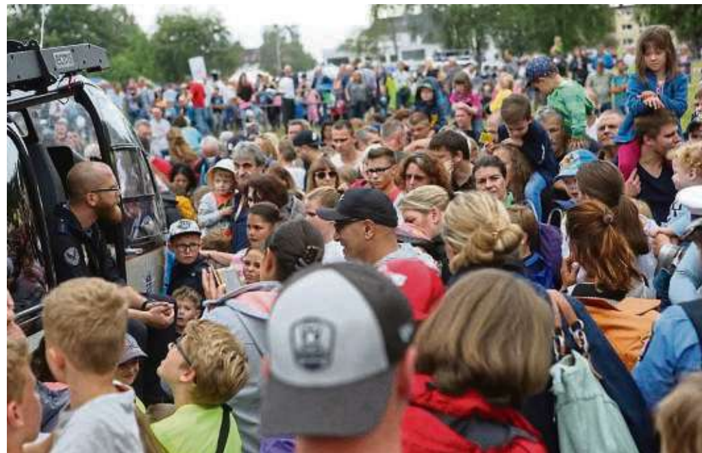
Nach der Landung des Polizeihubschraubers stürmten Kinder mit ihren Eltern in Richtung der Piloten, um sich über deren abenteuerliche Arbeit zu informieren.