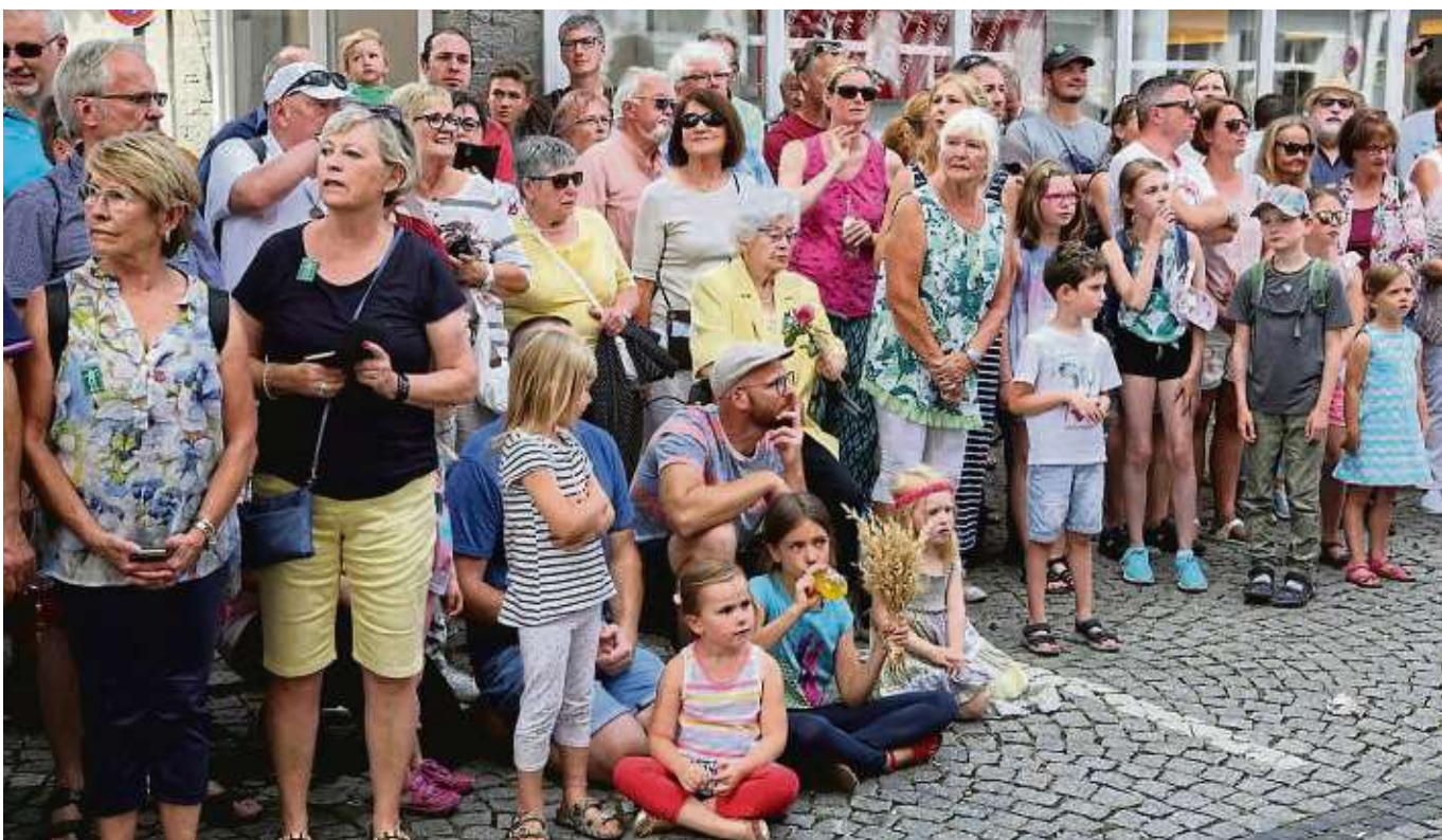
Viele hunderte Besucher aus der ganzen Region kamen zum Geleitszug in Seligenstadt und begutachteten genau die historischen Fußgruppen und Wagen, die durch die Altstadtstraßen zogen.