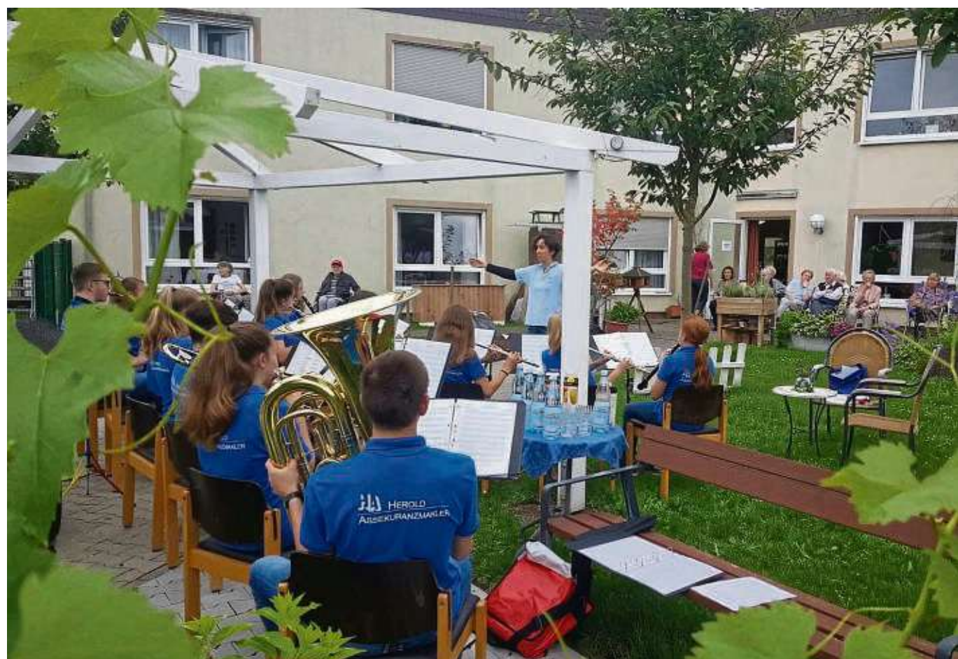
Zu einem kleinen Überraschungskonzert war das Schülerorchester der Musikgesellschaft Eintracht Hainstadt dieser Tage im Klein-Krotzenburger Simeonstift zu Besuch. Den jungen Musikern und den Bewohnern hat es sehr viel Freude gemacht, und es wurde sogar ein kleines Tänzchen gewagt. So wird es bestimmt nochmal zu einer Wiederholung kommen.

> Mehr Informationen zu Hessen Mobil unter mobil.hessen.de oder verkehrsservice.hessen.de.