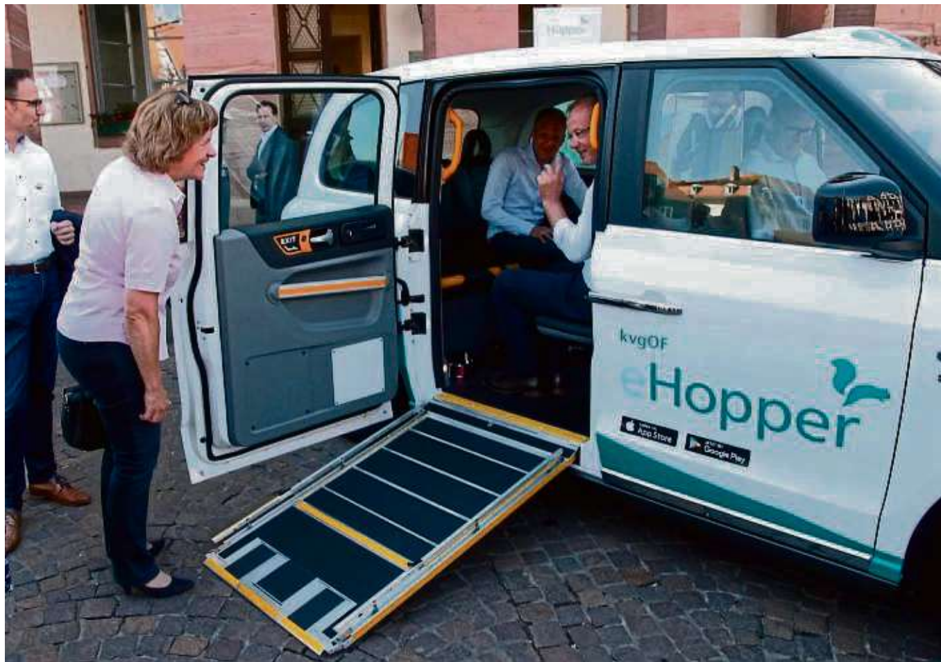
Den Start der sogenannten kvg-Hopper kündigte dieser Tage die Kreisverkehrsgesellschaft (kvgOF) auf dem Marktplatz in Seligenstadt an. Die Testphase mit vier Fahrzeugen startete direkt im Anschluss.

sucherränge des Plenarsaals gestürmt und alle Teilnehmer mit einem Lageplan ausgestattet, auf dem zu sehen war, welcher Politiker wo sitzt. Es konnte einer Diskussion über Wohnungsbau und die Problematik der Mietwohnungen beigewohnt werden. Später traf die Reisegruppe in einem Sitzungssaal der CDU-Fraktion auf den Landtagsabgeordneten und Landtagsvizepräsidenten Frank Lortz. Dieser erzählte auf sehr unterhaltsame Art von der Arbeit der Abgeordneten. Nach einem gemeinsamen Erinnerungsfoto ging es für alle auf den Heimweg.