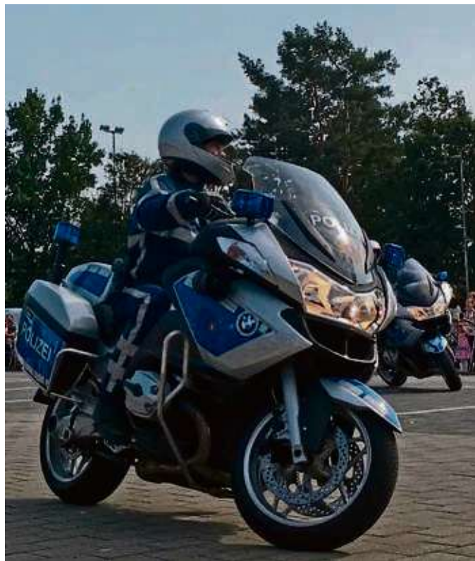
Auch auf Motorrädern ist die Polizei unterwegs und präsentiert sich bei der Polizeischau im August in Hainburg.

Die Jugendverkehrsschule bietet für Kinder ein Fahrradgeschicklichkeitsturnier mit tollen Preisen an. Daneben gibt die Polizei unter anderem Tipps zum Schutz vor Cyberkriminalität, Einbrechern und Trickdieben. Zudem stellen die Spezialisten der Verkehrsinspektion Geschwindigkeitsmessanlagen vor. Das Sachgebiet „Sprayer“ informiert über seine Arbeit. Beim Erkennungsdienst können sich kleine Besucher ihren Fingerabdruck mit nach Hause nehmen.