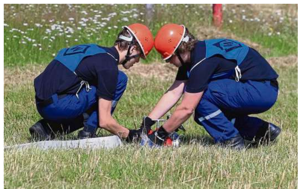
Höchste Konzentration beim Anschluss der Schläuche am Verteiler bei Jugendlichen während der Kreisfeuerwehrtages in Seligenstadt.