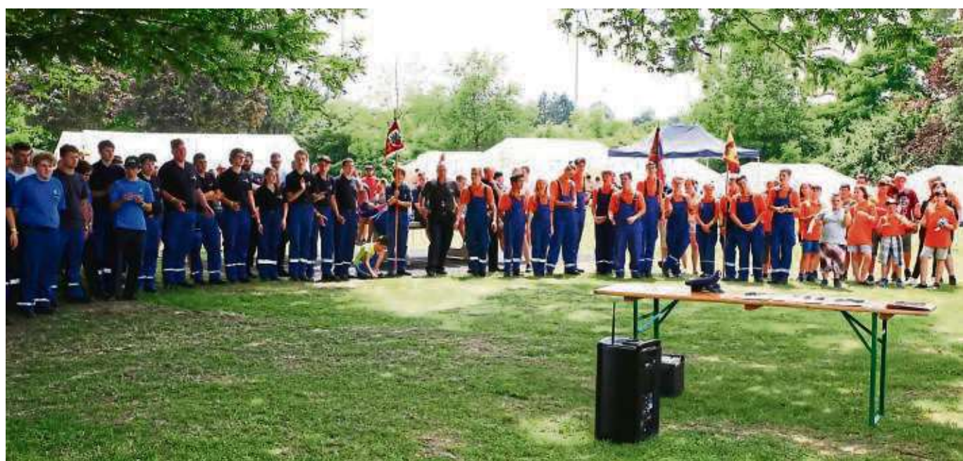
Rund 400 Jugendliche, Betreuer und Helfer von den Jugendfeuerwehren des Kreis Offenbachs zelteten und übten auf dem Gelände des Schwimmbads in Seligenstadt, im Zuge des Kreisjugendfeuerwehrtages.

gelaufen und Aufgaben gelöst wurden. Die Stadtrallye war als Geocaching-Workshop ausgelegt. Den dritten Platz bei der Lagerolympiade belegte die Jugendfeuerwehr Hainstadt, den zweiten Platz die Jugendfeuerwehr Mainhausen und den ersten Platz die Jugendfeuerwehr Offenbach.