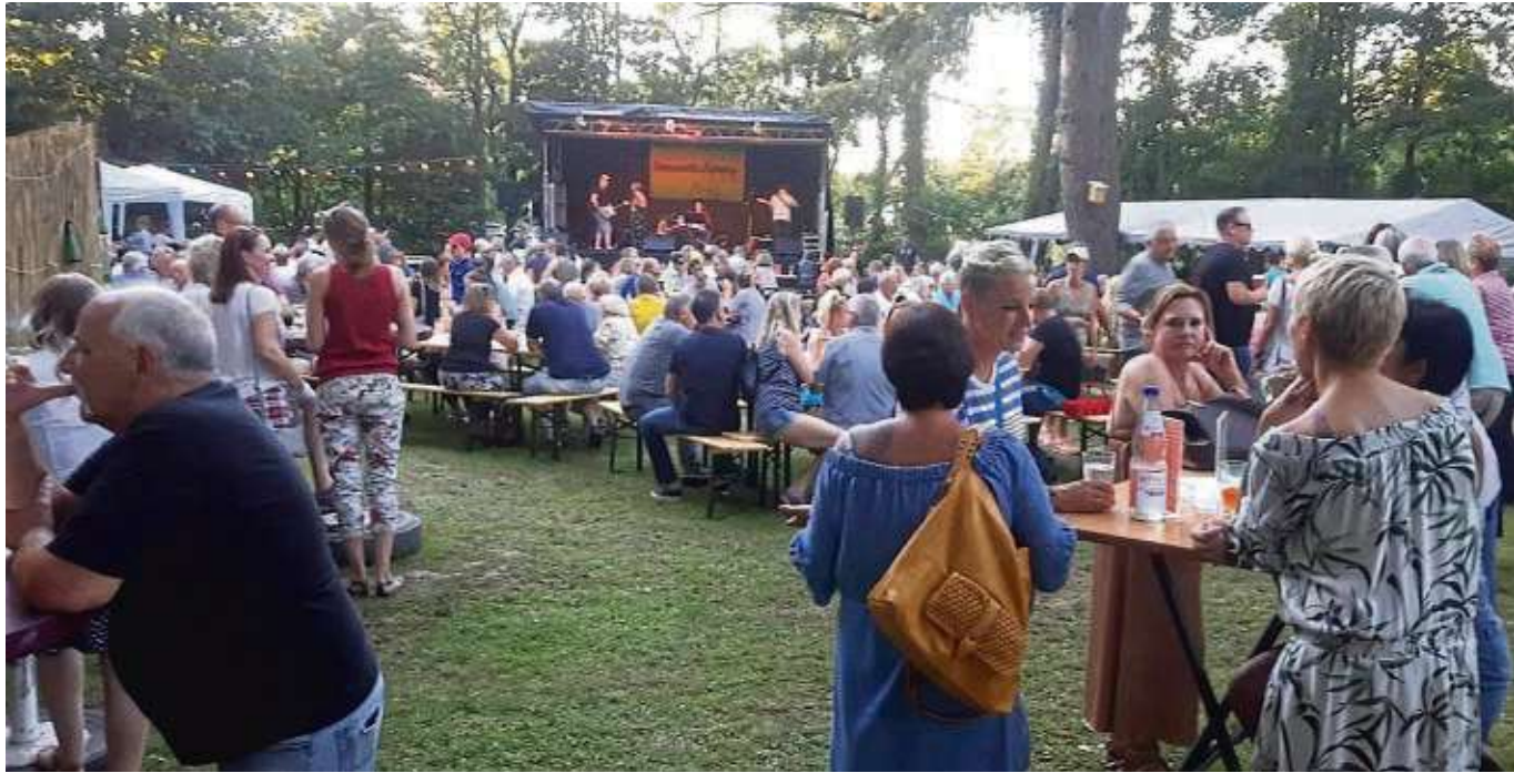
Wieder einmal sehr gut besucht war trotz der heißen Temperaturen das Hüttenfest an der verlängerten Stockstädter Straße in Zellhausen, zu dem der Verein „Die Hütte“ eingeladen hatte. Musik war Trumpf, aber auch die Spezialitäten beim Essens- und Getränkeangebot taten ihr Übriges, um hunderte Menschen aus der gesamten Region nach Zellhausen zu locken. Text/Fotos: Koch