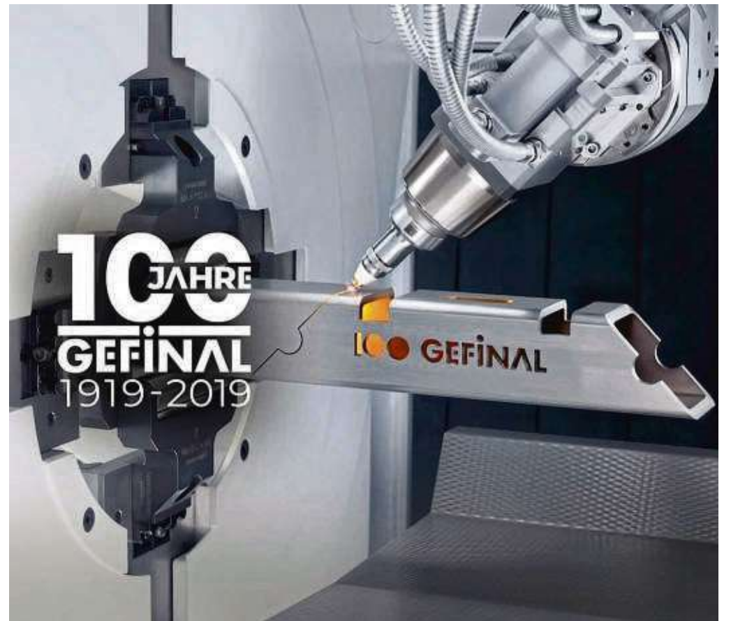
Schon vor vielen Jahren wurde bei Gefinal in Zellhausen unter anderem die vollautomatisierte Produktion mit modernsten Bearbeitungsmaschinen ausgerüstet.

rer. Seit dem Jahr 2001 leitet nun Ingo Hildebrandt den Betrieb. Er fuhr mit weiteren Modernisierungsmaßnahmen fort. Schon 2003 wurde unter anderem die vollautomatisierte Produktion mit modernsten Bearbeitungsmaschinen ausgerüstet und um ein Hochregallager ergänzt. Mittlerweile produzieren 100 Mitarbeiter auf 5600 Quadratmeter Produktions- und Lagerfläche zu allen Tag- und Nachtzeiten für einen großen Kundenkreis aus den unterschiedlichsten Branchen, wie dem Maschinenbau, der Chemieindustrie, Medizintechnik und Lebensmittelbranche. Weitere Erneuerungen sind schon in Planung und werden noch in diesem Jahr umgesetzt.