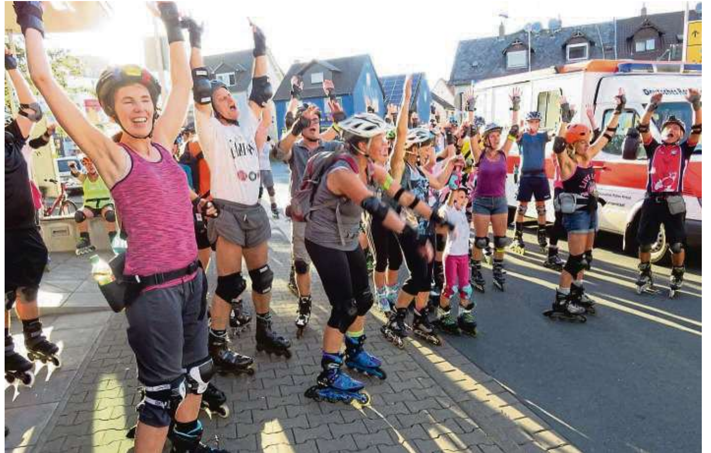
Begeisterung pur trotz brütender Hitze: Zur Seligenstädter Skate-Night trafen sich wieder viele Sportler am Kapellenplatz, um dann auf Tour zu gehen. Die Skate-Night ist kein Wettbewerb, sondern ein im Konvoi geführtes, gemeinsames, lockeres Miteinander. Nächster Termin ist am Donnerstag, 25. Juli. beko