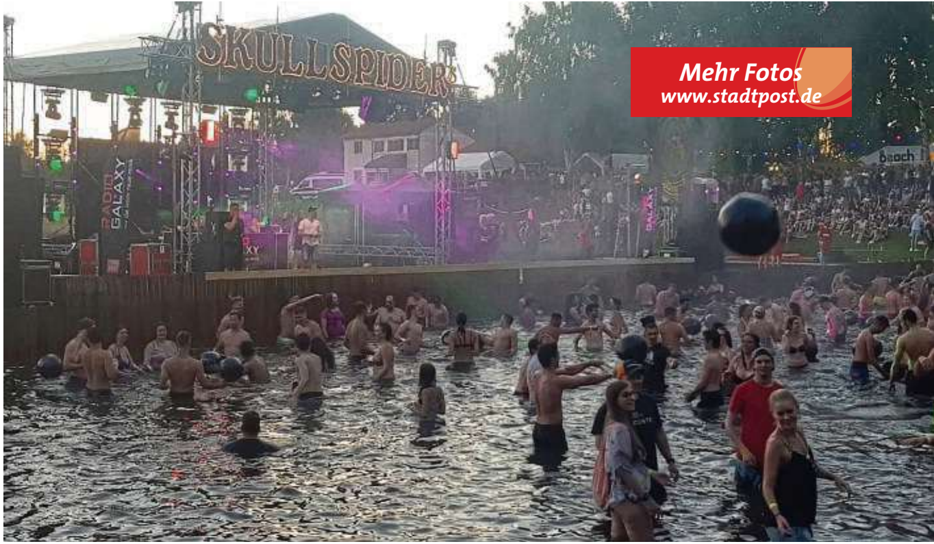
Die „Mutter aller Beachpartys“ am Mainflinger Badensee hat nichts an Attraktivität verloren. Zur 15. und wohl heißesten Auflage aller Zeiten durften sich die Veranstalter von den Skull Spiders über tausende Besucher freuen.