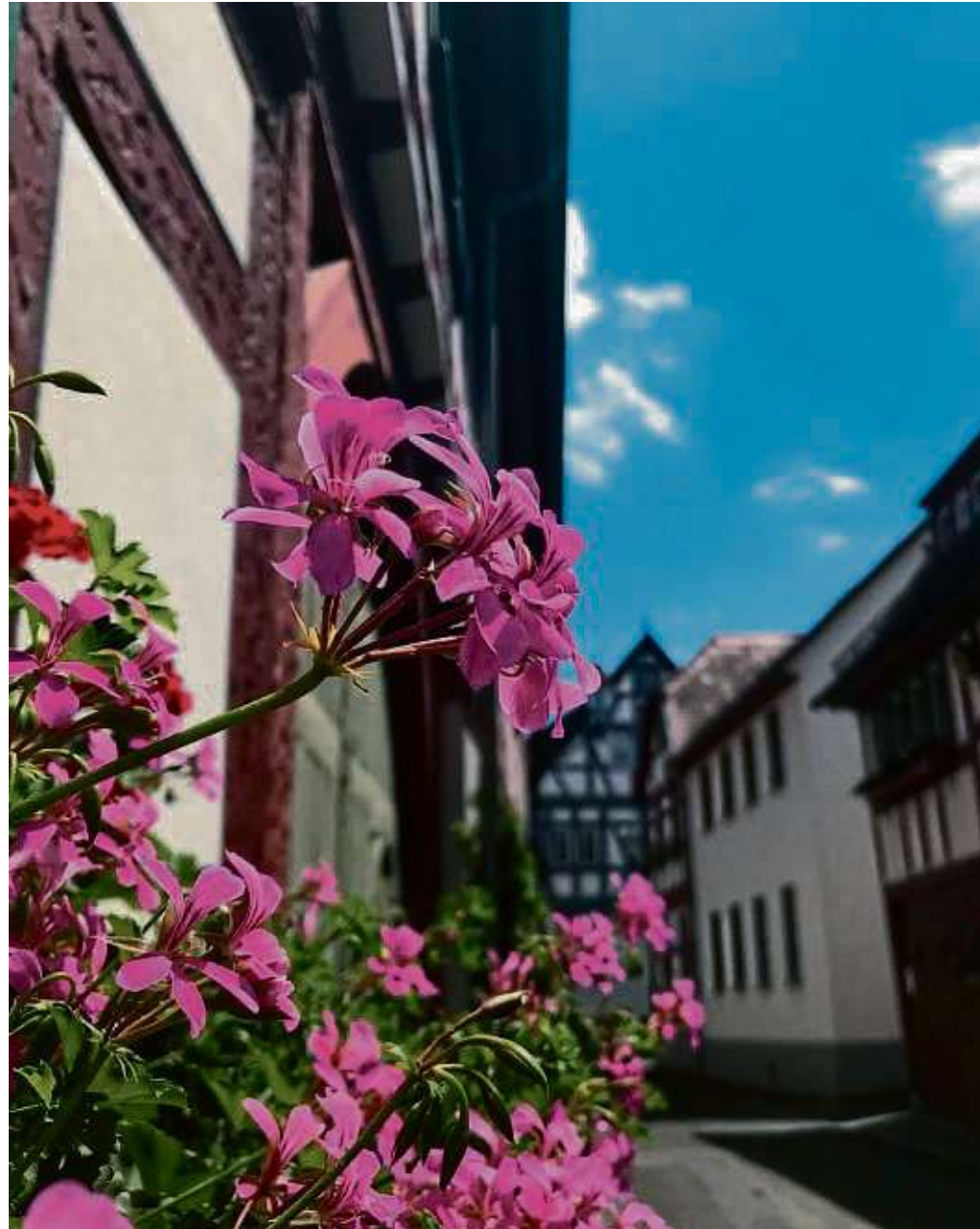
Trotz der großen Hitze in den zurückliegenden Tagen halten doch so manche Blumen in der Altstadt durch, wenn man sich richtig um sie kümmert und ihnen das „Wasser des Lebens“ gibt.

Tag der deutschen Imkerei ist an diesem Sonntag