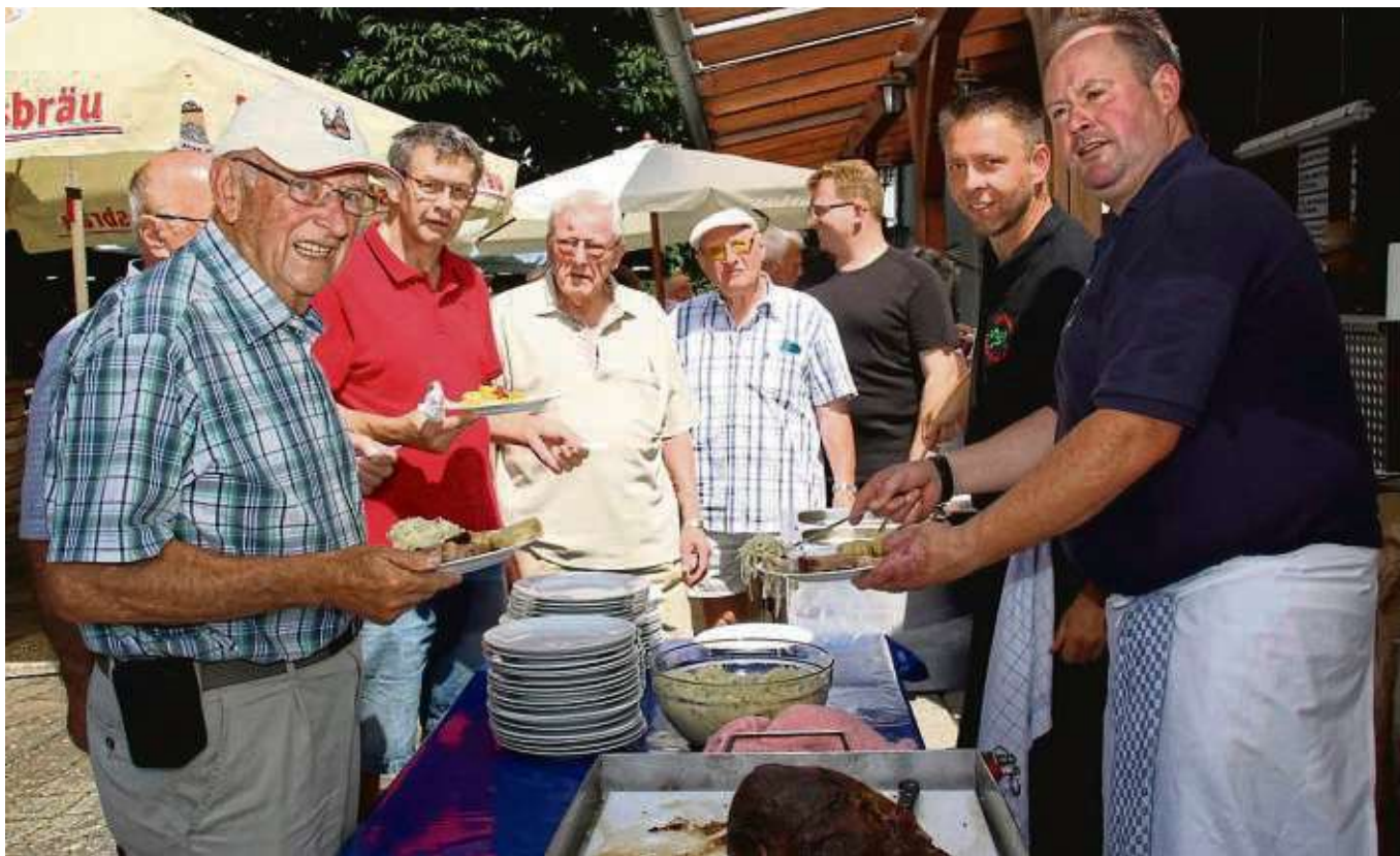
Zum Auftakt der 25. Kulinarischen Woche beim Gesangverein Harmonie Froschhausen sangen am Sonntag die „Knackfrösche“ des Vereins. Als besonderes Schmankerl gab es zum Mittag Ochs am Spieß, das war für viele Gäste der Renner. Jeder Tag dieser Woche steht unter einem anderen Motto, am Mittwoch ist Kroatischer Abend mit Pljeskavica mit Schafskäse, am Donnerstag geht es in die Puszta mit Szegediner Gulasch mit Serviettenknödel und abschließend am Freitag, folgt nach alter Tradition der Fischabend mit gebackenen Forellen oder Matjesfilets mit Bratkartoffeln. Der malerische Biergarten ist von 17 bis 21.30 Uhr geöffnet. Text / Foto: zbo

Seniorenkino im Turmpalast am Freitag, 19. Juli