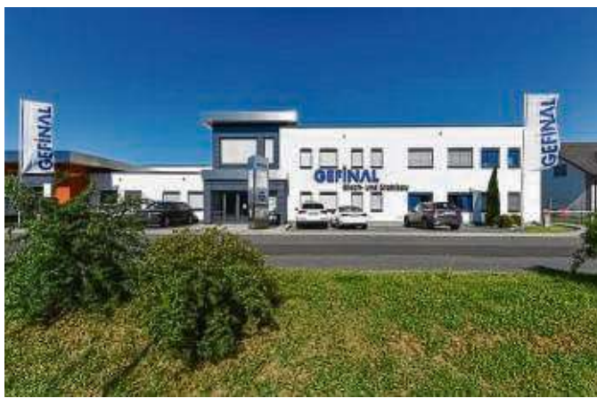
Die Firma Gefinal in Zellhausen an der Industriestraße feiert in diesen Tagen sein 100-jähriges Jubiläum.