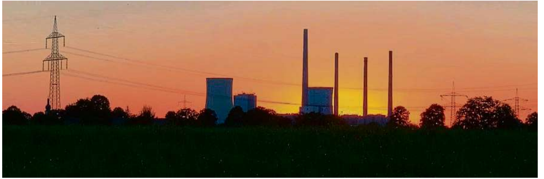
Sonnenuntergang mit dem Großkrotzenburger Kraftwerk Staudinger aus ungewöhnlicher Perspektive. Hier aus dem Feld zwischen Klein-Krotzenburg und Seligenstadt aufgenommen.

>> Mit der Rubrik „Worte, die verbinden“ spricht die Redaktion wöchentlich Leser aller Nationalitäten an und zeigt auf, dass wir trotz aller Unterschiede doch alle gleich sind. Bitte auch Instagram-Account „wordtieverbinden“ beachten.