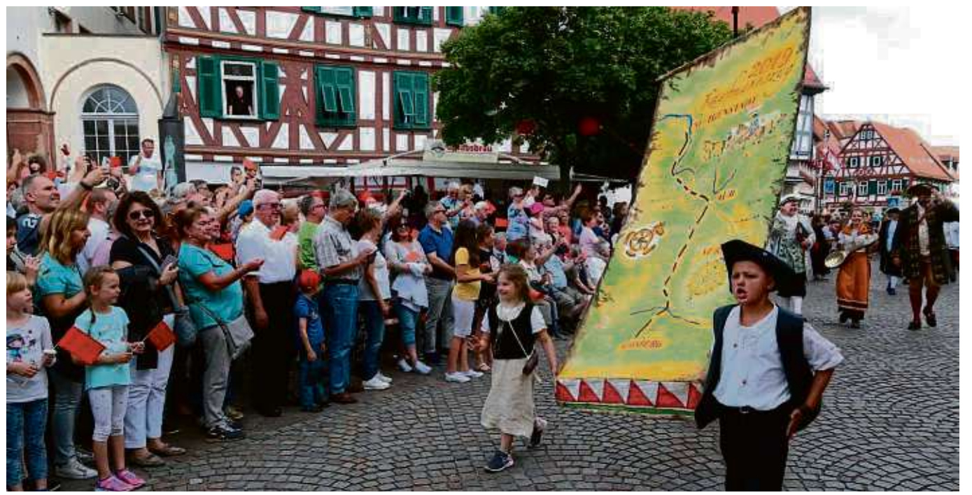
Eine 340 Kilometer lange Route, dargestellt auf dieser farbigen Karte, die am Samstag von zwei jungen Kaufleuten in Richtung Marktplatz getragen wurde, liegt hinter den rund 200 Teilnehmern des Historien-Spektakels.