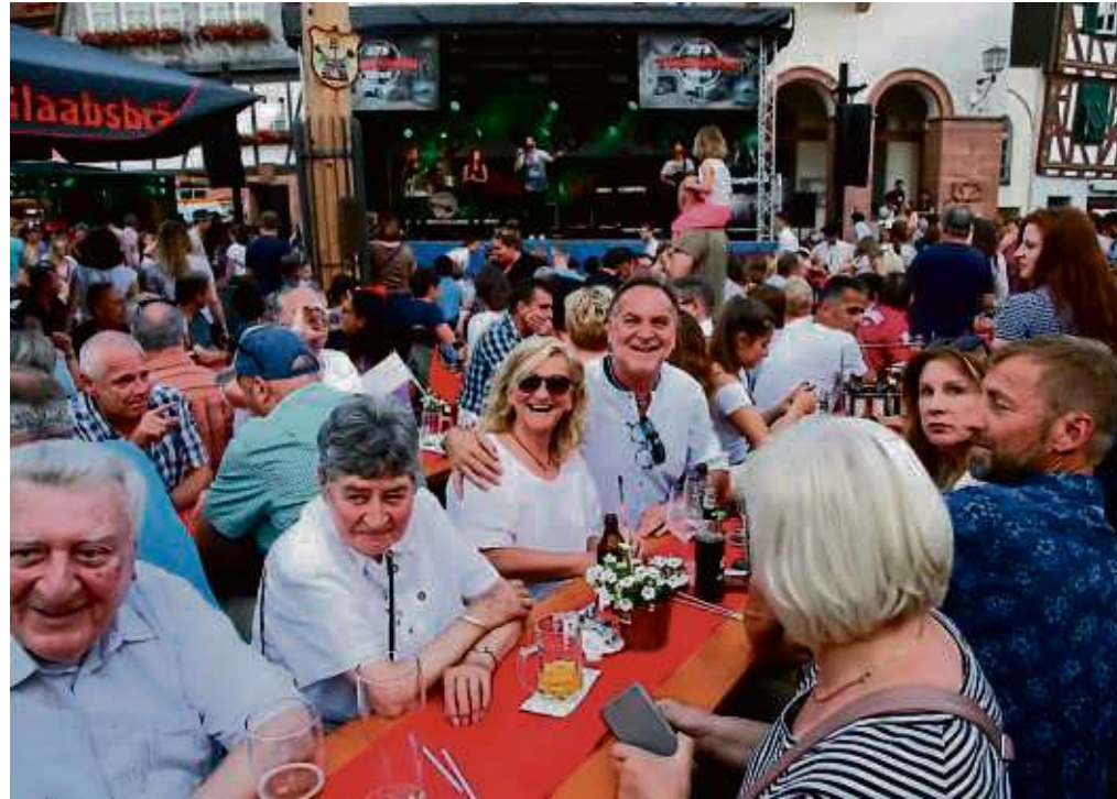
Feststimmung allenthalben und ein bis auf die letzte Bank gefüllter Markt- platz: Nicht nur die Ankunft des Kaufmannszugs wurde am Samstag gefeiert, auch die Seligenstädter Glaabsbräu hatte anlässlich ihres 275-jährigen Bestehens für zwei Tage zum Fest geladen und konnte tausende Besucher in der Einhardstadt begrüßen. Bierinseln, Food-Trucks, Live-Musik und Brauerei-Führung sorgten für Unterhaltung.

In diesem Sinne dennoch ein frohes Geleit! Euer Turmmännchen