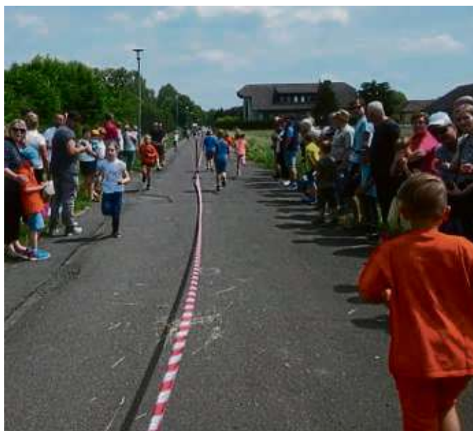
Kräftig angefeuert durch ihre Familien und die Lehrer liefen die Schüler der Klassen eins bis vier ihre Runden.

Zellhausen (red) – Mit Hilfe des Schulleiternbeirates, Unterstützung zahlreicher Eltern und der katholischen jungen Gemeinde Zellhausen feierte die Käthe-Paulus-Schule zum Ende der 72-Stunden-Aktion „Euch schickt der Himmel“ ihr jährliches Schulfest. Im Rahmen der Aktion des Bundes der deutschen katholischen Jugend gestaltete die KJG Zellhausen eine Lesecke im Schulhof mit Sitzmöbeln und Hochbeeten. Weiter wurde die Schulhofbemalung erneuert und erweitert. Auch bei der Ausführung des Schulfestes und der Betreuung des Sponsorenlaufes standen sie den unterstützenden Eltern und Lehrern hilfreich zur Seite. Das Schulfest startete, wie gewohnt, mit einem Mittagessen. Die von Eltern gespendeten Salate und Kuchen ließen keinen Wunsch offen. An der Saft-Bar der Schülergondel