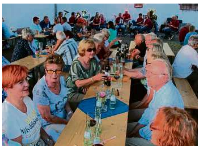
Eine laue Sommernacht unter den Linden erlebten die Besucher beim Katholischen Musikverein in Zellhausen. Bei zünftigen hessischen Essen wie Handkäs, Fleischwurst und einigen Schmankerl ließen es sich die Gäste gut gehen. Außerdem servierte der Musikverein verschiedene Weine und zur Unterhaltung spielte die Blasmusik.

Seligenstadt (red) – Gute Nachrichten für Pendler: Die erste Bauphase der komplexen Sanierung der A3 zwischen der Anschlussstelle Hanau und dem Seligenstädter Dreieck ist laut Hessen Mobil erfolgreich abgeschlossen. Am Dienstag konnten der zweite und der dritte Fahrstreifen wieder geöffnet werden. Das Baufeld wird nun auf den Standstreifen und den daneben liegenden ersten Fahrstreifen verlegt. Zusätzlich wird ab Dienstag, 25. Juni, die Sperrung der Ausfahrt der Anschlussstelle Seligenstadt in Fahrtrichtung Würzburg für knapp zwei Wochen aufgehoben. Im Anschluss beginnt die zweite Bauphase und damit die Sanierung der Zu- und Abfahrtsrampen der Anschlussstelle Seligenstadt. Hierfür muss die gesamte Anschlussstelle vom 9. bis zum 17. Juli voll gesperrt werden.