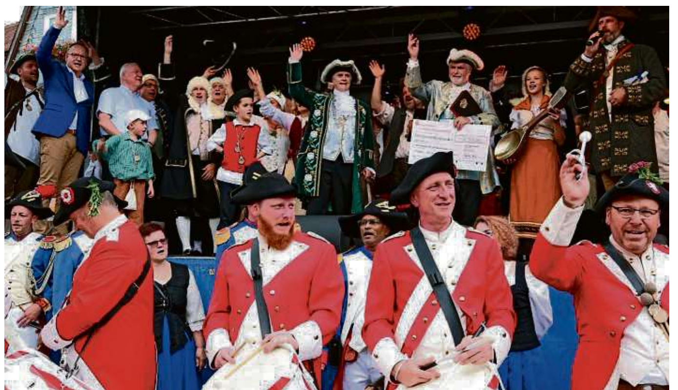
Trommelwirbel und Jubel für die Heimkehrer: Auf der Bühne vor dem Rathaus sowie auf den umliegenden Gassen wurde dem Zug ein rauschender Empfang bereitet.