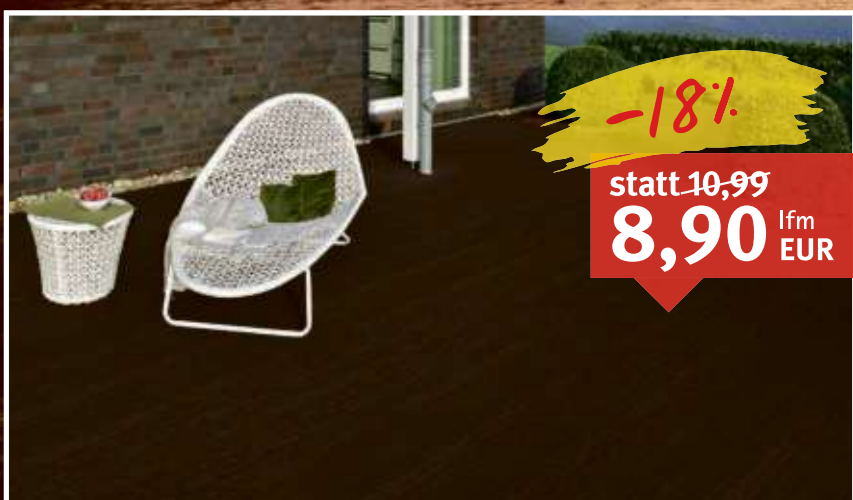
WPC-Terrassendiele „Xtreme“ Acorn brown Massivprofil, glatt/glatt, Maße: 20 x 127 mm; Längen: 366–488 cm