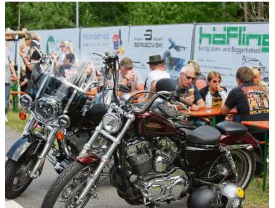
Auch wenn die Sonne dominierte am Wochenende: Im „Schatten“ der schweren Maschinen gönnte sich so mancher eine Pause.