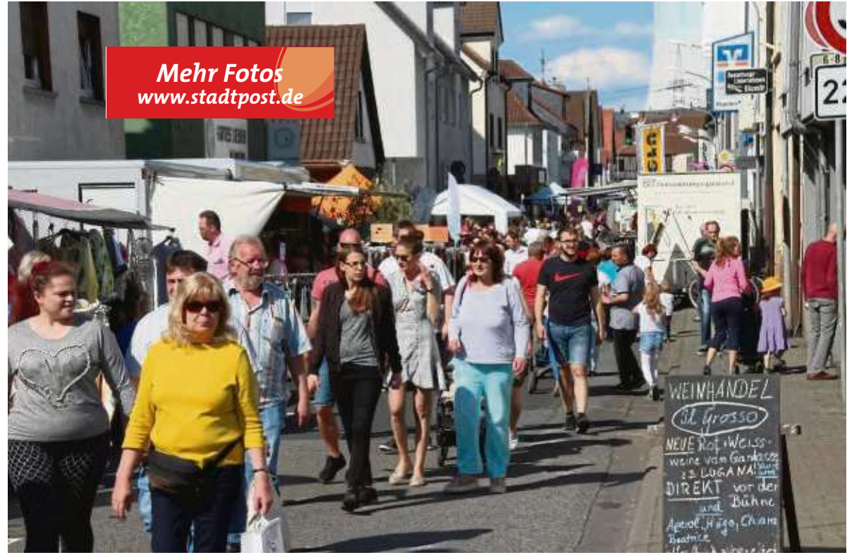
Großer Andrang beim 41. Hainburger Markt an den drei Veranstaltungstagen mit vielen verschiedenartigen Angeboten entlang der Offenbacher Landstraße.