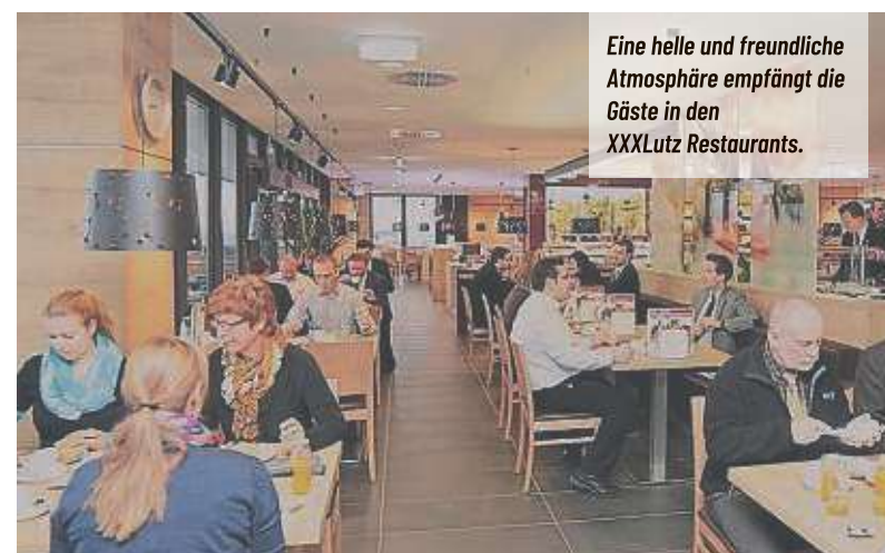
Eine helle und freundliche Atmosphäre empfängt die Gäste in den XXXLutz Restaurants.