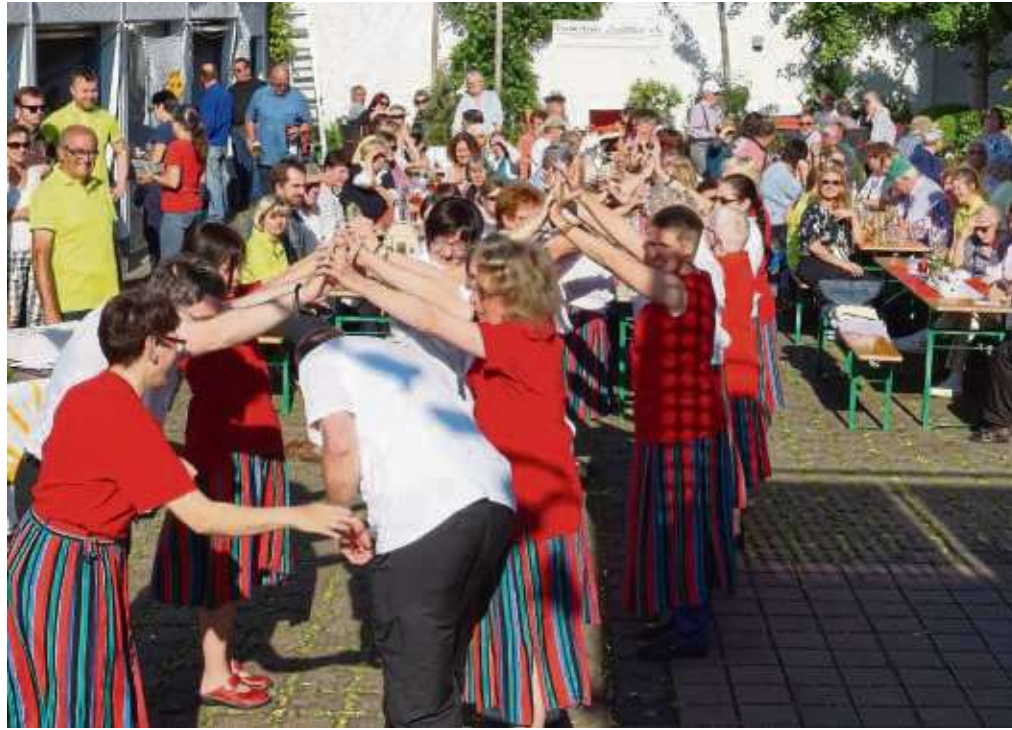
„Dieses Jahr find' ihr beim Lichtblick hessisch Esse un gut Musik“ war das Motto des Sommerfestes vom Förderkreis „Lichtblick“, welches auf dem Außengelände des Hotel Elysee in Seligenstadt stattfand. Einstudierte Tänze der Mitglieder und die Hessen-Rock-Band „Schwarzwurz“ hatten die zahlreichen Besucher zu einer Reise durch das schöne Hessenland eingeladen.

T: Super, dann seid alle begrüßt von eurem Turmmännche