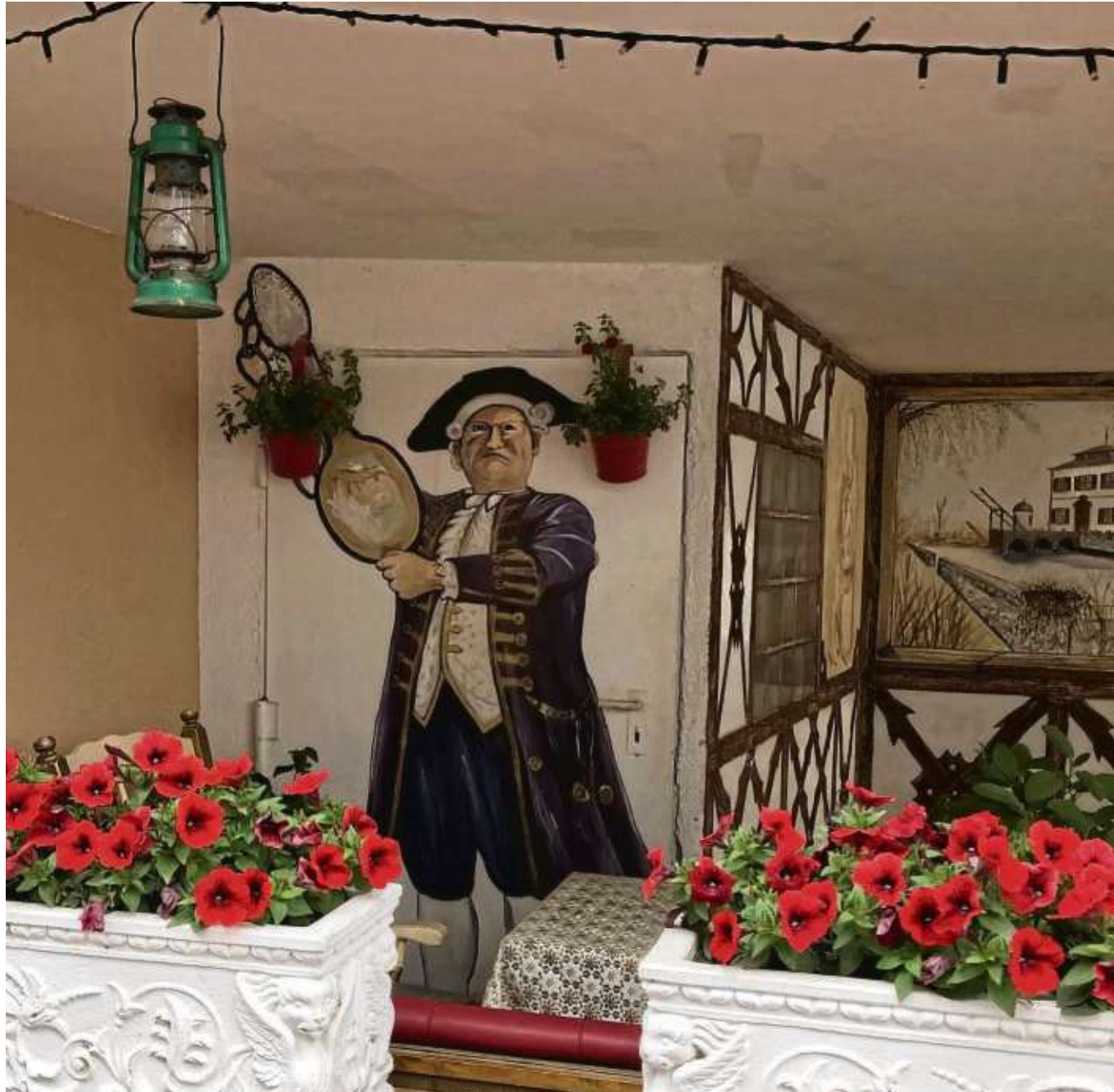
Allgegenwärtig ist das Geleit im Städtche. Und in manchen Ecken der Altstadt sollte man seine Augen offen halten, um von der Straße aus Motive zu finden wie diese. Auswärtige Besucher finden mitunter die tollsten Fotomotive, aber auch echte Selsestädter begeistern mit tollen „Hinguckern“. Immer wieder veröffentlicht auch das Seligenstädter Heimatblatt solche Schmuckbilder.

Seligenstadt (znd) – Die Bilderreise durch Seligenstadt („Blende 8 - die Sonne lacht“) mit Matthias Neubauer in der Kulturreihe „Zu guter Letzt“, vorgelesen für Freitag, 31. Mai, fällt aus. Darüber informiert das Stadtmarketing.