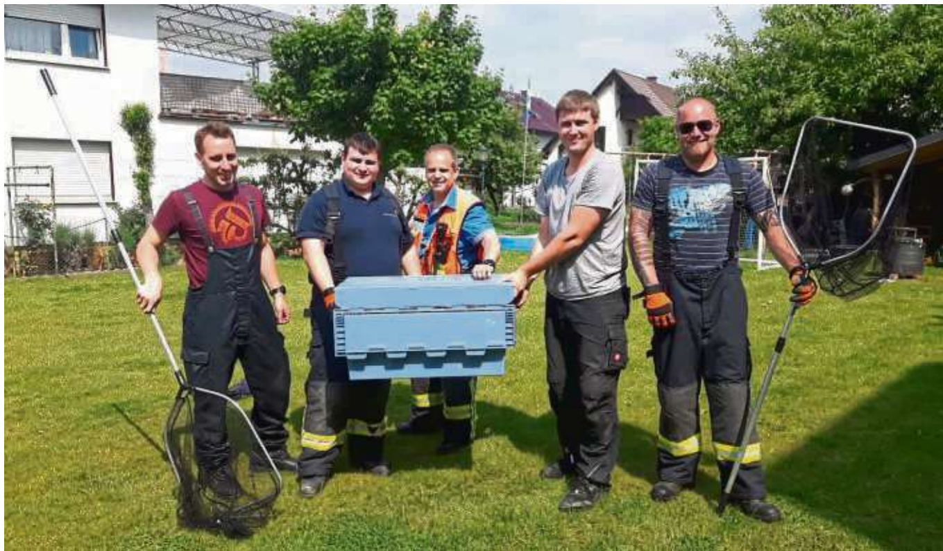
Schwierig war's erst mal, kompetentes Personal zu finden und dann noch an den Ort des Geschehens zu holen. Diese Kameraden der Freiwilligen Feuerwehr Zellhausen freuten sich nach etlichen Minuten über einen „guten Fang“.