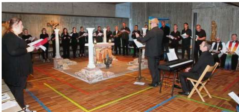
Ein neues Gottesdienstformat im Dekanat Seligenstadt stellte die Gemeinde St. Marien mit dem „Evensong“ in der Kirche St. Marien vor. Es handelt sich dabei um das Abendgebet der anglikanischen Kirche. Den musikalischen Part übernahm ein Projektchor aus dem Musikzentrum St. Gabriel. beko/Foto: ha