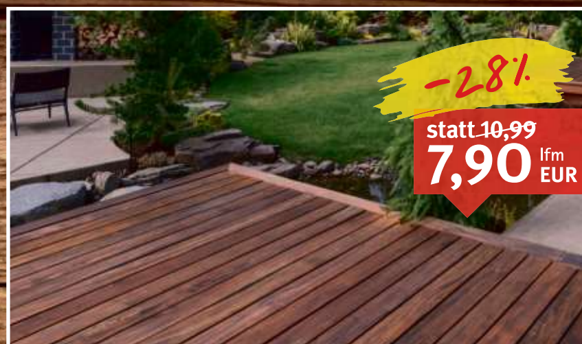
Terrassendiele Cumaru glatt/glatt, Maße: 21 x 145 mm, Längen: 215–545 cm