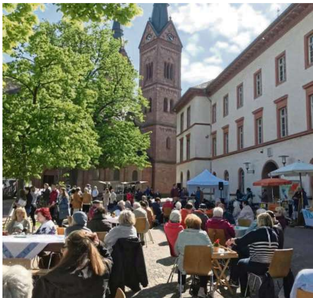
Immer wieder gibt es Veranstaltungen an der ehemaligen Hans-Memling-Schule im Schatten der Einhardbasilika.

Beide Texte sind online unter www.Freunde-HMS.de verfügbar.