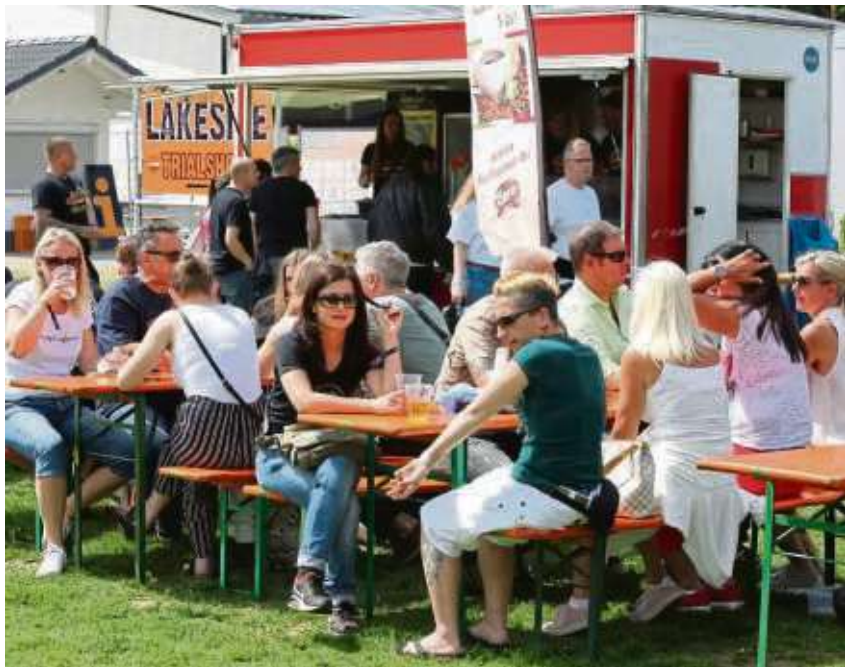
Treffpunkt „Marktplatz“ war angesagt bis zum offiziellen Abschluss der Lakeside-Bikedays in Mainhausen.