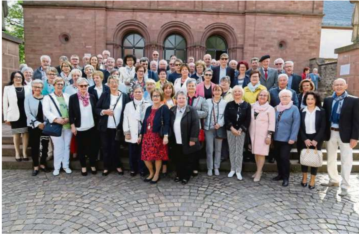
Jahrgangstreffen hatte kürzlich der Jahrgang 1948/1949 Seligenstadt. Vor der Basilika gab's ein Gruppenfoto

frischem Popcorn bedienen, während der Festbetrieb beginnt. Dabei ist beim Kirchenchor für zünftiges Essen (auch für Vegetarier), kühle Getränke und freundliche Bedienung gesorgt. Sicher werden auch einige Lieder angestimmt und mit Anekdoten auf die 50 Jahre des Bestehens zurückgeblickt. Übrigens: Über neue Sänger/innen (alte und junge, auch ohne Vor-Erfahrung) im Kirchenchor freuen sich die Verantwortlichen. Mit Dirigent Matthias Herr probt der Chor montags von 19.30 bis 21 Uhr im Pfarrheim. Einfach mal dort vorbeikommen.