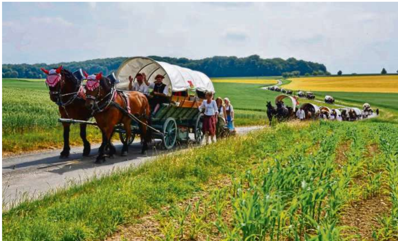
Erstmals nach mehr als 200 Jahren startete am 31. Mai 2003 ein Zug mit Kaufleuten und ihrem Geleit von Nürnberg in Richtung Frankfurt, der nun alle vier Jahre stattfindet. Am Samstag, 1. Juni, startet der Kaufmannszug nun in Augsburg.

Start am 1. Juni in Augsburg / Wieder tägliche Berichte im Internet