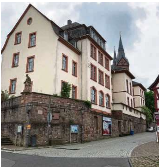
Immer wieder im Blickpunkt von Diskussionen: Die ehemalige Hans-Memling-Schule an der Basilika.

*Sie erhalten: Euro 50,- Nachlass beim Kauf einer kompletten Brille in Sehstärke ab Euro 200,- Euro 100,- Nachlass beim Kauf einer Brille in Sehstärke ab Euro 400,-. Dieses Angebot gilt bis 29.06.2019 und ist nicht mit anderen Sonderaktionen kombinierbar. Wir freuen uns auf Ihren Besuch in einer unserer SCHWIND Filialen in: Alzenau, Aschaffenburg, Halbach, Hösbach, Kleinostheim, Miltenberg, Obernburg, Seligenstadt. SCHWIND SEHEN & HÖREN GmbH · Mainparkstraße 12 · 63801 Kleinostheim · Telefon 0 60 27 / 508-313 · www.schwind-sehen-hoeren.de