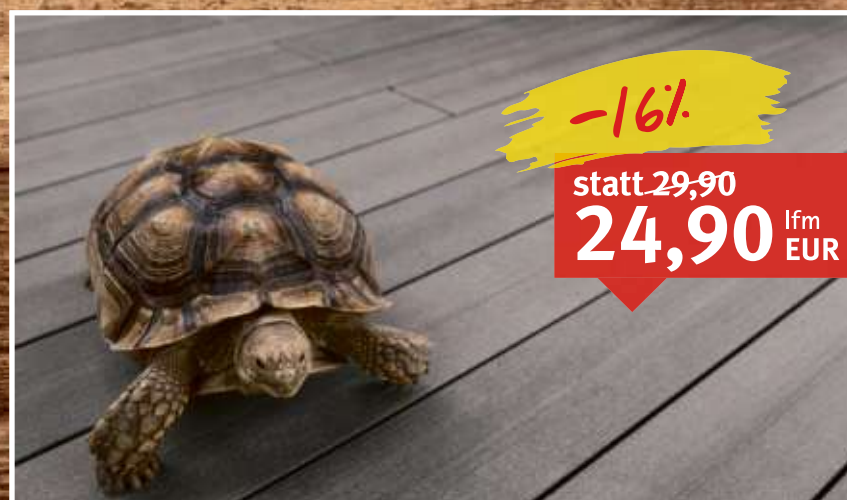
WPC-Terrassendiele „Signum Jumbo“ tonka Massivprofil, einseitig gehobelt, Maße: 21 x 242 mm, Länge: 420 cm