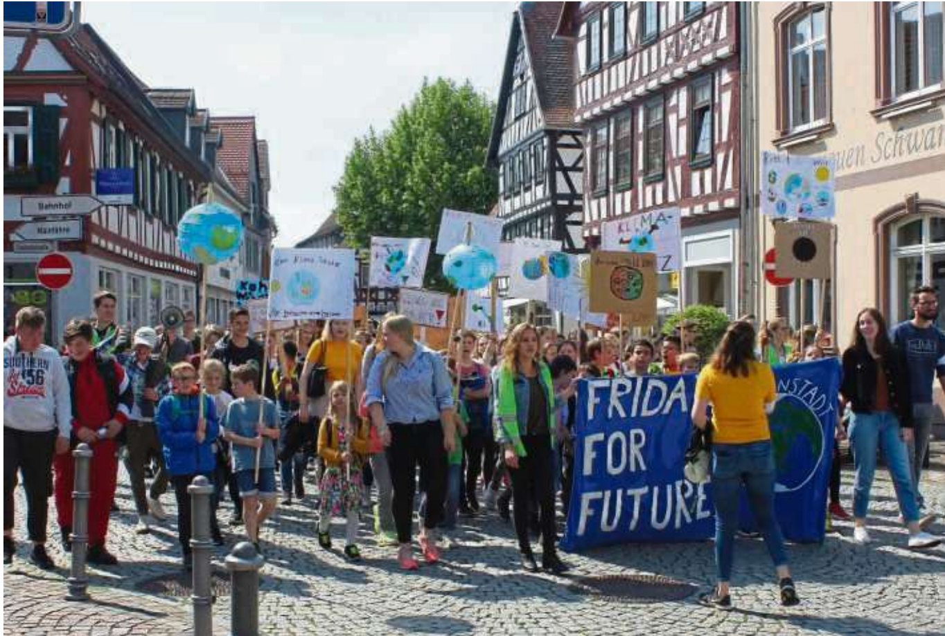
Rund 200 Teilnehmer wirkten bei der dritten „Fridays for Future“-Demonstration in Seligenstadt mit und äußerten bei der Kundgebung auf dem Marktplatz dann auch ihre Zukunftssorgen über die aktuelle Klimapolitik.

Rund 200 Teilnehmer bei der dritten „Fridays for Future“-Demonstration in Seligenstadt