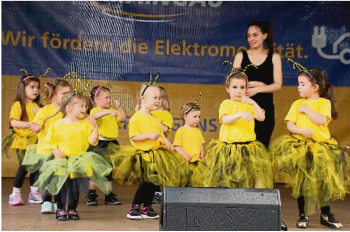
Auch die jüngsten Hainburger, die „Tanzmäuse“, waren auf der Bühne an der Eisenbahnstraße mit von der Partie beim 41. Hainburger Markt.