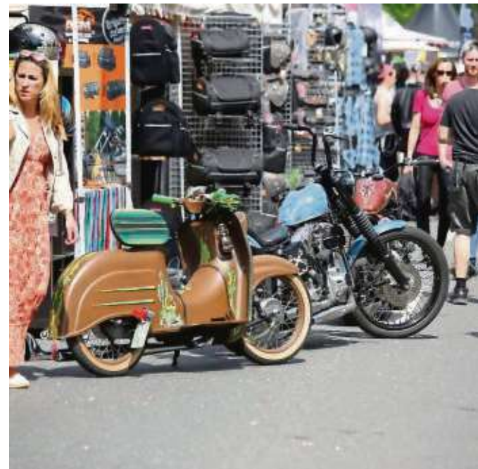
Natürlich auch wieder im Blickpunkt an zahlreichen Ständen: Die Unikate auf zwei Rädern.