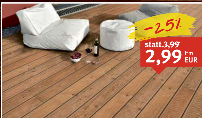
Terrassendiele Douglasie geriffelt/glatt, Maße: 20 x 120 mm, Länge: 300 cm