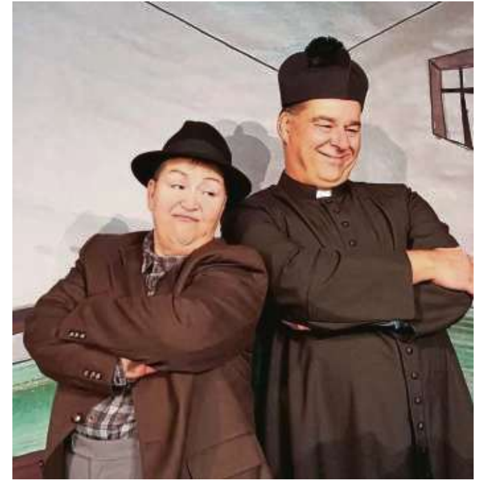
Mit dem Stück „Don Camillo und Peppone“ gastiert das Theater Nedelmann bei „Kultur am Fluss“.

einem Vierteljahrhundert mit Musik, Gesang, Literatur und Theater jährlich mehrere hundert Besucher an das Klein-Krotzenburger Mainufer. Veranstaltet wird der Event von der „Projektgruppe Kultur am Fluss“ der Pfarrgemeinde St. Nikolaus. Deren Mitglieder bieten den Besuchern auch wieder einen kleinen Imbiss und kühle Getränke. Der Eintritt zu „Kultur am Fluss“ ist frei. Ermöglicht wird das dank einer Reihe von Sponsoren. Bei schlechtem Wetter ziehen „Don Camillo und Peppone“ in den Pfarrsaal um.