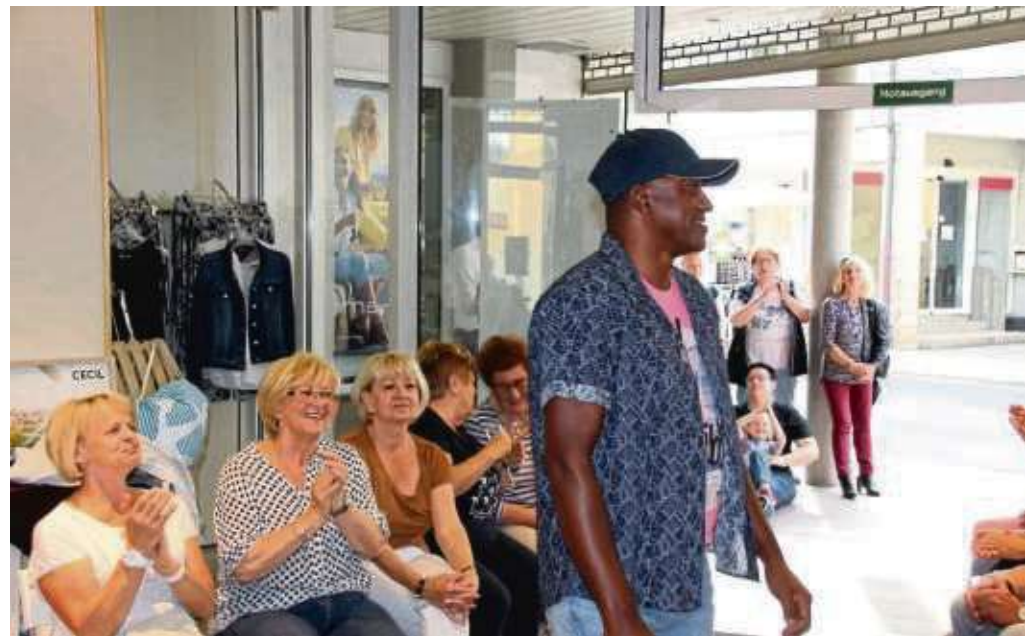
Eine Indoor-Sommer-Modenschau bot das Hainburger Modehaus Blumör gleich zum Start des 41. Hainburger Marktes.