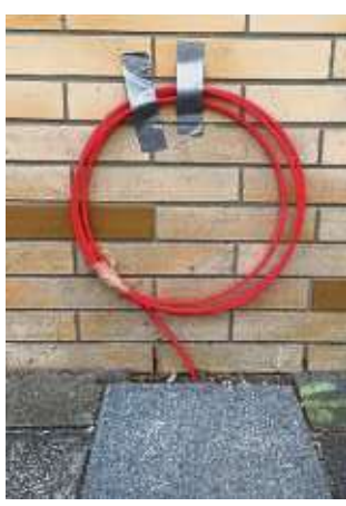
Bauphase in Mainhausen abgeschlossen?!

Nun bleibt noch etwas Zeit für Klein-Welzheim, während Froschhausen laut Mitteilung auf der