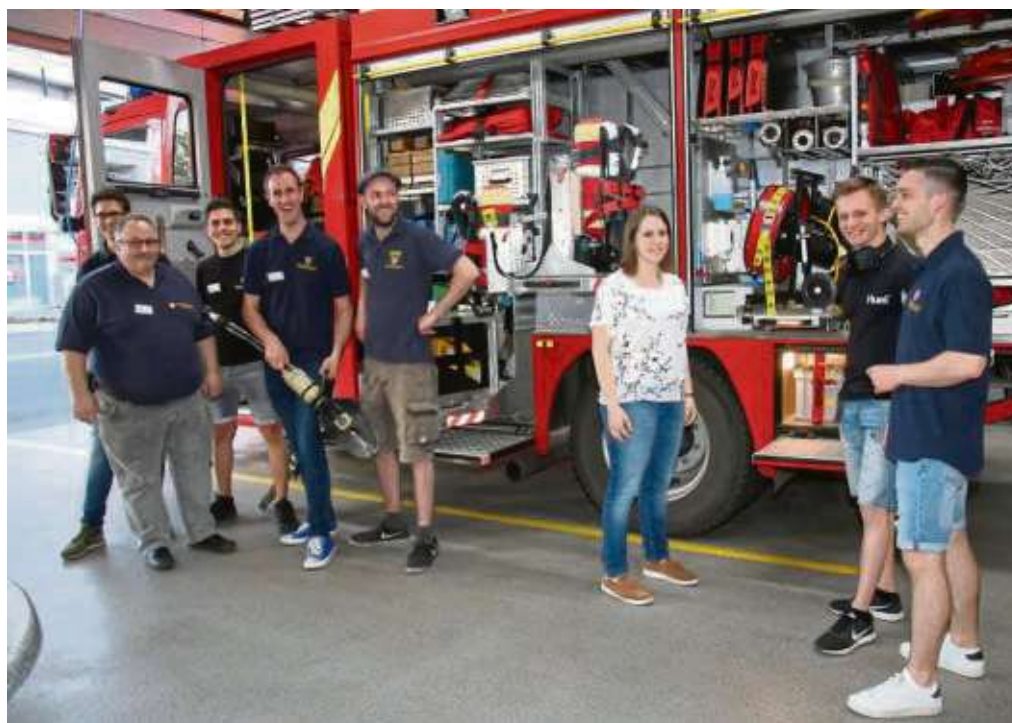
Nur wenige Interessierte kamen, um sich über die Arbeit der Freiwilligen Feuerwehr Froschhausen informieren zu lassen.

Froschhausen (zbo) – Dem Thema Mitgliederwerbung und -bindung gab die Freiwillige Feuerwehr Froschhausen mit einem gleichnamigen Arbeitskreis (AK) im Sommer ein Forum. Ziel war es, Froschhäuser Bürger für den aktiven Dienst in der Feuerwehr zu begeistern, indem der AK in der Öffentlichkeit über die Vorzüge dieses Hobbys informiert. In einem ersten Schritt wollte der Arbeitskreis von den Aktiven der örtlichen Wehr wissen, warum sie sich engagieren. Der ausgeprägte Teamgeist in der Mannschaft und die Möglichkeit, mit dem Dienst, anderen Menschen zu helfen, stellten sich klar als wichtigste „Motivationstreiber“ heraus. Darüber hinaus zeigte die Befragung, dass die Aktiven das Hobby Feuerwehr im Vergleich zu anderen Hobbys als besonders abwechslungsreich empfinden. Im zweiten