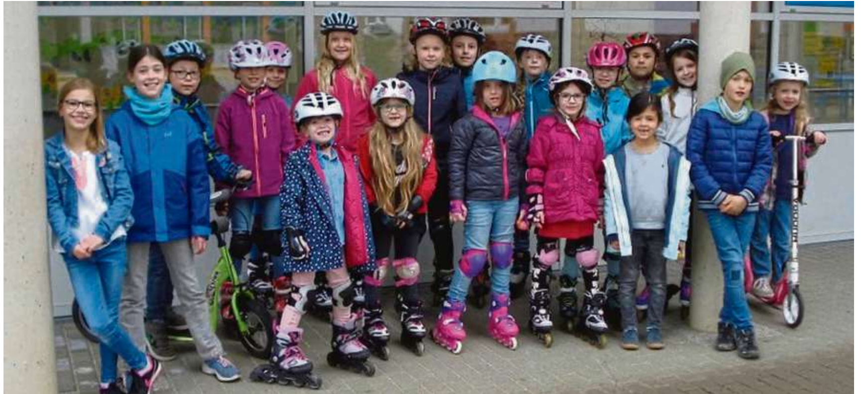
Die Ferienbetreuung in der Schülerburg Mainflingen fand nun wieder statt. Hierzu trafen sich 40 Kinder zum täglichen Spielen, Basteln und Toben. Gleich zu Beginn stand dann ein Ausflug zum Spielplatz in Dettingen auf dem Programm. Bei schönstem Frühlingwetter wurde hier geklettert und im Sand gebuddelt. Zudem gab es noch eine Osterbastelwerkstatt für die Kids. Dort konnten Eier bemalt oder Osterkarten, -hasen oder Eierbecher gebastelt werden. Es durften zudem eigene Inliner oder Roller mitgebracht werden.

>> Weitere Infos auf www.mainhausen.de (zja)