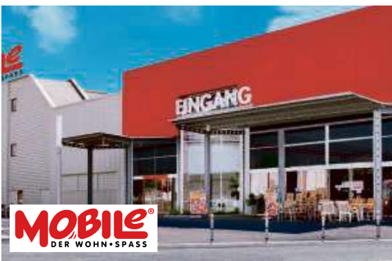
EGELSBACH, DIREKT AN DER A661/B3