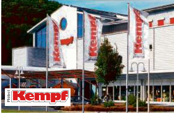
BAD KÖNIG/ZELL, DIREKT AN DER B45