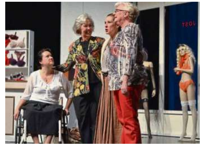
Die Kultkomödie „Altweiberfrühling“ wird am Samstag und Sonntag im Riesensaal aufgeführt. Foto: Veranstalter/p

Da ist es dann etwas frustrierend, wenn zu einem Infoabend eingeladen wird und das Interesse sehr gering ist. Nicht nur in Froschhausen soll's mitunter so sein. Türhänger alleine haben die Leute bei herrlichem Wetter nicht hinterm Ofen vorgelockt. Mitgliederwerbung ist keine leichte Aufgabe, wenn's nicht brennt... (beko)