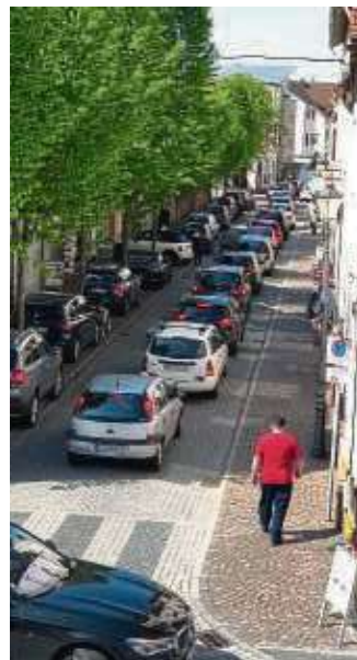
Staus bis in die Innenstadt waren Folge eines Unfalls.

Der Ford-Lenker sowie der 55-Jährige Lasterfahrer blieben nach bisherigen Erkenntnissen unverletzt. An allen drei Fahrzeugen entstand erheblicher Sachschaden, sodass diese nicht mehr fahrbereit waren. Aus dem Lastkraftwagen traten große Mengen Kraftstoff aus, der teilweise ins Erdreich eindrang. Während der Rettungs- und Aufräumarbeiten blieb die Autobahn 3 in Richtung Köln bis 9.45 Uhr voll gesperrt. Durch den Rückstau kam es auch auf der Autobahn 45 zu Verkehrsbehinderungen. Die Aufräumarbeiten dauerten bis 13 Uhr an. In dieser Zeit wurde der Verkehr auf zwei Spuren an der Unfallstelle vorbeigeleitet.