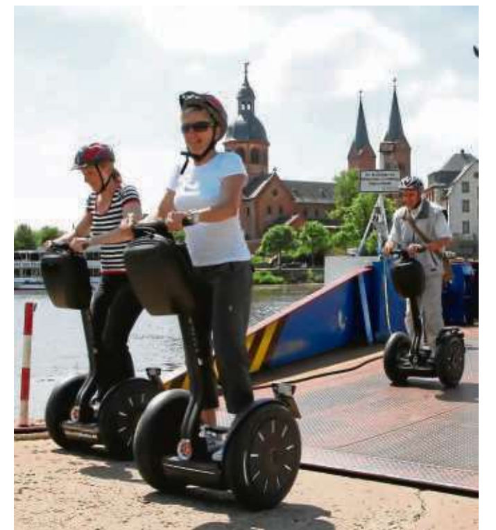
Die Segway-Touren in Seligenstadt starten wieder an diesem Sonntag um elf Uhr ab Fährgrasse Klein-Welzheim.

Seligenstadt (beko/red) - Einhardstadt mit ihren Sehenswürdigkeiten und über die wundervolle Umgebung. Bei einem kurzen Halt in der historischen Altstadt können die Teilnehmer verweilen und sich stärken, bevor es an den Ausgangspunkt der Tour zurückgeht“, wirbt Erster Stadtrat Michael Gerheim. Nähere Informationen unter www.unser-seligenstadt.de oder Tourist-Info der Stadt Seligenstadt: ☎ 06182 87177, E-Mail touristinfo@seligenstadt.de , Buchungen unter: www.cityfloater.de