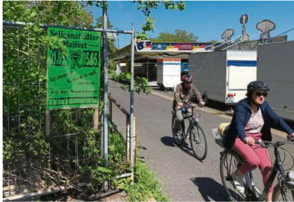
Seligenstädter Maifest ist wieder vom heutigen Mai-Feiertag an bis zum Sonntag auf den Mainwiesen. Schon Tradition ist es, dass dort Autoscooter, Kinderkarussell und andere Aktionen angesagt sind. Veranstalter ist der Schaustellerbetrieb Gustav Michel.

In der Hoffnung, dass sich vielleicht etwas ändert. Herzlichst euer Turmmännche