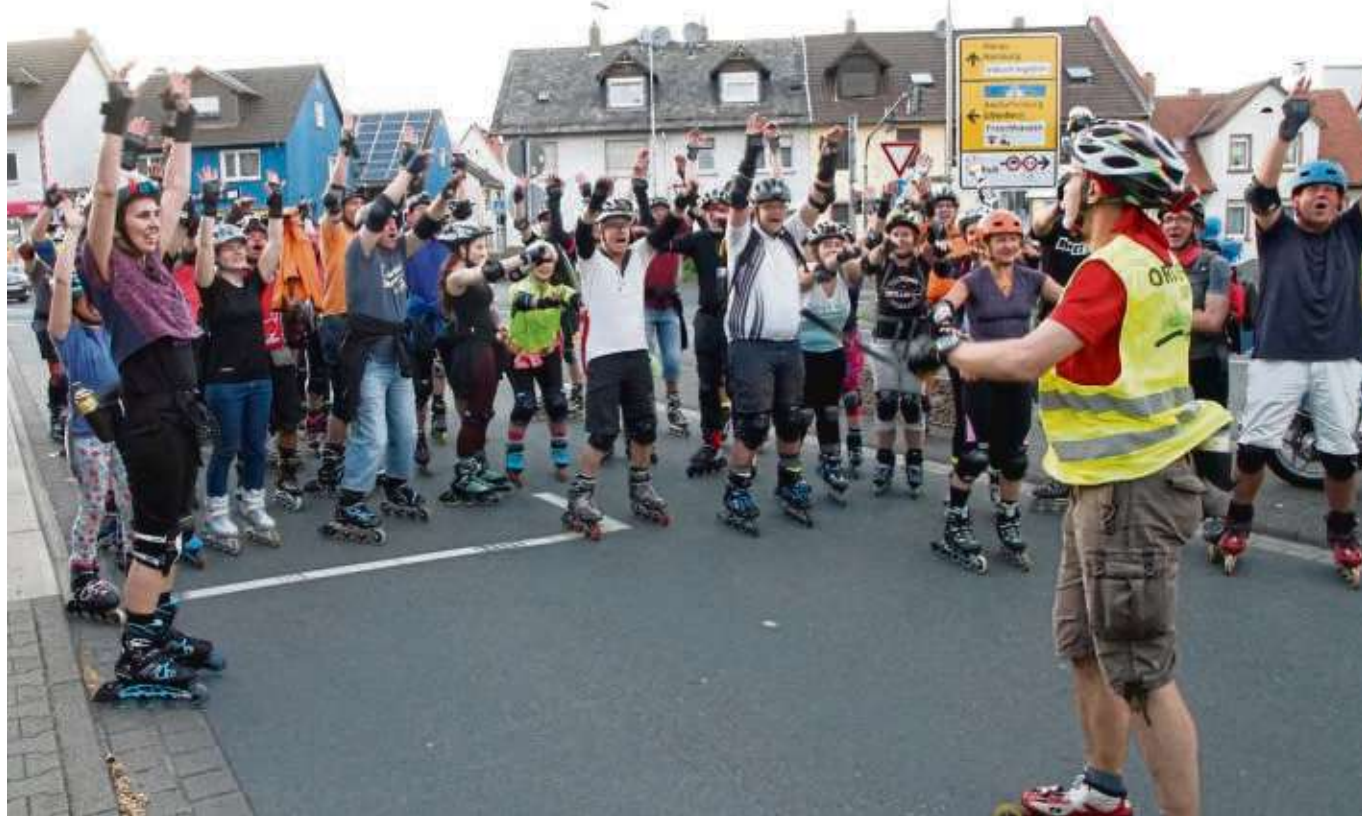
Gelungener Auftakt der Seligenstädter Skatenight-Saison. Bei mäßigem Wetter fanden sich am Donnerstagabend immerhin rund 100 Sportler auf dem Kapellenplatz ein, um sich auf eine kleinere Tour von rund 17 Kilometern nach Froschhausen sowie kreuz und quer durch die Kernstadt zu begeben. Die Begleitung des Trosses übernahmen wieder Polizei (Wagen und Motorräder) sowie das Ordnungsamt der Stadt. Weitere Termine: Immer donnerstags am 23. Mai, 27. Juni, 25. Juli, 15. August und 5. September jeweils um 20 Uhr ab Kapellenplatz. Ausführlichere Informationen und die Streckenpläne der Skatenights sind auf dem Stadtportal unter www.unser-seligenstadt.de zu finden.

rüber gehe. „Auch wer bisher selten gebetet hat, darf es einmal ausprobieren, sich eine Stunde im Gebetsraum eintragen und sich positiv überraschen lassen“, so die Veranstalter der Kirchengemeinde. Der Raum wird so hergerichtet, dass genügend Impulse für das Gebet zu finden sind: Gebetswand, Gebetsbuch, Klagemauer, Musikanlage, Instrumente oder Kerzen regen zu ganz verschiedenen Arten des Gebets an. Es liegt ein Gebets-Wochenplan im Gemeindezentrum aus. Weitere Infos unter 06182-27527 oder info@nazarener-seligenstadt.de .