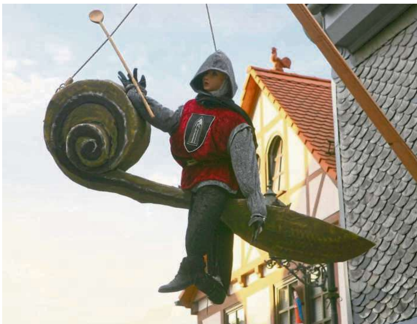
Beim Stadtfest während der Geleitswochen vor fünf Jahren entstand dieses Foto. Derzeit sind die Verantwortlichen des Heimatbundes wieder dabei, das Geleitsfest und die Geleitswochen für 2019 vorzubereiten.

Interesse haben, eine Hofbewirtschaftung zu übernehmen, können sich bis spätestens 13. Mai beim Arbeitskreis Geleitsfest unter c.colombo@heimatbund-seligenstadt.de melden. Zu einer ersten vorbereitenden Sitzung treffen sich die Teilnehmer und Interessenten am darauffolgenden Donnerstag, 16. Mai, um 19 Uhr in der Zunftstube des Heimatbundes, Am Eichwald 7.