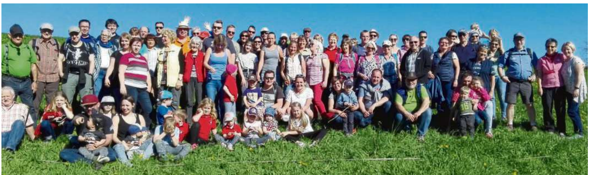
Karfreitagstour verbindet Jung und Alt: 86 Personen, einschließlich 22 Kinder, haben mit dem Wanderclub Edelweiß Seligenstadt bei gutem Wetter einen tollen Ausflug in den Spessart erleben dürfen. Ein Doppeldeckerbus brachte alle Teilnehmer nach Feldkahl. Nach einer einstündigen gemütlichen Wanderung (es waren Kinder von zwei, drei Jahren dabei, die die komplette Strecke gelaufen sind), gab es auf der Pferde-Ranch ein Karfreitags-Büfett (alles von Edelweißern selbst zusammengestellt). Nach dem Sonnenbaden auf der Wiese konnte jeder, der wollte, eine Planwagen-Rundfahrt mitmachen und alle wollten natürlich mit. Für die Kinder gab es Stockbrot und die Erwachsenen machten es sich in der Sonne bei einem Gläschen Wein gemütlich.