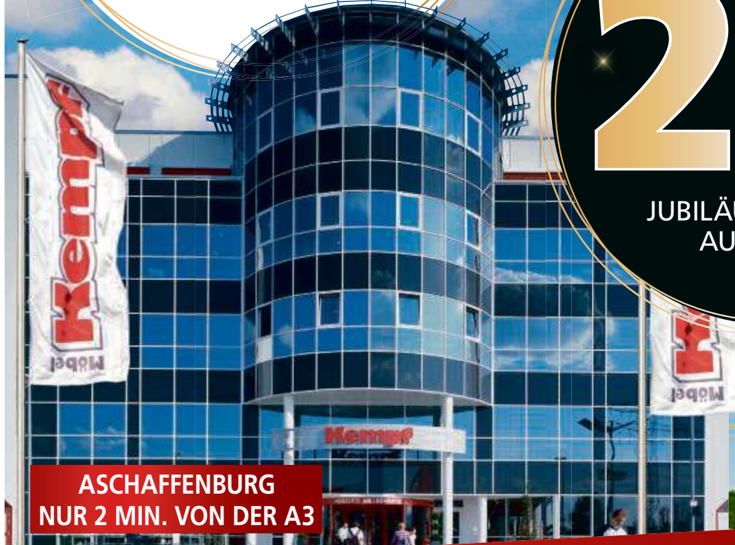
ASCHAFFENBURG NUR 2 MIN. VON DER A3