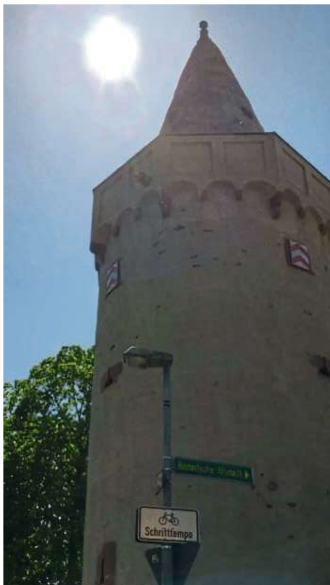
Sonne pur und strahlend blauer Himmel - so war's gestern und soll es heute wieder sein, danach ist ein Tief angesagt.