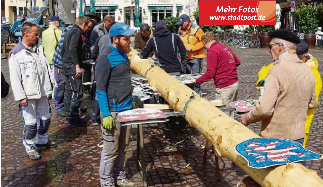
Das Symbol der Seligenstädter Bauhandwerker, der Zunftbaum, wird vorbereitet und steht seit Samstag wieder auf dem Marktplatz vor dem Rathaus.

Kreis (red) – Die Kreisverwaltung in Dietzenbach bleibt am Freitag, 10. Mai, wegen des Betriebsausfluges ganztägig für den Publikumsverkehr geschlossen. Bürger, die an diesem Tag ein Kfz zulassen wollen, werden gebeten, auf die Außenstellen in Langen, Mühlheim und Seligenstadt auszuweichen.