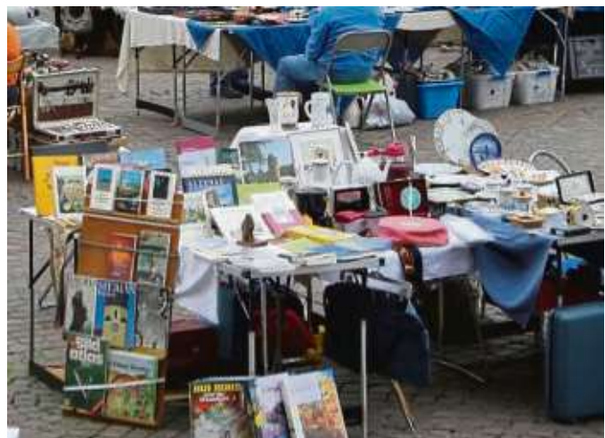
Anmelden kann man sich für die Flohmarkt im Verlauf des Hainburger Markts.

Standplatzkarten können nicht zurück genommen werden. Eine Karten-Reservierung ist nicht möglich. Die Flohmarktzeiten sind an beiden Tagen jeweils ab neun Uhr. Der Aufbau beginnt ab acht Uhr. Flohmarktende ist jeweils um 16 Uhr. Diese Zeiten sind einzuhalten. Zugelassen werden nur Stände mit Privatartikeln. Die Nummerierung der Standplätze erfolgt rechtzeitig. Im gesamten Flohmarktbereich besteht Parkverbot. Der Gewerbeverein Hainburg bittet die Flohmarktteilnehmer den jeweiligen Standplatz auch wieder sauber und aufgeräumt zu verlassen.