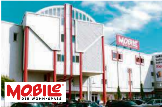
SULZBACH, BEI ASCHAFFENBURG