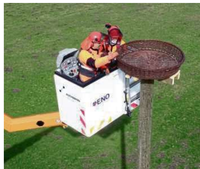
Ab ins Körbchen! Die Störche dürfen jedenfalls kommen.

Deutscher Wald Heusenstamm (SDW) in einer gemeinsamen Aktion rund 45 Vogelschutzarmaturen auf der 110.000 Kilovoltleitung (110 kV) auf dem Patershäuser Feld im Heusenstammer Wald befestigt worden. Die ENO ist eine hundertprozentige Tochtergesellschaft der Energieversorgung Offenbach AG (EVO). Zu ihren Kernaufgaben zählen Planung, Bau, Betrieb und Instandhaltung der Verteilernetze inklusive Netz- und Hausanschlüssen.