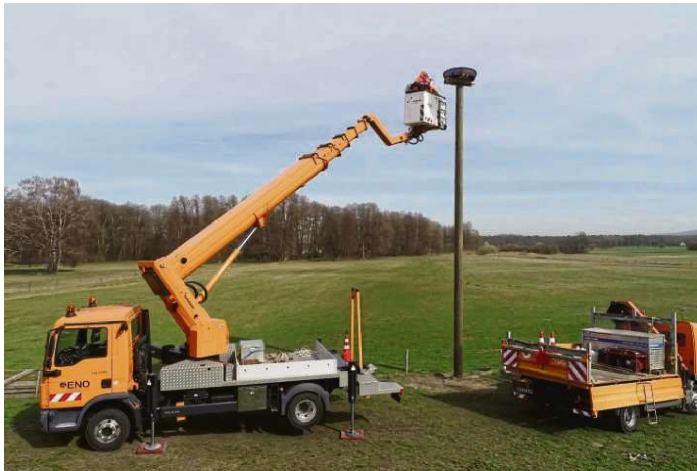
In zehn Meter Höhe haben dieser Tage Beschäftigte der Energienetze Offenbach GmbH (ENO) einen kreisrunden Weidenkorb an einem extra für diesen Zweck aufgestellten Mast befestigt.

– genauso wie in Mainhausen. Denn auch dort ist ein neues Storchennest entstanden. In zehn Meter Höhe haben dieser Tage Beschäftigte der Energienetze Offenbach GmbH (ENO) einen kreisrunden Weidenkorb an einem extra für diesen Zweck aufgestellten Mast auf einem Feld des Ortsteils Zellhausen der Gemeinde Mainhausen befestigt. Der Horst soll als Brutstätte für Störche dienen. Der Offenbacher Netzbetreiber entsprach damit einer Bitte des Ortsverbands Seligenstadt, Hainburg und Mainhausen des Bundes für Umwelt- und Naturschutz Deutschland (BUND). Laut dem BUND-Ortsverband stehen Störche noch immer auf der roten Liste der gefährdeten Arten. In den vergangenen Jahren hatten sich dem BUND zufolge nur wenige Störche zum Nisten in dieser Gegend niedergelassen. Nach wie vor fehlten neben den geeigneten Nestplätzen auch die passenden Lebensräume. Störche bevorzugten vor allem Sümpfe, feuchte Wiesen, flache Gewässer und offene Landschaften. Mit dem neuen Standort hofft der Ortsverband eine ideale Umgebung mit einem hervorragenden Nahrungsangebot gefunden zu haben, das einen weiteren Anreiz zum Nisten In den vergangenen Jahren hat die ENO immer