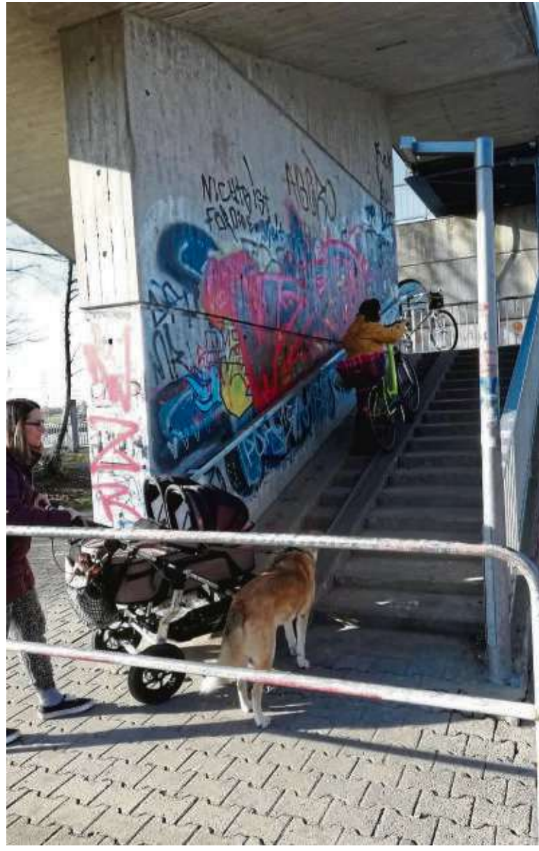
Beschwerlicher Aufstieg an der Klein-Krotzenburg Schleuse: Mit Kinderwagen und dem Rad ist es nicht leicht, die Treppen zu überwinden.

angeregten Ausbau des Schleusenstegs anzugehen. Der Aufstieg soll ähnlich gestaltet werden wie der Steg in Mainhausen, wo Radfahrer, Rollstuhlfahrer, Fußgänger, Familien mit Kindern und Kinderwagen ohne Hilfe über eine ausreichend dimensionierte Rampe den Schleusensteg überqueren können. Die Maßnahme kann mit bis zu 80 Prozent der Bau- und Planungskosten vom Land Hessen bezuschusst werden. Die Hainburger Grünen haben dazu einen Antrag in das Gemeindeparlament eingebracht, der in der nächsten Ausschusssitzung des Bau-, Verkehrs-, Wirtschafts- und Umweltausschusses beraten werden soll.