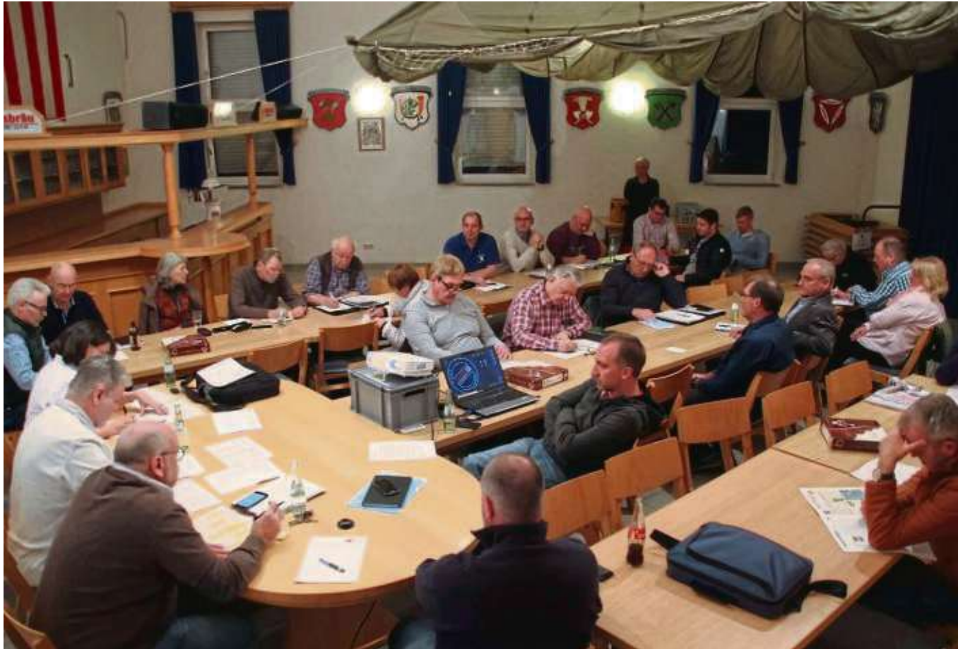
Zuhören und mitschreiben: Die Vorstellung und Abstimmung der Aktivitäten und Veranstaltungen der Vereine funktionierte reibungslos beim Treffen der Vereinsvertreter.

Mainhausen (red) – Der Garten der Kindertagesstätte in Mainhausen ist frühlingfertig. Dazu kamen motivierte Eltern, Kinder und sogar Großeltern in die Kita „Haus der kleinen Kleckse“. Bei wunderschönem Wetter wurde Hand in Hand einiges geschafft. Beete und Hecken wurden von Unkraut befreit, Blumen, Sträucher und Kletterhecken wurden angepflanzt, Bienenwiesen, Sonnenblumen ausgesät. Auch der Frühjahrsputz rund ums Haus und unter den Hecken ist nicht zu kurz gekommen. Doch was die Kinder besonders erfreut, sind die drei neuen Tipis, die durch Äste, die noch vom Herbstbaumschnitt übrig waren, entstanden sind. Von den Tipis stehen zwei im Vordergrund und einer hinter dem Haus. Ein neuer Natur-Spielbereich als Unterschlupf und ein Ort zum Träumen und Wohlfühlen. Die Raupe auf dem Boden, die visuell dazu helfen soll die Feuerwehreinfahrt zu bemerken und freizulassen, und auch die mit der Zeit verblassten Marienkäfersteine bekamen einen neuen Anstrich und erscheinen in neuem Glanz. Zur Stärkung nach der Arbeit gab es Quark-Käse-Taschen, Kaffee und Kuchen.