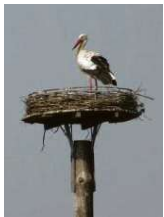
Dieser Storch ist in Seligenstadt schon heimisch.

Im Herbst des vergangenen Jahres erreichte die von der Mainhäuser SPD initiierte Unterschriftenkampagne „Babenhäuser Straße entschärfen – jetzt!“ insgesamt 821 Unterstützer, die eine bauliche Entschärfung von Gefahrenpunkten und eine Reduzierung des Lärms durch eine Sanierung der Straßendecke einfordern. Die Gemeinde hatte zuvor mehrfach vergeblich versucht, mit den übergeordneten Behörden entsprechende Maßnahmen in die Wege zu leiten. Selbst die Bereitstellung von eigenen Haushaltsmitteln brachte kein Ergebnis.