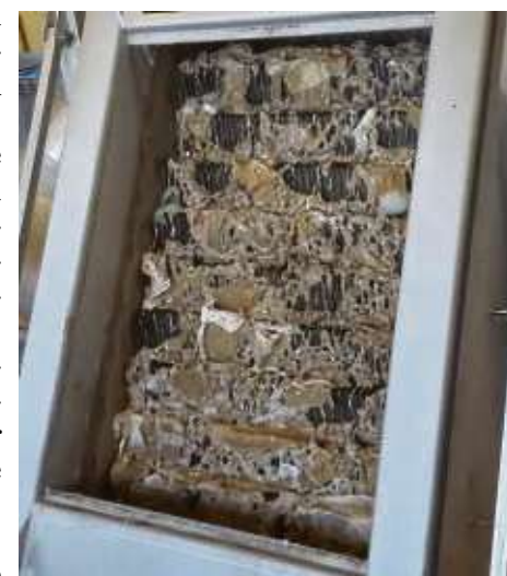
Ärgerlich: Feuchttücher im Pumpwerk.