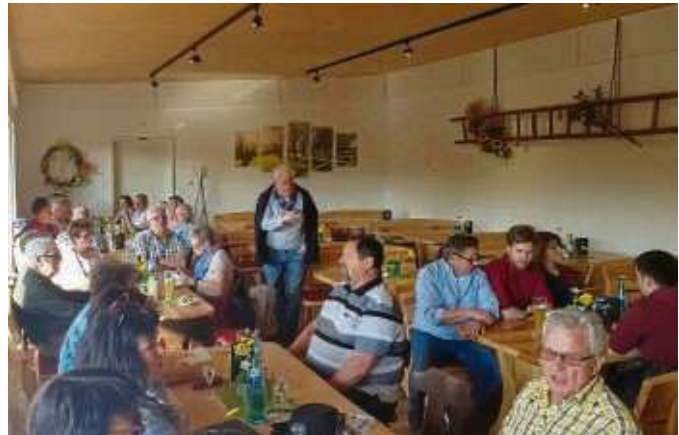
Auf großes Interesse stieß die Frühjahrswanderung der Gesellschaft der Freunde. Bei schönem sonnigen Wetter wanderten rund 40 Freunde von Seligenstadt zum Gemüsehof Wurbs in Klein-Auheim. Bei lockerer Stimmung und gutem Essen wurden auch ein paar Lieder gesungen und man ließ den Abend ausklingen.