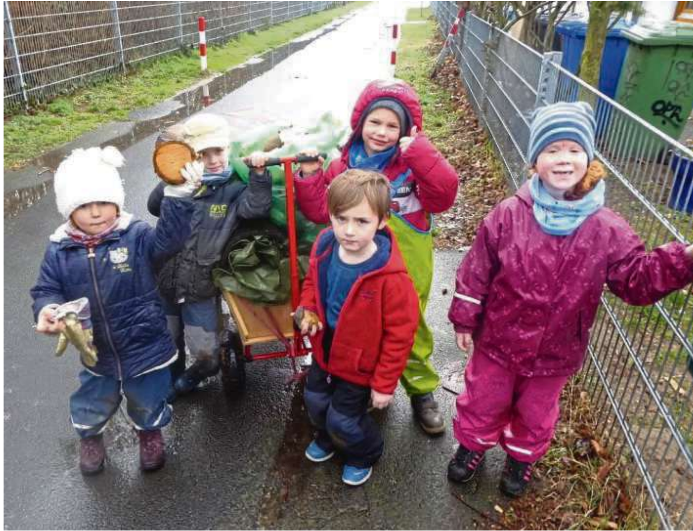
Die Seligenstädter Kindertagesstätte „die Wilde 13“ hat es sich von jeher auf die Fahne geschrieben, den Kindergartenkindern Nachhaltigkeit, Tierschutz und Achtsamkeit gegenüber unserer Umwelt zu vermitteln. Das Waldgebiet in der Nähe des Vereinsgeländes von Sportfreunden und Spielvereinigung gehört zum festen Forschungs- und Entdeckungsgebiet. Leider fanden die Kinder immer wieder jede Menge Müll an ihrem liebsten Spielort, was sie empörte. So begaben sich ganz im Sinne der „Fridays for Future-Bewegung“ bewaffnet mit Müllsäcken und Bollerwagen auf einen Waldspaziergang der etwas anderen Art. Gemeinsam beschlossen die Kinder das Umweltamt und den Bauhof der Stadt Seligenstadt zu informieren. Die Kinder selbst griffen zum Telefonhörer und bestellten die städtischen Mitarbeiter, um den Müllberg abholen zu lassen.

lichen Ladesäulen den Umstieg auf Elektrofahrzeuge erleichtern. Zudem setzt er ausschließlich auf Öko-Strom, damit die E-Mobilität auch wirklich Sinn ergibt. Die neuen Ladesäulen verfügen über jeweils einen Ladeplatz und sind rund um die Uhr verfügbar. Das Lade-Prozedere ist leicht: Wer zum ersten Mal tanken will, loggt sich mit seinem Mobiltelefon oder Tablet auf der EVO-Homepage ein, gibt Namen und E-Mail-Adresse an und erhält daraufhin ein Passwort. Alle Informationen hierzu finden sich auf der Ladesäule selbst. Mit dem Passwort können sich die Kunden daraufhin zum Tanken freischalten lassen. Über das Ende des Ladevorgangs werden die Kunden dann per E-Mail informiert. Der Vorgang dauert drei bis fünf Stunden bis der Akku zu 80 Prozent geladen ist. Auf der Homepage können die Kunden auch sehen, welche Ladesäule frei, belegt oder in Wartung ist.