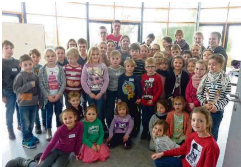
Die Kirche unter der Lupe: Das nahmen mehr als 40 Kinder, die am Kindertag in St. Marien teilgenommen haben. Vieles gab es dabei zu entdecken: Vom Taufbecken, über die beiden Altäre zu den Apostelleuchtern und einem Engel erkundeten die Kinder mit Interesse in Kleingruppen alles Stück für Stück angeleitet vom Kindertage-Team. Der Abschluss fand im Labyrinth der Unterkirche statt, wo die Kinder mit einer besonderen Geschichte inspiriert, wurden Aussagen über Gott zu treffen. Sie konnten ihre eigenen Vorstellungen dazu aufschreiben oder malen und hinterließen dabei ihre Spuren im Labyrinth.

der Band „The Ants“. Am Samstag, 06. April, wird als Bühnen-Act auch das junge Gesangstalent Orlando, bekannt aus der aktuellen Staffel „The Voice Kids“, auf der Bühne stehen. Alle Informationen zum Bühnenprogramm und den Teilnehmern sind zu finden unter www.fruehlingduft-handwerkskunst.de