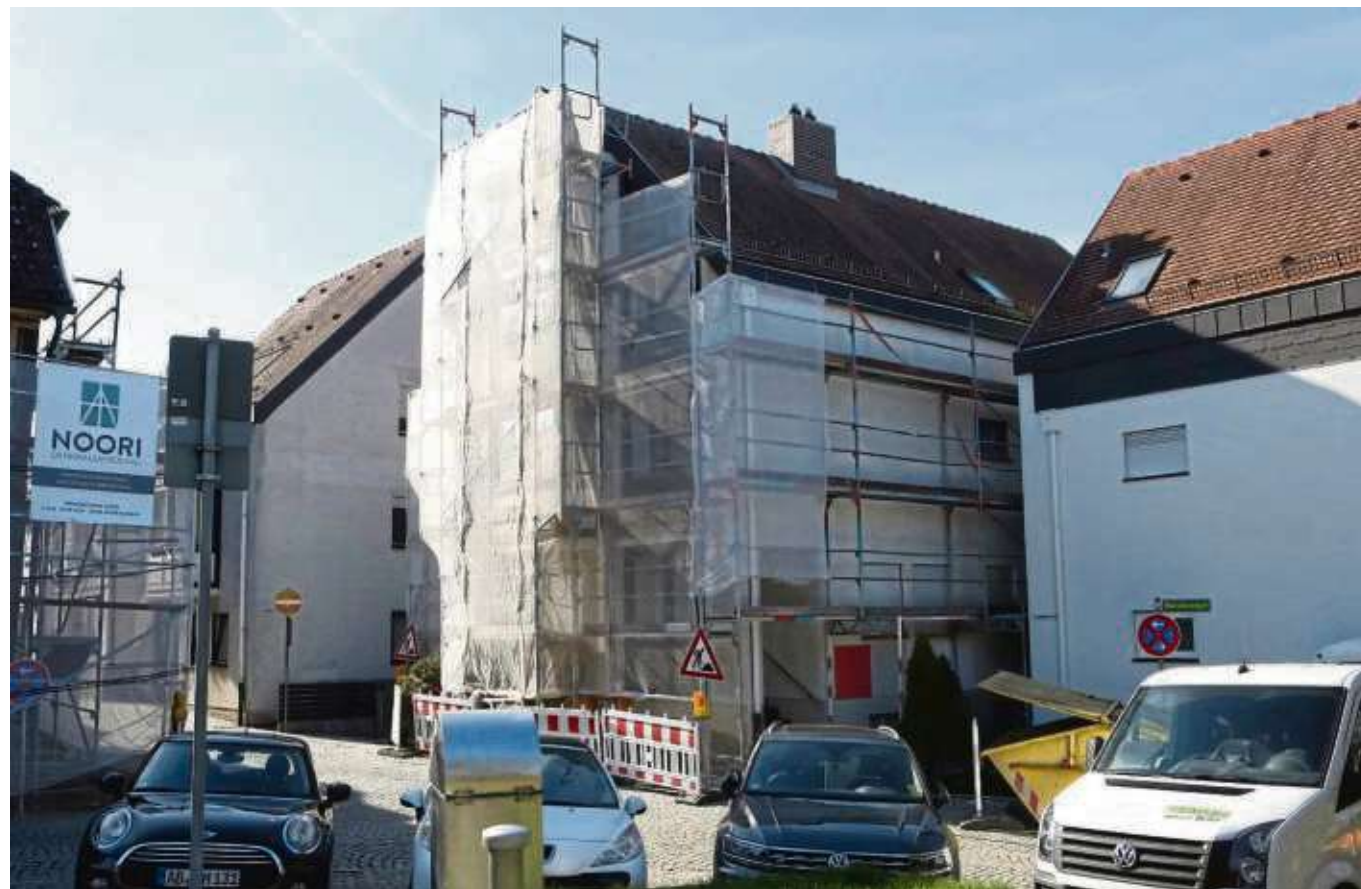
Auf Vordermann gebracht wird die städtische Seniorenwohnanlage an der Hospitalstraße. Spätestens im Jahr 2020, vielleicht auch schon dieses Jahr, sollen die Baumaßnahmen abgeschlossen werden.

und die nächsten Termine sind auf der Homepage https://kaethe-muench-basar.jimdo.com einsehbar. Der Erlös kommt dem Förderverein der Kita Käthe Münch zugute. Auf der Website des Vereins unter www.foerderverein-kaethe-muench.de sind alle Neuanschaffungen und Projekte für die Kita einsehbar.