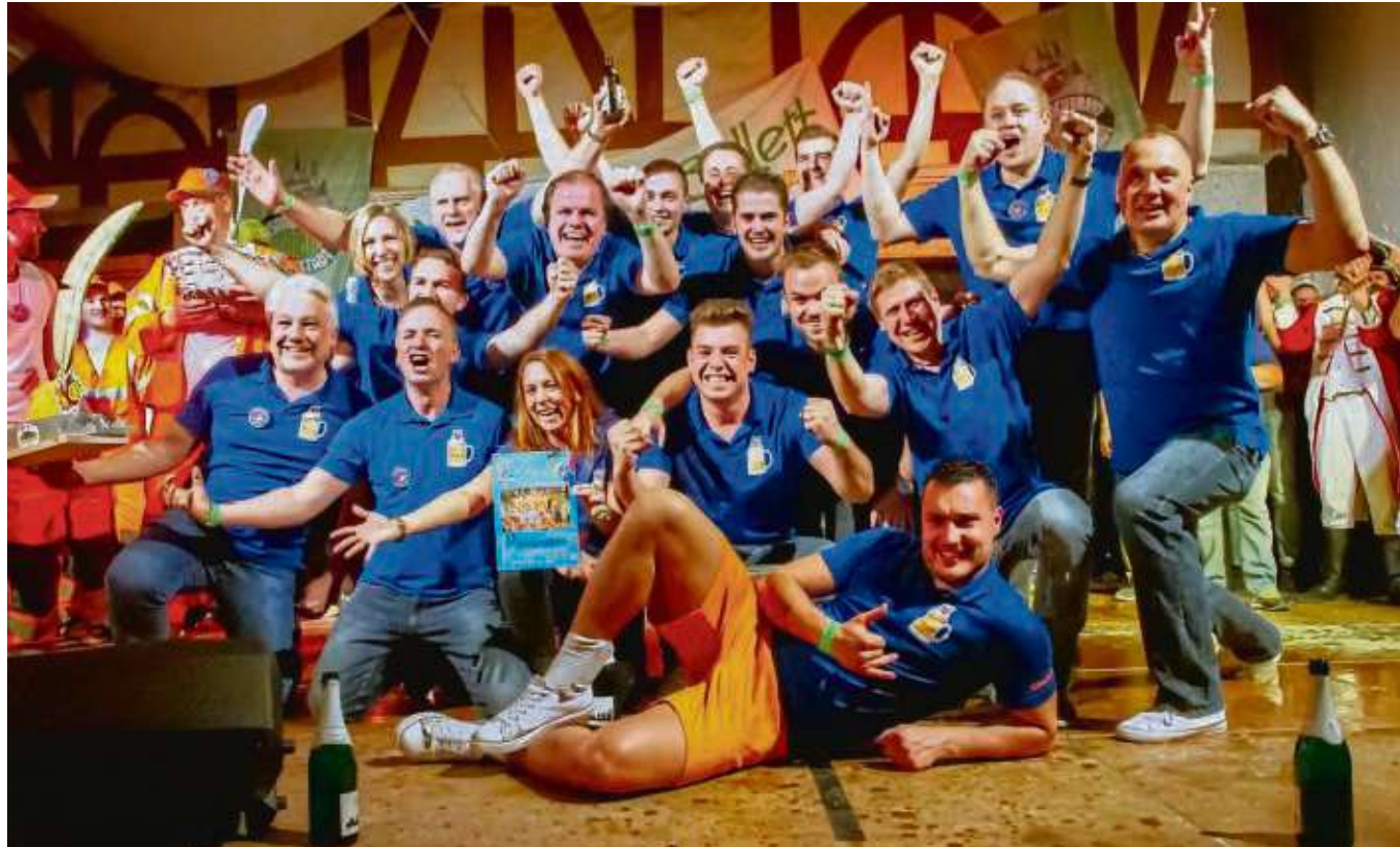
Den Männerballett-Contest veranstaltete wieder die Germania Seligenstadt in der Heimatbundhalle. Mit dem außer Konkurrenz auftretenden gastgebenden Ballett startete die Veranstaltung mit elf teilnehmenden Gruppen. Sieger wurde das Ballett „Just4beer“ (Foto) aus Zellhausen, Platz zwei belegte die Gruppe „Taktlos der JSK Jügesheim“, Drittplatzierte wurden die Aktiven des Seligenstädter Wagenbauerballetts, alle anderen landeten auf dem vierten Platz. Noch fastnachtlich orientiert beurteilten elf Juroren die Leistungen der Tänzer.

Seligenstadt (red) – Gestern tagte erstmals der neue Seniorenbeirat. Bericht folgt.