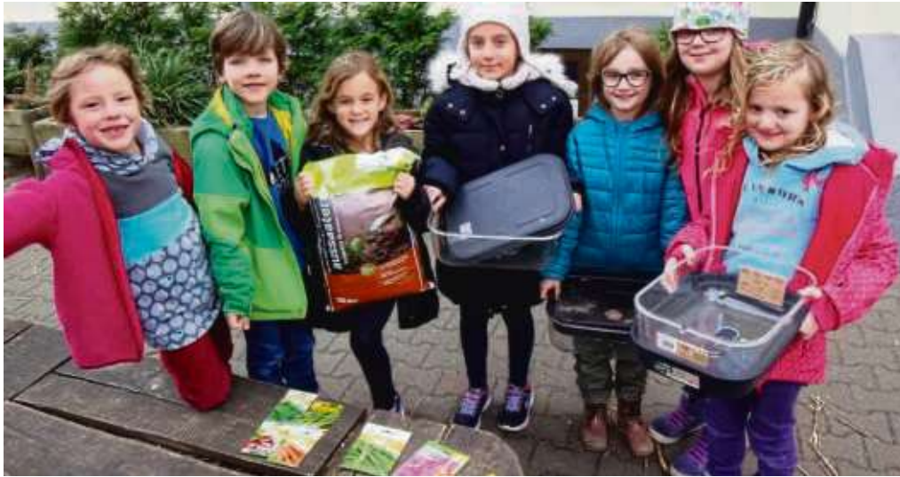
Die jüngsten Schüler der Freien Schule Seligenstadt-Mainhausen freuen sich über die Geschenke der Gärtnerei Fischer aus Dudenhofen.