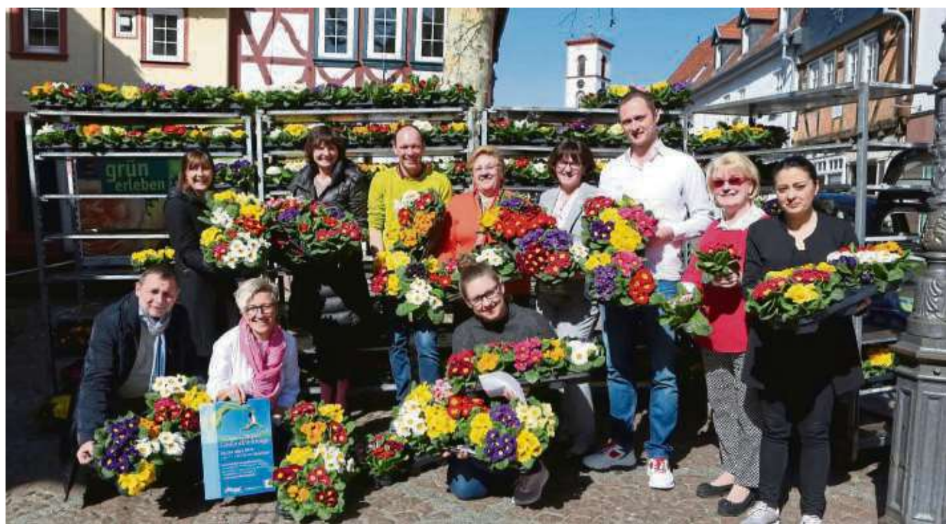
Es ist wieder Primelzeit und Seligenstadt blüht auf: 1.700 Primeln werden in den kommenden Tagen und Wochen an den Eingangstüren der Geschäfte und den Schaufenstern die Kunden verzaubern.

Selbst der kleinste Anzeigentext findet aufmerksame Leser. Sie haben es gerade bewiesen!