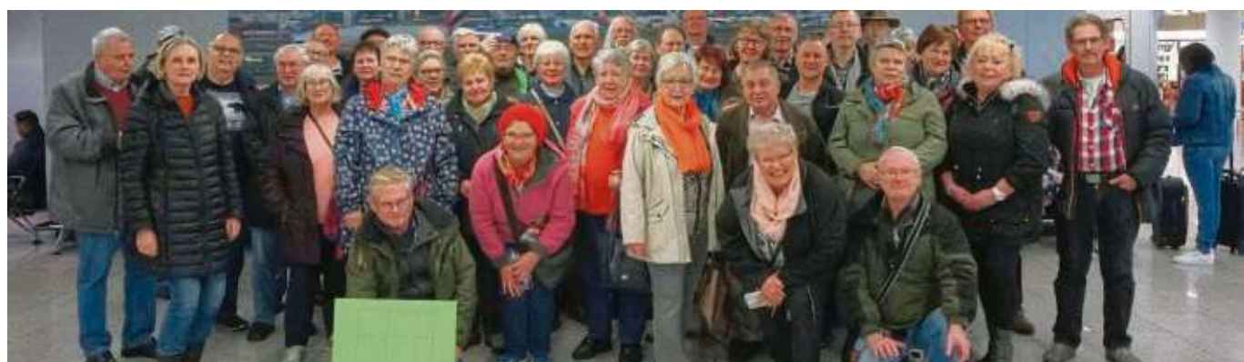
Der Event-Ausflug des Europäischen Freundeskreis Hainburg führte seine Mitglieder, nebst Freunden und Bekannten, zum Frankfurter Flughafen. Dort erwartete sie eine zweistündige Rundfahrt rund um den Flughafen. Große und kleine Flugzeuge wurden aus kurzer Instanz bestaunt. Beim Paulaner im Square ließen die Teilnehmer den Ausflugstag ausklingen.

l Hainburger“ zum ersten Mal bei einem großen Konzert der MGE dabei, und spielen zünftig in Tracht auf. Das große Orchester bringt konzertante und modernere Stücke zu Gehör. Somit ist für jeden Geschmack etwas dabei. Karten gibt es bei allen Musikern, in der Bücherei Klingler in Hainstadt und im Schuhhaus Heeg in Klein-Krotzenburg sowie an der Abendkasse. Dabei zeigt sich die MGE auch familienfreundlich, denn erstmalig gibt es auch ermäßigte Karten für Kinder bis 14 Jahre. Weitere Informationen gibt es online unter www.mge1888.de .