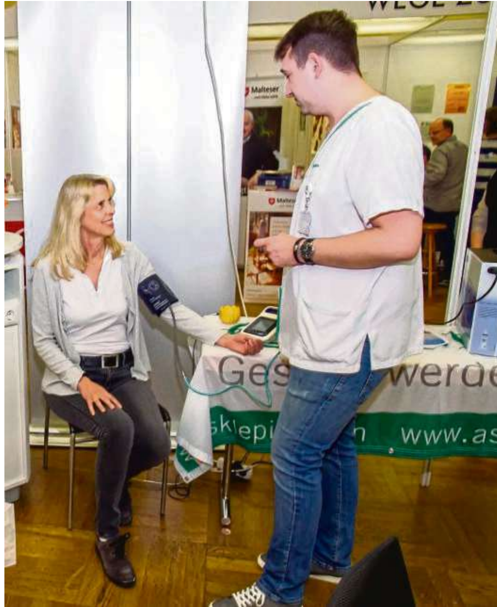
Gesundheitstage in Seligenstadt mit zahlreichen Angeboten, so auch das Blutdruck messen am Stand der Asklepios-Klinik Seligenstadt.