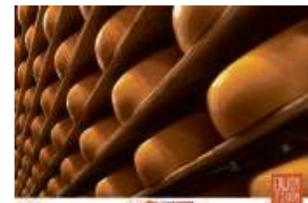
Das europäische Gütesiegel „g.g.A.“ auf der Verpackung garantiert, dass der Gouda zu 100 % aus niederländischer

Mit dem original Gouda Holland g.g.A. bringen Sie die jahrhundertlange Erfahrung und Leidenschaft der Niederländer für Käse auf den Tisch – wie ein kleines Stück Holland.