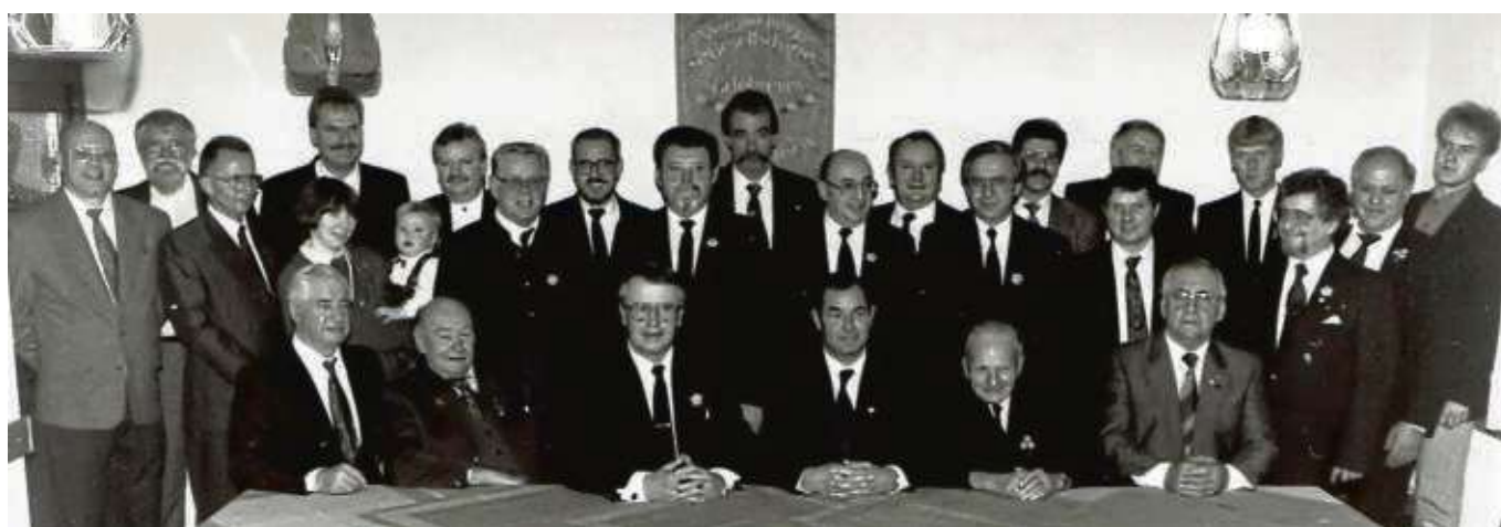
Foto aus 1994 zeigt die Edelweißmitglieder beim 100-jährigen Vereinsjubiläum. Mit einem Italienischen Abend feiert die Vergnügungsgesellschaft Edelweiß nun ihr 125-jähriges Jubiläum am Freitag, 5. April, im Hotel Columbus Froschhausen.

verein Edelweiß Rossbach und zur Portugiesischen Folkloregruppe Sol Nascente. Auch die Galopprennbahn Niederrad, das Volkstheater Frankfurt und die Riverboat Shuffle des Lions Clubs Aschaffenburg waren wiederholt gelungene Ausflugsziele. Neben diesen vergnüglichen Aktivitäten hat der Edelweiß auch im Ortsbild immer wieder Akzente gesetzt, so durch ein Hinweisschild zur Liebfrauenheide am Trinkborn, eine Zeittafel zur Geschichte des Froschhausener Rathauses, den Erhalt der alten Glocke im Schwesterngarten und zuletzt durch die Platzierung der beiden Froschfiguren am Froschhäuser Kreisel zur 725-Jahr-Feier der Gemeinde. Im Jubiläumsjahr 2019 ist die Anschaffung von zwei neuen Sitzbänken am Feldkreuz neben der Hohl vorgesehen.