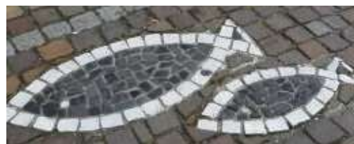
So einiges werden die Teilnehmer entdecken auf dem Weg mit Uschi Lüft.

ten auf einem Spaziergang durch die Gassen und Gärten der Stadt, dabei vielleicht auch Zeichen und Symbole finden, die mit dem Frühling verbunden sind. Treffpunkt ist im Rathaus-Innenhof. Pro Teilnehmer werden fünf Euro erbeten, Kinder in Begleitung sind frei. Anmeldung bei Uschi Lüft, ☎ 25524.