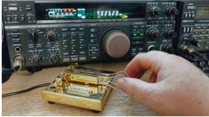
Auch das Eingabegerät für Morsezeichen ist moderner und ergonomischer geworden. Das sogenannte „Paddle“ hat die klassische Morsetaste weitgehend abgelöst. Morsezeichen können so mit geringerem Bewegungsaufwand schneller eingegeben werden.