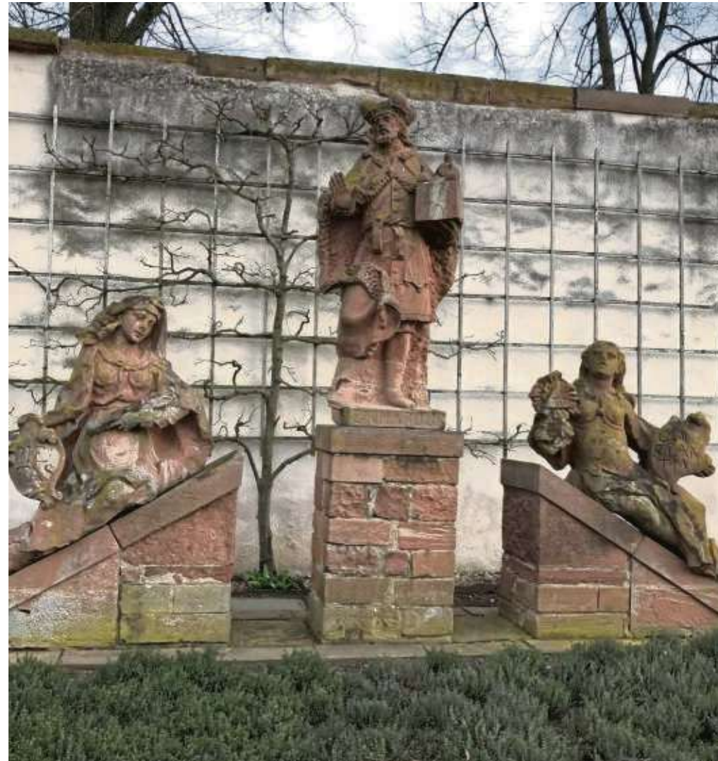
„Einhard - Gründer von Kloster und Stadt“ ist das Motto einer Themenführung, die von der Seligenstädter Stadtführer-Gilde am Samstag, 16. März, angeboten wird.

Karls des Großen - all das sind Namen für einen großen Mann unserer Geschichte. Wer mehr über diese erstaunliche Persönlichkeit aus dem 9. Jahrhundert erfahren möchten, sollte an der Führung teilnehmen.