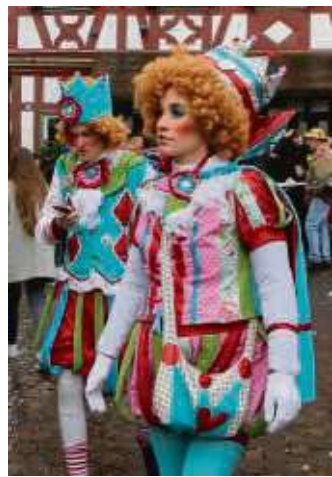
Aus und vorbei. Kein neuer Rosenmontagszug!

Seligenstadt (beko) – Der ausgefallene Rosenmontagszug in Seligenstadt