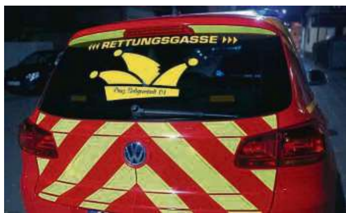
Tolle Wehrleute: Selbst der Einsatzleitwagen der Feuerwehr war Prinz Alexander als Stadtbrandinspektor gewidmet.