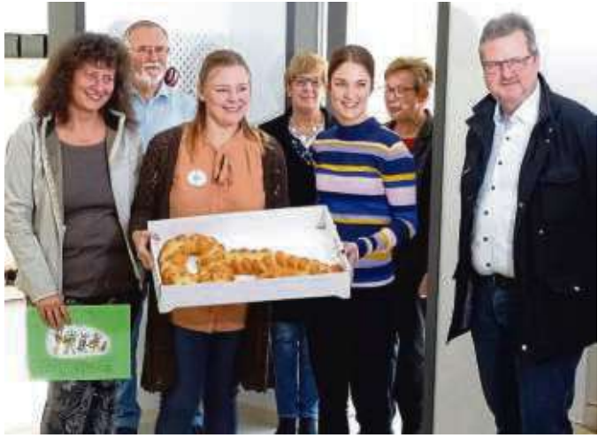
Einen großen, aus Teig gebackenen, Schlüssel übergab das whn-Architektenteam symbolisch.