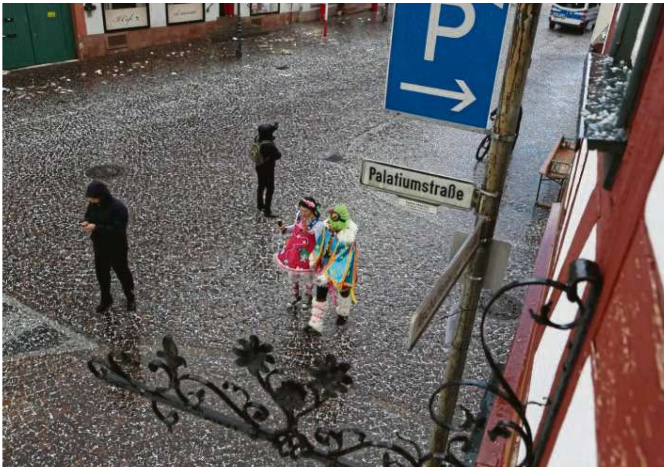
Trostlos sah es aus kurz nach der Absage des Rosenmontagszuges, auch wenn danach auf dem Marktplatz noch kräftig gefeiert wurde. Unmittelbar nach dem schweren Hagelschauer entstand dieses Foto an der Aschaffenburger Straße.

Wir haben fertig! Es geht weiter! Mit der Entscheidung, den Rosenmontagszug nicht nachzuholen, ist auch in der Redaktion (zumindest vorübergehend) etwas Ruhe eingekkehrt. Der Ausnahmezustand ist beendet nach mehr als 60 Veranstaltungen im Ostkreis, die vom Heimatblatt für die Printausgabe sowie die Online-Präsentation mit Veröffentlichungen bedacht wurden. Ungewöhnlich viel und dazu kostenfrei (!) bis ins Wohnzimmer. Alleine von acht großen Sitzungen hat die SHB-Redaktion live und ausführlich berichtet, auch erlebt, wie sich das „Kümmern um die Presse“ in den zurückliegenden Jahren ganz unterschiedlich gewandelt hat, wie auch Rückmeldungen auf ganz verschiedene Weisen (oder auch gar nicht) gegeben werden. Nächstes Kapitel: Das Geleitsfest. (beko)