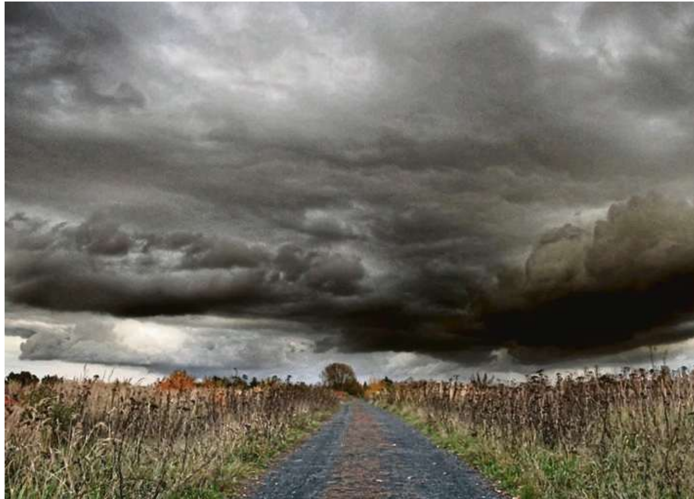
Die Zeichen stehen auf Sturm. Das Sturmtief „Bennet“ vermieste den Schlumbern den Rosenmontagszug, einen Nachholtermin wird es nicht geben, dieser Tage sorgte Sturm Eberhard für zahlreiche Einsätze von Feuerwehren. Auch in den kommenden Tagen soll es stürmisch bleiben und die Wolken dominieren, allerdings mit sonnigen Zwischen-Hochs. Es ist eben wie das Leben. Freude und Trauer wechseln sich ab.

wird nicht nachgeholt. Das beschlossen am späten Donnerstagabend die Verantwortlichen des Heimatbund-Vorstandes mit deutlicher Mehrheit. Der Zug musste am Rosenmontag wegen des Sturmtiefs „Bennet“ aus Sicherheitsgründen kurzfristig in den Mittagsstunden abgesagt werden. Ein Nachholzug sei ein zu großes finanzielles Risiko, sagte Pressesprecher Michael Eiles gegenüber dieser Zeitung. Nun bereiten sich die Seligenstädter auf den Kaufmannszug und das Geleitsfest vor. Mehr auf Seite 6.