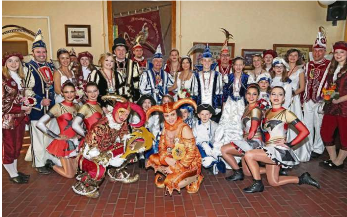
So viel närrischer Tollitätenglanz kommt selten in einem Raum zusammen: Die Prinzenpaare aus Froshhausen, Hainstadt, Klein-Krotzenburg, Seligenstadt, Zellhausen und aus Babenhausen sowie närrischer Todie beiden Kinderprinzenpaare aus Froshhausen und Seligenstadt samt Entourage gaben sich am Sonntagnachmittag im Vereinsheim der Harmonie Froshhausen bestens gelaunt ein Stelldichein.

Seligenstadt (beko) – Das Kolpinghaus ist nach der langen Winterpause ab 26. Februar wieder jeden Dienstag von 14 bis 18 Uhr geöffnet. Es werden Speisen und Getränke, Kaffee und Kuchen angeboten. Beliebt sind die Vesperbrote und dazu ein frisches Bier vom Fass oder auch alkoholfreie Getränke. Auf dem Spielplatz haben Kinder jede Menge Freizeitspaß, mit Spielzeugautos, Karussell, Schaukeln, Rutsche und Sandkasten. Eine Outdoor-Tischtennisplatte lädt zum Spielen ein. > www.kolping-seligenstadt.de