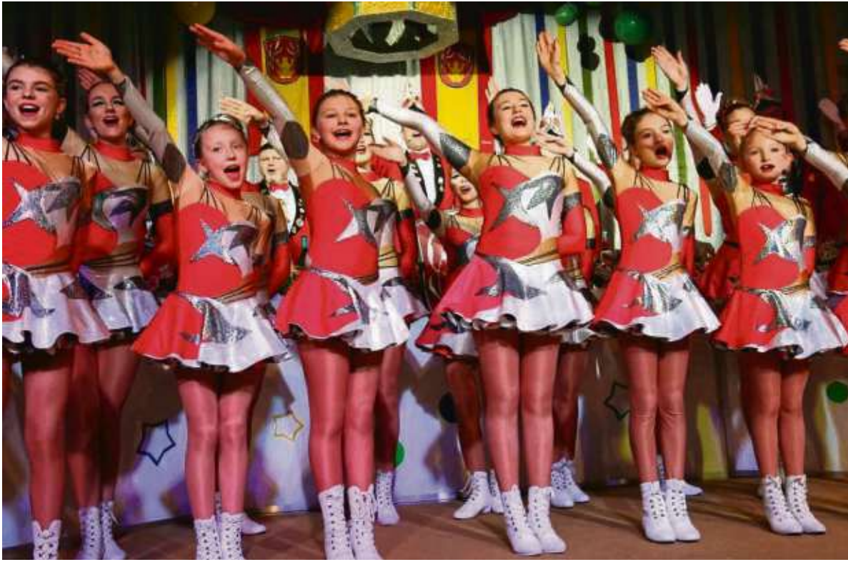
Froschhause Helau! Die Gardemädchen, ganz gleich ob klein, mittel oder groß, wissen, was an Fastnacht dazu gehört und wie man die Narren im Saal begrüßt.