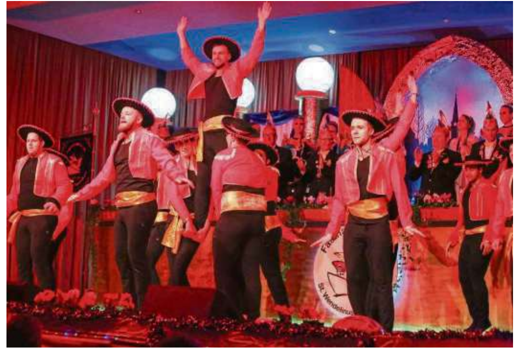
Die Gruppe „Petra Müller“ ließ mit spanischen und lateinamerikanischen Klängen das Publikum in der Hainstädter Sporthalle toben.