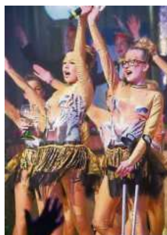
Haaschtadt Helau, auch von der Verletzten-Riege.