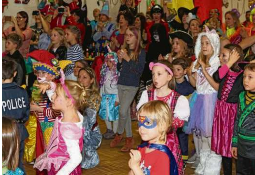
Fastnachtsparty für die kleinen Narren war nun bei den Seligenstädter Fastnachtsfreunden in der Heimatbundhalle. Tanzgarden traten auf, Prinzenpaar und Kinderprinzenpaar waren gekommen und die kleinen Narren im Schlumberland hatten ihre Freude.

Es grüßt „lächelnd“ von hier oben, euer Turmmännche