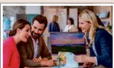
Mit persönlicher Beratung im STEWA Reisebüro 360° zu Ihrem nächsten Traumurlaub.