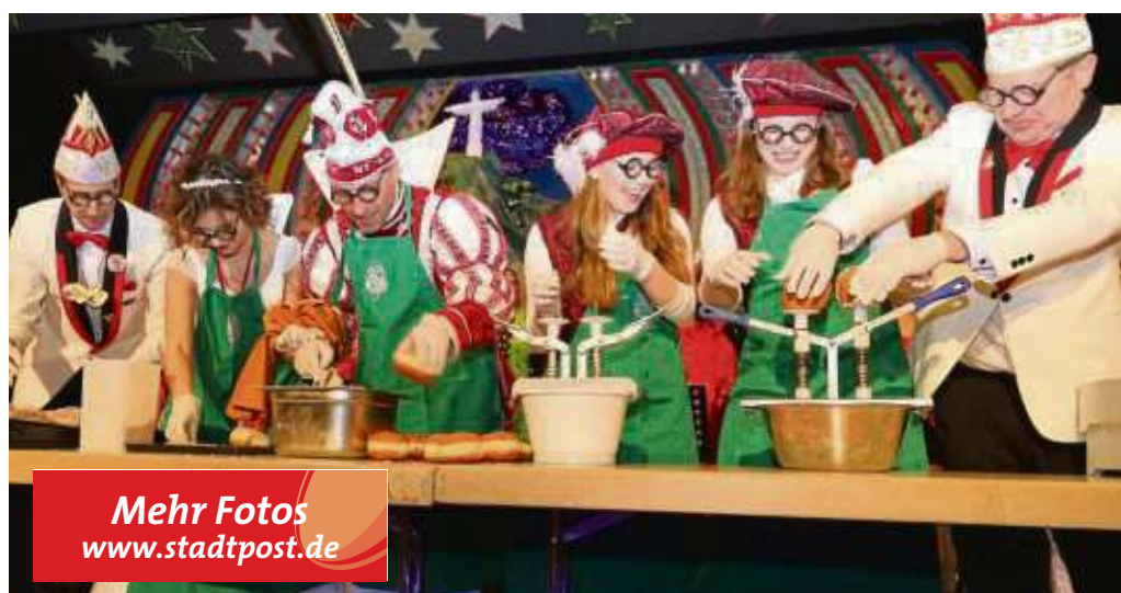
Ohne ein Spiel zu bewältigen, durfte das Prinzenpaar und sein Hofstaat, die Germania-Bühne nicht verlassen.

Klein-Krotzenburg (red) – Auf geht's zum Fußballer-Maskenball der SG Germania Klein-Krotzenburg am Samstag, 23. Februar, 19.11 Uhr im Vereinsheim am Triebweg. Unter dem Motto „Feiern wie auf der Reeperbahn“ werden phantasievolle Kostüme, tolle Masken, eine angenehme Atmosphäre und eine tolle Stimmung erwartet. Prinz „Assi“ wird sich samt Gefolge die Ehre geben. Eine große Tanzfläche steht zur Verfügung und wartet darauf, ordentlich beansprucht zu werden. Speisen und verschiedenste Getränke stehen zur Verfügung.