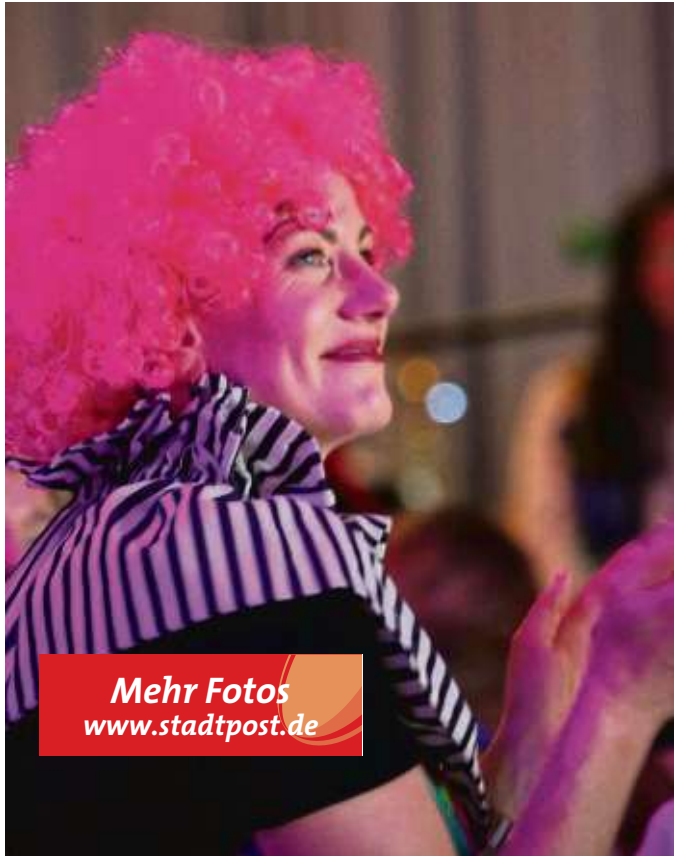
Mehr Fotos www.stadtpost.de