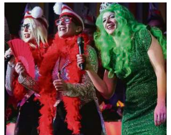
Musikalisch begeisternde Harmonisten in der eingebauten et was anderen Fastnachtssitzung.