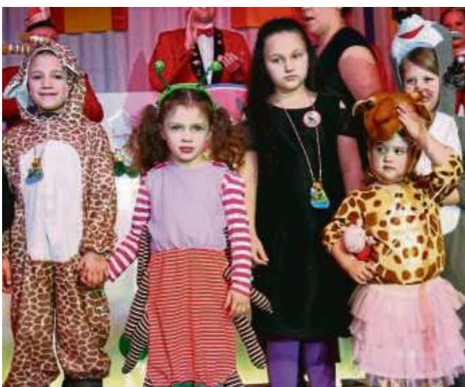
Gleich geht's los für die „Knackfrösch“ in der großen Bürgerhaus-Narrhalla in Quaaktown-City.