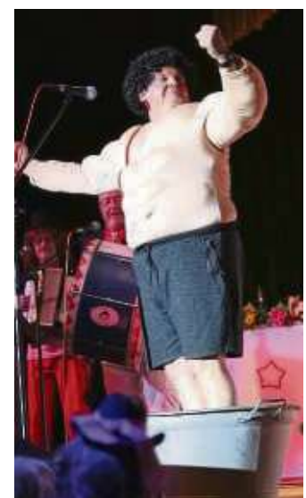
Eine wtwqas außergewöhnliche Bütt' für Mr. Sellistadt.