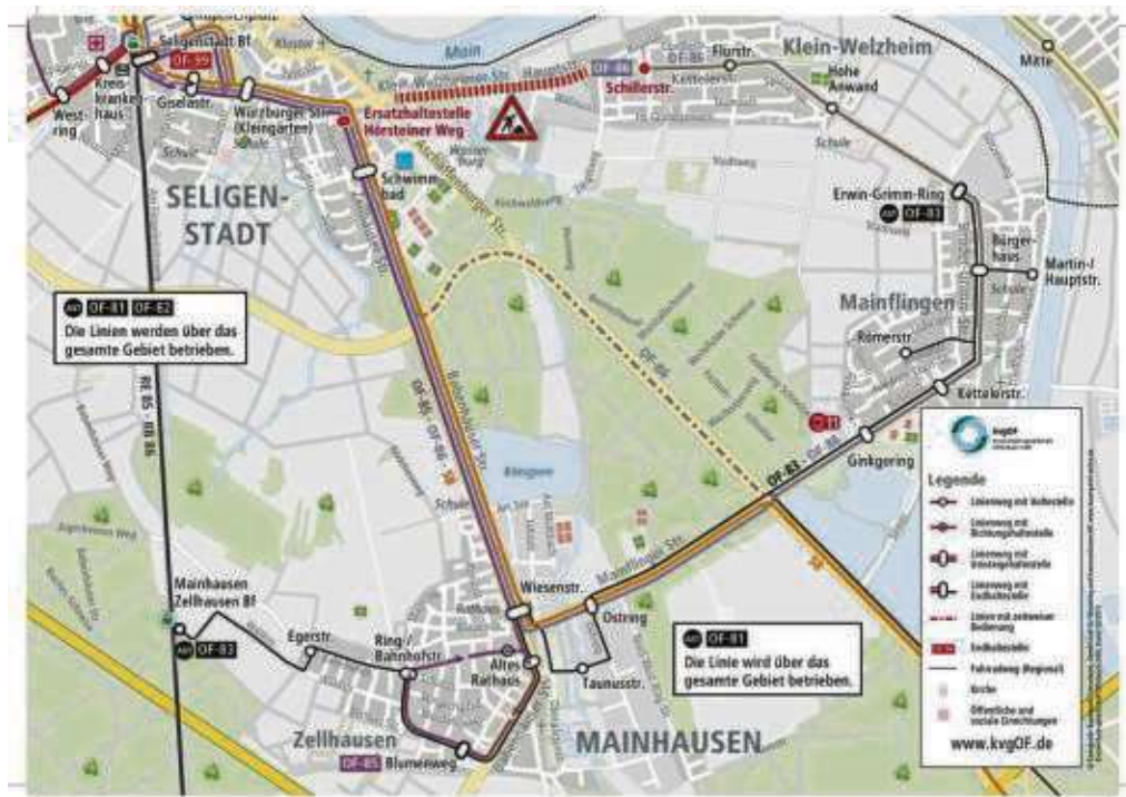
Heute soll's los gehen mit der Sanierung der K185 im Seligenstädter Stadtteil Klein-Welzheim. Konsequenzen hat das natürlich auch für den ÖPNV. Die Buslinie OF-86 wird während der Bauzeit in beiden Richtungen umgeleitet über Mainflingen, wie die obige Legende zeigt. Weitere Infos online.

Die Teilnahme am Kurs ist kostenlos, eine Spende für die Hospizgruppe wird erbeten. Anmeldungen sind aus organisatorischen Gründen notwendig und werden unter www.vhs-seligenstadt.de/infos/anmeldung/ entgegengenommen. Nähere Auskünfte erhalten Interessierte von den Kursleitern Petra und Hartmut Ehrich, die unter ☎ 0170 4605355 erreichbar sind.