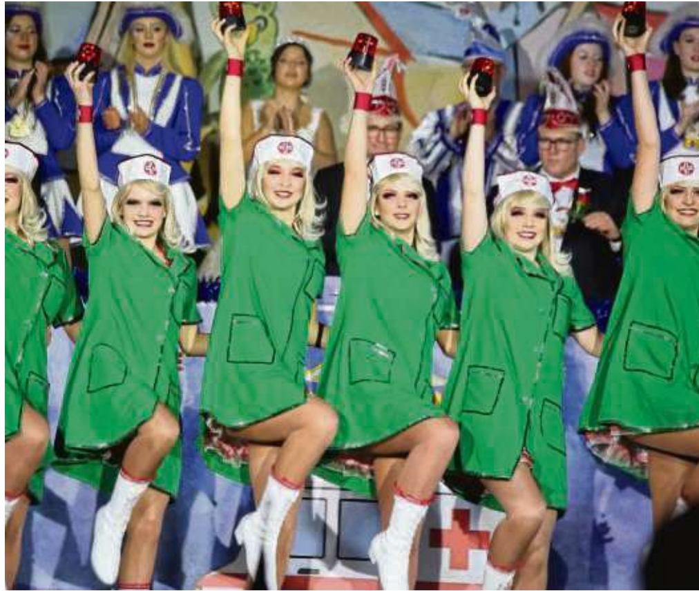
Feiern bis der Arzt kommt, heißt es ja bekanntlich. Die Krankenschwestern (von den Young Diamonds aus Krotzeborch) sind schon mal da. Viele Fotos mehr auf www.stadtpost.de

> Das närrische Treiben der Turn- und Sportgemeinde Froschhausen (TuS) beginnt am Freitag, 22. Februar, um 20.11 Uhr im Bürgerhaus Froschhausen. Der Eintritt ist frei, ebenso auch am Tag darauf, wenn die kleinen Narren bei der Kinderfastnacht zu ihrem Recht kommen: Ebenfalls im Froschhäuser Bürgerhaus geht es am Samstag, 23. Februar, um 14.31 Uhr los. > Zur närrischen Sitzung lädt der Gesangverein Liederkranz Zellhausen die Närrinnen und Narrhalesen aus Mainhausen und Umgebung für Samstag, 23. Februar, ab 19.33 Uhr in das Bürgerhaus Zellhausen, Rheinstraße 3, ein. > Zum närrischen Kreppelnachmittag lädt der Verein „Hand in Hand“ Seniorenhilfe Hainburg alle Mitglieder ein für Donnerstag, 21. Februar, ab 14.30 Uhr bei der Musikgesellschaft Eintracht