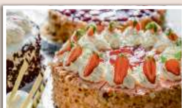
Ob Frühstück, Mittagstisch oder Kuchen: Im Café Zimt genießen Sie täglich Frisches aus der Region!

Unsere Referenten berichten im Café Zimt über einzigartige Orte und die schönsten Reiseziele (Programmauszug):