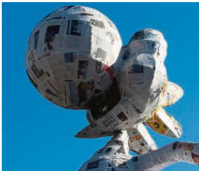
Bekannt und unbekannt Gesichter, im Moment noch mehr oder weniger farblos, kamen zum Vorschein, als die Wagenbauer nun ihre Motivwagen für den Rosenmontagszug erstmals ins Freie zogen. Zusammen mit Fachpersonal wurden die Wagen gründlichen TÜV-Tests unterzogen. Alle Wagen haben bestanden - der Rosenmontag kann kommen. Mehr Infos unter www.heimatbund-seligenstadt.de

ser Führung von einer ehemaligen Fastnachtprinzessin, einer Vollblutfastnachtlerin aus dem Schlumberland. Lustige Verse und kleine Reden begleiten in dieser Führung und zum krönenden Abschluss gibt es noch ein Fastnachtgebäck. Beginn ist jeweils um 14 Uhr am Steinheimer Torturm. Kostenbeitrag acht Euro, Kinder in Begleitung sind frei. Anmeldung erforderlich unter ☎ 0171 2934437.