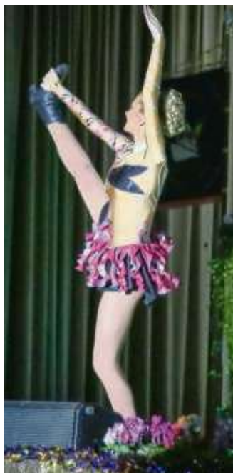
Auch tänzerische Leckerbissen waren angesagt.