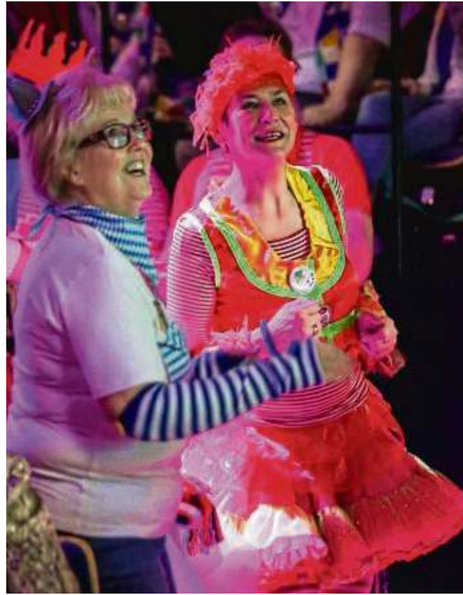
Volle Narrhalla-Säle, begeistert mitkatschende und mittanzende närrischen Besucher in den Fastnachtssitzungen im Ostkreis sind derzeit zu beobachten. Wir haben dazu eine Bildergalerie vorbereitet, die jeweils aktuell ergänzt wird.