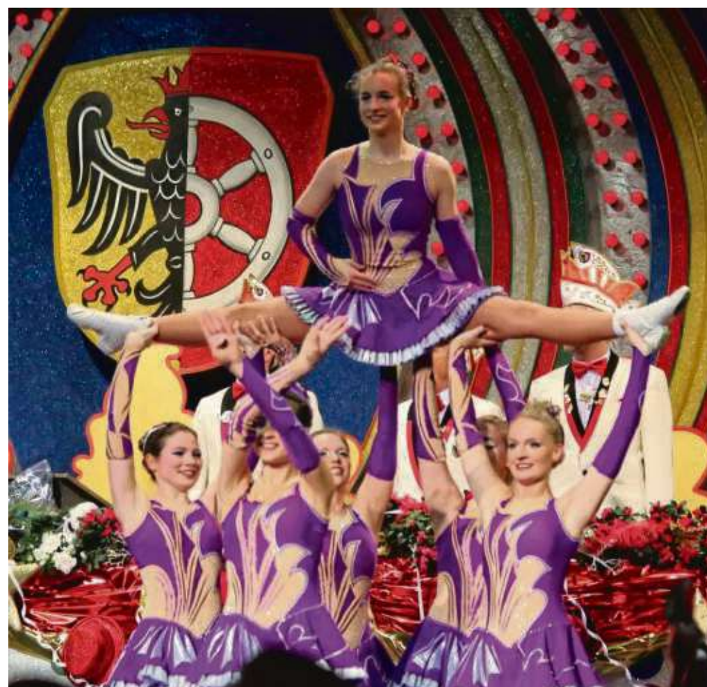
Zeigten wieder einmal ihr tänzerisches Können auf der Bühne des Riesensaales: Die Mädels der „Lila-Garde“ der Seligenstädter Fastnachtsfreunde.