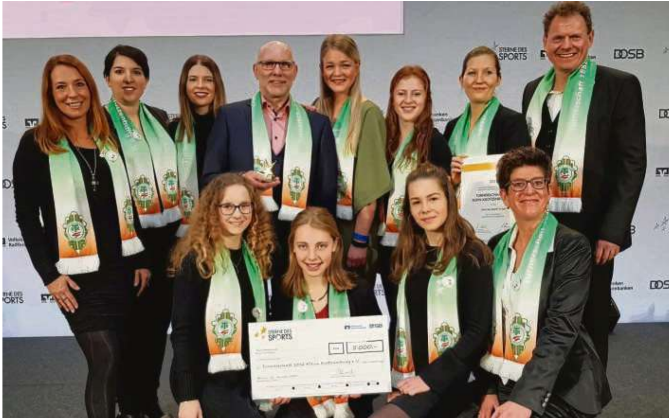
Vertreter der Turnerschaft Klein-Krotzenburg belegte bei der Verleihung des „Großen Stern des Sports“ in Berlin den dritten Platz und wurden auch von Bundespräsident Frank-Walter Steinmeier ausgezeichnet.

Klein-Krotzenburg (red) Die Turnerschaft aus Klein-Krotzenburg hat den dritten Platz bei der Verleihung des „Großen Stern des Sports“ belegt. Der Verein möchte junge Menschen an das ehrenamtliche Arbeiten heranführen und wurde für seine Aktion „Gib uns Dein Talent“ mit einem Preisgeld von 5000 Euro belohnt. Die Herausforderung nachlassenden freiwilligen Engagements in Sportvereinen gehen die Hessen damit proaktiv und innovativ an. Dafür haben sie vier Teilprojekte entwickelt: „Junge Frauen in den Vorstand“, „Vereinbarkeit von Familie und Ehrenamt“, „Reversed Mentoring“ (Alt lernt von Jung) und „TrainerIn sein ist cool“. Die OP berichtete ausführlich, auch online.