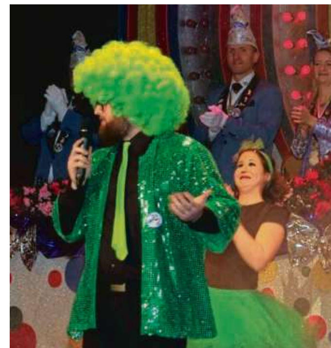
Mit grasgrüner Perücke und Tüll singen die TGS-Pausensingers von „Cordula Grün“.