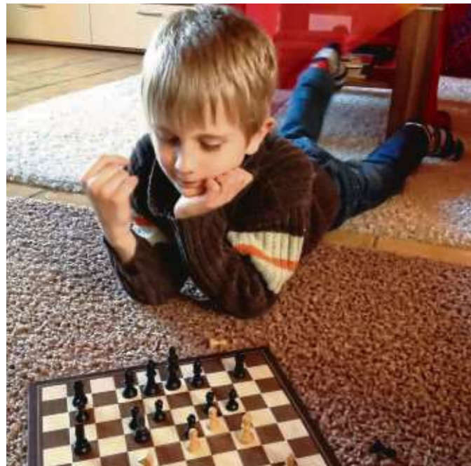
Bald nicht mehr alleine zuhause spielen, wenn es auch in der Gemeinschaft geht. S(pi)eligenstadt lädt dazu ein.

Von Donnerstag, 7. bis Sonntag, 10. Februar, können unter dem Motto „S(pi)eligenstadt“ im evangelischen Gemeindezentrum in