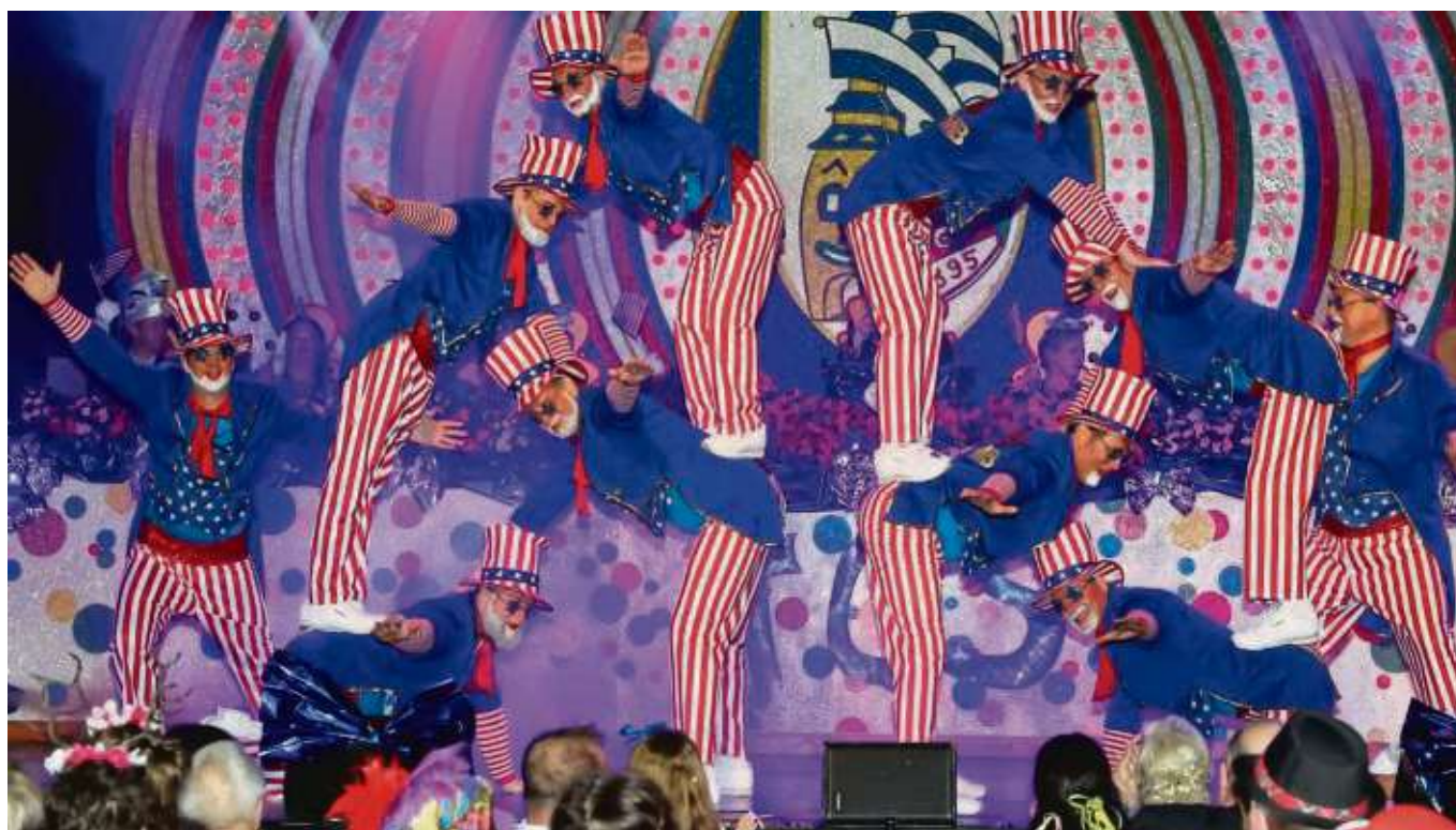
Hohe Bewertung in der B-Note: Staatsmännisch schreitet das TGS-Männerballett mit Stars and Stripes durch das Rampenlicht auf der Riesensaal-Bühne.