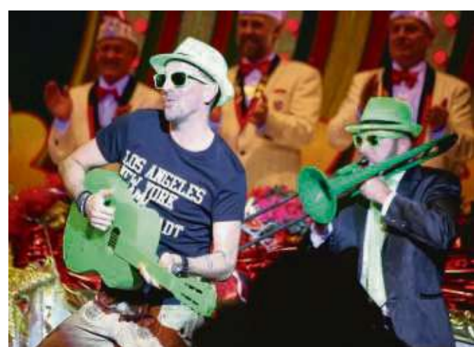
Brachten so richtig Schwung in die Hütte mit der TV-Premiere des Jahres: Die Akteure des Schlumber-Schlagerbooms.