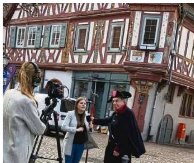
Einer der Seligenstädter Nachtwächter vor knapp einem Jahr im Interview mit einer Rundfunkanstalt.

ginnt um 20 Uhr. „Unsere Nachtwächterführung gibt einen faszinierenden Einblick in das „dunkle“ Leben der Stadt und liefert spannende geschichtliche Hintergründe“, verrät Bürgermeister Daniell Bastian. Jeden ersten Freitag im Monat findet eine öffentliche Nachtwächterführung (5.50 Euro pro Person) statt, sie kann aber auch individuell gebucht werden (pauschal 85 Euro für bis zu 15 Personen). Reservierung erforderlich unter ☎ 06182 87177.