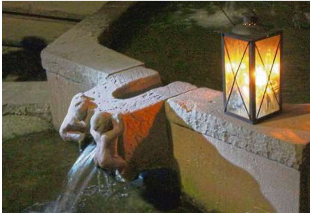
Seligenstädter „Nachtführungen mit Schmaus“ sind wieder geplant bei der Stadtführer-Gilde. Vorbei geht's auch am „Babybrunnen“.

Seid wie immer herzlich begrüßt, euer Turmmännche