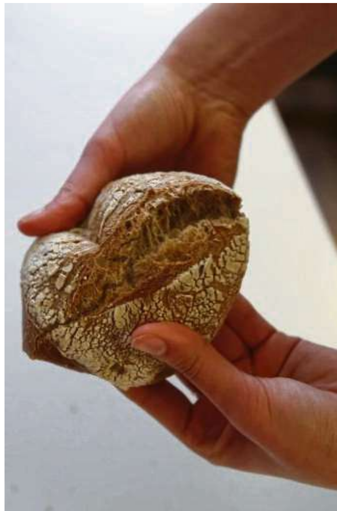
Jedes Wort und jede Tat sollte gut durchdacht sein.

>> Mit der neuen Rubrik „Worte, die verbinden“ will die Redaktion wöchentlich Leser aller Nationalitäten ansprechen und aufzeigen, dass wir trotz aller Unterschiede doch alle gleich sind. (znd)