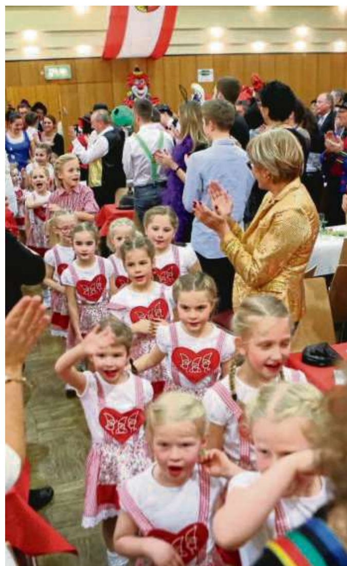
Auch beim Heimatbund hat der Nachwuchs Vortritt. Und viele Kinder werden sich auch am Kinderzug beteiligen.

Wer noch als Fußgruppe oder mit einem Fahrzeug teilnehmen möchte, sollte möglichst bald die Anmeldeunterlagen beim Orga-Team unter www.kulturausschuss-hainstadt.de/überuns/kontakte oder unter volker.jaekel@kulturausschuss-hainstadt.de bzw. peter.anderlohr@kulturausschuss-hainstadt.de anfordern.