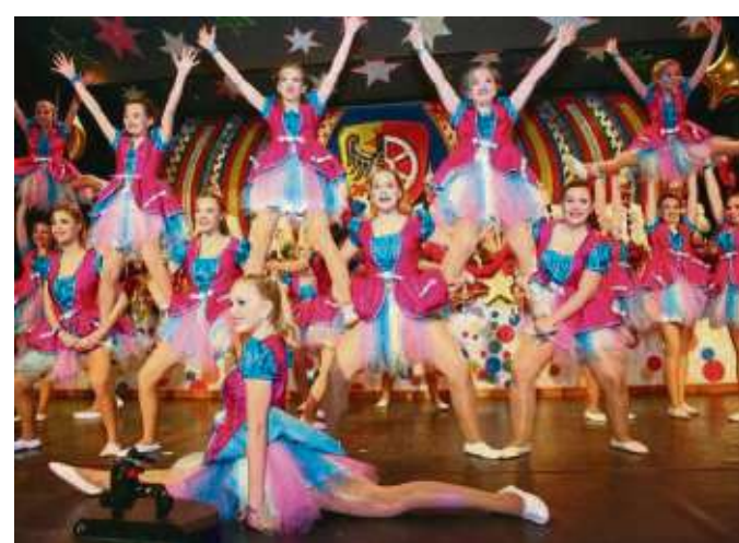
Als „Zuckerpuppen“ sorgten die „Spotlights“ des Heimatbundes für das „Salz in der närrischen Suppe“.