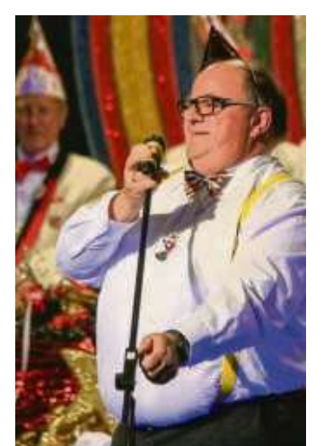
Der „Geoff“ aus Krotzeboers in Seligenstadt aktiv.