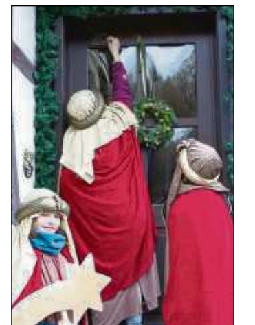
Sternsinger segnen wieder die Häuser.

Zellhausen Die Sternsinger der Kirchengemeinde Sankt Wendelinus ziehen von Donnerstag, 3. Januar, bis Montag, 7. Januar, von Tür zu Tür, um den Segen in die Häuser zu bringen und Spenden zu sammeln.