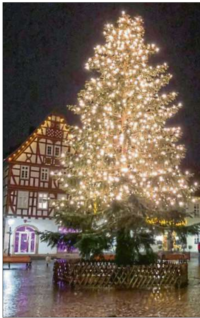
Rund 1.000 Lichter zieren derzeit noch den Weihnachtsbaum auf dem Seligenstädter Marktplatz.

Seligenstadt (red) – Am Fastnachtssamstag, 2. März, rockt die Partyband „Doctor Blond“ den Hexenball des Heimatbundes. Ab 19.44 Uhr in der Heimatbundhalle sind, mit den Hits der letzten Jahrzehnte und dem Besten aus den aktuellen Charts, viel Spaß und ausgelassene Stimmung garantiert. Die begehrten Karten für die Fastnachtsparty sind im Vorverkauf für zehn Euro bei der Tourist-Info Seligenstadt und im Fundus des Heimatbundes erhältlich, an der Abendkasse kosten sie zwölf Euro.