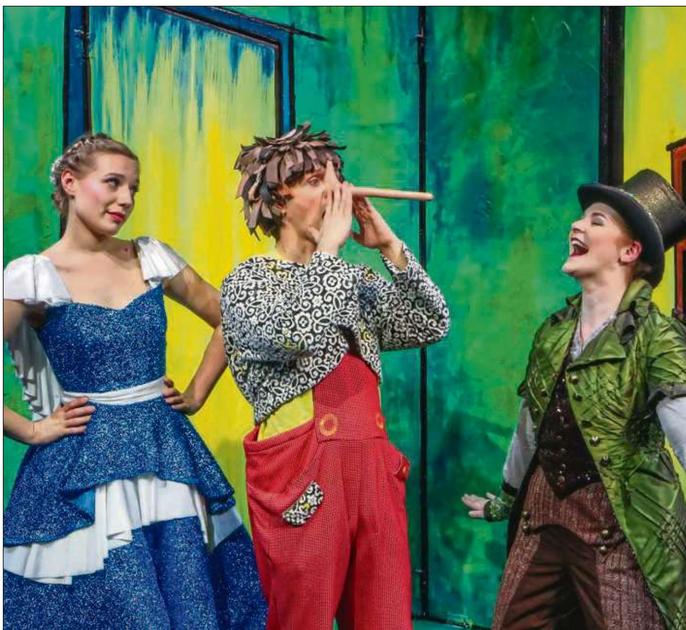
Auf seinen Abenteuern erhält Pinocchio Hilfe und Beistand von der Blauen Fee und der Grille – muss aber auch mit dem Gelächter leben, das er als Reaktion auf seine wachsende Nase erhält, die ihn als Lügner entlarvt.

Das Musical dauert zwei Stunden inklusive 20 Minuten Pause und ist geeignet für Kinder im Alter ab vier Jahren. Die Tickets kosten im Vorverkauf 27, 24 oder 20 Euro, je nach Kategorie, Kinder im Alter bis 14 Jahren erhalten eine Ermäßigung in Höhe von zwei Euro. Der Preis an der Tageskasse beträgt zusätzlich zwei Euro. Erhältlich sind die Tickets online unter www.theaterliberi.de , über die Tickethotline ☎ 0180 5 600311 sowie bei allen bekannten Vorverkaufsstellen.