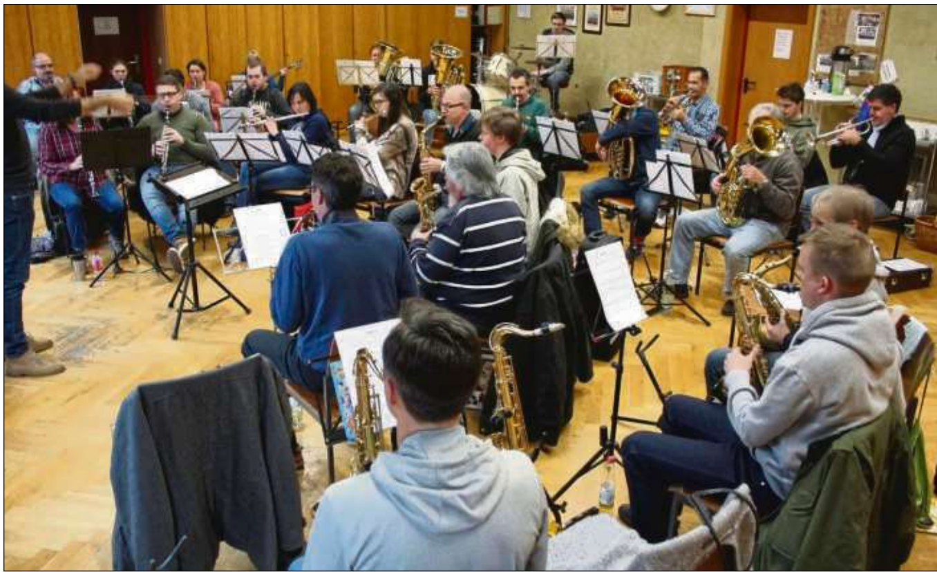
Das Musikcorps beim Probedirigat auf der Suche nach einem neuen Dirigenten. Mit größter Spannung erwarten die Dirigenten und Musiker die Auszählung der Abstimmung und damit die Entscheidung, wer neuer Musikcorps-Leiter wird.

Lesen Sie die Ausgaben der Heimatblätter auch auf www.stadtpost.de