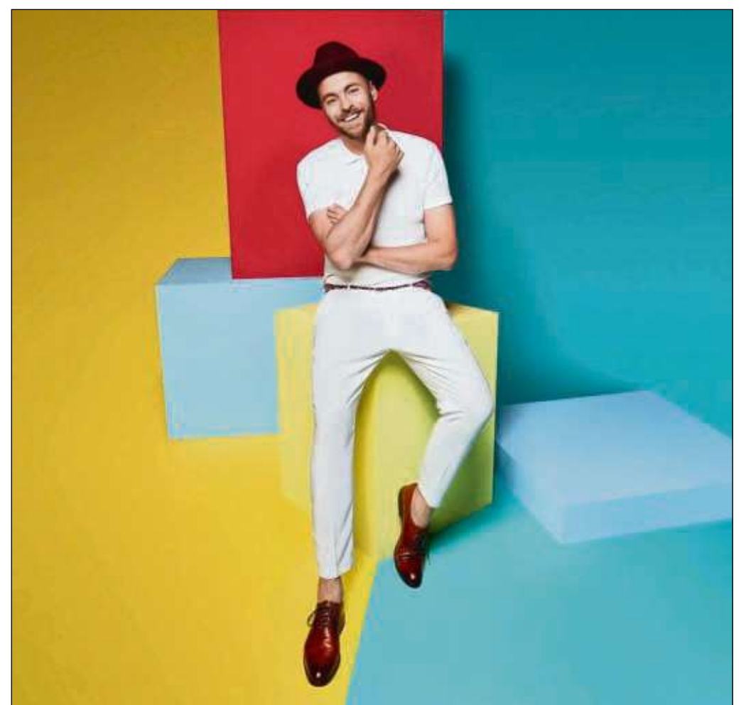
Max Mutzke präsentiert am Donnerstag, 1. August, sein neues Programm „Colors“.