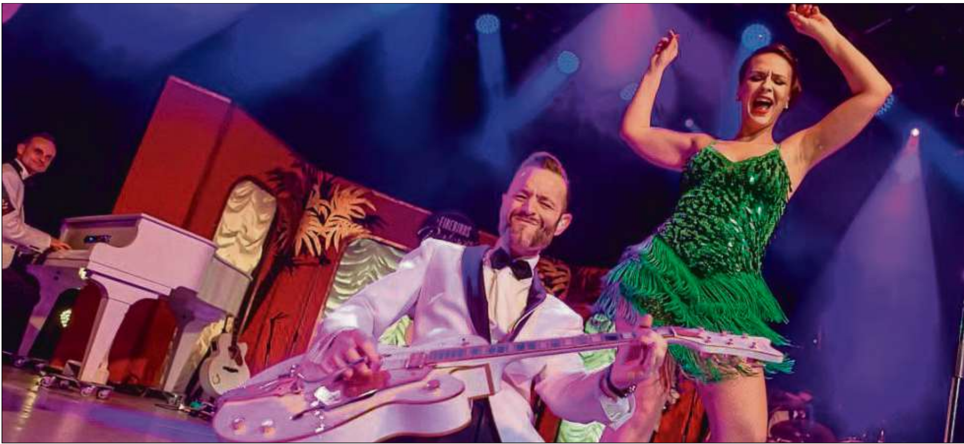
The Firebirds Burlesque Show macht am Sonntag, 31. März, 18 Uhr, Station in der Neuen Stadthalle Langen. Mit dabei sind „Kalinka Kalschnikow“ aus Österreich, die tanzende „Mademoiselle Kiki La Bise“ aus Berlin und die italienische Stil-Ikone „Rita Lynch“. Verstärkt werden die Burlesquedamen durch die artistischen Höchstleistungen von „Inna Zobenko“ aus der Ukraine und „Emiria Morihata“ aus Japan. Diese Damen treffen auf die Rock'n'Roll Formation „The Firebirds“. Zusammen mit Sängerin „Kiki De Ville“ aus England bieten sie Entertainment aus Klassikern der 50er und 60er, A-Cappella-Einlagen und jazzigen Momenten. Karten kosten ab 29 Euro und sind an allen örtlich bekannten Vorverkaufsstellen und Konzertkassen erhältlich. Weitere Tickets und Informationen unter: www.paulis.de .

Leitbild Mobilität des Kreises Offenbach