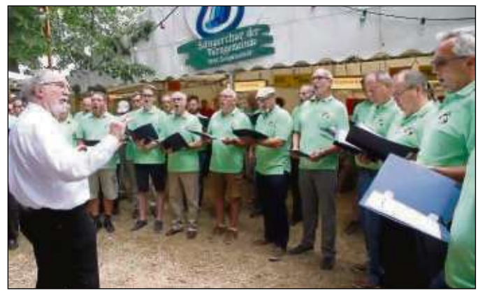
Auch die Germania Seligenstadt zählte zu den befreundeten Chören, die beim Maa-Allee-Fest sangen.