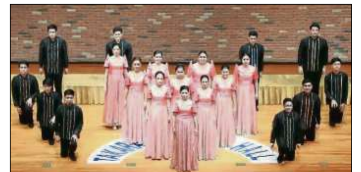
Der renommierte Chor Imusicapella ist am Dienstag zu Gast in Seligenstadt.