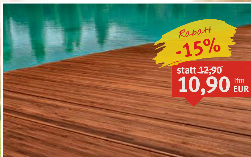
Terrassendiele Bambus Classico plus glatt gehobelt, gewölbte Oberfläche, Maße: 20 x 140 x 3.00 mm