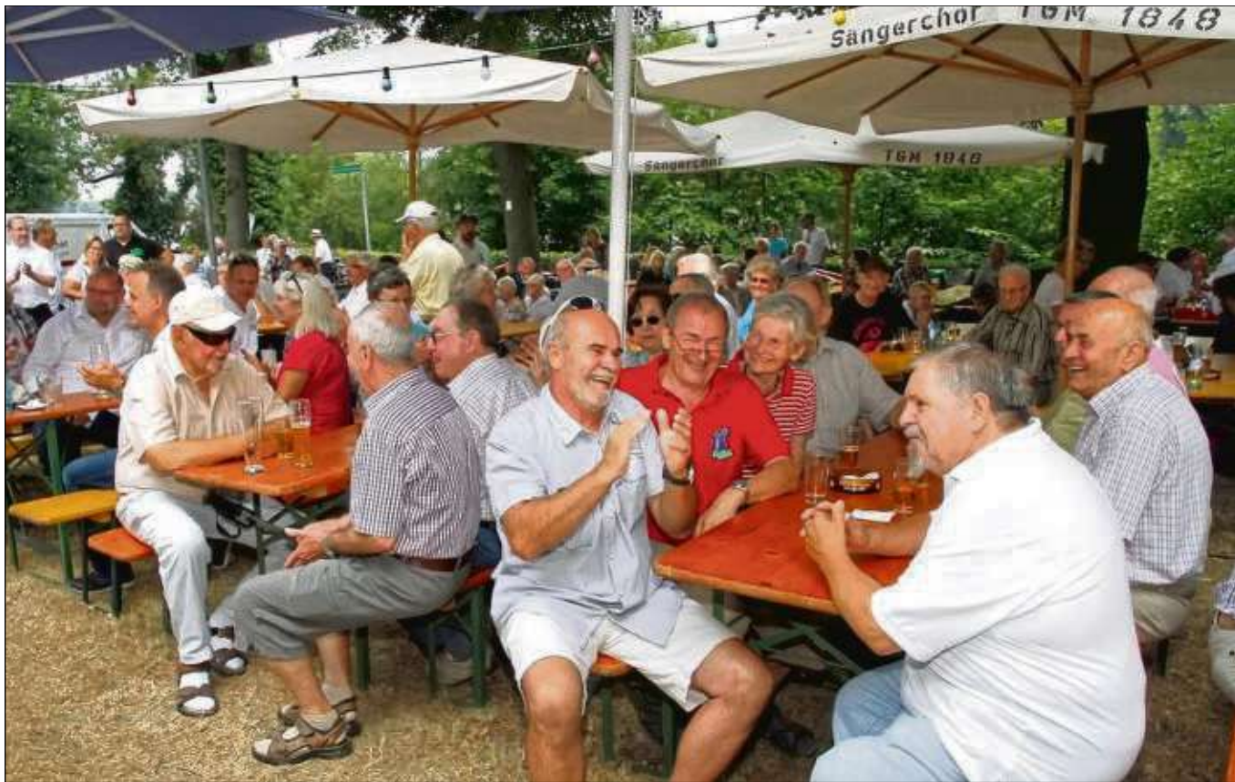
Richtig zünftig gefeiert wurde wieder beim Maa-Allee-Fest des Sängerschors der Turngemeinde Seligenstadt am Maimufer und die Besucher hatten offensichtlich auch viel Spaß. Weitere Fotos in der Bildergalerie der Offenbach-Post.

Seligenstadt (zmb) – Der Startschuss zur nächsten Seligenstädter Skate-Night fällt am Donnerstag, 26. Juli, um 20 Uhr auf dem Kapellenplatz. Die Strecke führt nach Klein-Krotzenburg und zurück zum Freihofplatz. Nach einer Pause im „Il Castello“ geht's weiter nach Mainhausen und wieder zurück zum Kapellenplatz. Die Skate-Night ist kein Wettbewerb, sondern ein im Konvoi geführtes, lockeres Miteinander auf den für die Skater verkehrsfrei gehaltenen Straßen. Bei der Skating-Tour sorgen die Polizei und die Ordnungspolizei sowie das Rote Kreuz und freiwillige Ordner für die Sicherheit der rund 300 bis 400 Beteiligten. Bei dieser Veranstaltung besteht Helmpflicht.