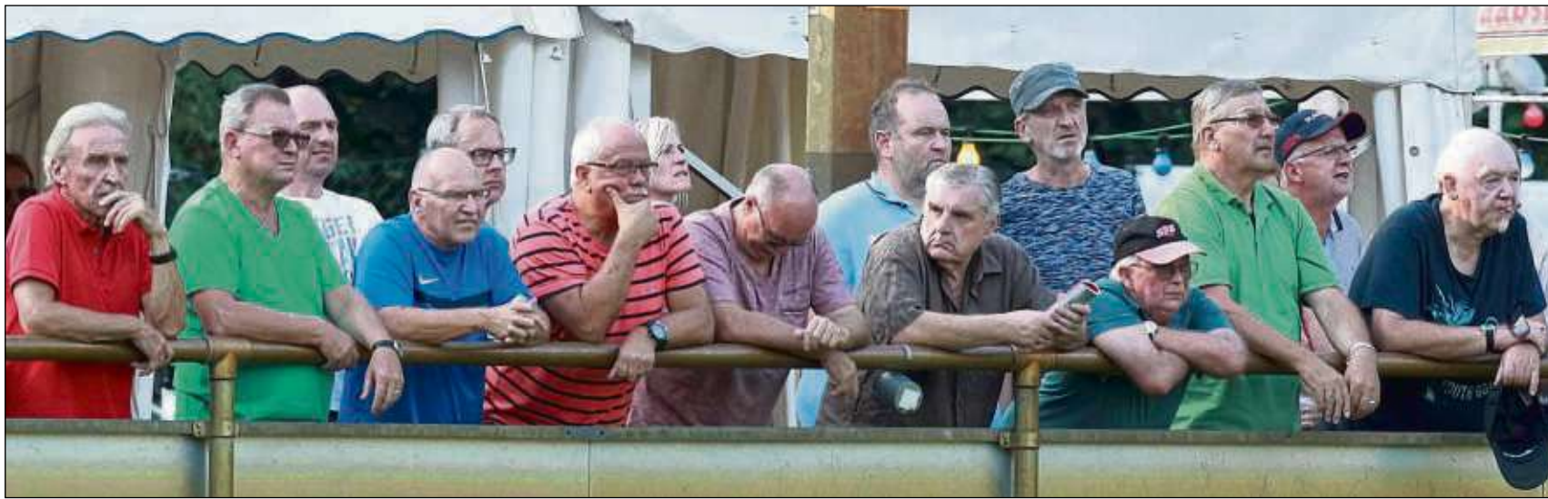
Immer auf der Höhe und nahe am Geschehen. Die Zuschauer beim Mainpokal.