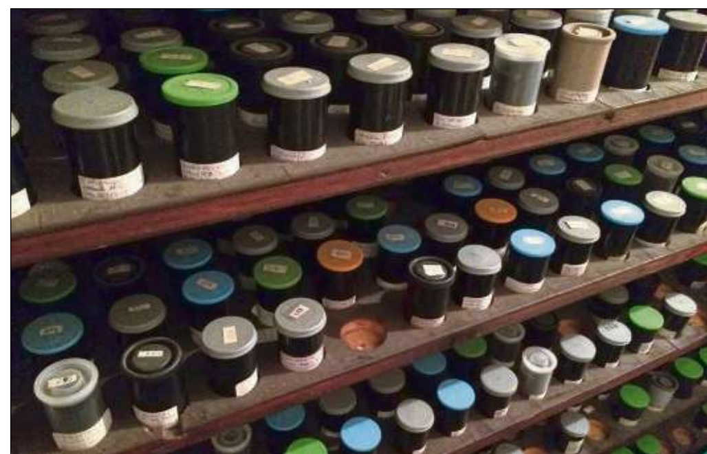
Blick ins alte Filmrollen-Archiv: Vor der Digitalkamera war „Entwickeln von schwarz-weiß Fotos in der eigenen Dunkelkammer angesagt.“