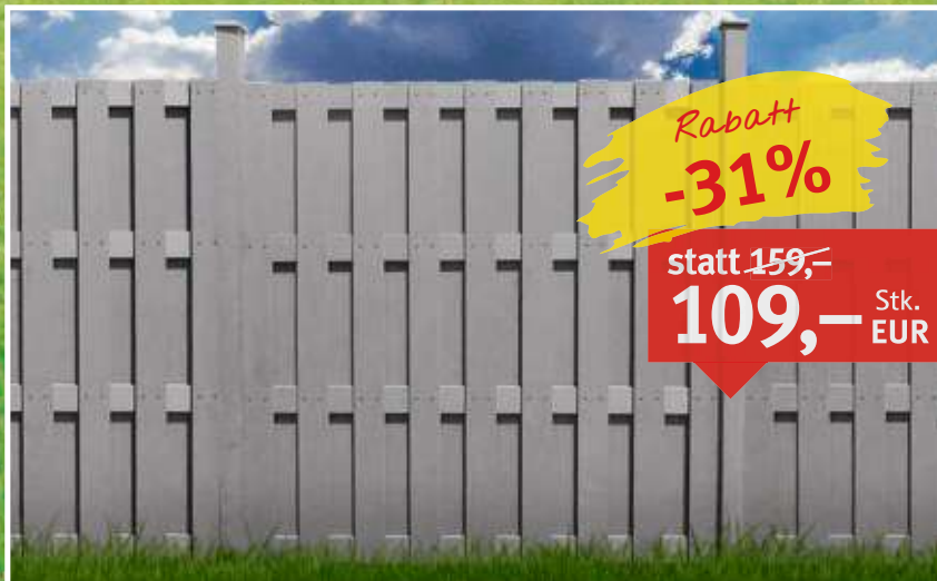
WPC Sichtschutzzaun Oslo Farbe: Hellgrau, Lamellen: 140 x 7 mm, Maße: 180 x 180 cm