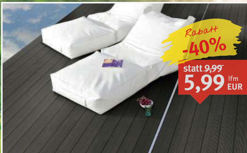
WPC-Terrassendiele Midsummer massiv, grob geriffelt, Farbe: Silbergrau Maße: 20 x 140 x 4.000 mm