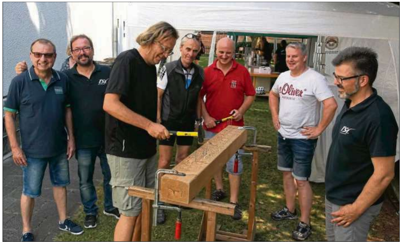
Die Radsportvereinigung Klein-Krotzenburg feierte ihr Sommerfest im Biergarten an der Radsporthalle. Gleich zu Beginn sorgten die Musikcorps der TGS beim zünftigen Frühschoppen für gute Stimmung. Zur Mittagszeit war das Festzelt dann gut besetzt. Mit einem reichhaltigen Angebot an Speisen und Getränken war für die Besucher bestens gesorgt. Am Nachmittag starteten die beliebten Gaudiwettbewerbe mit den Disziplinen Büchsenwerfen und Nageln. Des Weiteren stand die Vorführung verschiedener Sportarten auf dem Programm und eine Hüpfburg stand bereit.

ter anderem eine Radballvorführung demonstriert. Die Tanzsportgruppe „Styles and Elements“ begeisterte mit gleich drei Tanzeinlagen die Zuschauer, welche zum Abschluss sogar dazu animiert wurden, selbst das Tanzbein zu schwingen. Der Vorstand und der Wirtschaftsausschuss der Radsportvereinigung bedanken sich bei allen Besuchern, die den Weg zur Radsporthalle gefunden haben, aber auch bei den vielen fleißigen Helfern an den Ständen und im Hintergrund sowie bei den Sportlern sehr herzlich und blicken schon voller Vorfreude auf das nächste Event, welches am Sonntag, 19. August, stattfindet. Dann wird im Rahmen eines kleinen Festaktes die Radsporthalle zu Ehren ihres im letzten Jahr verstorbenen Ehrenvorsitzenden offiziell in „Georg Flohr Radsporthalle“ umbenannt. Nähere Informationen hierzu folgen in Kürze.