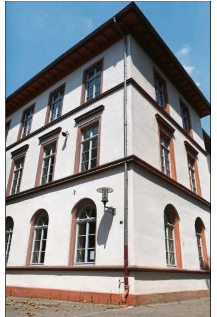
Nicht mehr im früheren HMS-Schulgebäude, dafür aber auf dem Außengelände will der Verein „Freunde der Hans-Memling-Schule“ weitere Veranstaltungen organisieren.

Seligenstadt (red) – Nicht mehr im früheren HMS-Schulgebäude, dafür aber auf dem Außengelände will der Verein „Freunde der Hans-Memling-Schule“ weitere Veranstaltungen organisieren. „Mehrere Termine für Veranstaltungen auf dem Schulhof sind angemeldet und Bürgermeister Daniell Bastian um Zustimmung gebeten“, so der Verein in einer Pressemeldung. So sollen - neben den monatlichen Kreativschoppen - am Tag des offenen Denkmals (9. September) ein Infostand und eine Kaffeetafel auf dem Schulhof organisiert und Zugang im Rahmen von Führungen ermöglicht werden. In Vorbereitung ist auch wieder der in der letzten Adventszeit so beeindruckende „Lebendige Adventskalender“, bei dem täglich ein neues Fenster der Schulfassade mit selbst gebastelten Motiven erleuchtet wird und zu dessen Öffnung eine Überraschung des jeweiligen Paten (Vereine, Parteien, u.a.) folgt.