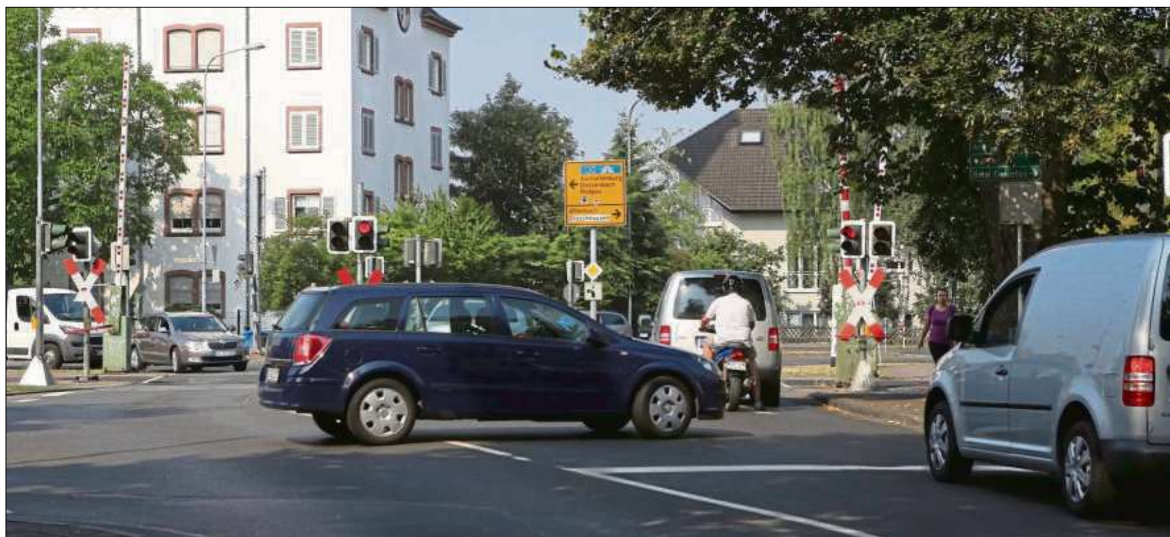
Der Seligenstädter Bahnübergang wie wir ihn kennen, zum Glück gerade mit offenen Schranken. Im Volksmund heißt er „Karibik“, wenn gleich von Sommer und Süden kaum etwas zu spüren ist. Es sei denn, man steht mal wieder in der Autoschlange und wartet auf sich öffnende Schranken.