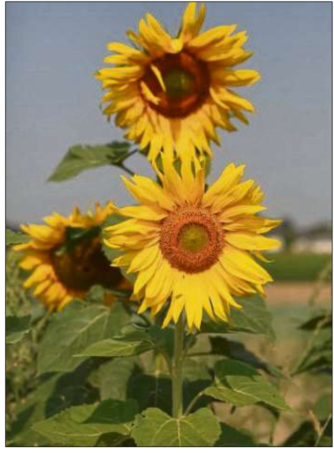
Wer hat sie schon entdeckt bei einem Spaziergang, die zahlreichen Sonnenblumen Seligenstadts?