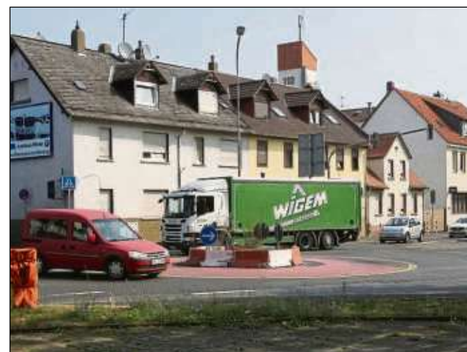
Immer wieder Diskussionsthema im Städtche: Der Kapellenplatz-Kreisler.