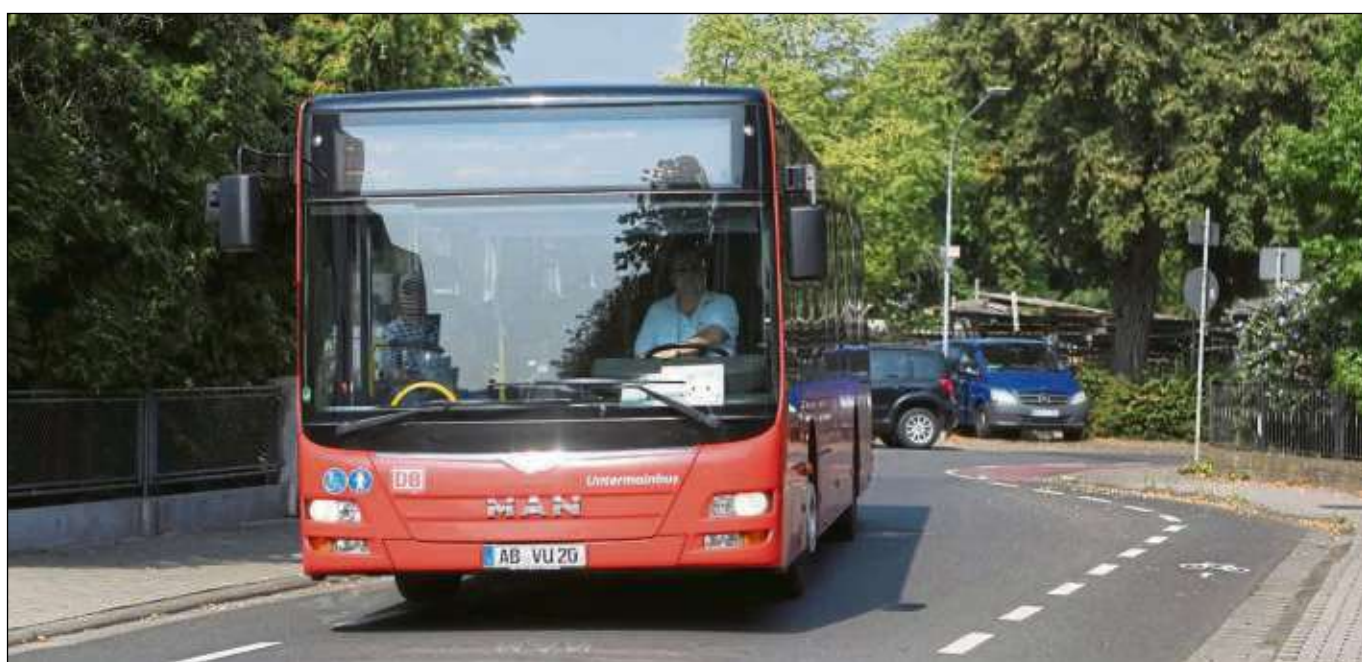
Der Bus 58 von Rodgau-Weiskirchen in Richtung Aschaffenburg kommt gut an. Kostenlos testen können die Fahrgäste die neuen Fahrten auf der Linie 58 an den ersten drei Samstagen im August.