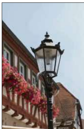
Auch ein Thema: Laternen ohne Blumenampeln.

Rentner treffen sich bei diesem Wetter eher im Schatten als mitten auf dem Marktplatz, diskutieren über den Kapellenplatz-Kreisler, die Ernteaufälle und den möglichen Tunnel mit einem Kreisler unter den Gleisen und das manchmal so lautstark, dass das Turmmännchen davon Wind bekommt.