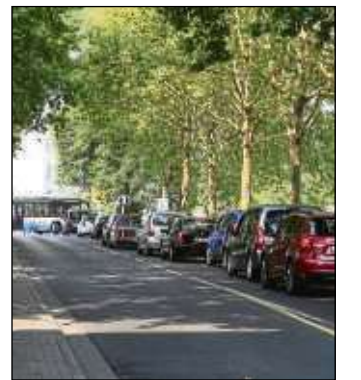
Ein Thema: Autoschlange vor der Bahnüberführung.