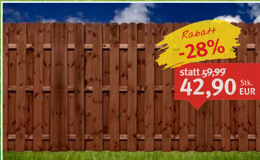
Sichtschutzzaun Kiefer KDI braun Latte: ca. 12 x 120 mm, Breite beliebig kürzbar, Maße: 180 x 180 cm