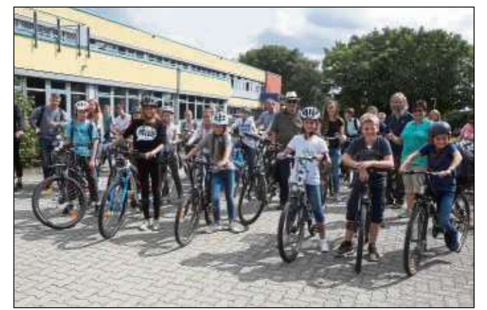
Neuer Rekord beim Stadtradeln 2017: 619 Teilnehmer waren mit von der Partie. Ob das getoppt wird?

Im vergangenen Jahr konnte sogar ein neuer Rekord mit zwölf Teams aus 619 Teilnehmern und insgesamt 88.432 Kilometern aufgestellt werden. Weitere Informationen erhalten Interessierte unter www.stadtradeln.de/Seligenstadt/