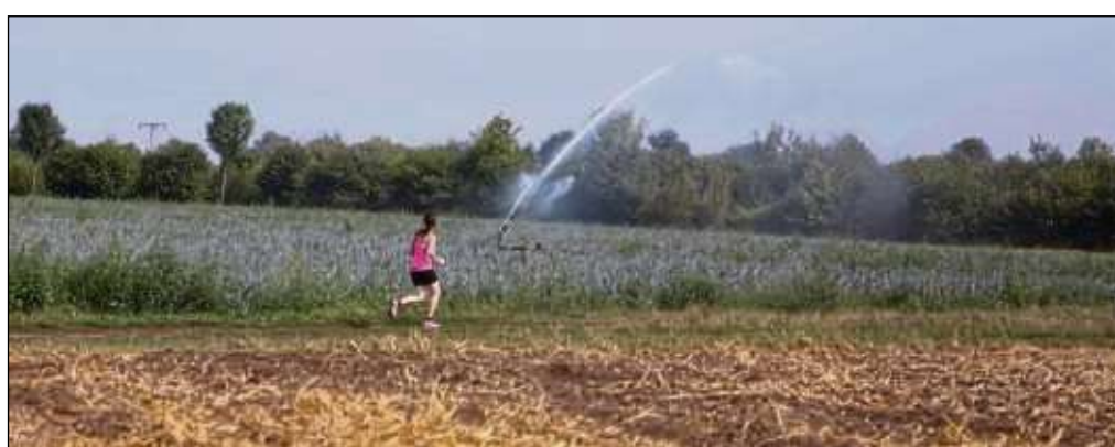
Ernteaufälle sind an der Tagesordnung für die Landwirte der Region. Durch den heißen Sommer, der offenbar weitergeht, müssen Felder immer weiter gewässert werden.