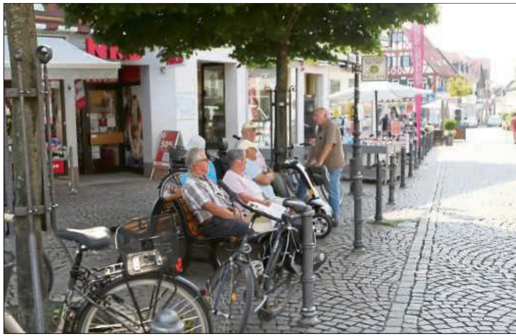
Ein schattiges Plätzchen haben sich die Rentner gesucht, um miteinander zu plaudern und die Themen der Stadt ins Visier zu nehmen, sehr zur Freude vom Turmmännchen.