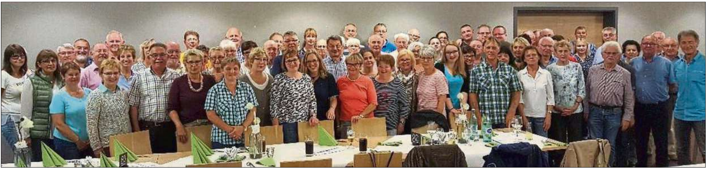
Einen „sonnigen“ Ausflug erlebte die Sängervereinigung Klein-Welzheim in Würzburg. Nach Führungen auf der Festung Marienberg und in der Altstadt brachte ein Ausflugsschiff die Teilnehmer nach Veitshöchheim zur Besichtigung des weltberühmten Rokokogartens. Auf der Heimfahrt wurde am Abend Halt gemacht in Mespelbrunn zum gemütlichen Beisammensein.