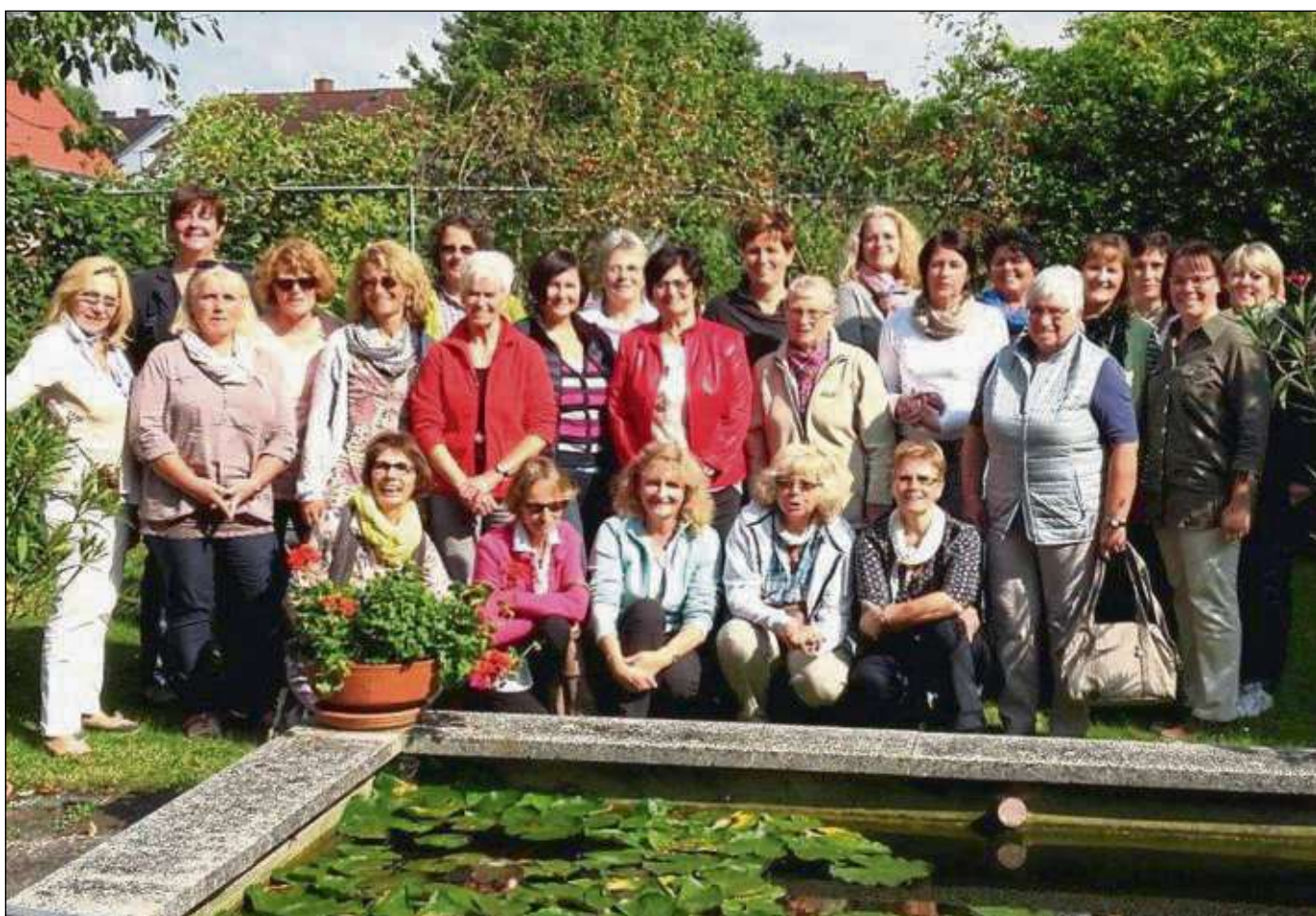
Ein Ausflugs in den Franziskusgarten des ehemaligen Kapuzinerklosters in Dieburg unternahmen nun circa 30 Frauen der Pfarrei St. Nikolaus Klein-Krotzenburg bei schönstem Spätsommerwetter. Bei einer Führung erfuhren sie, dass eine Gruppe von Ehrenamtlichen den Garten liebevoll hegt und pflegt. Hier lädt der Sonnengesang des Heiligen Franziskus, welcher mit Symbolen dargestellt wird, zum Meditieren ein. Dem kamen die Frauen am Nachmittag als geistlichen Impuls nach.

Die Hospizgruppe Seligenstadt und Umgebung bietet ihre Dienste ehrenamtlich, unentgeltlich und überkonfessionell an. Die ambulante Fürsorge und Zuwendung für sterbende, schwerkranke und trauernde Menschen steht im Mittelpunkt ihres Handelns. Weitere Informationen unter www.hospiz-seligenstadt.de oder Hospiz-telefon 01785646979.