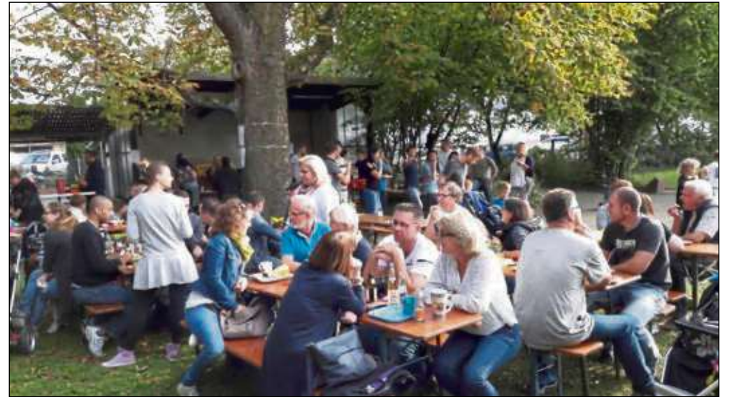
Gemütlich feierten Eltern und Kinder der Kita St. Margareta Froschhausen ein Herbstfest auf dem Gelände am Maximilian-Kolbe-Haus.