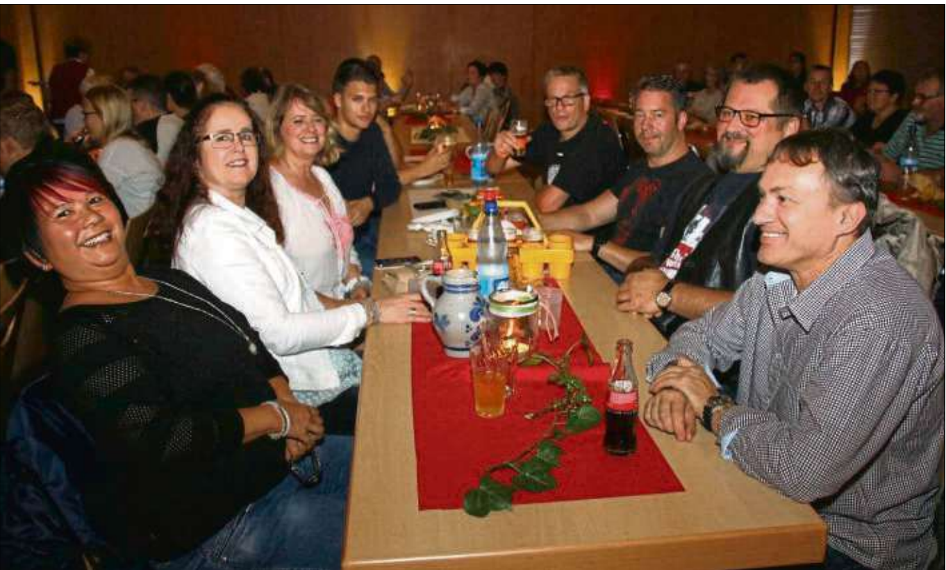
Zu einem „Hessischen Abend“ hatte die Freiwillige Feuerwehr Mainflingen vergangenen Samstag in das Bürgerhaus eingeladen. Mit Live-Musik von der Seligenstädter Kapelle Blech & Co hatten die Besucher prächtige Unterhaltung. Auch für das leibliche Wohl war mit Spezialitäten von Handkäs bis zum Abbelwoi bestens gesorgt.

forderlich sind ein Mountainbike oder ein Trekkingrad und möglichst auch ein Fahrradhelm zur eigenen Sicherheit. Willkommen sind auch Interessierte, die nicht Mitglied der Mövia sind. Abfahrt ist um zehn Uhr am Vereinsheim am Bahnhof in Hainstadt. Infos unter ☎ 5797.