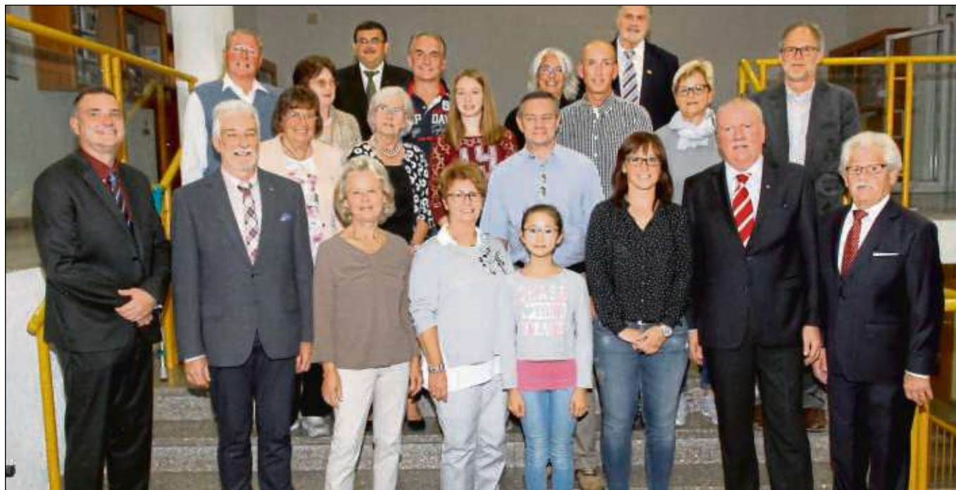
Lasst Blumen sprechen: Große Freunde bei den Siegern des Blumenwettbewerbs und dem Vereinsring-Vorstand.

Blumenwettbewerb des Vereinsrings Klein-Welzheim