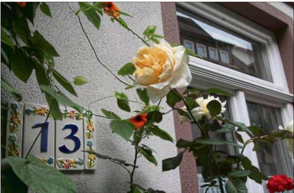
Was für ein Wochenende und Wochenstart in Seligenstadt! Die Sonne schien, jeder pilgerte noch einmal ins Städtchen und nutzte womöglich die letzte Chance auf einen Kaffee im Freien zu genießen und selbst die Rosen blühten noch in der Altstadt. Ob's dieses Jahr noch einmal so schön wird?

Walzer modern, die steirische Harmonika trifft auf eine Harfe und ein Saxofon kommt hinzu, so kommt eine außergewöhnliche Musikmischung zustande. Auch eine kleine kulinarische Überraschung mit Weißwurst steht für die Gäste bereit. Karten sind im Vorverkauf bei den Buchhandlungen geschichten*reich und beim Buchladen in Seligenstadt sowie unter ☎ 06182 899449 erhältlich.