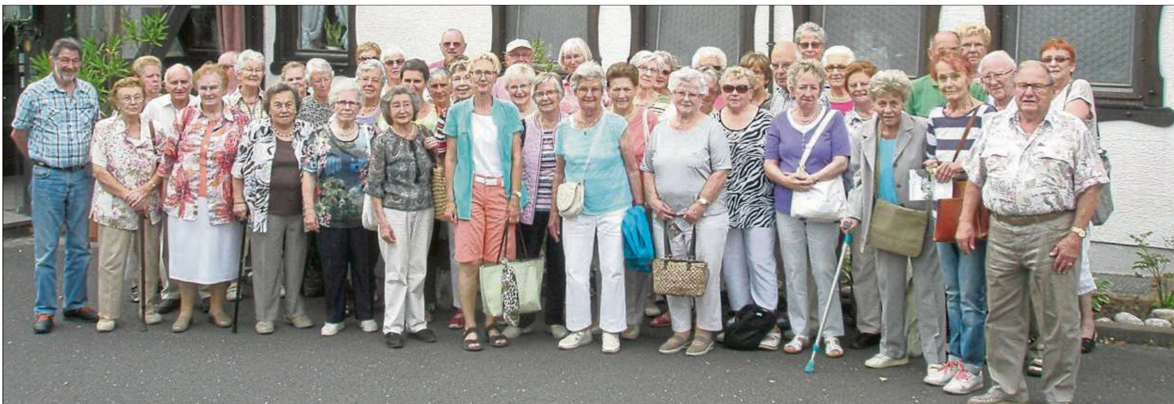
Der Verein „Hand in Hand“ Seniorenhilfe Hainburg besuchte mit gut gelaunten Senioren die Kurstadt Bad Kissingen.