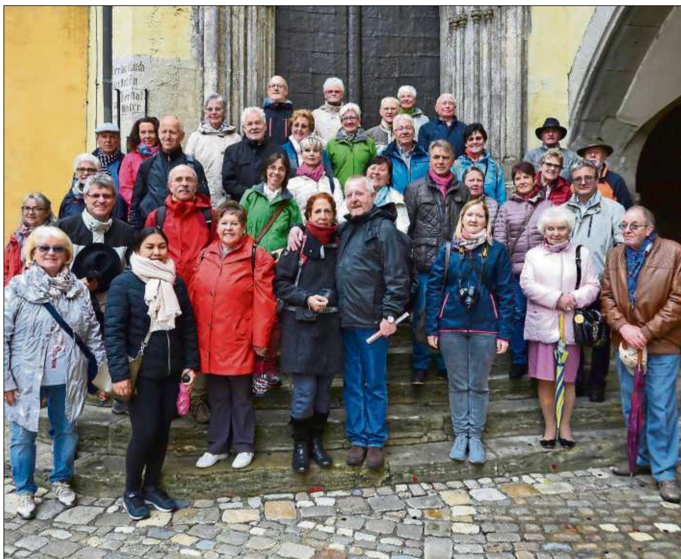
Der Vier-Tagesausflug des Chores an der Basilika führte diesmal nach Passau und Regensburg. Ein besonderes Erlebnis war neben den Führungen (Städte und Brauerei sowie im Innviertel), einer Drei-Flüsse-Schiffahrt und der Einkehr in einer Schnapsbrennerei die Teilnahme am Hochamt im Dom zu Passau unter Mitgestaltung des Kinder- und Jugendchores am Erfurter Dom unter Anwesenheit von 60 „Goldhauben“-Frauen. Lieder aus früheren Zeiten und humorvolle Textbeiträge rundeten einen gemeinsamen Abend ab. Das Bild entstand vor dem Rathaus in Regensburg.