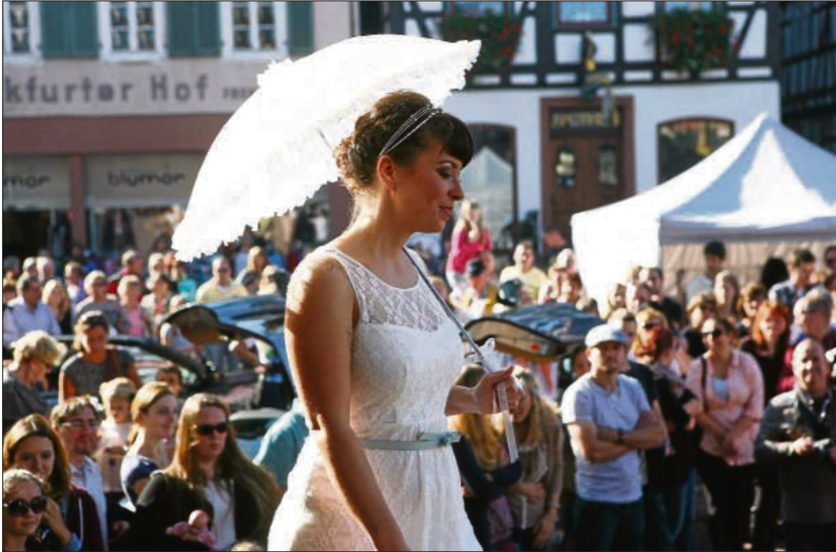
Ob Secondhand oder neu, ob Fachgeschäft oder Outlet - verschiedene Hersteller und Anbieter präsentierten das, was zu einer stilvollen und traditionellen Hochzeit alles dazu gehört.

Seligenstadt (beko) – „Och, was hier los?“ entfuhr es dem Motorradfahrer aus dem Main-Kinzig-Kreis an der Palatium-/Ecke Aschaffener Straße und am Stand der Metzgerei Fecher waren drei Radfahrer aus dem „großen“ Frankfurt völlig verblüfft, dass sie im beschaulichen Seligenstadt keine Ruhe fanden, sondern ein Großereignis, das seinesgleichen sucht. Shoppingtag und Hochzeits-Festtag waren angesagt und nicht nur die Seligenstädter kamen, staunten, informierten sich und kauften. Im Riesensaal waren ebenso viel los wie auf dem Marktplatz und in den Geschäften des Einhardstädtchens. Mehr auf www.op-online.de