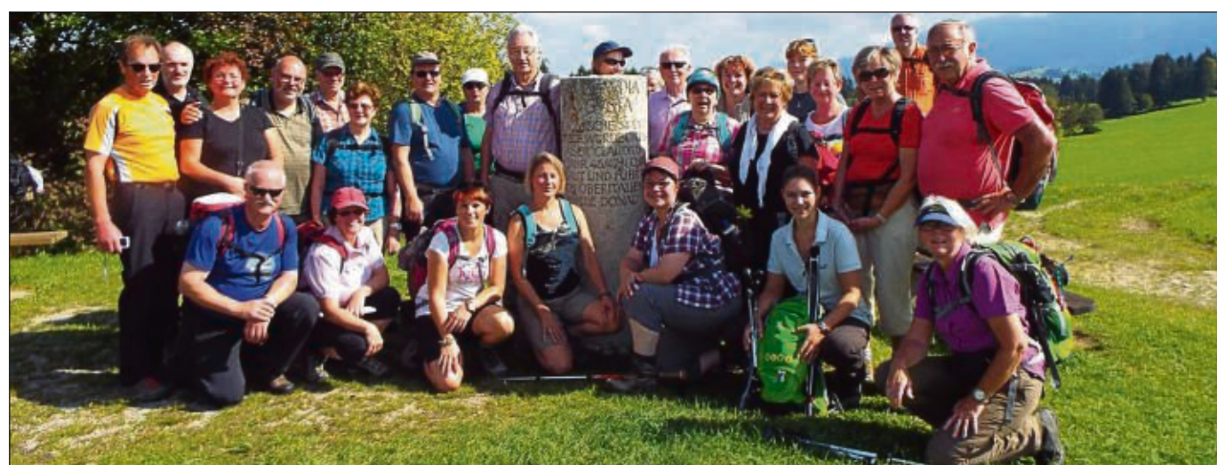
Bei ihrer Alpenüberquerung erlebten die Teilnehmer des Wanderclubs Edelweiß Anfang Oktober wunderbare Wandertage mit strahlendem Sonnenschein. Unter Kaiser Claudius wurde vor 2000 Jahren die Via Claudia Augusta gebaut. Es war die erste Straße, die von der Adria, durch die Po-Ebene über die Alpen bis zur Donau führte. Dieser uralte Kultur- und Handelsweg des Römischen Reiches ist ein großes Stück Geschichte und eine europäische Kulturachse.

hardt Maatz in besonderer Weise in Szene gestellt. Um 14.30 Uhr wird „Der Zauberspiegel“ und um 16.30 Uhr „Das tapfere Schneiderlein“ gespielt. Selbstverständlich ist dieses Theater nicht nur für die kleinsten, sondern die ganze Familie. Im Vorverkauf erhalten Interessenten die Karten zum ermäßigten Preis bei folgenden Vorverkaufsstellen: Tourist-Info, Bücherwurm und der Buchladen. Der Erlös der Veranstaltung kommt dem St. Josefshaus zugute.