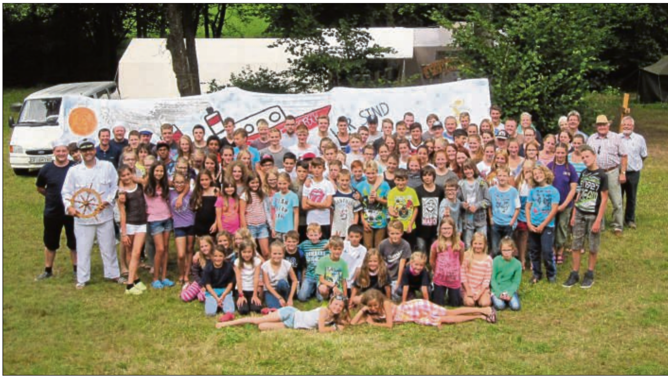
Die „MS Krotzeboersch“ lief diesen Sommer mit dem Zeltlager der Pfarrgemeinde St. Nikolaus Klein-Krotzenburg an Bord zur ersten Kreuzfahrt in das grüne Meer des Odenwaldes aus. Als Heimathafen diente den 120 Kindern, Gruppenleitern, der Kombüsecrew sowie den Leichtmatrosen nebst Lagerleitung während der zwölf Tage andauernden Reise das schöne Elztal bei Limbach-Laudenberg. Die Offenbach-Post berichtete ausführlich.

Sich anmelden können Interessenten per E-Mail an flohmarkt-st.marien@gmx.net .