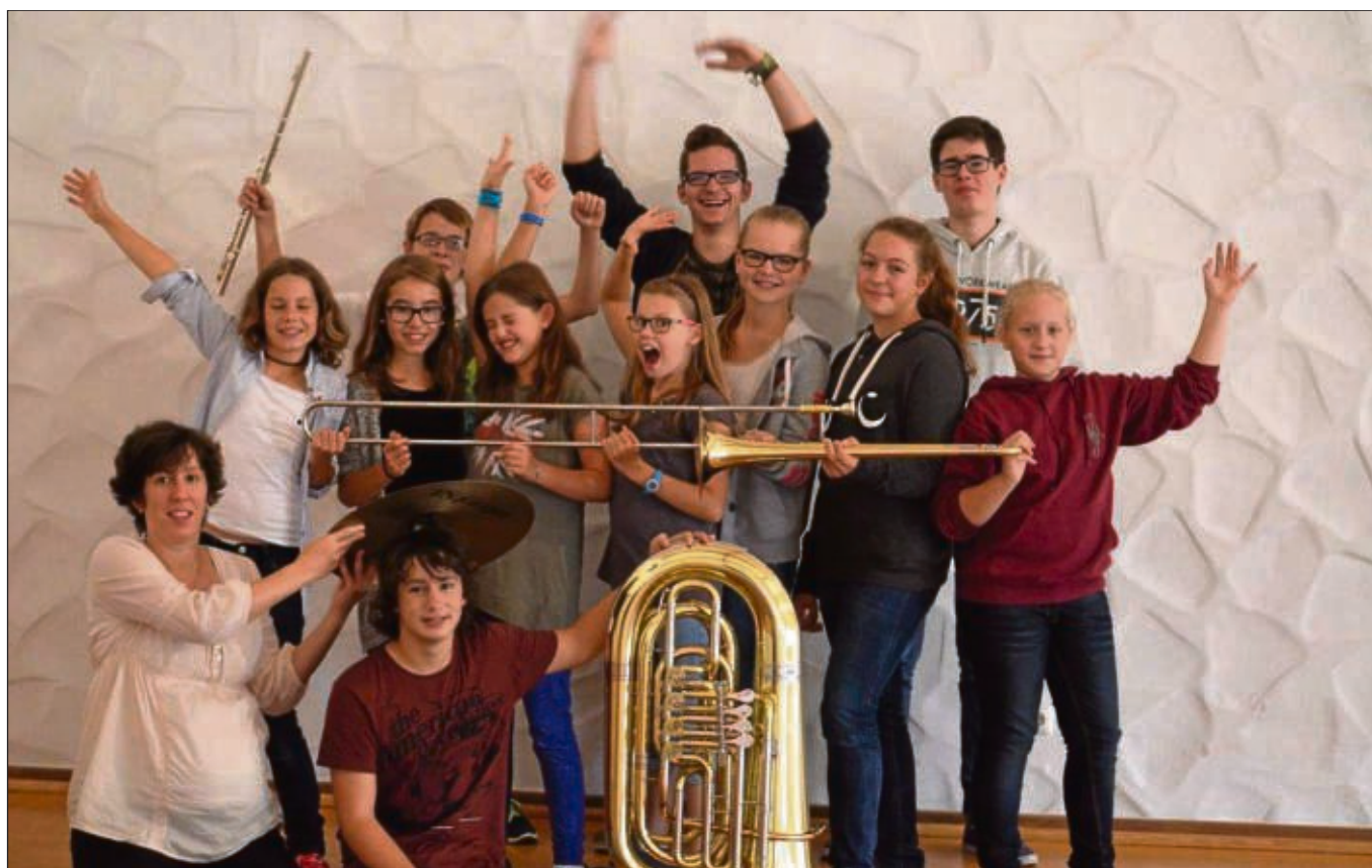
Mit viel Power bereitet sich das Vororchester der Musikgesellschaft Eintracht Hainstadt auf das Herbstkonzert am Samstag, 8. November, in der Sporthalle in Hainstadt vor. Den ganzen Probetag wurde fleißig geübt, leckere Pizza liesen sich alle gut schmecken und auch der Spaß kam nicht zu kurz bei den „kleinen Profis“, wie auf dem Bild zu sehen ist.