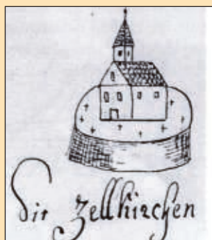
Die Zellkirche anno 1740.