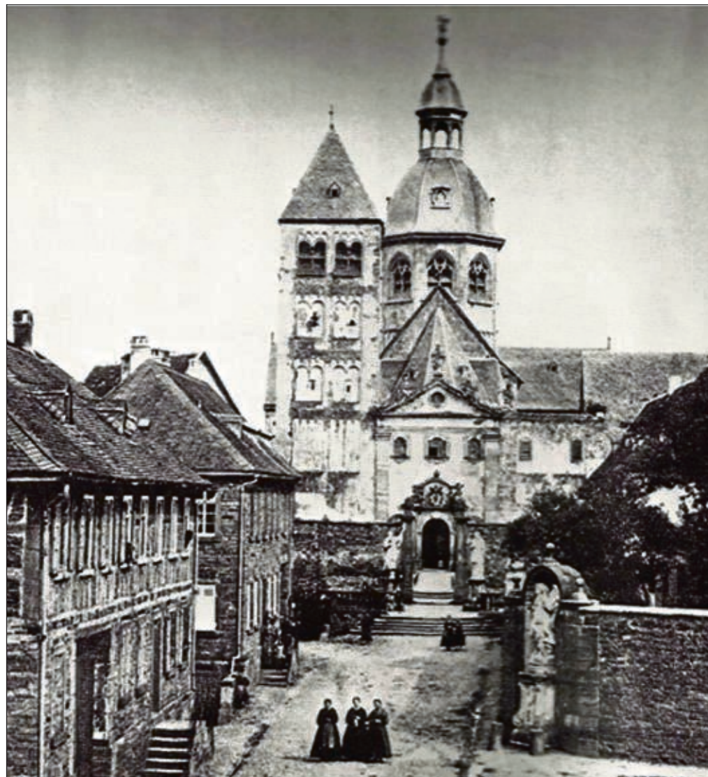
Die Elnhard-Basilika anno 1849. Damals zu dieser Zeit etwa wurde der „Chor an der Basilika“ als Kirchengesangsverein gegründet, später mit dem Namen „Cäcilien-Verein“. Der Chor an der Basilika feiert am 16. November das 165-jährige Bestehen.