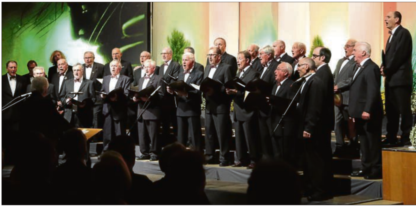
Erste Kulturwoche war nun in Zellhausen: Der erfolgreiche Männerchor des Gesangvereins Harmonie eröffnete mit seinem Auftritt im Bürgerhaus die erste Zellhäuser Kulturwoche.

Zellhausen (Iena) – Die katholische Kindertagesstätte St. Wendelinus Zellhausen veranstaltet einen vorsortierten Flohmarkt am Sonntag, 23. November, im Bürgerhaus Zellhausen. Öffnungszeiten sind von 11.30 bis 13.30 Uhr und für werdende Mütter schon ab 10.30 Uhr. Angeboten auf dem Flohmarkt werden unter anderem Herbst- und Wintersachen sowie Großteile und Spielsachen. Der gesamte Erlös kommt der Kindertagesstätte zu Gute.