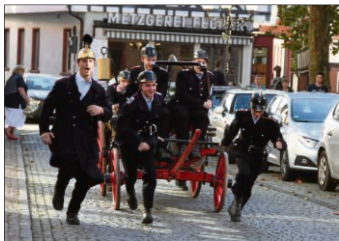
Mit Muskelkraft wurde das Löschgerät aus dem Jahre 1893 an die Einsatzstelle gezogen, bevor Feuerwehrleute und Zuschauer Wasser aus dem Marktplatzbrunnen pumpeten.