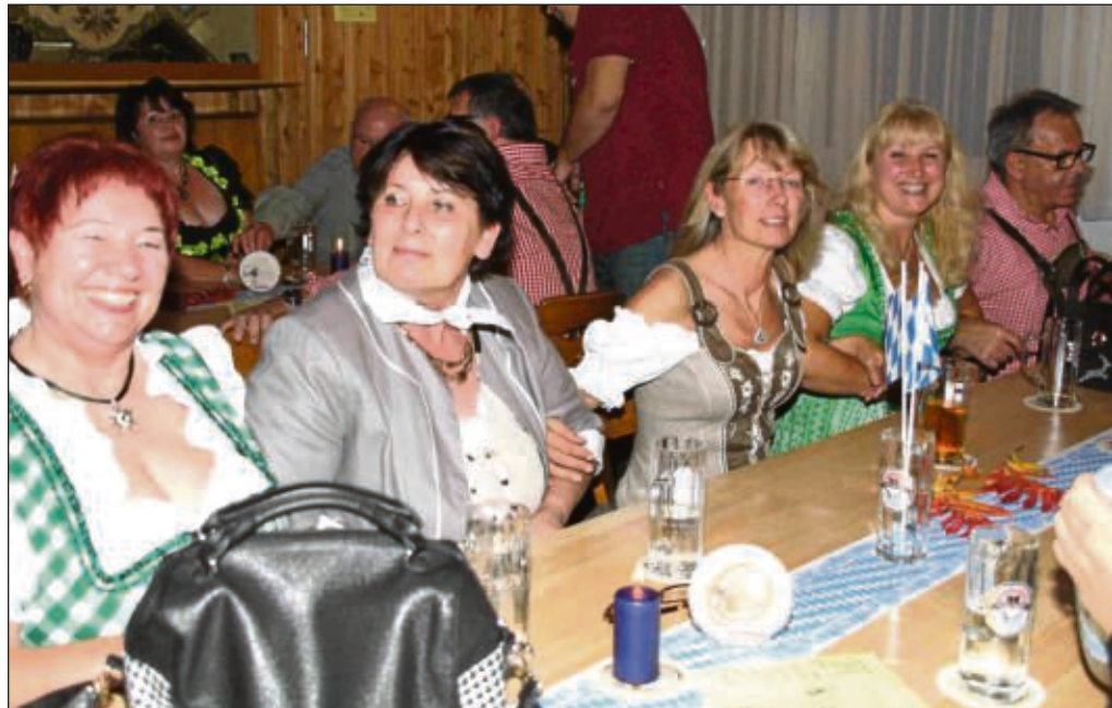
„O'zapft is“ hieß es beim Gesangverein Liederfreund Froschhausen, der am Wochenende sein Oktoberfest feierte. Bei deftigen Speisen und „Wiesentypischen“ Getränken feierten die Besucher im Sängerkloster bis tief in die Nacht.