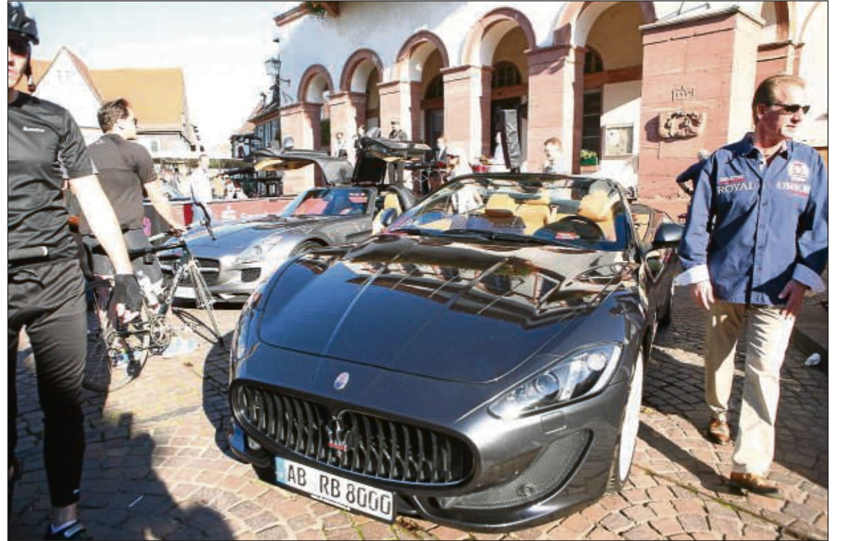
Ob mit dem Maserati, mit dem Mercedes, einem anderen Luxusauto oder mit der Pferdekutsche – am Sonntag informierten sich die Besucher beim Hochzeitsfesttag, wie man denn zur Hochzeit unterwegs sein kann.