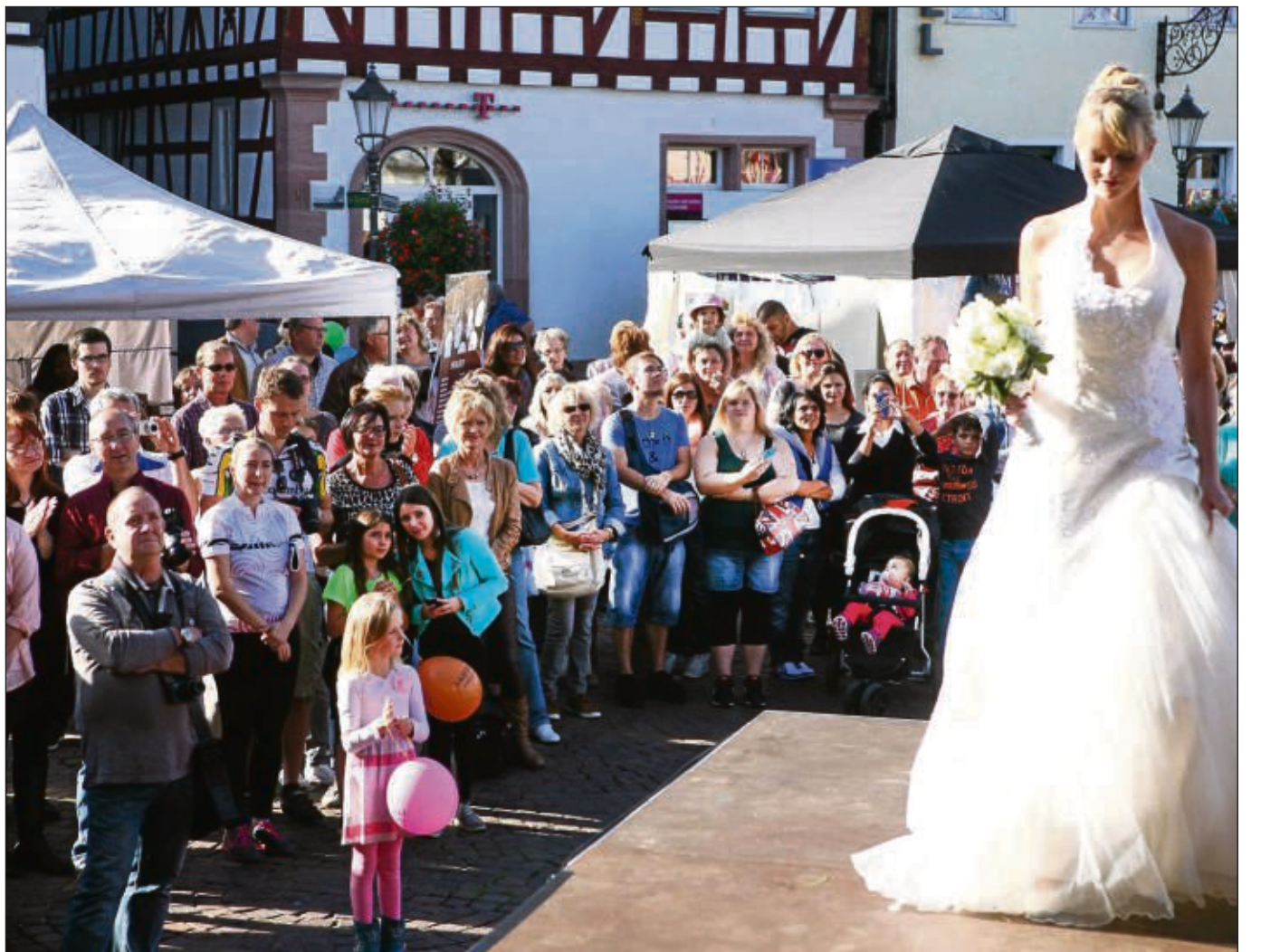
Brautkleid-Angebote für den „schönsten Tag im Leben“: Die Modenschau auf der Marktplatzbühne war einer der Publikumsrenner beim Seligenstädter Hochzeitstag am Sonntag, aber auch im Riesensaal gab es vielfältige Informationen und Aktionen. Mehr heute im SHB auf Seite 8.