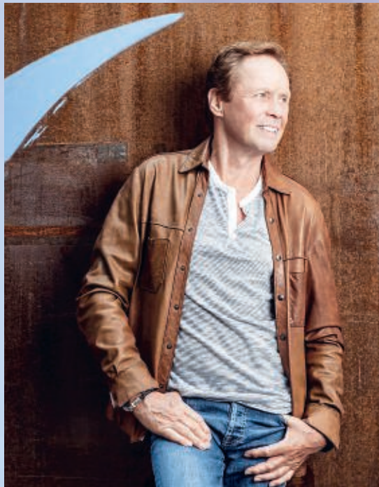
Peter Kraus