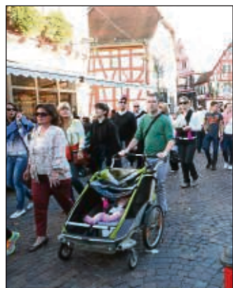
Unterwegs waren wieder viele Menschen beim Shoppingtag in der Einhardstadt.