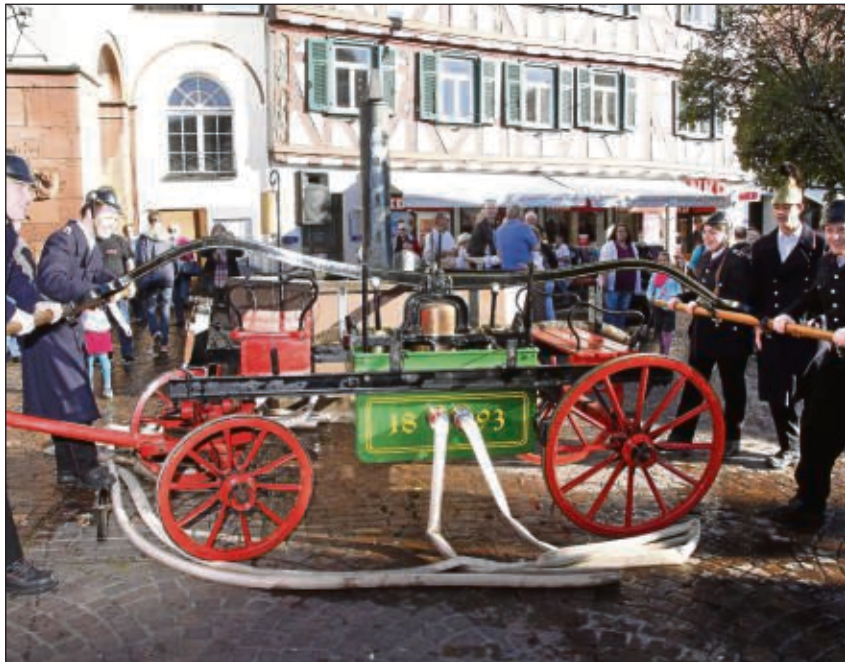
Mit Muskelkraft wurde für das Löschgerät aus dem Jahre 1893 an der Einsatzstelle Wasser aus dem Marktplatzbrunnen gepumpt.

Zöller. Zurückblicken kann die Feuerwehr auf ein großartiges Sommerfest im Juni, auf einen spektakulären Technik-Tag rund um das Feuerwehrhaus und letztendlich auf die historische Großübung am Seligenstädter Rathaus.