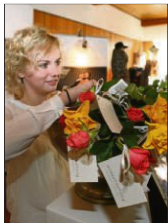
Viefältige Informationen und Neues rund um die Hochzeit gab es an den Ständen im Riesensaal.