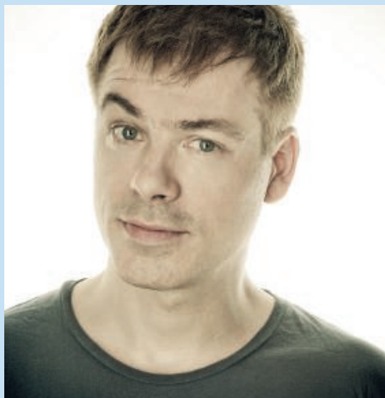
Michael Mittermeier