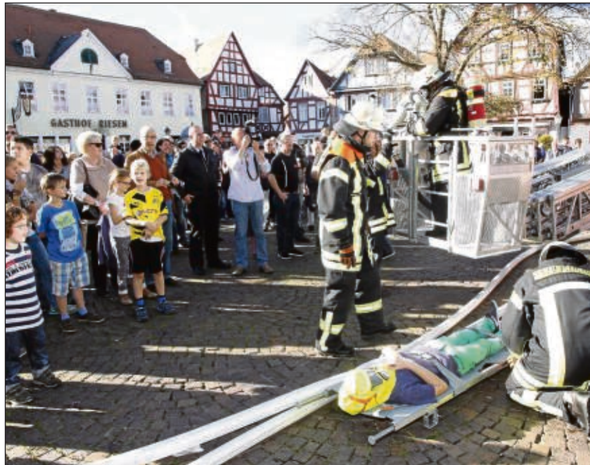
Zahlreiche Beobachter hatte die Freiwillige Feuerwehr Seligenstadt während der Großübung auf dem Marktplatz.