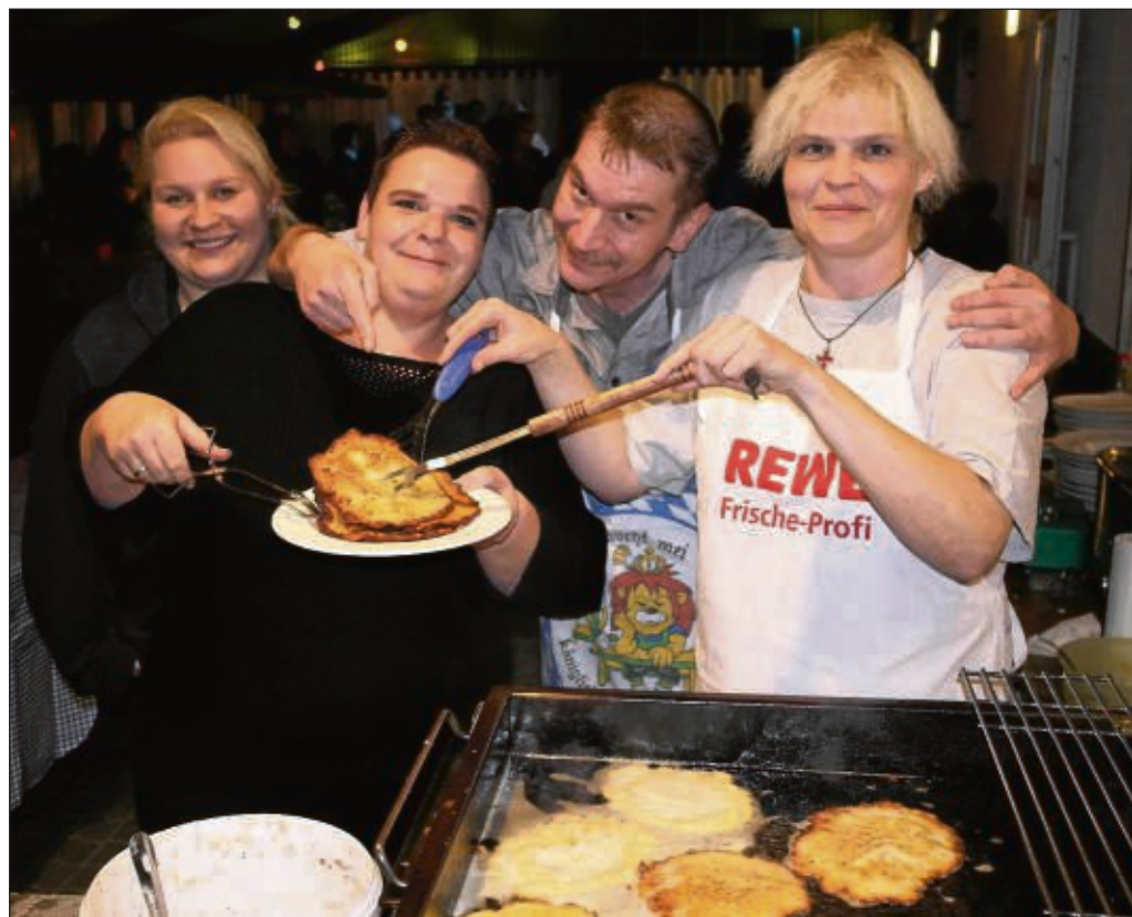
Mit „Auf geht's zur Kartoffel-Fete“ lockte die Freien Turnerschaft Hainstadt zum Sportplatz am Katzenfeld 1 wieder einige Besucher an. Es gab wieder alles rund um die Kartoffel, wie Folienkartoffel mit frischem Dip, Wiener Kartoffelsuppe, Kartoffelsuppe nach Omas Art und hausgemachte Kartoffelpuffer mit Äppelbrei. DJ Musik sorgte für Stimmung.