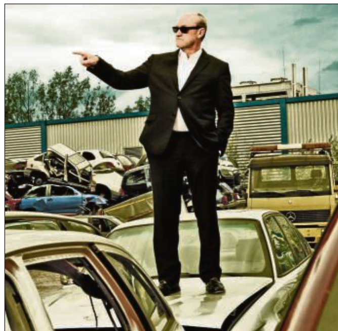
Comedian Bodo Bach ist am 27. November im Seligenstädter „Riesensaal“ zu Gast.

schweren Exemplaren ist alles möglich. Zum Abschluss findet am Sonntag, 23. November, 17 Uhr, ein Lichtergottesdienst statt. Gast im Lichtergottesdienst ist der Gospelchor „PlentyGoodRoom“ aus dem Raum Aschaffenburg. Das Kerzenziehen ist ohne Voranmeldung möglich. Die Kerzen können während der Öffnungszeiten der Kerzenwerkstatt und dann bis Weihnachten jeweils sonntags von 12 bis 13 Uhr im Gemeindezentrum in Froschhausen, Am Klinggraben 1c, erworben werden. Infos: ☎ 0179 6901083.