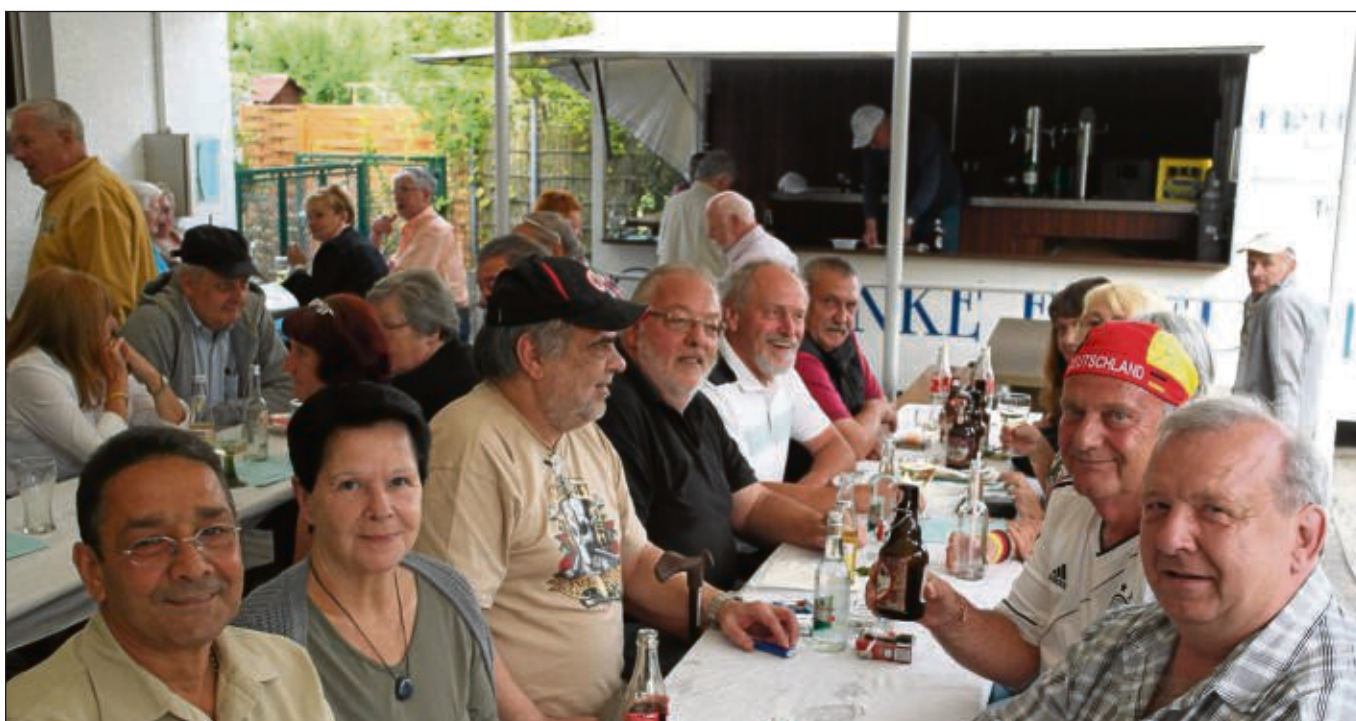
Der Sozialverband VdK-Ortsverband Hainburg veranstaltete ein Grillfest auf dem Gelände des Kleingartenbauvereins Hainstadt. Bei Grilltem und Getränke konnten sich die neuen Mitglieder vom letzten und diesem Jahre gegenseitig kennenlernen.

rungen gebildet, so dass die Mitglieder mehr in die Organisation einbezogen werden. Dieses Jahr freut sich der Chor, sein 45-jähriges Bestehen zu feiern und man plant im Herbst ein Konzert unter dem Arbeitstitel „Sing dem Herrn ein neues Lied“. Dazu sind auch interessierte „Neusänger“ eingeladen, donnerstags um 19.30 Uhr im Pfarrheim bei den Proben herein zu schnuppern.