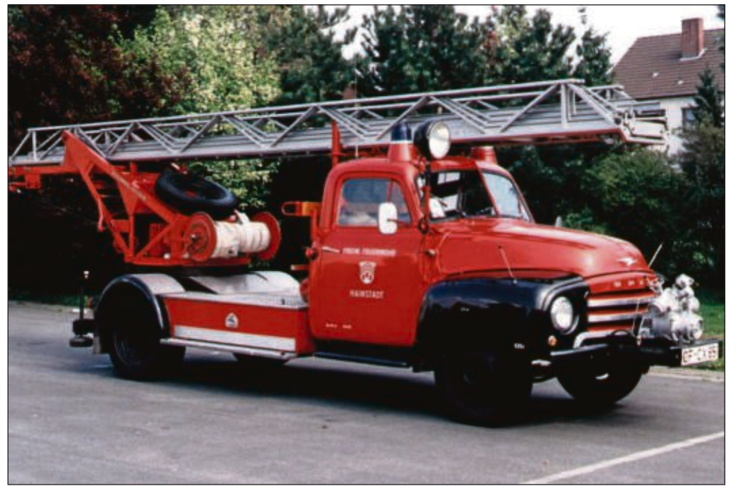
Auch die alte Drehleiter (Baujahr 1960) der Hainstädter Feuerwehr ist bei der Oldtimer-Show während des Feuerwehrtages zum 125-Jährigen vom 18. bis 21. Juli zu sehen.