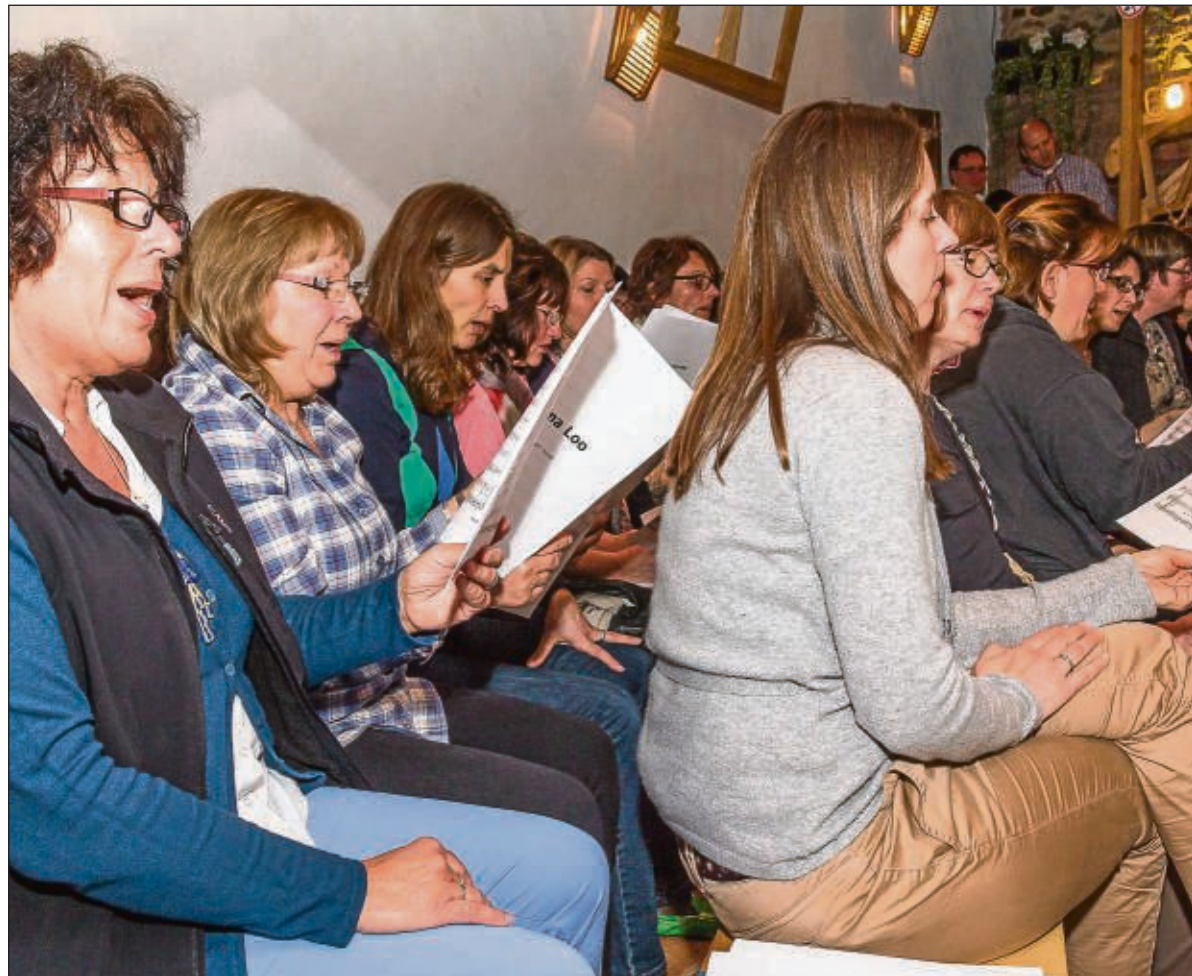
Fleißig geübt wird derzeit bei „Vox Musica“ und am 19. Juli präsentieren die Frauen und Männer ein Potpourri beim Konzert in der Gärtnerei Löwer.

Seligenstadt (sofa) – Einen Ausflug nach Vierzehnheiligen und Schloss Banz veranstaltet die Katholische Frauengemeinschaft Deutschlands (kfd) der Basilika Pfarrei am Mittwoch, 9. Juli, mit Abfahrt um 7 Uhr am Busparkplatz am Friedhof (durch die schwierige Verkehrssituation in der Stadt musste die Busabfahrtstelle verlegt werden). Es gibt noch wenige freie Plätze. Interessenten sollten sich daher umgehend unter der Telefonnummer 06182 24875 anmelden. Der Preis für die Busfahrt und Führung beträgt 20 Euro.