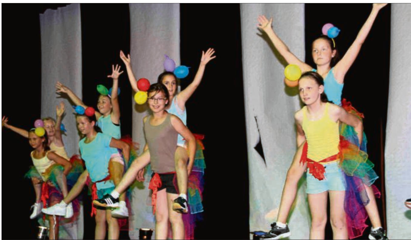
150 Sportler der Turngemeinde Zellhausen begeisterten die Zuschauer im Bürgerhaus Zellhausen mit ihrer Turnshow „Traumwelten“.

Klein-Krotzenburg (sofa) – „Schpil-sche mir a Liddele“ heißt es am Freitag, 11. Juli, um 20 Uhr in der Klein-Krotzenburger Synagoge (Kettelerstraße 6), wenn Charlotte Flörke und Birgit Imgram Heiteres und Nachdenkliches für gespitzte Ohren und neugierige Menschen vortragen. Ein spannungsreicher Bogen jiddischer Musik wird mit Akkordeon, Flöten, Gitarre und Gesang gespannt, heitere und leise Töne laden zum Nachdenken und Schmunzeln ein. Neben rhythmischen Eskapaden und verhaltenen Melodien kommt auch das Wort nicht zu kurz: Texte jüdischer Autoren geben hintergründige Alltagssituationen wieder, die aber immer mit einem Augenzwinkern begleitet werden. Traditionell gibt es bei den Sommerkonzerten in der Synagoge auch Getränke und Leckereien, wozu der Arbeitskreis Ehemalige Synagoge einlädt.