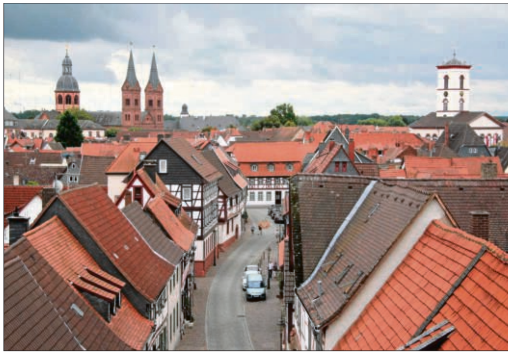
Seligenstadt von oben kann man betrachten vom Steinheimer Torturm aus unterhalb des Turmmännchens oder eben am Samstag mit Hilfe der Firma Zöller.