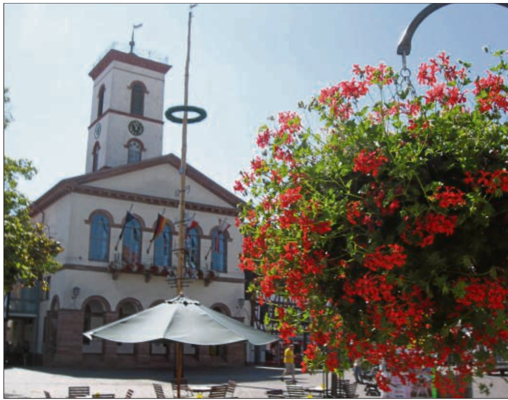
Neben der derzeitigen Fussball-Weltmeisterschaft gibt es noch mehr, an dem man sich erfreuen kann - die wieder sprießende Blumenpracht in Seligenstadt. Die zarten Pflänzlein müssen gehegt und gepflegt werden, um der Stadtflora-Jury die Entscheidung schwer zu machen.

In diesem Sinne Euch Allen eine schöne Zeit..... Euer Turmmännche