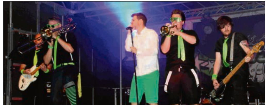
Der Freitagabend bei den Feierlichkeiten des Wanderclubs Edelweiß in Seligenstadt stand ganz im Zeichen der Jugend mit großer Open-Air Veranstaltung von Shit To Hit Konzert mit „The Punch „N“ Judy Show“.

Wanderclub Edelweiß Seligenstadt feierte 90-Jähriges