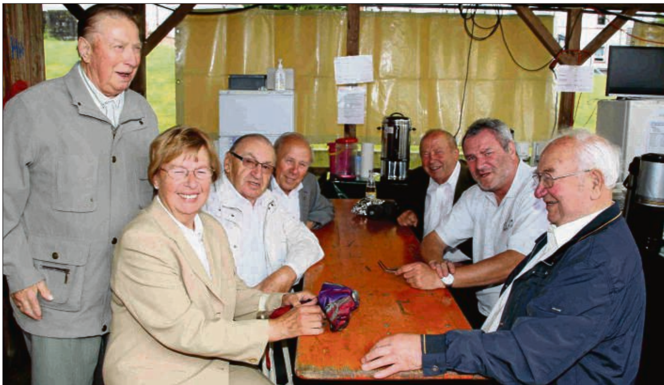
Viele Besucher kamen zum kulinarisch-musikalischem Sommerfest der Sängervereinigung Mainflingen ans Mainufer und auch die Gastchöre gaben ein Stelldichein.