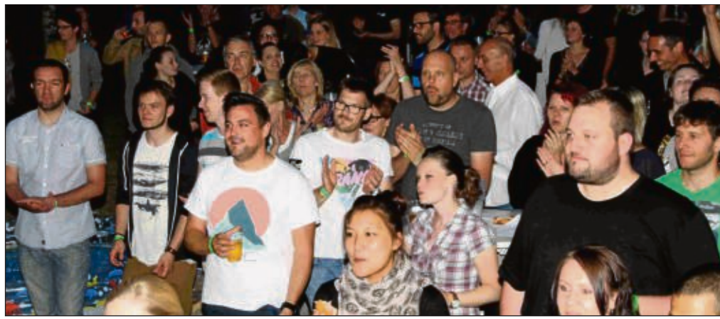
Gut besucht waren die Veranstaltungen beim Wanderclub Edelweiß in Seligenstadt trotz schlechter Witterung.