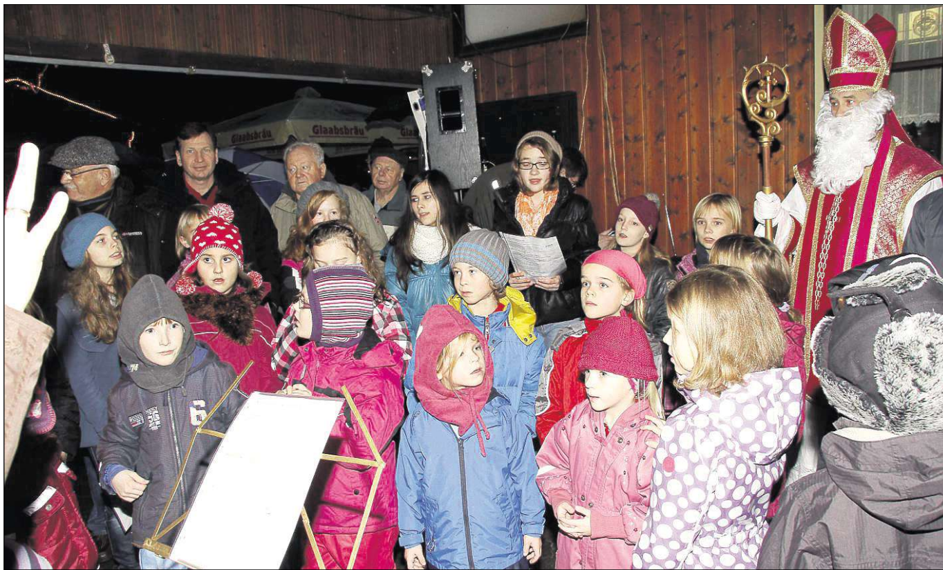
Winterfest bei der Sängervereinigung Germania in Klein-Welzheim und nach dem Auftritt des Kinderchors gab es natürlich zur Freude der Kinder die Bescherung durch den Nikolaus.

Sängervereinigung Germania Klein-Welzheim