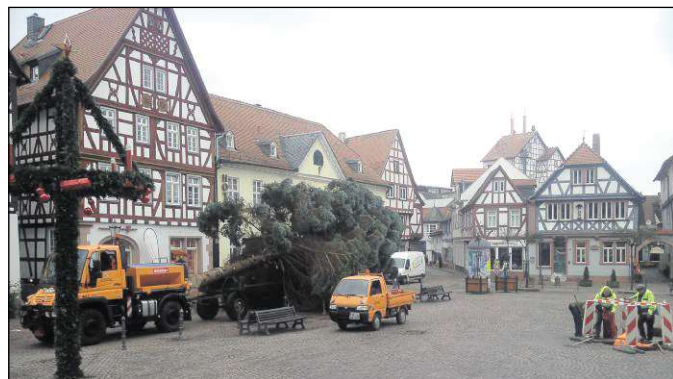
Dienstag mittag: Da lag er noch, kurz darauf, zierte er den Marktplatz: Der Weihnachtsbaum 2012.