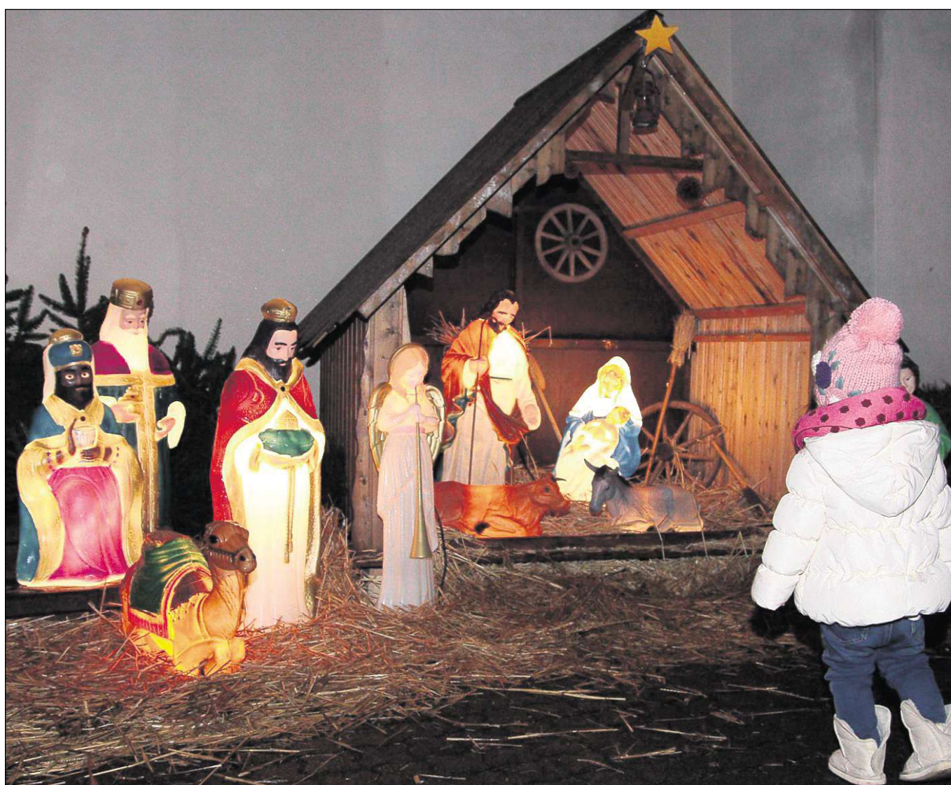
Eine Krippe in Lebensgröße, bestaunt nicht nur von den Kleinen. Die erstmals aufgebaute Krippe hat es den Kindern beim Zellhäuser Weihnachtsmarkt besonders angetan.

Ergänzend singt der Chor, zum Teil im Wechsel mit der Gemeinde, die bekannten Weihnachtslieder „Ich steh an deiner Krippe hier“, „Nun freut euch ihr Christen“ sowie das „O du fröhliche“.