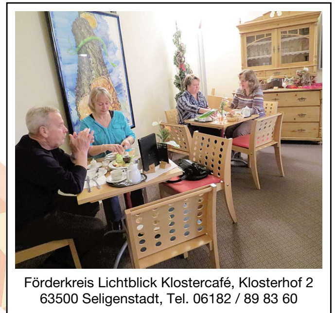
Förderkreis Lichtblick Klostercafé, Klosterhof 2 63500 Seligenstadt, Tel. 06182 / 89 83 60