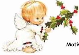
Motiv nicht mitzählen!!!

Auf unseren folgenden Gewinnspielseiten haben wir für Sie diese Engelchen verteilt.