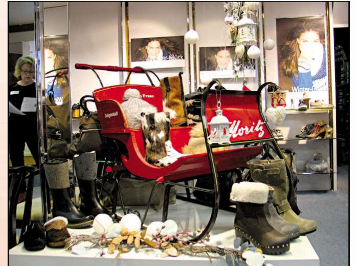
Schuhhaus Franz, Aschaffener Str. 17 63500 Seligenstadt, Tel. 06182 / 2 24 11