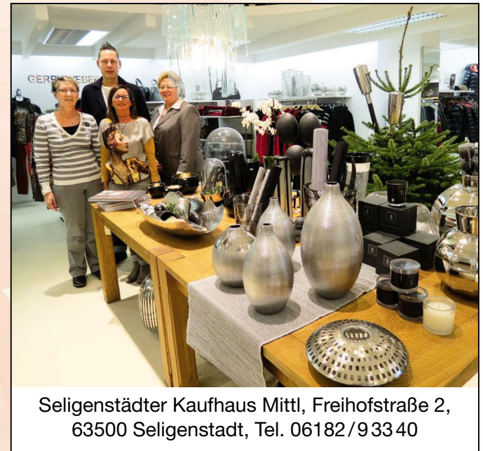
Seligenstädter Kaufhaus Mittl, Freihofstraße 2, 63500 Seligenstadt, Tel. 06182/9 33 40