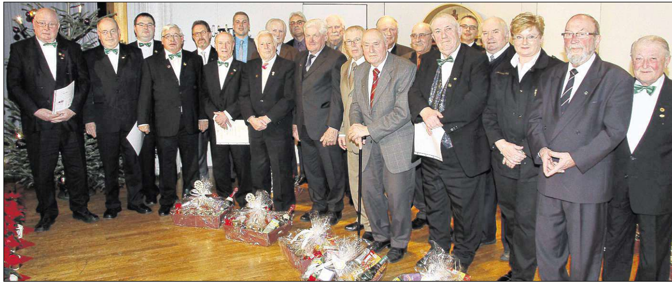
Zahlreiche Ehrungen gab es neben zwei unterhaltsamen Theaterstücken beim Familienabend des Gesangvereins Harmonie Froschhausen im Bürgerhaus.