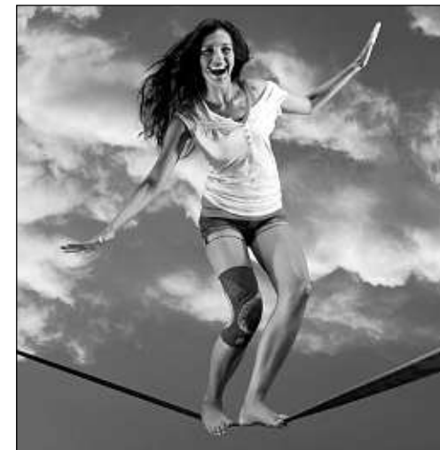
Besonders junge Frauen sind oft von einem vorderen Knieschmerz betroffen – Kniebandagen (z. B. die neue Genumedi PT) können helfen.

(bbs/mm) Wenn Beschwerden neben, unter oder hinter der Kniescheibe auftreten, spricht man häufig von einem vorderen Knieschmerz bzw. „patellofemoralem Schmerzsyndrom“ (Patella = Kniescheibe). Beim Treppensteigen, nach langem Sitzen oder beim Sport „zwickt das Knie“. Häufige Ursache: ein Ungleichgewicht der inneren und äußeren Oberschenkelmuskulatur. Dabei ist der äußere Muskel verspannt bzw. verkürzt und der innere geschwächt. Jetzt können spezielle Kniebandagen helfen (z. B. Genumedi PT). Ein ringförmiges Silikonkissen (Pelotte) umfasst und unterstützt die Kniescheibe. An der Außenseite sollte die Silikon-Pelotte verstärkt sein. Dann kann sich die Kniescheibe nicht aus dem Gleitlager des Oberschenkelknochens nach außen verschieben. Eine besondere Massagewirkung entsteht durch eingearbeitete Pads im oberen, äußeren Bereich der Bandage. Sie wirken auf den Triggerpunkt, so kann sich die äußere Oberschenkelmuskulatur wieder entspannen. Gleichzeitig wird der innere, vordere Oberschenkelmuskel aktiviert. Durch den zusätzlichen Gurt über der äußeren Pelotte kann