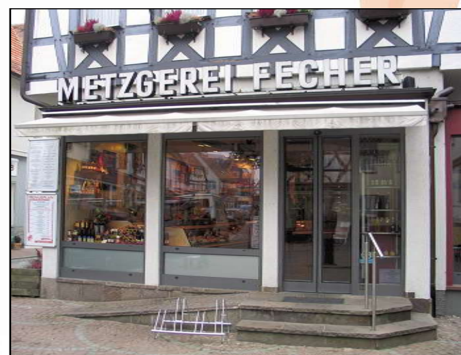
Metzgerei Fecher, Aschaffener Str. 31 63500 Seligenstadt, Tel. 06182 / 33 22