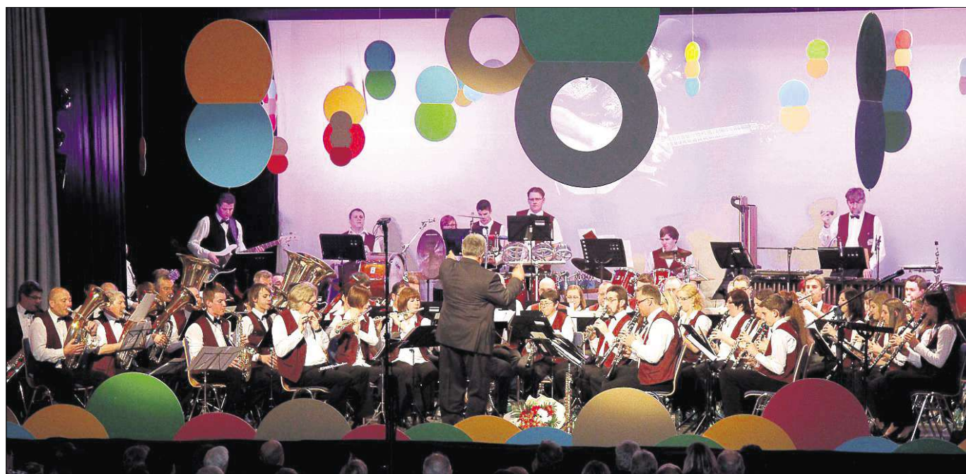
Einen absoluten Glanzpunkt in den Konzerteigenen der Region setzte vergangenen Samstag das Bläserorchester des Musikvereins Klein-Welzheim. Mit mehr als 70 Aktiven war das Orchester im Bürgerhaus aktiv.

Musikverein Klein-Welzheim setzte einen Glanzpunkt im Konzerteigenen der Region