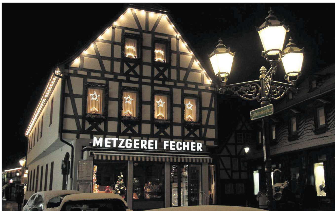
Markt und Straßen stehn verlassen, still erleuchtet jedes Haus - und so manches Haus erstrahlt in diesen adventlichen Tagen vor dem dritten Advent allemal festlich...