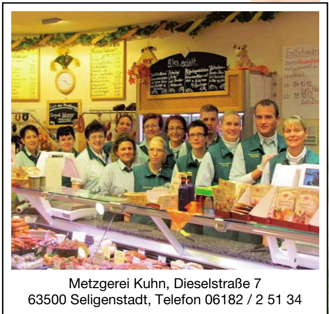
Metzgerei Kuhn, Dieselstraße 7 63500 Seligenstadt, Telefon 06182 / 2 51 34