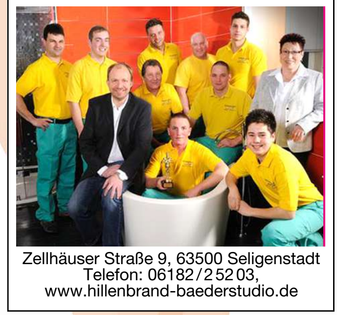
Zellhäuser Straße 9, 63500 Seligenstadt Telefon: 06182/2 52 03, www.hillenbrand-baederstudio.de