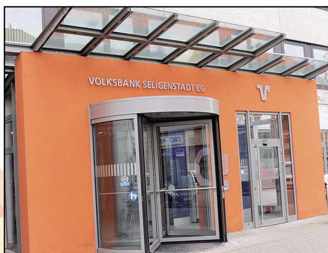
VOLKSBANK SELIGENSTADT EG, Bahnhofstraße 24 63500 Seligenstadt, Tel. 06182/89050,