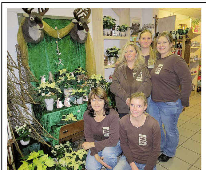
Blumen Zöller, Babenhäuser Straße 10 63500 Seligenstadt, Tel. 06182 / 37 65