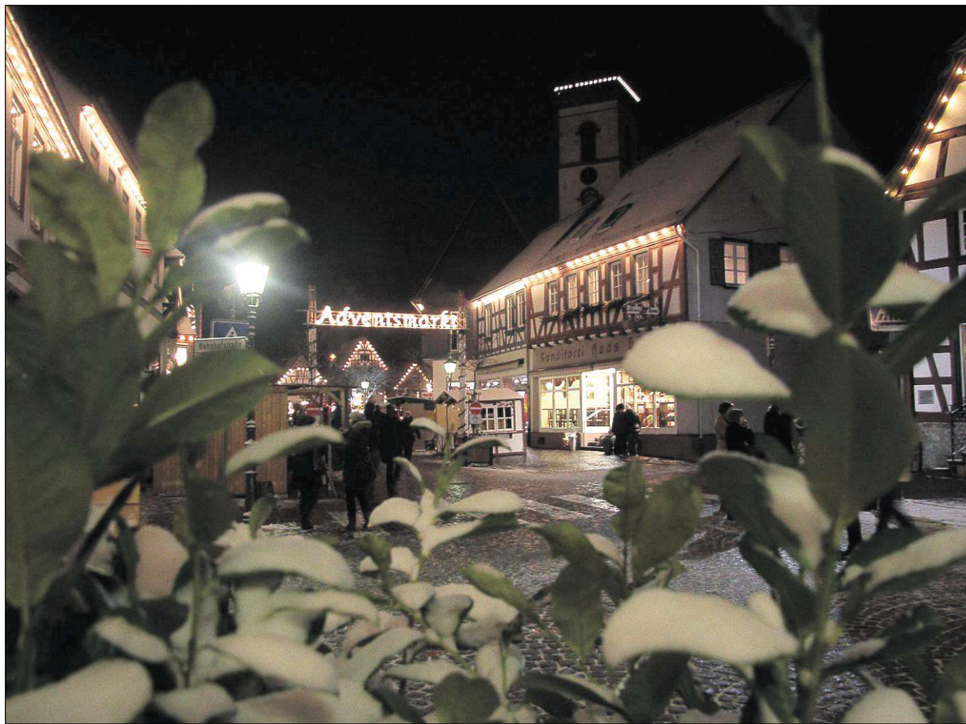
Einen schneebedeckten Adventsmarkt erlebten die Seligenstädter und ihre Gäste am vergangenen Wochenende und am Wochenbeginn. Noch bis zu diesem Sonntag, 16. Dezember, ist der Adventsmarkt auf dem Marktplatz geöffnet, wochentags von 15 bis 20 Uhr, am Samstag von 10 bis 20 Uhr und am Sonntag dann von 12 bis 20 Uhr. Mehr rund um den Adventsmarkt in dieser Ausgabe des SHB mit dem Weihnachtsgewinnspiel.