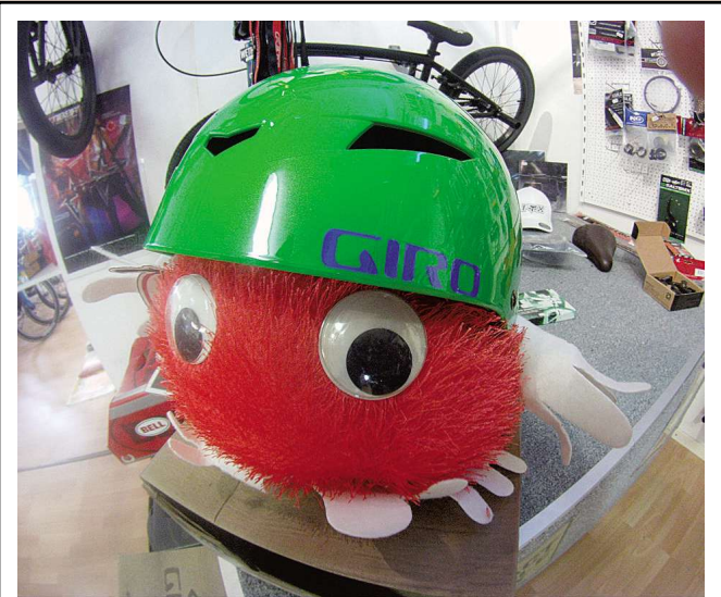
Radsport König, Ferdinand-Porsche-Straße 16a 63500 Seligenstadt, Tel. 06182 / 89 94 94