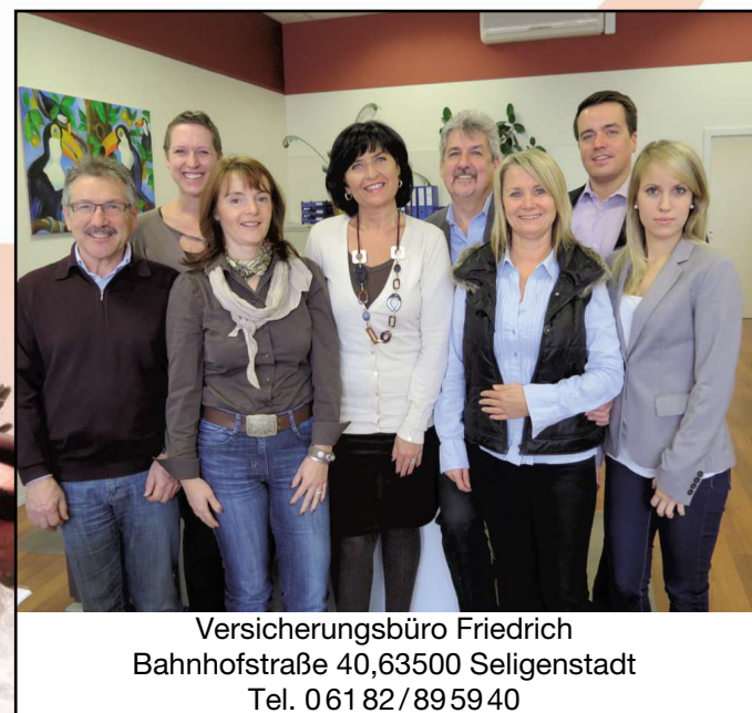
Versicherungsbüro Friedrich Bahnhofstraße 40, 63500 Seligenstadt Tel. 061 82/895940