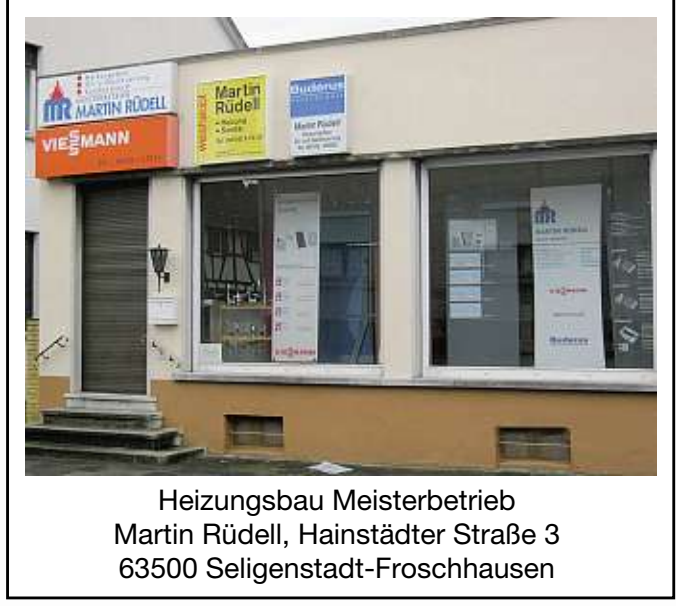
Heizungsbau Meisterbetrieb Martin Rüdell, Hainstädter Straße 3 63500 Seligenstadt-Froschhausen