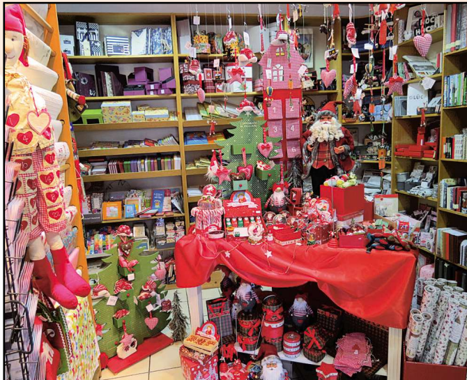
Der Papierladen Seligenstadt, Bahnhofstraße 40 63500 Seligenstadt, Tel. 06182/3573