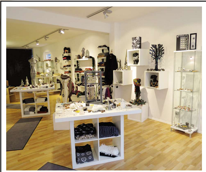
Schmuck Stein, Bahnhofstraße 6 63500 Seligenstadt, Tel. 06182 / 6 40 83 00