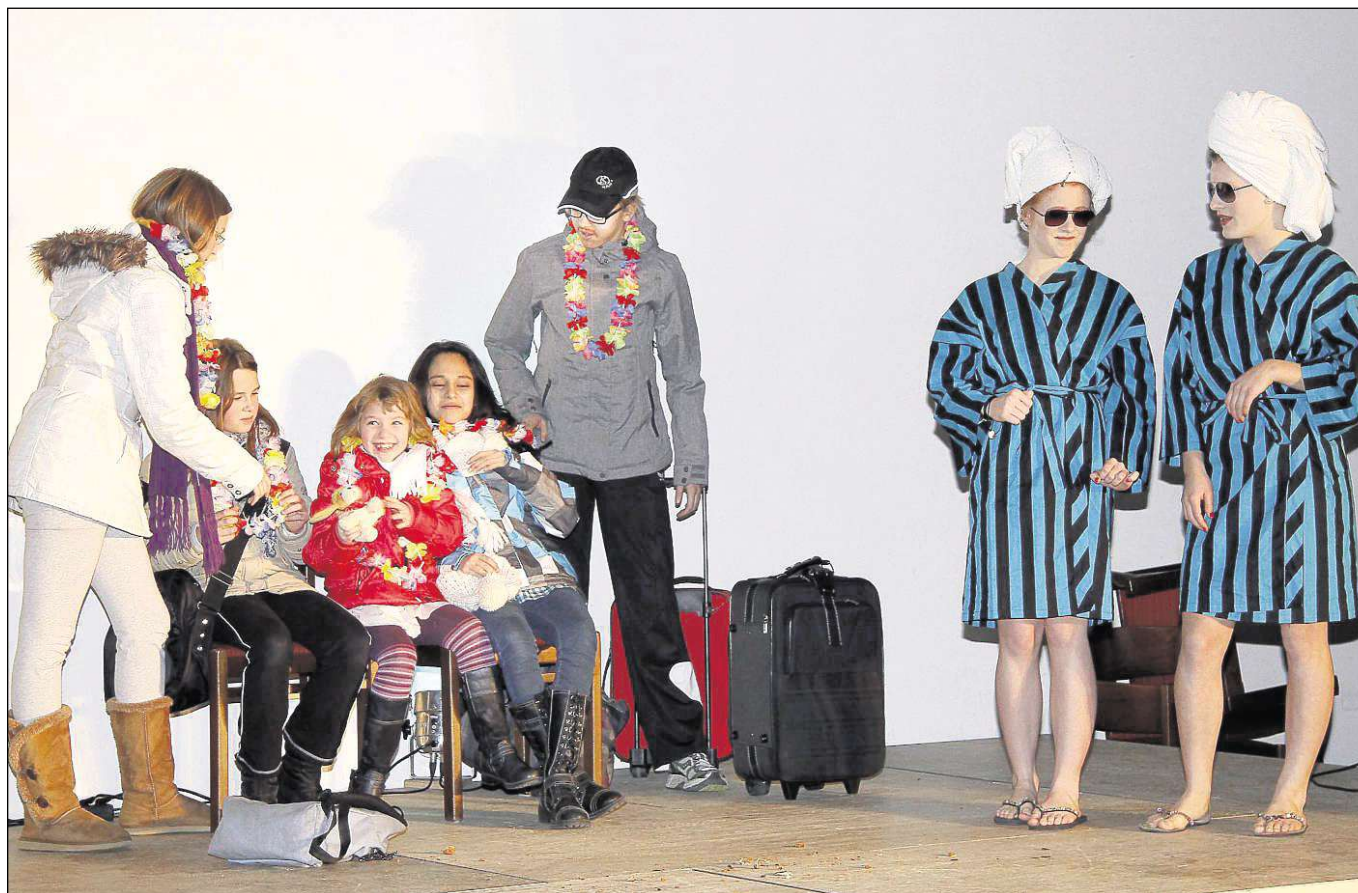
„Weihnachten unter Palmen“ war Thema eines besonderen Weihnachtserlebnisses, zu dem der Verein „Theater am Main“ in den Jakobssaal eingeladen hatte, um mit dem Kindertheaterkurs die Nachwuchsarbeit zu präsentieren.