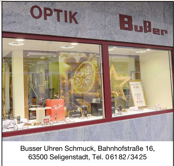
Busser Uhren Schmuck, Bahnhofstraße 16, 63500 Seligenstadt, Tel. 061 82/34 25