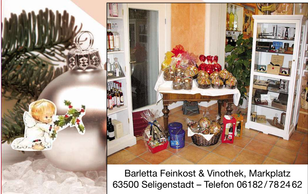
Barletta Feinkost & Vinothek, Marktplatz 63500 Seligenstadt – Telefon 06182/782462