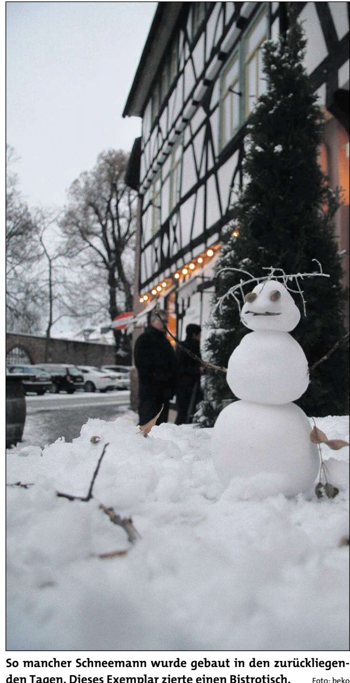
So mancher Schneemann wurde gebaut in den zurückliegenden Tagen. Dieses Exemplar zierte einen Bistrotisch.