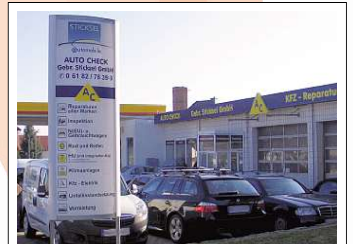
AUTO CHECK Gebr. Sticksel GmbH Offenbacher Landstr. 40, 63500 Seligenstadt, Tel.: 0 61 82/7 83 90