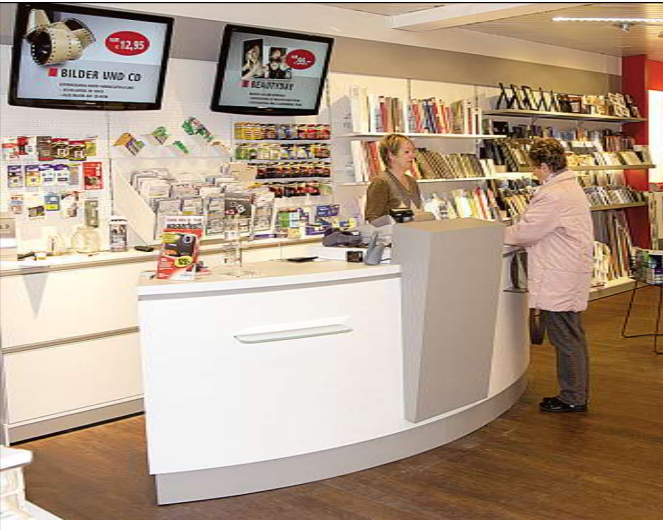
Foto Ehrmann, Bahnhofstraße 4, 63500 Seligenstadt, Tel. 06182 / 2 70 07