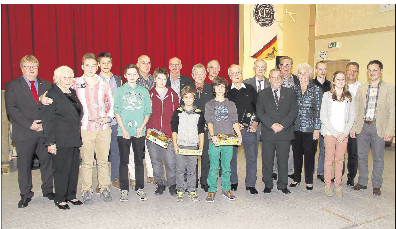
Langjährige Mitglieder und erfolgreiche Sportler ehrter der Motorsportclub Klein-Krotzenburg im Verlaufe seines Familienabends in der Radsporthalle. Zudem gab es ein buntes Programm.

Hainburg (beko) – Die Johannes-Gutenberg-Schule im Ortsteil Hainstadt lädt für Donnerstag, 29. November, um 19.30 Uhr zu einem Informationsabend alle Eltern ein, deren Kinder im nächsten Schuljahr in die Schule kommen werden. Die Eltern sogenannter „Kann-Kinder“ sind auch willkommen. Es wird das Modell der Jahrgangsmischung vorgestellt. Alle Aktionen, die noch vor der Einschulung stattfinden, werden bekannt gegeben.