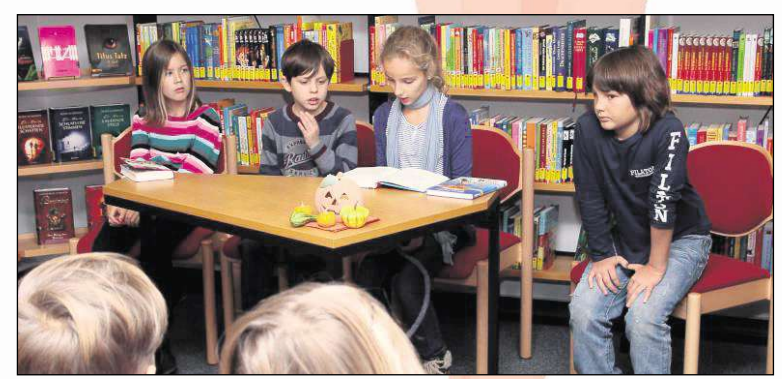
Schüler der Johannes-Kepler-Schule lesen beim bundesweiten Vorlesestag auch in der katholischen öffentlichen Bücherei in einer öffentlichen Veranstaltung aus ihren Lieblingsbüchern vor und begeistern damit nicht nur die Gleichaltrigen.

DACHDECKERMEISTERBETRIEB Ausführung sämtlicher Dach- und Spenglerarbeiten Jörg Bleckmann DACHDECKERMEISTER Dach- Wand und Abdichtungstechnik Tel. 061 82/64 00 62 63512 HAINBURG www.bleckmann-bedachungen.de