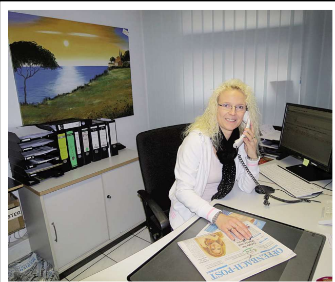
Offenbach Post, Aschaffenburger Straße 8 63500 Seligenstadt, Tel. 06182 / 92 98 31