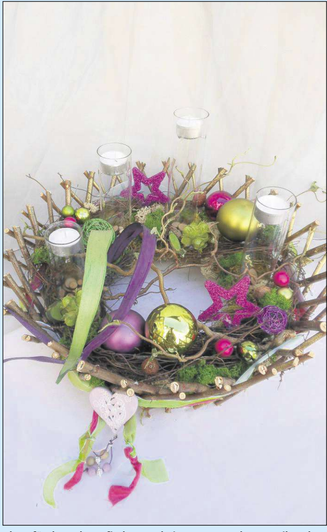
Ideen für den Advent findet man beim „etwas anderen Weihnachtsmarkt“ im Kloster Seligenstadt.