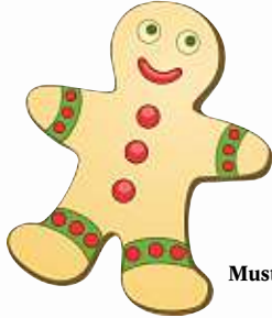
Muster nicht mitzählen!!!

Und so funktioniert es: Auf den folgenden Seiten finden Sie das HAINBURGER WEIHNACHTSGEWINNSPIEL mit den Erscheinungen am 29.11., 06.12. und 13.12.2012 in unserer Zeitung. Bitte zählen Sie die Lebkuchenmänner der jeweiligen Ausgabe und schreiben Sie Ihr Ergebnis mit dem Datum der Ausgabe auf den ausgeschnittenen Gewinn Coupon.