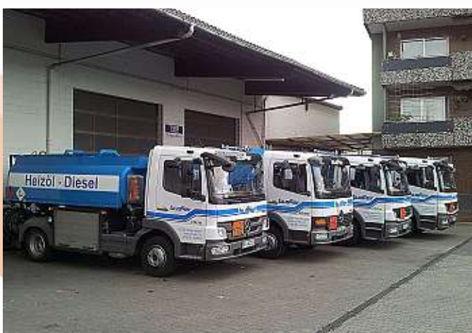
Brennstoffe Adrian Busser Waldstraße 24 · 63500 Seligenstadt Tel. 0 61 82/6 00 59