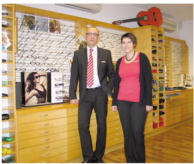
Schwind Sehen + Hören, Frankfurter Straße 19 63500 Seligenstadt, Tel. 06182 / 82 94 30