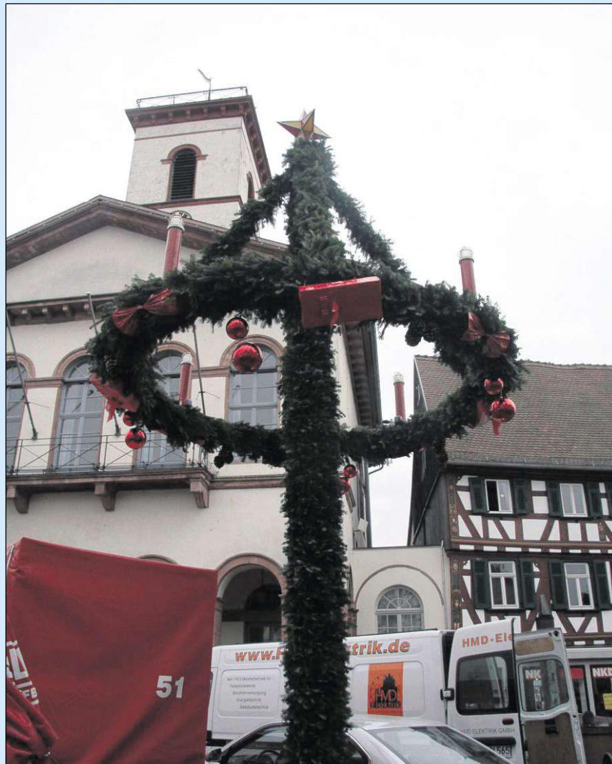
Der Adventskranz im Schatten des Rathauses steht, die Fahrzeuge der Handwerker sind inzwischen auch weg. Es kann losgehen mit dem Adventsmarkt 2012 in der Einhardstadt. Pünktlich im Vorfeld des ersten Adventssonntages.

Seligenstadt (sofa) – Einen Adventskalender in Form eines Flyers brachte nun die Stadt Seligenstadt heraus. Dies teilte die Stadtverwaltung mit. Ihren Angaben zufolge ist das weihnachtliche Angebot von über 50 Veranstaltungen chronologisch aufgelistet und umfasst die Zeit von Donnerstag, 29. November, bis Montag, 31. Dezember. Die Adventsflyer sind kostenlos im Rathaus, in der Tourist-Info im Einhardhaus, im Bürgeramt und den Verwaltungsstellen Froschhausen und Kleinwelzheim erhältlich. Darüber hinaus liegen die Programme in zahlreichen Geschäften, Cafés und Lokalen zum Mitnehmen aus. Online ist der Kalender auf der städtischen Homepage unter www.seligenstadt.de zu finden.