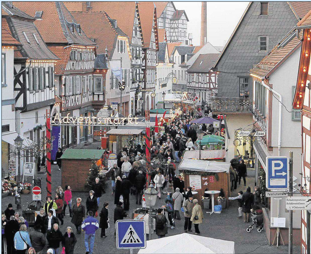
Der Seligenstädter Adventsmarkt wird heute um 17 Uhr offiziell eröffnet.