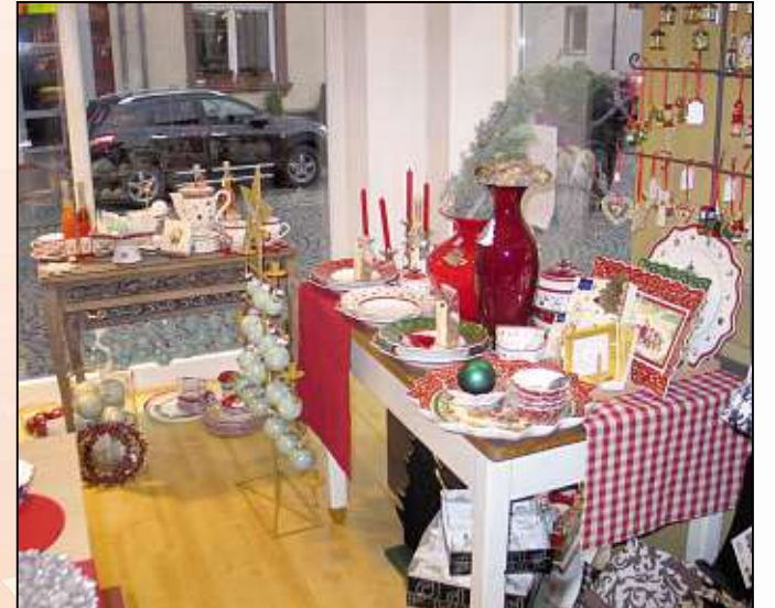
Link Ihr Treffpunkt Zuhause, Freihofstraße 1, 63500 Seligenstadt, Tel. 06182/3301