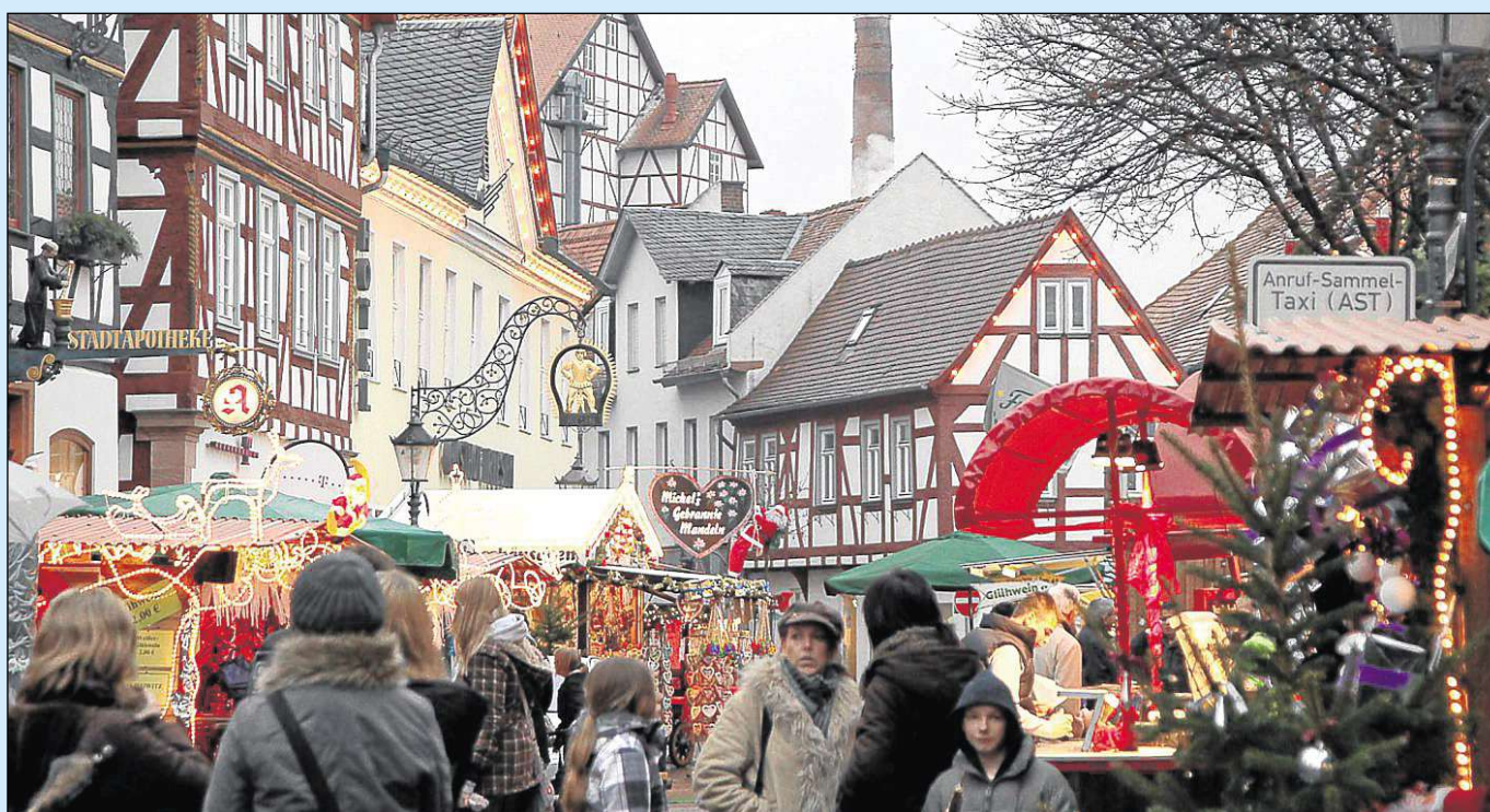
Ab heute abend soll es wieder so aussehen beim Adventsmarkt auf dem Seligenstädter Marktplatz.