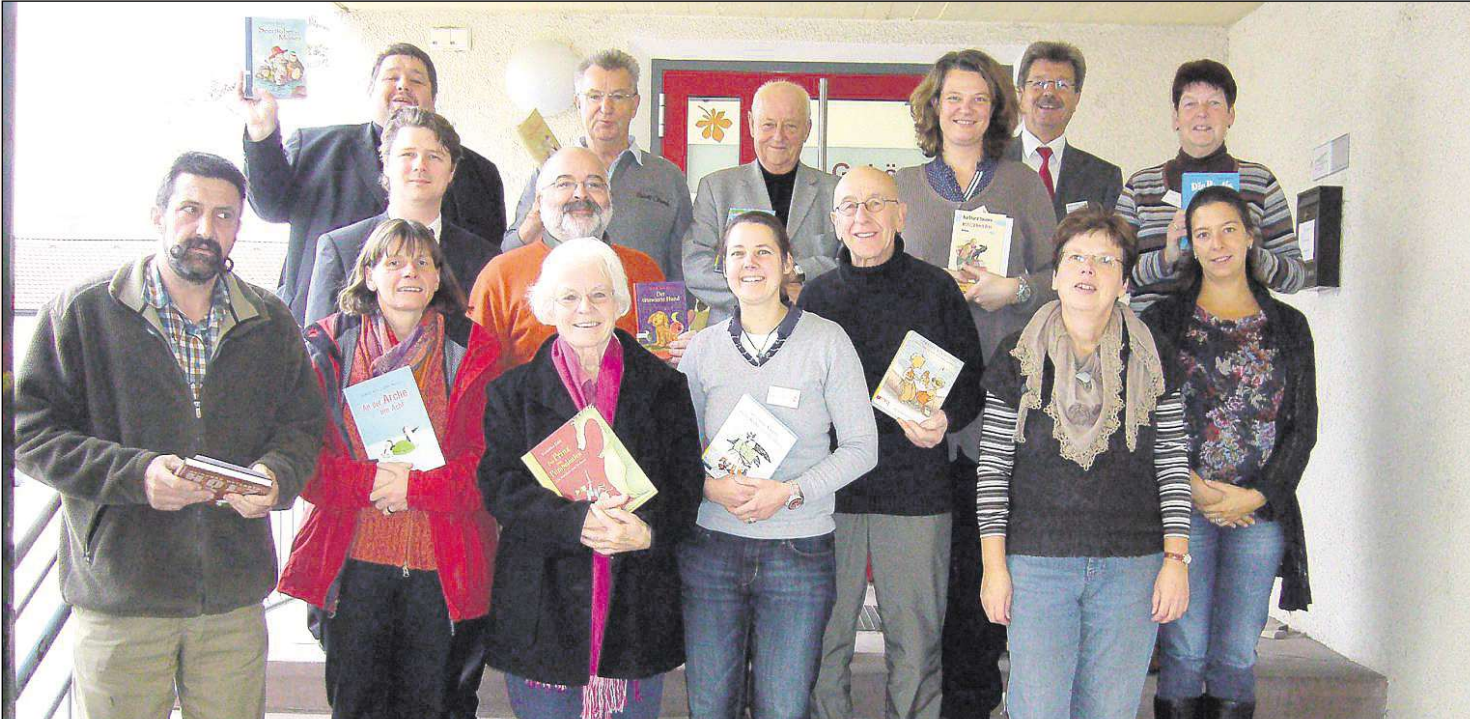
Prominente Vorleser hatte die Johannes-Kepler-Schule zu Gast am Vorlesestag.

Winter Immobilien Winter Immobilien Offenbacher Landstraße 86 • 63512 Hainburg Tel. 0172 / 3795469 • www.winterimmobilien.com