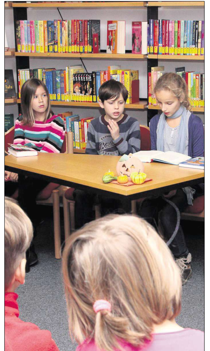
Schüler der Johannes-Kepler-Schule in Hainburg lesen am bundesweiten Vorlesetag aus ihren Lieblingsbüchern vor.

Klein-Krotzenburg (ega) – Auch in diesem Jahr lud die katholische Bücherei in Klein-Krotzenburg unter dem Motto „Schüler lesen für Schüler“ zu einem Vorlesetag ein. Acht Schülerinnen und Schüler der dritten und vierten Klasse der Johannes-Kepler-Schule lasen am Freitagnachmittag aus ihren Lieblingsbüchern vor und wurden am Ende von der Bücherei-Mitarbeiterin Gabi Distel mit einem Dankeschön in Form eines kleinen Präsentes belohnt. In diesem Jahr waren am neunten bundesweiten Vorlesetag rund 48 000 Vorlesende in ganz Deutschland aktiv, um bei ihren Zuhörern die Lust aufs Lesen zu wecken.