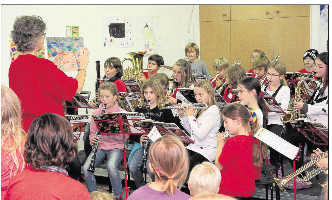
Ihren ersten Auftritt vor Publikum hatte die Bläserklasse der Freien Schule Zellhausen am Tag der offenen Tür.

Zellhausen (ega) – Mit einem bunten Programm aus Musikvorführungen, Akrobatik, Tänzen und Hausführungen in deutscher und englischer Sprache lockte die Freie Schule Zellhausen ihre Besucher zum Tag der offenen Tür in das ehemalige Grundschulgebäude an der Schulstraße. Zudem konnten sich Interessierte über das Konzept der integrierten Gesamtschule informieren, dessen Grundlage das fächerübergreifende Lernen in altersgemischten Gruppen ist. Die Freie Schule nimmt bereits Kinder ab Beginn ihres letzten Kindergartenjahres auf und unterrichtet sie im aktuellen Schuljahr bis zur achten Klasse. Bis zum Jahr 2015 ist die schrittweise Erweiterung bis Klasse zehn geplant.