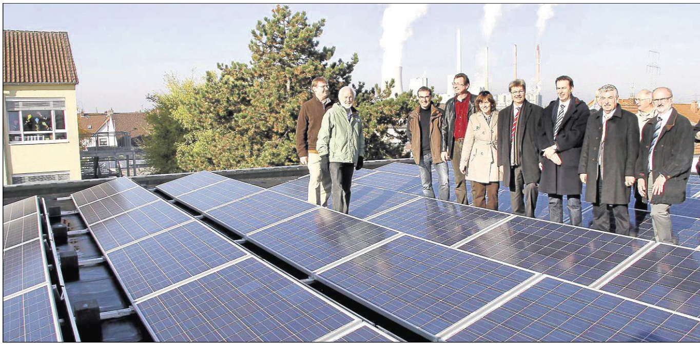
Eine Photovoltaikanlage gibt es mittlerweile auch auf dem Betreuungsgebäude der Hainburger Johannes-Kepler-Schule. Zehn Bürger wurden als Investoren für dieses alternative Kraftwerk gewonnen.