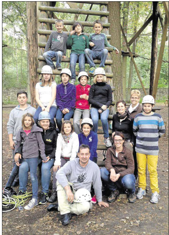
Einen Ausflug in den Waldseilgarten der Fasanerie in Klein-Auheim unternahm dieser Tage Jugendliche des Tennisclubs Grün-Weiß Zellhausen. Die Abenteuer in den Baumwipfeln des Wildparks forderte von den Tennissacks neben Geschicklichkeit und Kraft auch Mut und Überwindung. Ein Picknick unter Bäumen mit in Rucksäcken herangeschleppten Essen und Trinken war eine willkommene Unterbrechung, um sich für den nächsten Wipfelaufstieg wieder zu stärken.

kelbach, Herbert Stegmann, Willy Bohnenberger sowie Horst Götze. Als Aktiver verstarb Erich Klein. Im Anschluss an den Gottesdienst werden verdiente Mitglieder geehrt. In einer kleinen Feierstunde werden im Kilianshaus die Urkunden und Präsente überreicht. ● Eine so genannte Vergrünerungsaktion gegen die Überpopulation von Kormoranen am Königsee in Zellhausen gestattet die Unteren Fischereibehörde im Kreis Offenbach jetzt der Gemeinde Mainhausen als Ausnahme (Bundesnaturschutzgesetz, Paragraph 45,7). Ziel ist es, „vor allem durch Schreckschüsse die ansonsten besonders geschützte Tierart zu reduzieren.“ ● Zum Tag der offenen Tür lädt für Samstag, 24. November, von 15 bis 17 Uhr die Kindertagesstätte Villa Kunterbunt (Martinstraße 20) ein. Neben Kaffee und Kuchen können interessierte Eltern beider Mainhäuser Ortsteile an Führungen durch die Einrichtungen teilnehmen.