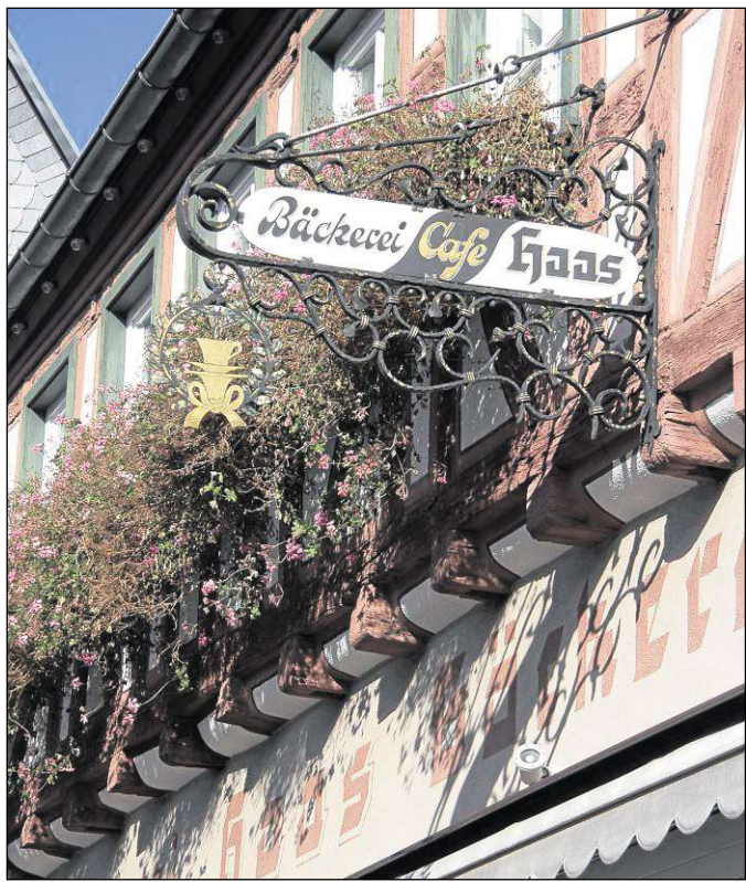
Blumenschmuck in Seligenstadt und so mancher Preisträger wird bald ausgezeichnet.

Seligenstadt (beko) – Die alljährliche Buchausstellung in der Katholischen öffentlichen Bücherei St. Marien (Unterkirche, Steinweg 25, Seligenstadt) findet an den beiden Sonntagen, 4. und 11. November, statt. An beiden Tagen ist der Bücherflohmarkt geöffnet. Hier kann man sich für nur einen Euro pro Buch mit Lesestoff eindecken. Am zweiten Sonntag werden die Gäste mit leckeren Torten und Kuchen im Flohmarktcafé verwöhnt. Um 15 Uhr kommt eine „Zauberin“ und wird den Kindern von der „Zauberin Zilly“ erzählen. Es können auch wieder kleine Geschenke aus Olivenholz erworben werden. Die Öffnungszeiten sind von 9.30 bis 12.20 Uhr und von 14 bis 18 Uhr.