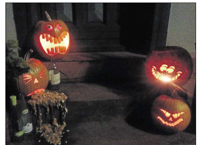
Gestern Abend noch Halloween, die Nacht zu Allerheiligen, heute Beginn des „dunklen Monats“.