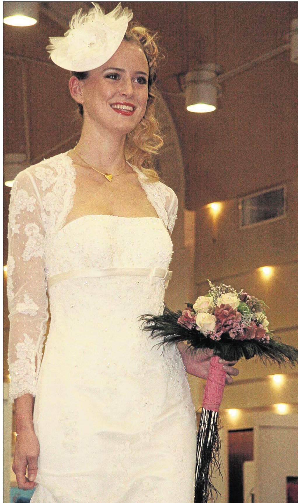
Zweiter Seligenstädter Hochzeitstag war am Sonntag mit zahlreichen Aktionen im Riesensaal und auf dem Marktplatz, parallel dazu verkaufsoffenes Wochenende.

Kriminalliteratur aus der Region und moderne Krimis im Angebot