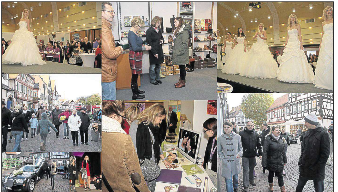
Fachberatung in Schuhgeschäften, zufriedene Geschäftsleute, Stretch-Limo und Hochzeitskutsche auf dem Marktplatz sowie Modenschauen im Riesensaal. Seligenstadt war am Sonntag Ziel zahlreicher Besucher.

Seligenstadt (beko) – gestalten mit dem Besuch Auch auf dem Marktplatz Groß war das Angebot, im Riesensaal bei den Modenschauen und den Ständen am Hochzeitstag. herrschte viel Betrieb und die Geschäftsleute dürften auch zufrieden gewesen sein.