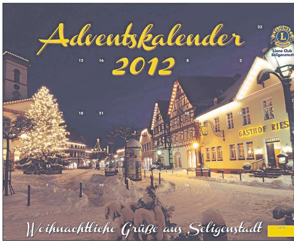
Weihnachtliche Grüße aus Seligenstadt via Adventskalender. Der Lions Club Seligenstadt startet am heutigen Donnerstag wieder seine Aktion, um bedürftige Menschen zu unterstützen und da zu helfen, wo der Staat an seine Grenzen stößt. Mehr dazu im untenstehenden Artikel.