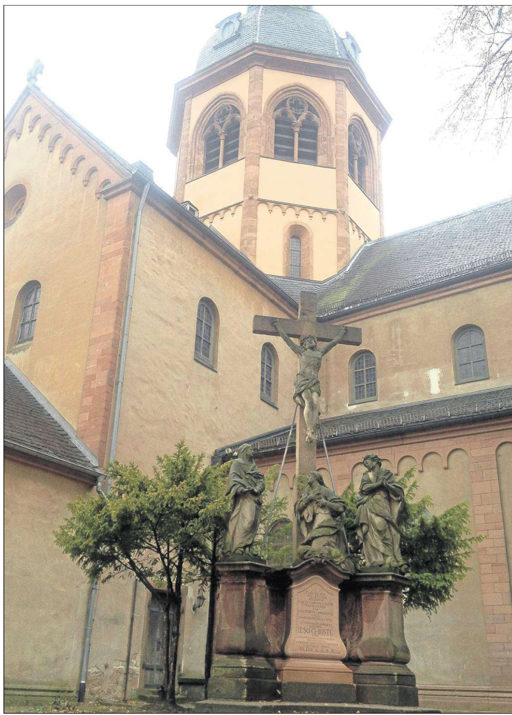
Allerheiligen und Allerseelen sind die ersten Tage im Monat November, dem dunklen Monat, der oft in Zeichen der Trauer steht. Nach dem Halloweenabend und dem Gedenken an alle Heiligen am heutigen Donnerstag stehen an Allerseelen die Verstorbenen im Blickpunkt. Man gedenkt der Verstorbenen, man erinnert sich, man geht auf die Friedhöfe, an die Kreuze.

Einen besinnlichen Monat November wünscht Euch, Euer Turmmännche