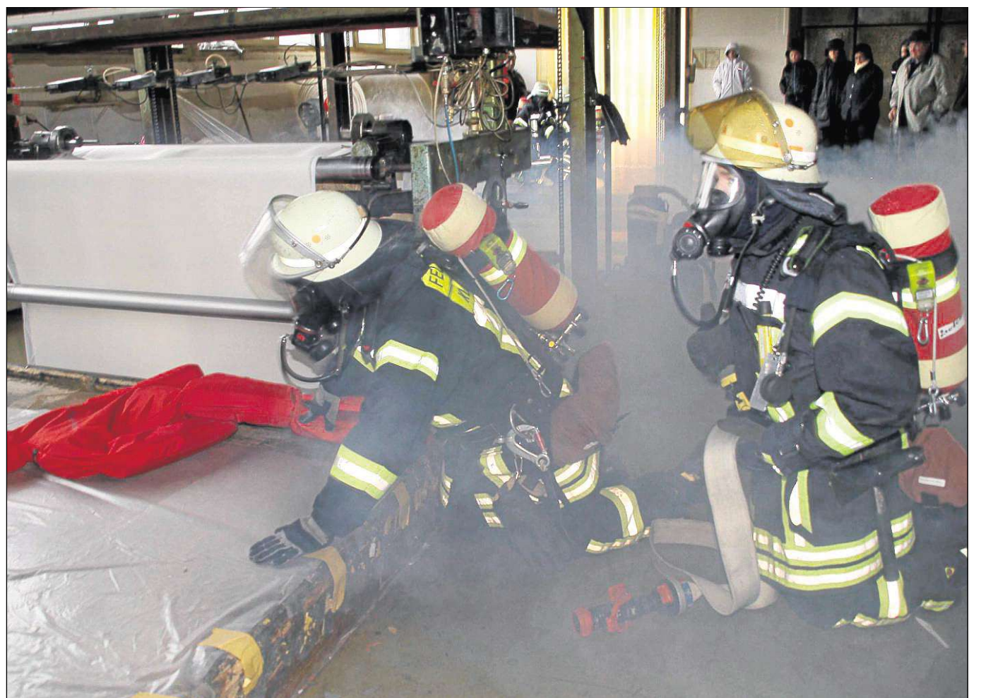
Gekonnt arbeiteten die Wehrleute der Klein-Welzheimer Freiwilligen Feuerwehr während der Abschlussübung vor der Firma Köba an der Hauptstraße auch in Atemschutzanzügen..

Abschlussübung der Klein-Welzheimer Feuerwehr