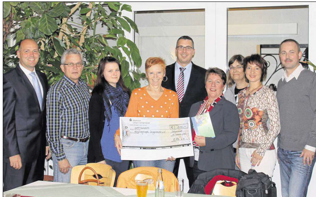
Eine Spende im Wert von 800 Euro überreichte der Europäische Freundeskreis Seligenstadt (EFS) an die Hospizgruppe Seligenstadt und Umgebung. Der Betrag stammt aus dem Verkaufserlös der Büchermeile des EFS während des Frühlingmarktes. Rund 20 000 Kilometer sind die 32 Aktiven im vergangenen Jahr für ihr Engagement gefahren, mehr als 5600 Stunden wurden geleistet für Sterbe- und Trauerbegleitung und mehr. Weitere Informationen im Internet unter www.hospiz-seligenstadt.de und www.efs-seligenstadt.de beko

Wie finde ich die richtige Pflege? Bei plötzlicher Pflegebedürftigkeit gibt es viele Entscheidungen zu treffen. Nutze ich einen professionellen Pflegedienst? Oder ist eine dauerhafte Unterbringung in einem Pflegeheim besser? Die AOK-Pflegeberater helfen auch dabei. Wer eine Pflegeeinrichtung für Angehörige oder sich selbst sucht, kann auch den Pflegenavigator der AOK Hessen im Internet nutzen. Dort sind alle stationären Pflegeheime mit vollstationärer Pflege, Kurzzeit- sowie Tages- und Nachtpflege und alle Pflegedienste verzeichnet. Man kann mit dem Navigator Informationen über Pflegeeinrichtungen in seiner näheren Umgebung einholen oder in einem bestimmten Postleitzahlenbereich suchen. Die Pflegeeinrichtungen stellen dort auch wichtige Infos zu Preisen, zu einrichtungsinternen Besonderheiten oder zu besonderen Schwerpunkten der Pflege zur Verfügung. Verzeichnet sind ebenfalls die Pflegenoten für jede geprüfte Pflegeeinrichtung. Die Noten sind das Ergebnis von Qualitätsprüfungen, die der Medizinische Dienst der Krankenversicherung seit 2009 unangekündigt in allen Pflegeeinrichtungen durchführt.