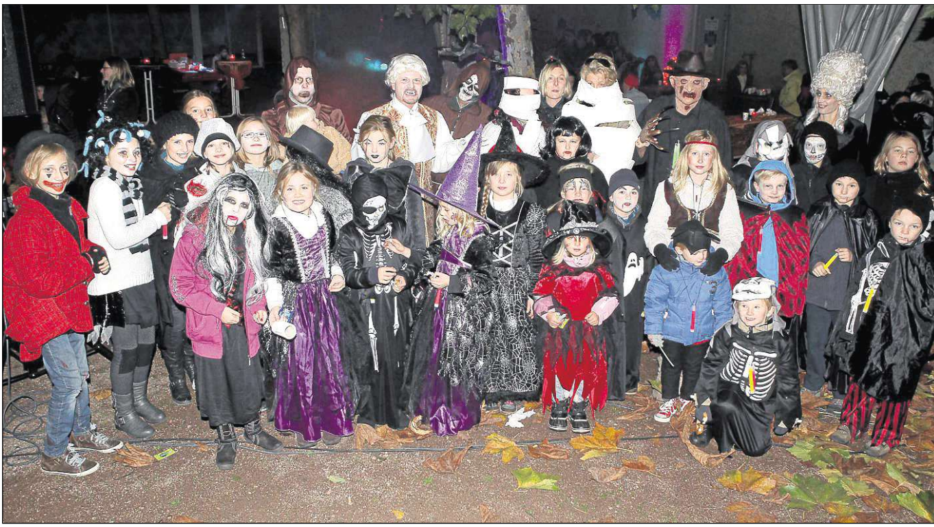
Süßes statt Saurem und jede Menge Spaß gab es bei der schaurig schönen Halloween-Party der TGS-Karnevalisten am Sonntag. Kurz vorm Start in die närrische Zeit feierten sie eine gruselige Halloween-Party auf dem TGS-Gelände am Jahnsportplatz. Nicht nur die herbstlichen Temperaturen, sondern auch jede Menge unheimliche Gestalten, Nebel und Geistermusik sorgten bei den zahlreichen Besuchern für Gänsehaut. Die Veranstaltung war eine gelungene Vorbereitung auf die bevorstehende Kampagne. Der offizielle Kartenvorverkauf für die beiden Galasitzungen am 19. und 20. Januar beginnt traditionell am 11.11.. Kartenbestellungen können sowohl telefonisch unter ☎ 06182 786833 wie auch per E-Mail an kartenbestellung@tgs-karneval.de aufgegeben werden.