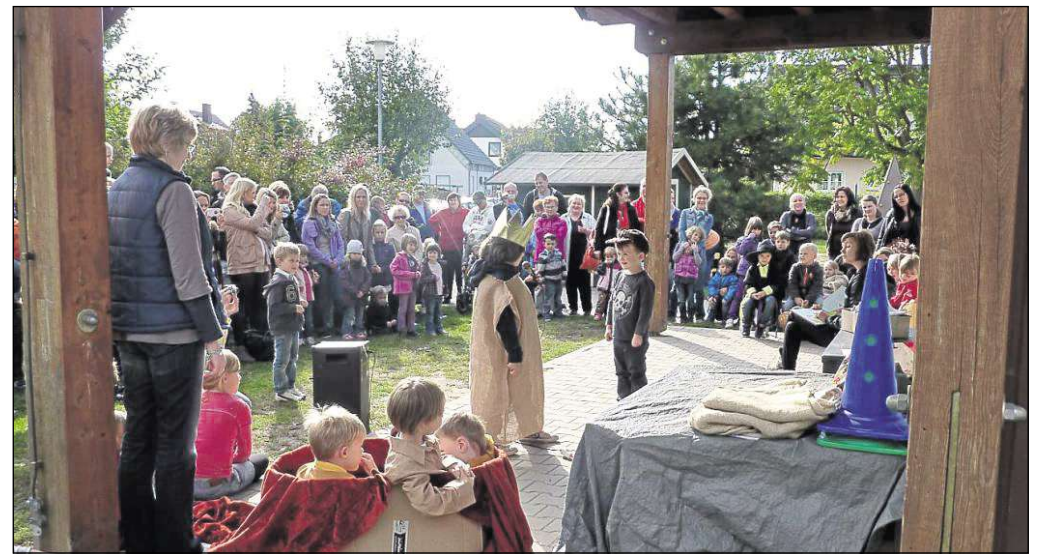
Ein Kartoffelfest gab es im Mainflinger Kindergarten „Panama“. Für diesen Anlass hatten die Vorschulkinder ein Theaterstück vom Kartoffelkönig und ein Gedicht einstudiert, die Kleinen trugen ein Lied über die Apfelernte vor. Höhepunkt der Vorträge war der eigene „Panama“-Song, den eine ehemalige Praktikantin schrieb. Danach gab es reichlich Zeit zum Toben, Spielen, Rennen auf dem großzügigen Außengelände.

Zellhausen (beko) – Ihren traditionellen bayerischen Bierabend veranstaltet am Samstag, 27. Oktober, die Freiwillige Feuerwehr Zellhausen ab 19 Uhr im Zellhäuser Bürgerhaus (Rheinstraße 3). Für musikalische Unterhaltung sorgen „Die Nixnutze“. Die Band sorgt mit einer Mischung aus Schlagern, Party und Rock für Stimmung. Natürlich gibt es auch wieder altbewährte, leckere bayerische Schmankerln, frisch gebratene Haxen und Weizenbier vom Fass. Die Zellhäuser Brandschützer freuen sich auf viel Besuch.