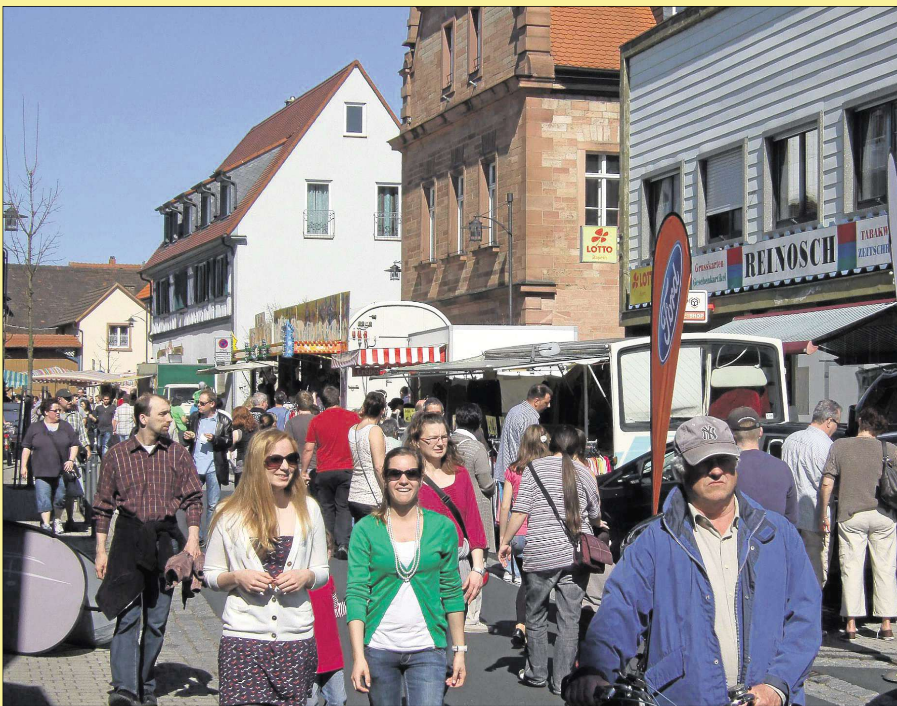
Impression vom Frühlingsmarkt im März. Zahlreiche Besucher erfreuten sich am reichhaltigen Angebot.