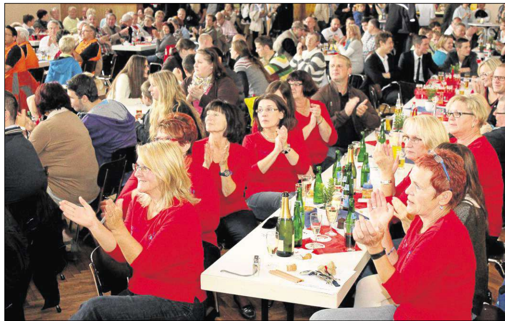
Mit dem gut besuchten Frühschoppen der „Haaschter Kerbborsche“ in der Sporthalle an der Offenbacher Landstraße startete das Kirchweihfest der Pfarrgemeinde St. Wendelinus.