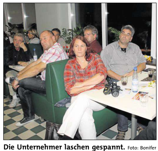
Die Unternehmer laschen gespannt.

Ein Fehlen oder Nachreichen von geforderten Dokumenten lässt den Antragsteller nicht gerade positiv erscheinen. Sie stellte auch die „Todsünden“ eines Bankgesprächs dar. Statt Vergangenheitsbewältigung soll eine zukunftsorientierte Aufbruchstimmung verbreitet und es soll vermieden werden, negativ über die Konkurrenz zu sprechen. Ein Ausflug in Ablauf und Beantragung von Förderdarlehen rundeten den Vortrag ab.