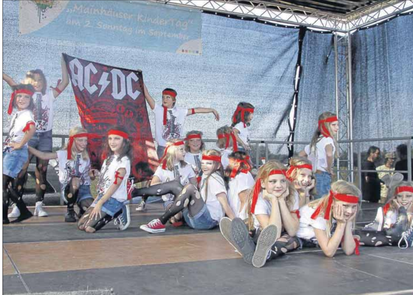
Auch die Tanzgruppe der TSG Mainflingen begeisterte beim Kindertag in Zellhausen auf dem Gelände des Luftsportverein, wo zahlreiche Familien mit Kindern vertreten waren.

Mainflingen hat sein Obdienceturnier am Sonntag, 16. September. Beginn 9 Uhr auf dem Vereinsgelände, Am Mainweg 24. ● Die Mitgliederversammlung des Gewerbevereins Mainhausen beginnt am Freitag, 21. September, um 19.30 Uhr im alten Rathaus in Zellhausen. Neben dem Rechenschaftsbericht des Vorstandes steht die Neuwahl des Gesamtvorstandes im Mittelpunkt. Auch soll das Thema eines vierten Gewerbemarktes Mainhausen 2013 ergänzt durch eine Ausbildungsmesse zur Sprache kommen. Für Montag, 1. Oktober, lädt der Gewerbeverein Mainhausen zum Vortrag „Erfolgreiche Bankgespräche führen - so erreichen Unternehmer ihr Ziel“ in das Bistro „Mahlzeit“, Ostring 19a, ein.